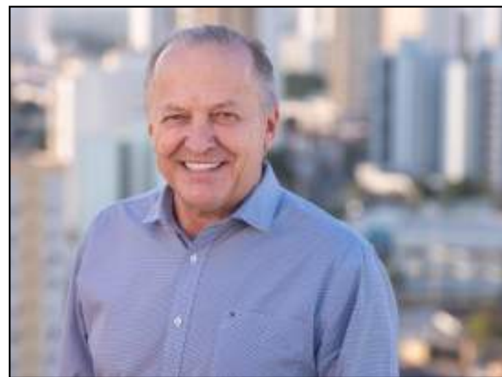
Enfraquecido em MT, PDT pode perder principal nome