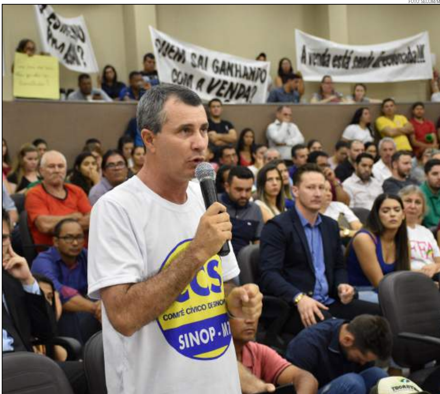
Pressão vez prefeitura rever projeto