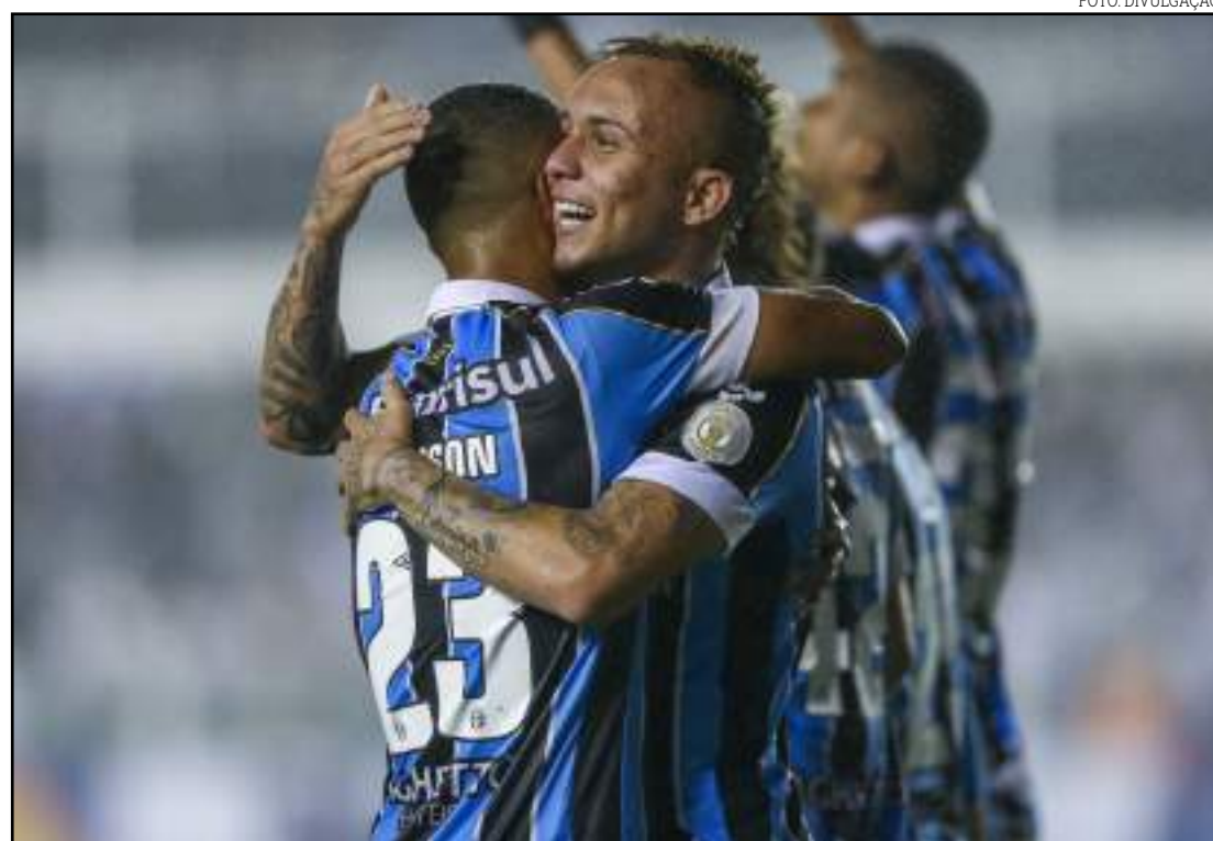
Time está invicto há seis partidas, com quatro vitórias e dois empates

“Não é surpresa para mim. Quando falo que jogamos o melhor futebol do Brasil dizem que estou menosprezando. Não menosprezo ninguém. Meu time não escolhe adversário e nem local. Perdemos muitos pontos importantes no co-