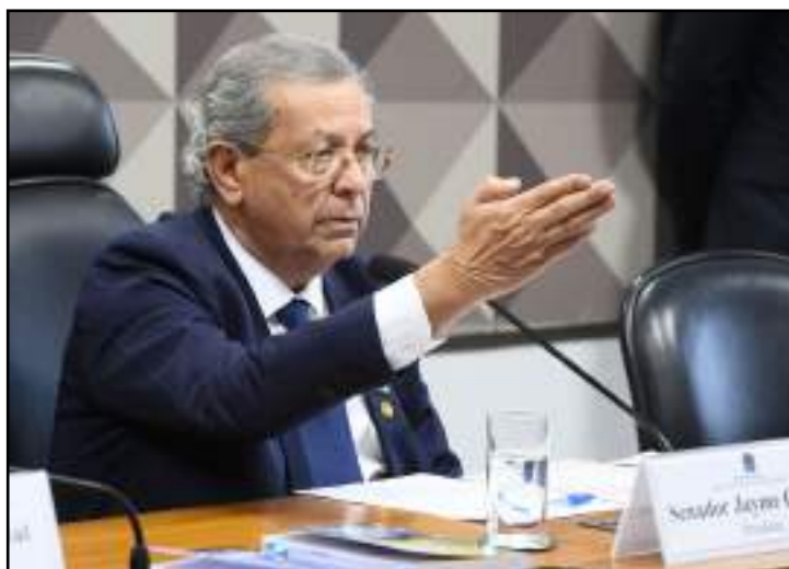
Por aclamação Campos assume a presidência do Conselho de Ética

O Conselho de Ética do Senado é sinônimo de poder sobre o destino dos parlamentares, ele é o responsável por receber denúncias contra os senadores e recomendar ao plenário a cassação de mandatos. Nos próximos dois anos a presidência do conselho fica então com o senador de Mato Grosso, Jayme Campos que logo após a sua nomeação declarou que o conselho vai seguir o que prevê o Regimento Interno e será uma gestão sem revanchismos e independente. “Este não será um conselho de revanchismo. Vai prevalecer aqui o que prevê o Regimento Interno e, acima de tudo, a nossa Constituição Federal. Agiremos de forma independente, mas com muito equilíbrio na defesa e intransigência das boas ações dos que fazem parte do Congresso Nacional e, acima de