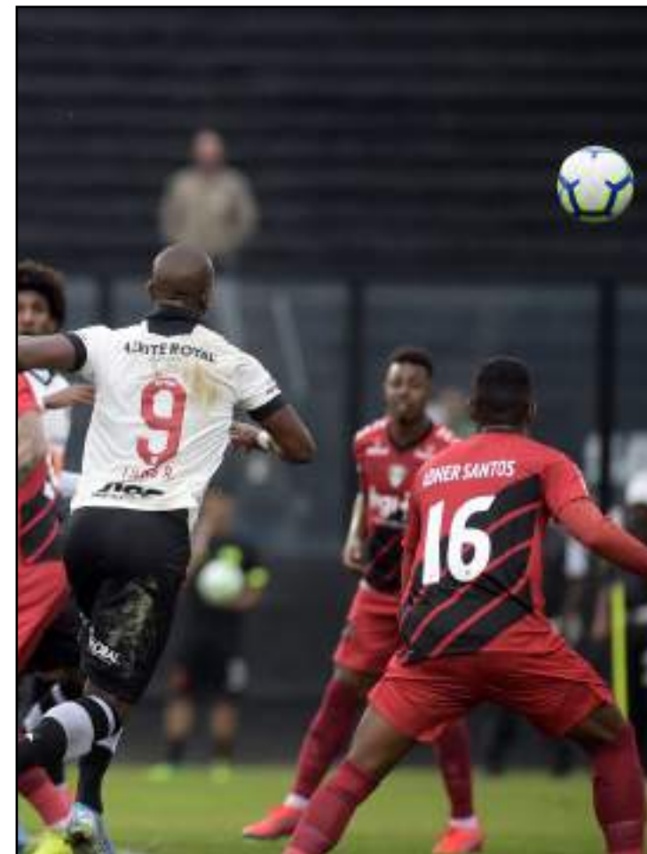
Furacão utilizou sete titulares diante do Vasco, na rodada passada