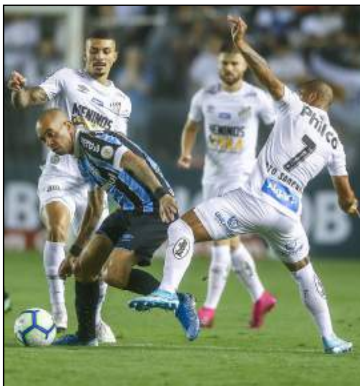
Santos perdeu para o Grêmio na Vila Belmiro

Na próxima rodada do Campeonato Brasileiro, o Santos viaja ao Rio de Janeiro para enfrentar o Fluminense, no Maracanã, na quinta (26), às 19h.