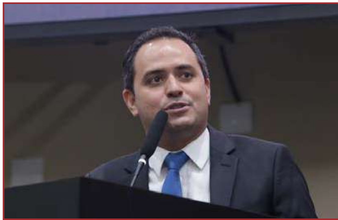
A Via Brasil já manifestou o interesse em readequar o contrato

"Atualmente, esta rodovia está sob concessão da Via Brasil, por um período de 10 anos, sem contar com a obra de duplicação porque a expectativa era da chegada da Ferrogrão. Ou o contrato será refeito, ampliando o prazo de concessão e garantindo a obra, ou poderemos ter a mesma solução adotada no restante da rodovia. O importante não é quem vai fa-