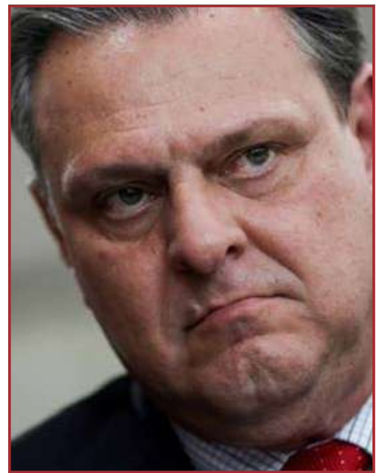
Após escândalo, governo federal desistiu da importação

máximo de interessados - devidamente qualificados - para prestação de serviços ou o fornecimento de bens.