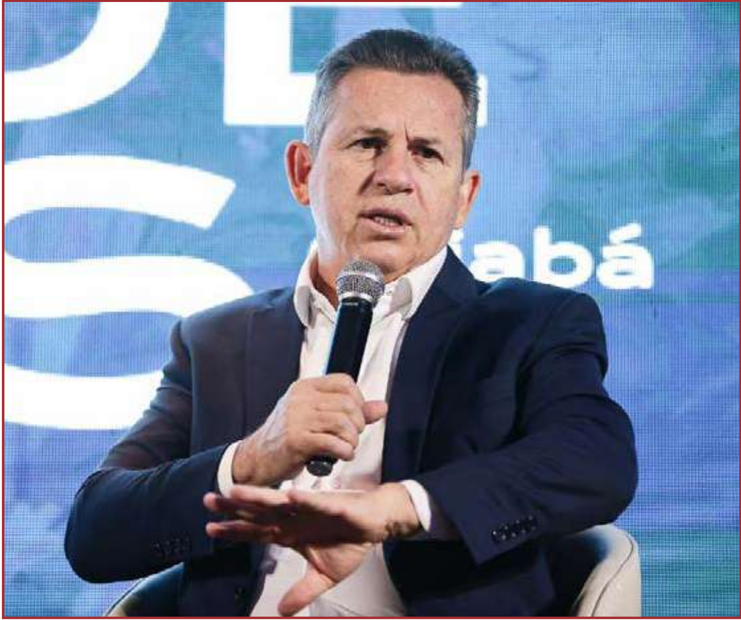
A proposição foi encaminhada na terça-feira

A proposta agora será analisada pelos deputados e, assim que aprovada, retorna para sanção do governador.