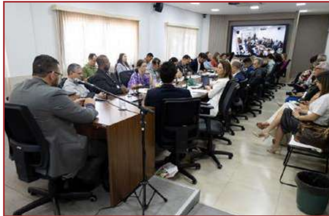
Assinatura fez parte da programação da Missão de Monitoramento do REM MT