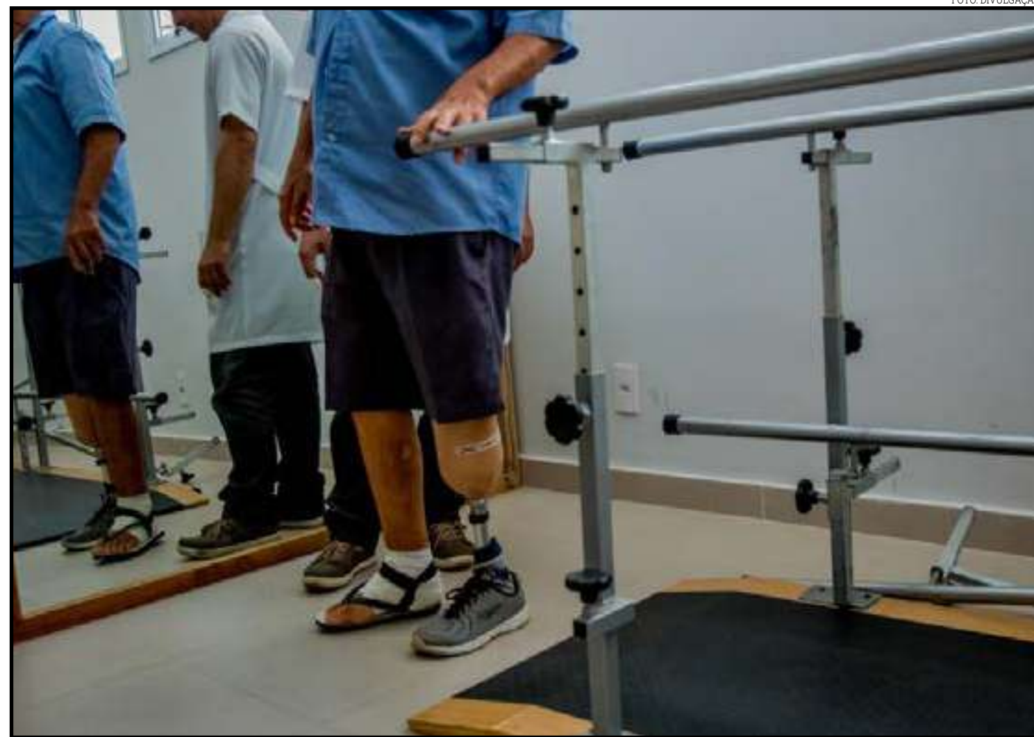
Mais de 390 órteses e próteses também foram entregues de janeiro a junho