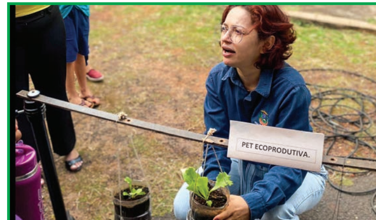
Cursos vão atender as demandas regionais