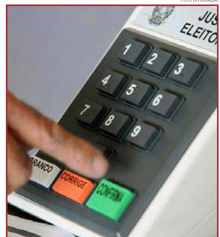
Propaganda eleitoral no rádio e TV começa dia 30 de agosto

está pronta para nos auxiliar, diferente do que aconteceu na CPI que tivemos no passado. Hoje, a Energisa está com uma diretoria nova, ela quer realmente acompanhar todas as demandas que venham para a Assembleia Legislativa, para in loco, tentar solucionar esses problemas. A gente sabe que principalmente o interior, passa por diversas dificuldades", explicou o parlamentar.