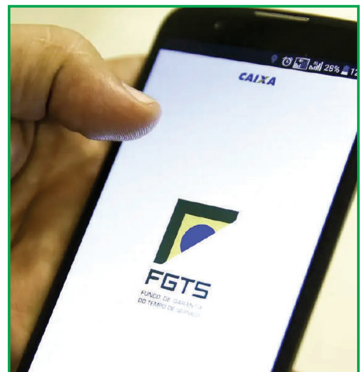
Conselho define em agosto repartição do resultado entre cotistas

lógicos renováveis, oferecendo uma alternativa viável e sustentável para o desenvolvimento econômico, reduzindo a dependência de recursos não-renováveis.