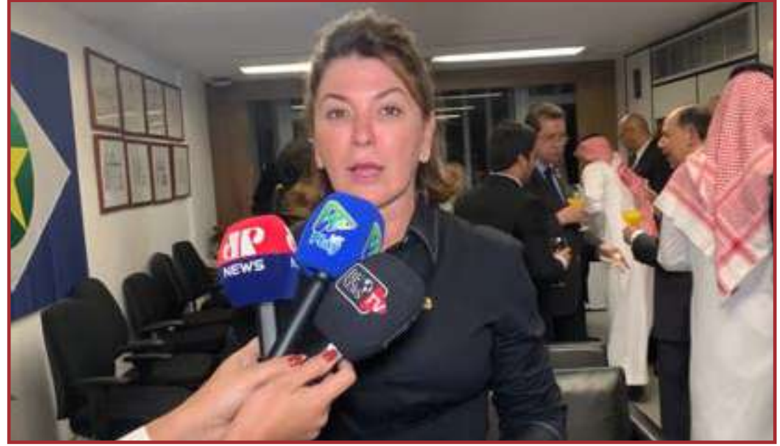
Eles discutiram a possibilidade de abertura de novos mercados

brasileiros, principalmente de Mato Grosso", explicou a senadora. Na reunião os sauditas reafirmaram o compromisso de investimentos no país, o que segundo a parlamentar resultou em uma reunião bem produtiva. "Eles estão reiterando o compromisso e o interesse de fazer investimentos aqui no Brasil e tanto adquirir produtos. Então foi uma reunião extremamente produtiva com segmentos representantes da parte da saúde, da parte da educação, da parte da defesa e acredito que teremos bons resultados complementares partindo dessa reunião que já teve algumas outras e essa com certeza vai complementar a celeridade e também a vinda de outros para acordos comerciais no próximo mês e também a ida de muitos brasileiros, tanto parlamentares como empresários para a Arábia Saudita complementar e estreitar os laços comerciais com o Brasil. Eles chegaram também a conversar sobre um possível investimento na Embraer. "Eles [os sauditas] têm