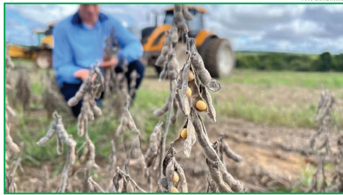
Elevação na variação mensal é decorrente aos preços dos fertilizantes e corretivos

Diante desse cenário, pontua o Instituto, para conseguir cobrir o COE da safra 2024/25 o produtor de soja