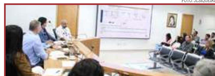
CST da Energia Elétrica já recebeu várias reclamações de consumidores

Na argumentação da engenharia, a Energisa precisa cuidar do cliente, se colocar no lugar dele analisando suas necessidades. "Precisa ter excelência na qualidade dos trabalhos e atendimento, com agilidade e segurança. Atualmente, não se vê dessa maneira, ou seja, 51,98%