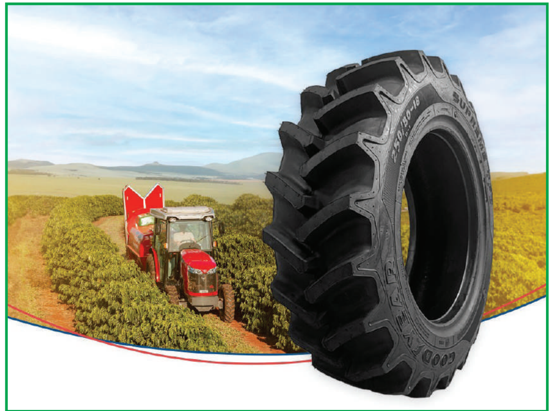
Supreme TFC da Titan Pneus proporciona economia superior a 4% de combustível

“Essa linha possui ainda barras com maior robustez na região central propiciando uma maior proteção da banda de rodagem e pegada mais plana, além de angulação de 23 graus melhorando a tração e autolimpeza, ou seja, em condições de excesso torque ou em transporte em solos compactados, essa tecnologia evita arrancha-