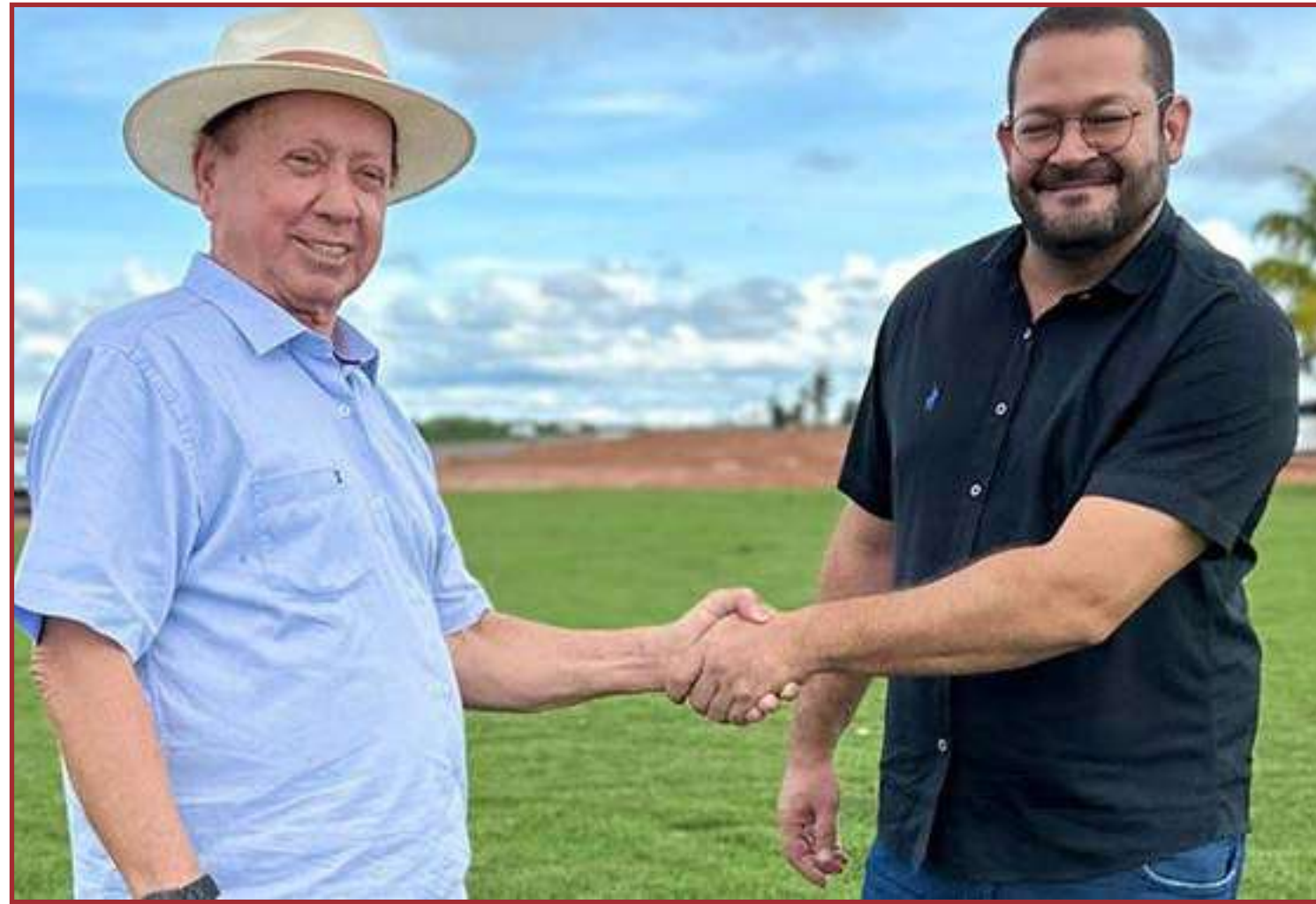
Coligação de Roberto Dorner é a maior deste pleito com 8 partidos