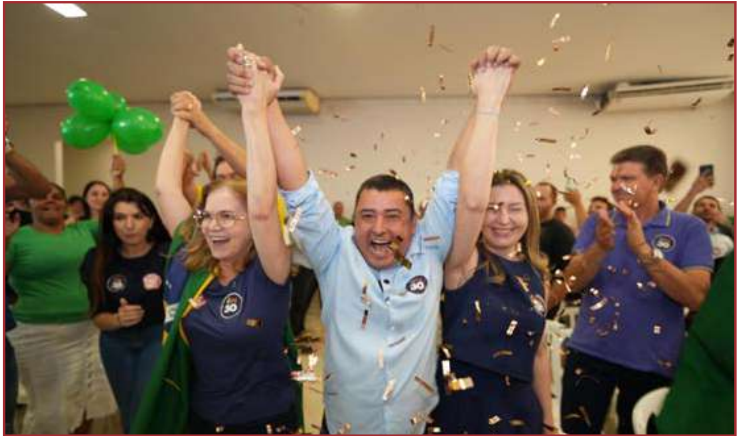
As eleições ocorrem no domingo dia 6 de outubro

Hoje nós temos a equipe, temos vereadores de alta qualidade, tem vereadores que já foram, inclusive, presidente da Câmara, fez um bom trabalho, um traba-