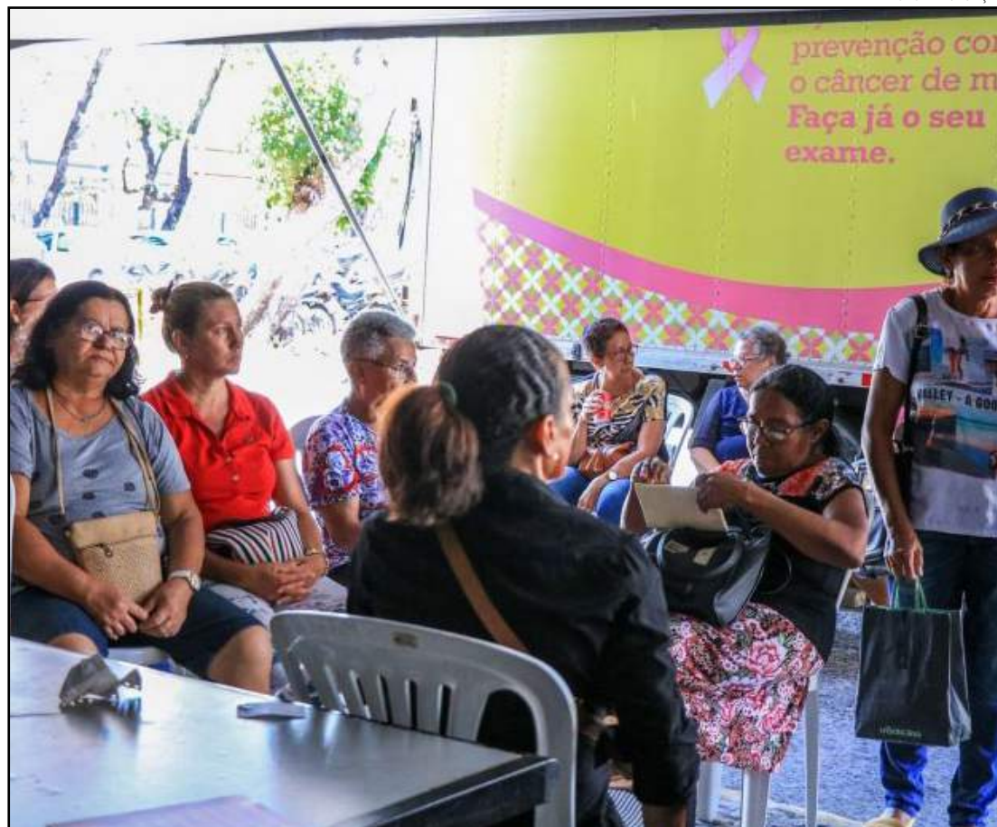
Inca prevê quase 700 novos casos de câncer de mama em Mato Grosso

O câncer de mama não tem somente uma causa. A idade é um dos mais importantes fatores de risco para a doença (cerca de quatro em cada cinco casos ocorrem