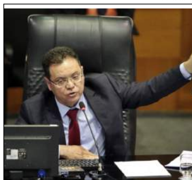
Só depois a LOA entrará em discussão