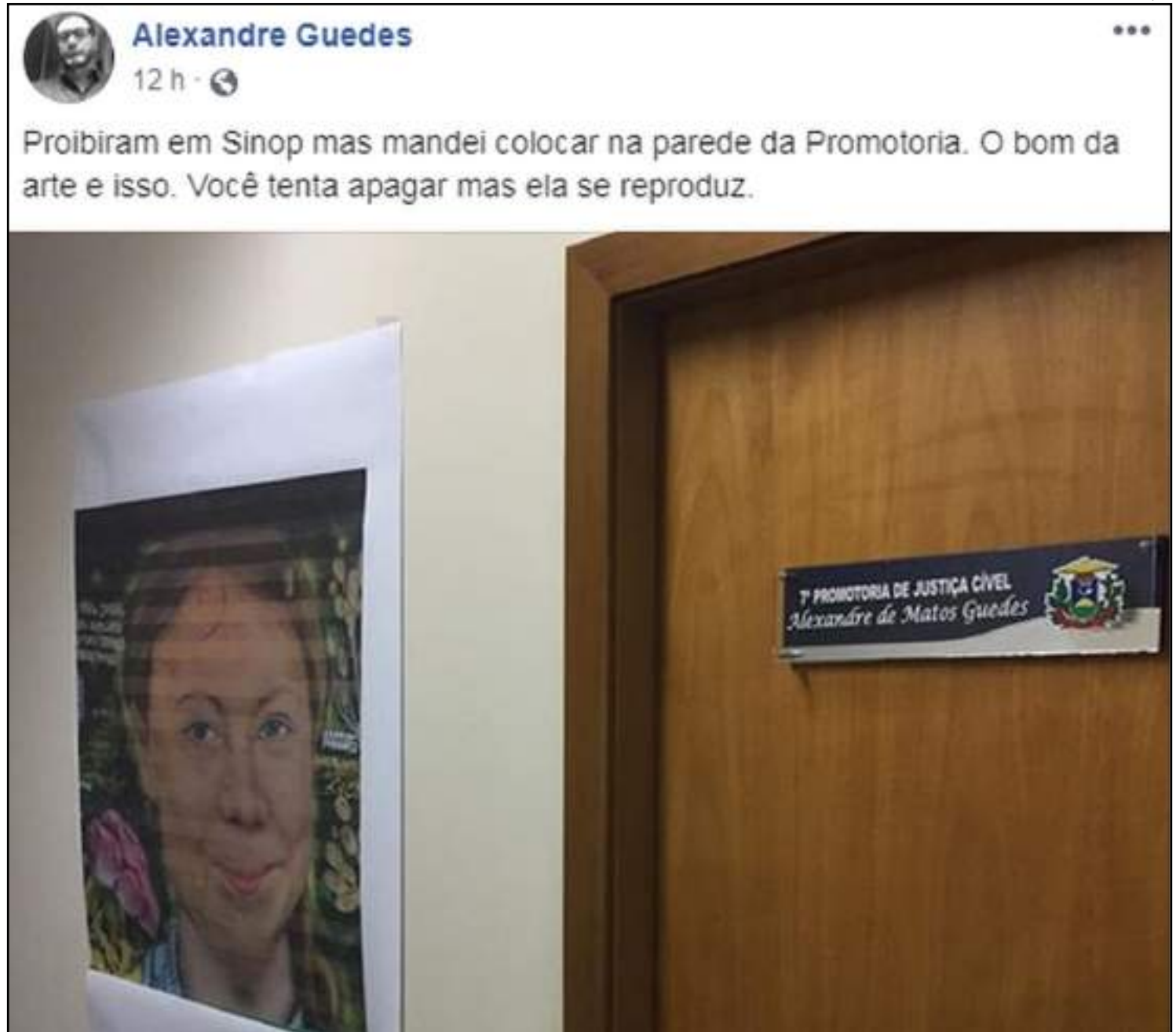
Atitude do promotor foi elogiada pelos internautas nos comentários

Desde que se tornou protagonista do combate às mudanças climáticas, a ativista Greta Thunberg vem dividindo opiniões. Também se tornou o mais