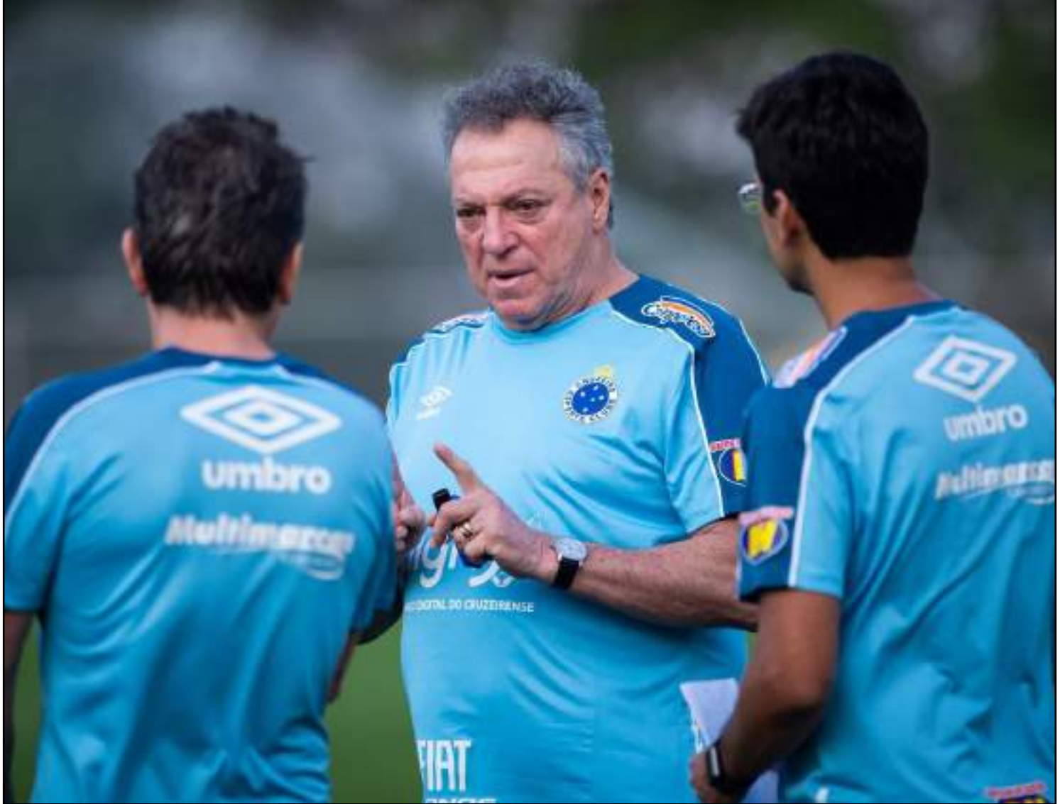
Abel Braga tem a missão de evitar queda inédita à Série B

O Cruzeiro não vence há cinco rodadas no Campeonato Brasileiro e está na zona de rebaixamento, em 17° lugar, com 19 pontos. Abel Braga é o terceiro treinador do time neste Brasileiro. Mano Menezes e Rogério Ceni também trabalharam na equipe.