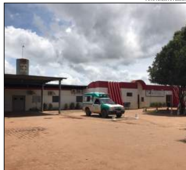
"Homem" passou por um procedimento de drenagem no pulmão

No entanto, foi informado pela menina que não era para entrar no local, mas ele entrou. Em seguida, a garota, em legítima defesa, pegou uma espingarda e disparou duas vezes contra ele. O garimpeiro contou que foi até a cidade para pedir socorro e foi encaminhado ao Hospital Regional.