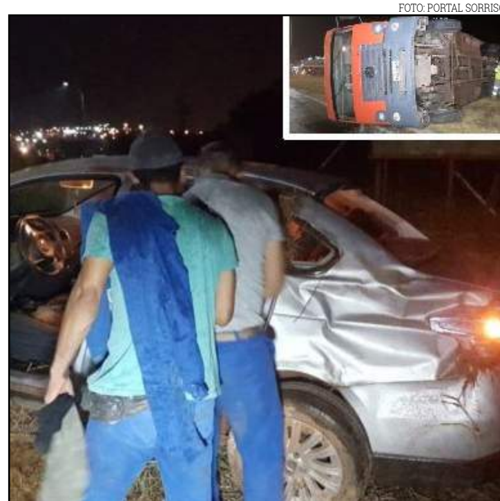
Motorista de Siena capotou na pista; caminhão (em destaque) também se acidentou

Com o tombamento, parte da carga ficou espalhada no local, porém, não chegou a atrapalhar o fluxo de veículos na rodovia.