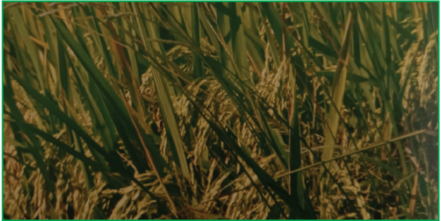
Essa mudança ocorreu em função das adversidades climáticas que impactaram as últimas safras

O agrônomo reforça que, na época, o solo sofria com aci-