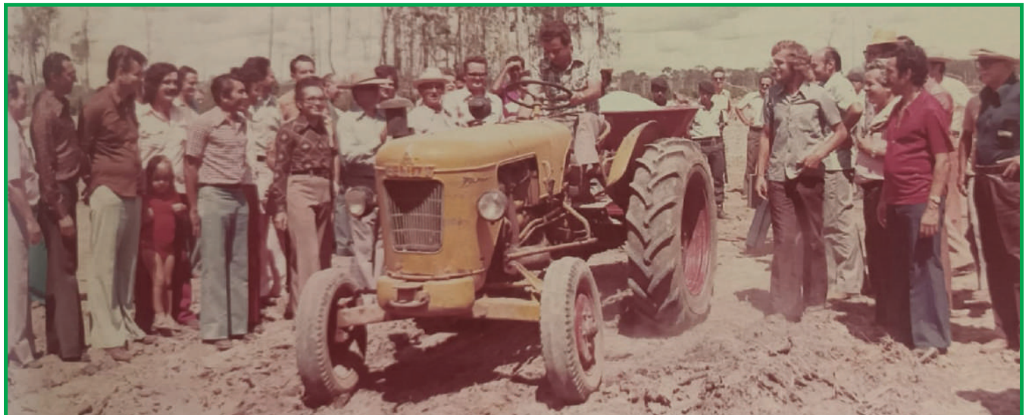
Lançamento do programa do calcário para correção de solo, em 1975, com a presença do ministro da Agricultura, Alysso Paulineeli