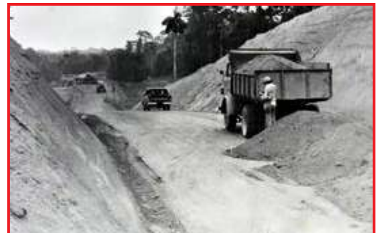
Registro das obras de construção da rodovia

tariam economia no frete e menor tempo de transporte. A distância de Sinop para o porto de Santarém é de 1.260 km, trajeto 330 km mais curto se citarmos o porto de Miritituba, distrito de Itaituba. Além disso, há um importante fator para se pensar ainda mais no escoamento da produção pelo Norte do que pelo Sul/Sudeste do país: a saturação dos portos, especialmente