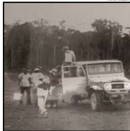
Primeiras ruas sendo abertas