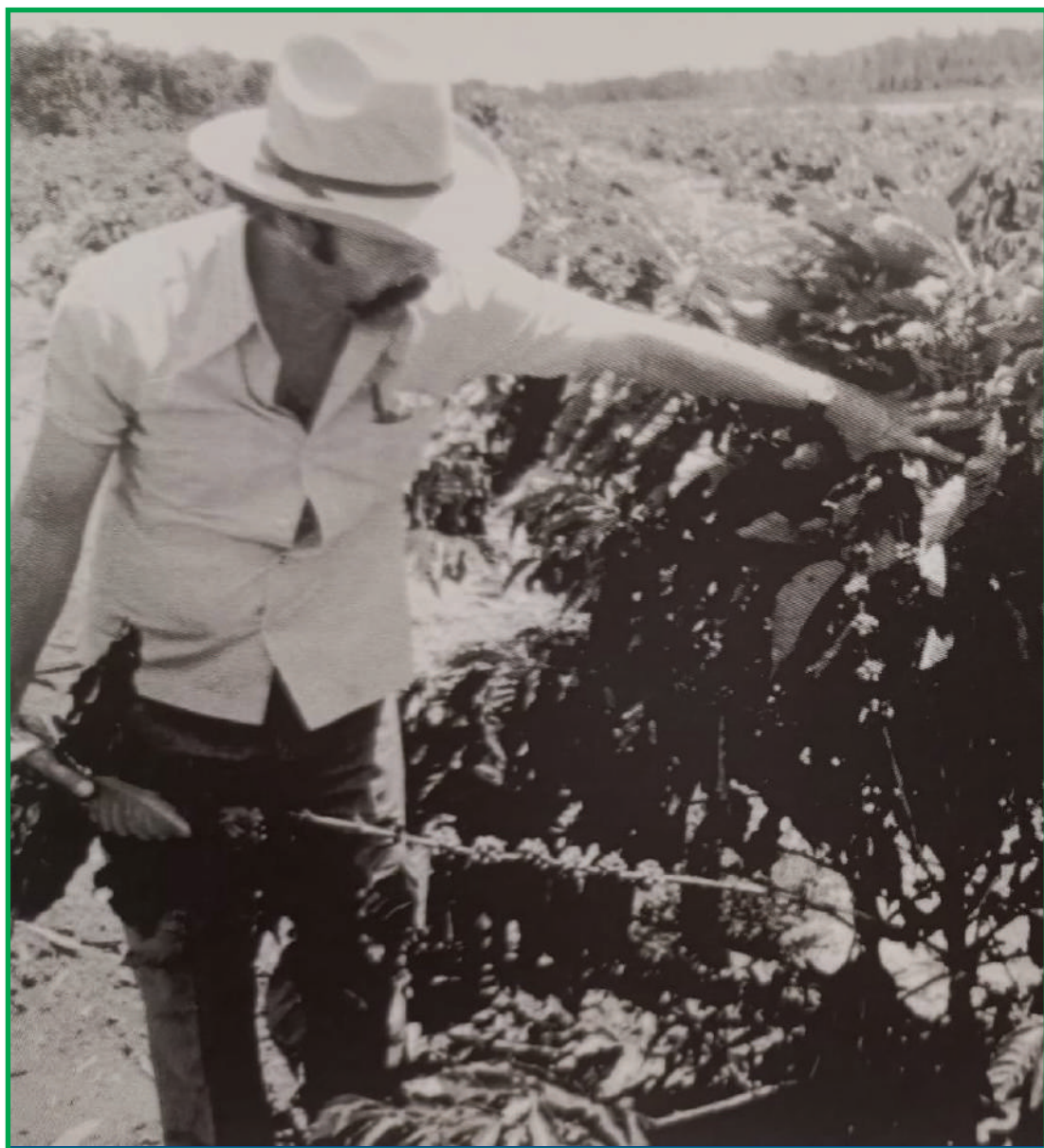
Plantio de café, em 1978, na Estrada Rosália