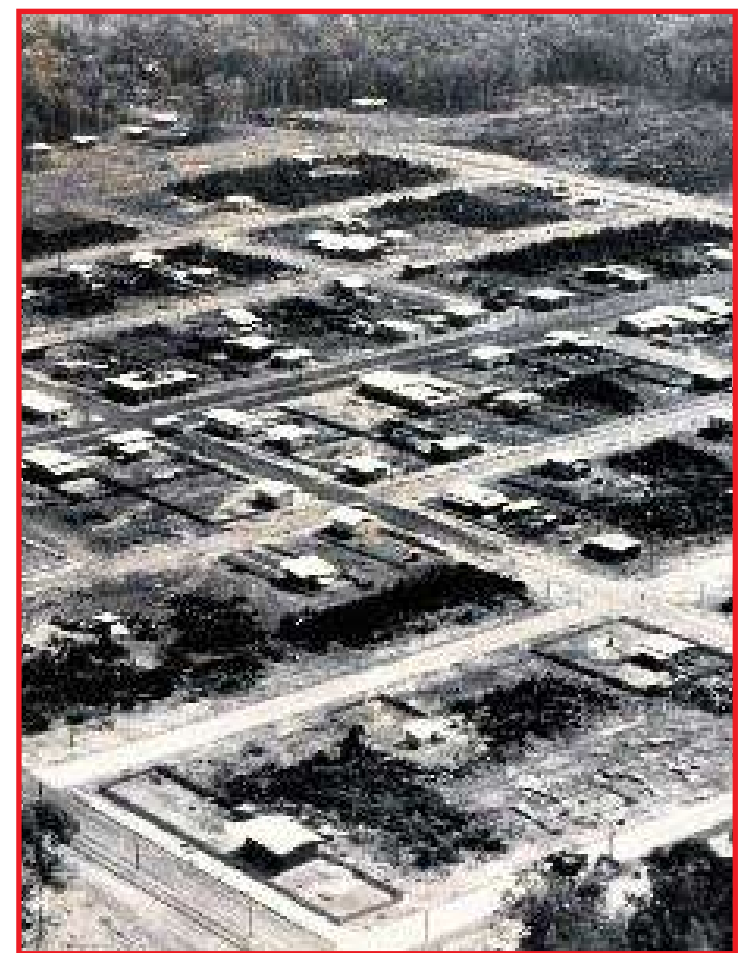
Imagem aérea mostra o primeiro ano de fundação de Sinop