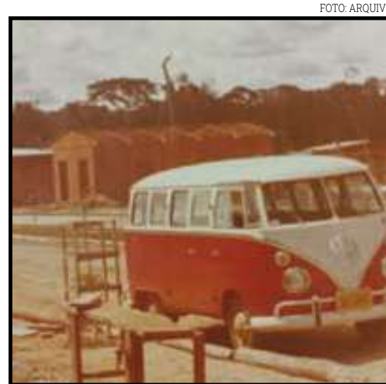
Ruas e casas sendo construídas

calhadas, muito menos pavimentadas. O poeirão cobria a cidade na época de seca, obrigando os comércios a cobrir as mercadorias com plástico ou tecido, enquanto