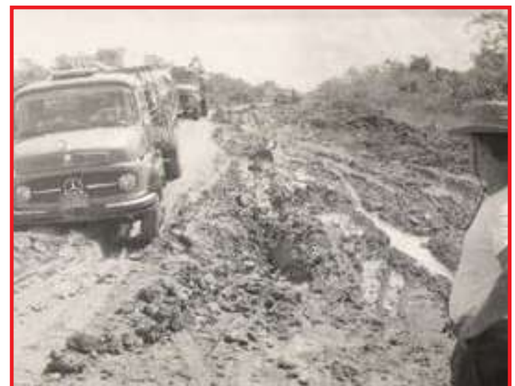
Atoleiros eram frequentes na BR-163

SENTINDO NORTE Além de duplicar a rodovia para o Sul, há interesse significativo na melhoria das condições de tráfego e pavimentação no trecho paraense da BR-163. Em termos de comércio exterior, os portos do Arco Norte represen-