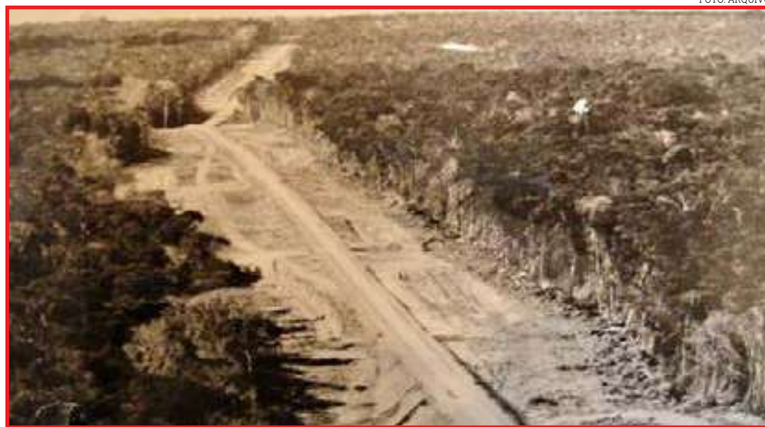
Rodovia Cuiabá-Santarém teve traçado alterado para 'cortar' Sinop

É nesse período que várias empresas colonizadoras (entre elas a Colonizadora Sinop) já estavam se estabelecendo e abrindo cidades às margens da rodovia. No projeto original, a BR-163 deveria passar onde