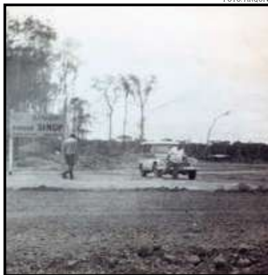
Abertura da cidade

As primeiras ruas e avenidas abertas não eram cas-