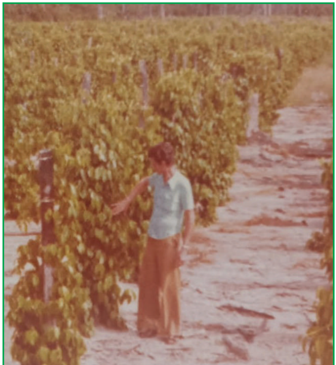
Plantação de pimenta do reino, em 1977