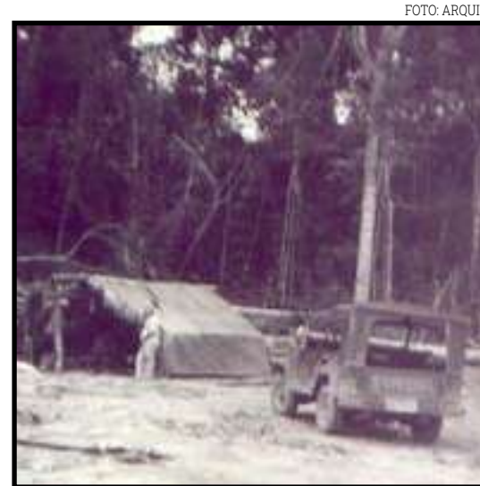
Pessoas ficavam em acampamentos precários no início de Sinop