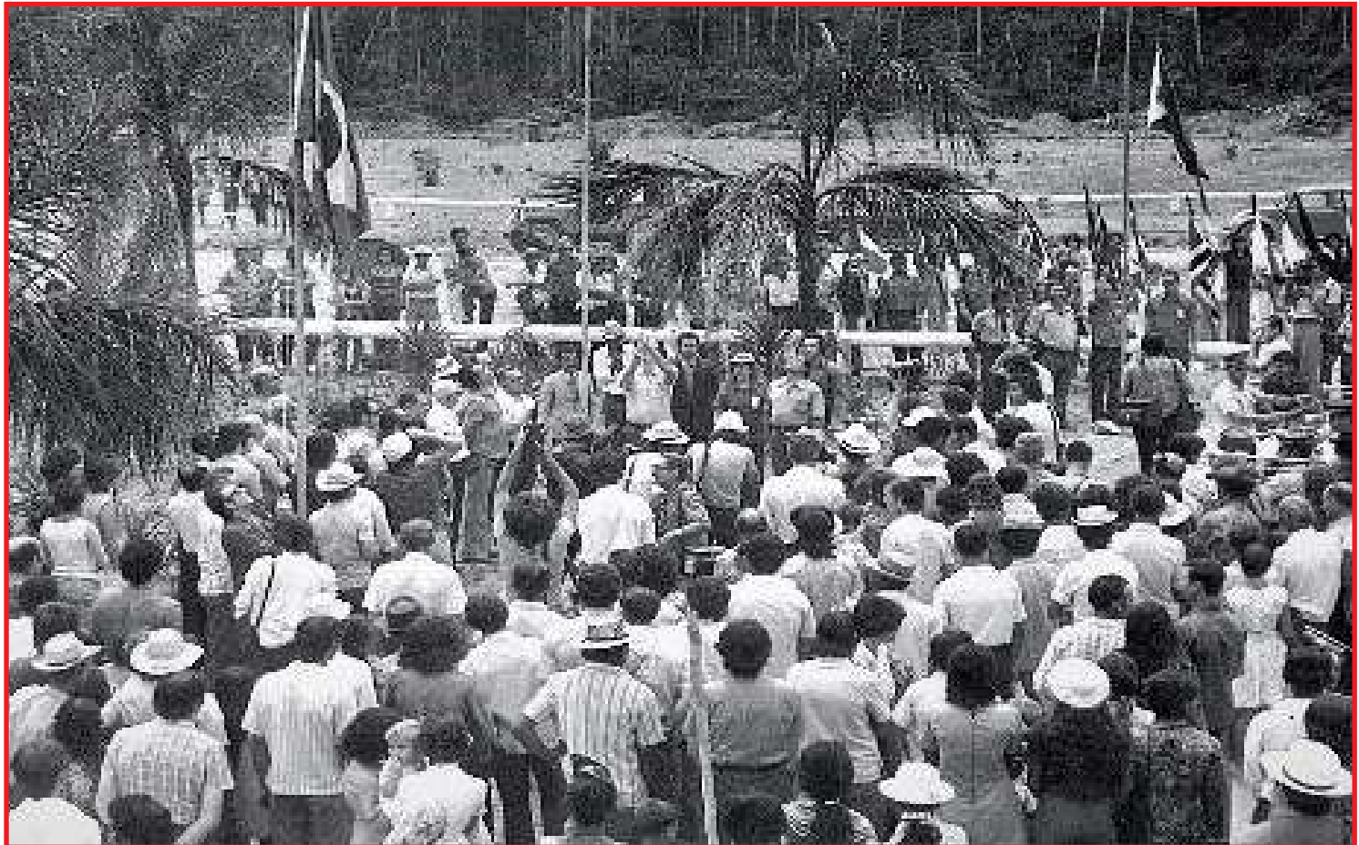
Multidão se reúne para cerimônia de fundação