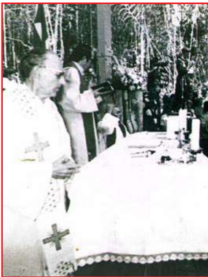
Missa de fundação de Sinop em 1974