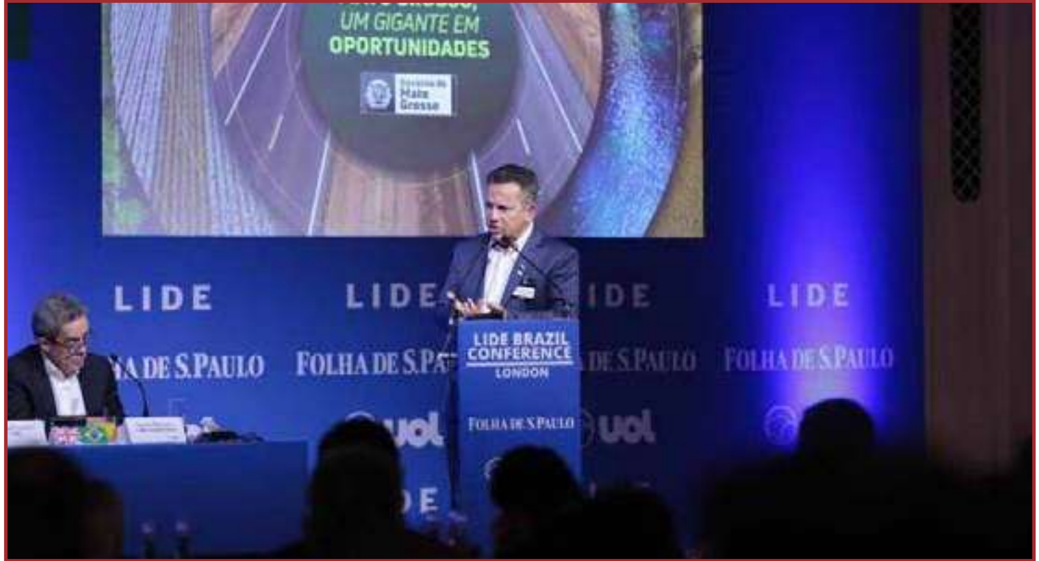
Para Mendes Mato Grosso tem mostrado compromisso com a preservação ambiental

Ele também apontou os recordes de Mato Grosso na produção de milho, soja, algodão, etanol de milho e