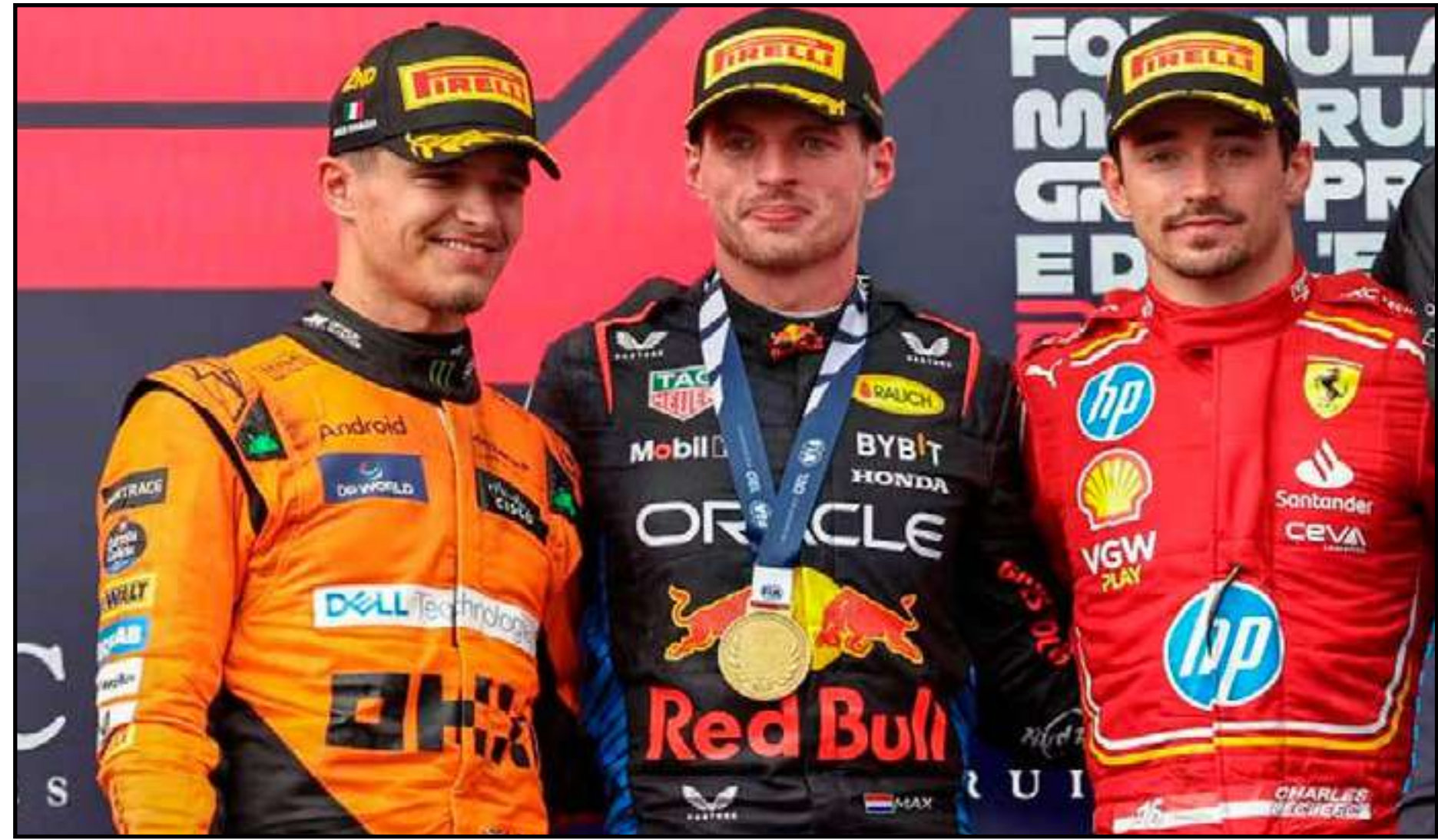
Verstappen, Norris e Leclerc no pódio no GP da Emilia-Romagna

Na competição de construtores, o início do ano indicava mais um título tranquilo para a RBR, atual bicampeã. No entanto, a queda de de-