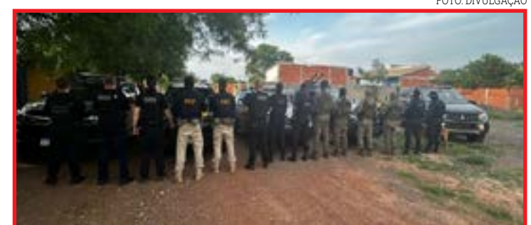
Acusações de tráfico de drogas, homicídios, chacinas e ataques a caixas eletrônicas

A FICCO/MT é uma força integrada composta pela Polícia Federal, Polícia Rodoviária Federal, Polícia Judiciária Civil e Polícia Militar, que atuam de forma conjunta no enfrentamento do crime organizado no Mato Grosso.