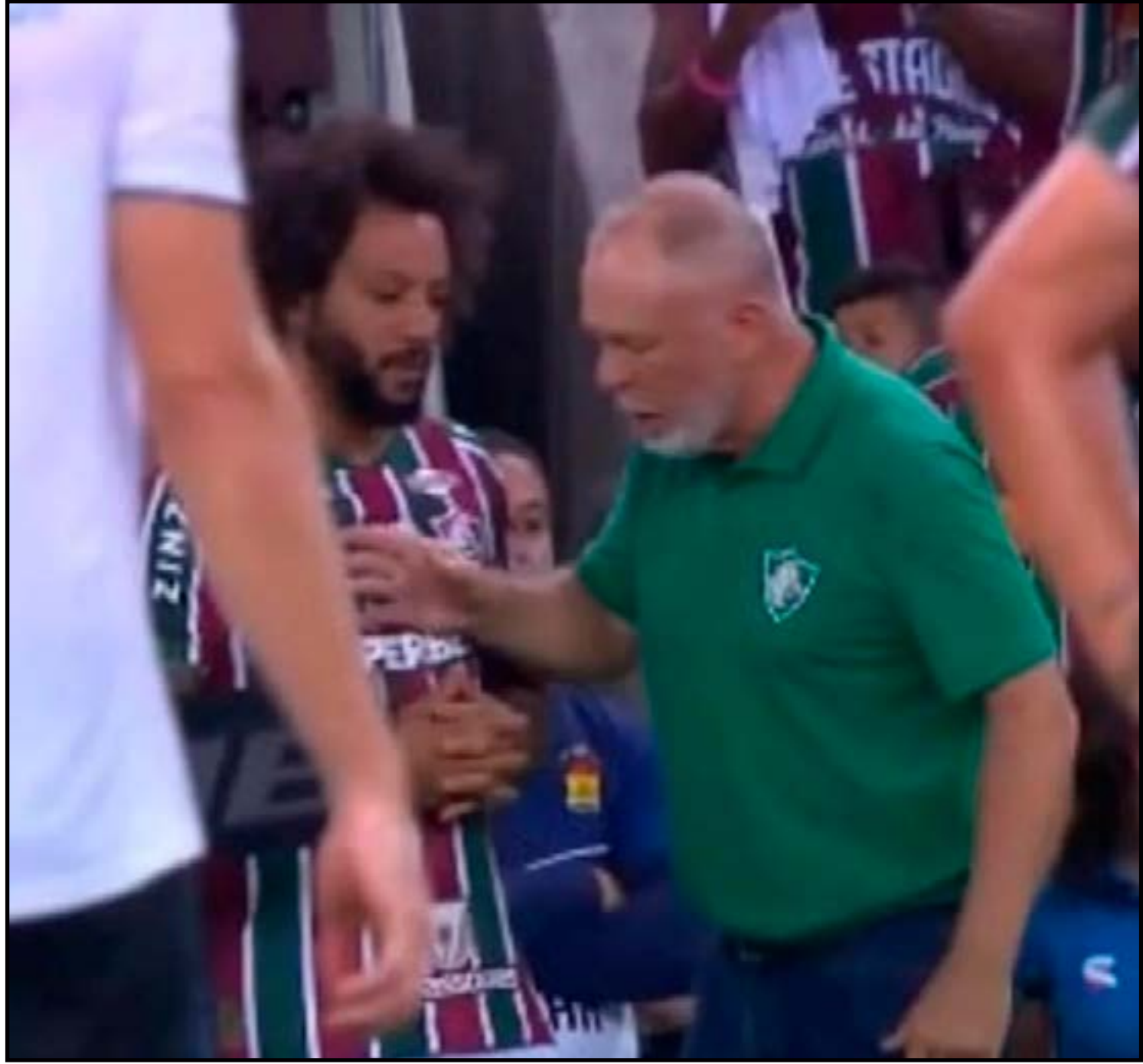
Houve críticas ao nível de comprometimento, ausência como visitante e fama de "reclamão"

O problema é que, neste caso, existia uma guerra de narrativas. Marcelo afirmava sentir dores, e funcionários do Fluminense tinham dificuldade em questionar o camisa 12 sem colocar sua palavra em xeque ou criar maiores problemas. Afinal, eram questões médicas. Mesmo sem ter desafetos explícitos ou problemas diretos com companheiros e funcionários, Marcelo não era dos mais benquistos no cotidiano do CT Carlos Castilho. Depois do empate por 2 a 2 com o Grêmio, Marcelo perdeu o início do bate-papo no vestiário por ter sido sorteado para realizar exame antidoping. Ele se despede do Fluminense com 68 jogos nes-