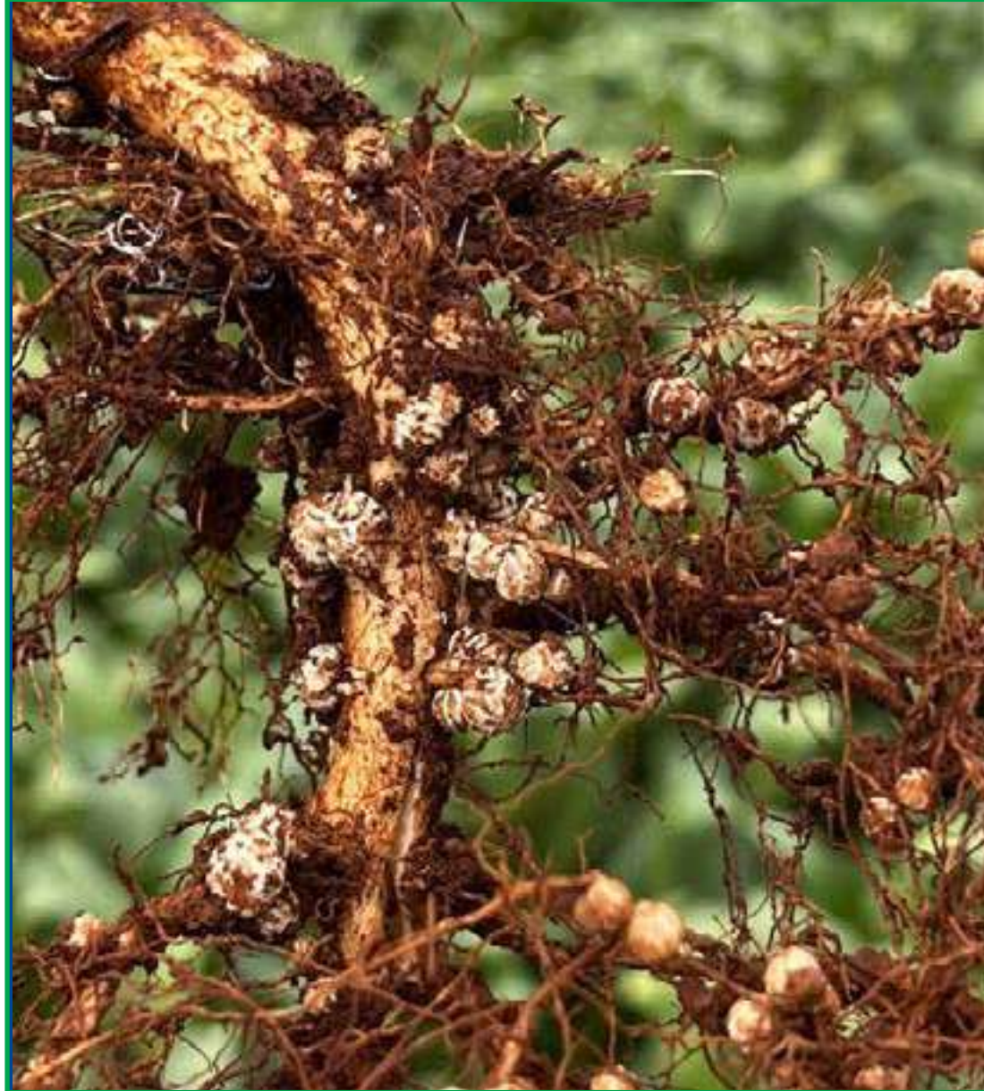
Produtores respiram aliviados após um longo período de forte calor e falta de chuva

"A companhia dinamarquesa oferece inoculantes de alta tecnologia voltados para o tratamento industrial de sementes: o pacote de soluções CTS 1000, inoculante biológico de longa vida à base de Bradyrhizobium para a soja, que tem longevidade de até 90 dias no pós-tratamento", finaliza.