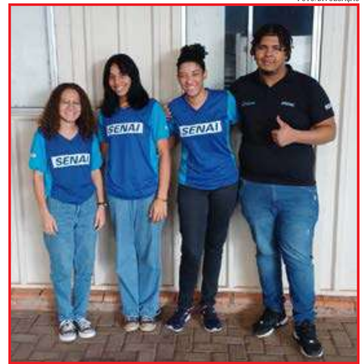
Equipe do Senai Distrito ficou com o 3º lugar na categoria Evolução