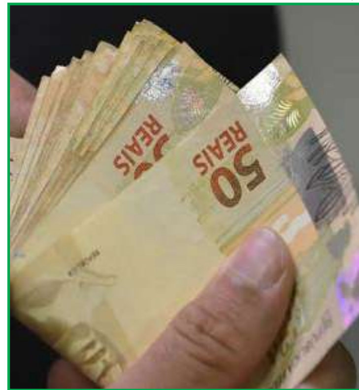
Volume de dinheiro é 4,8% superior ao ano passado