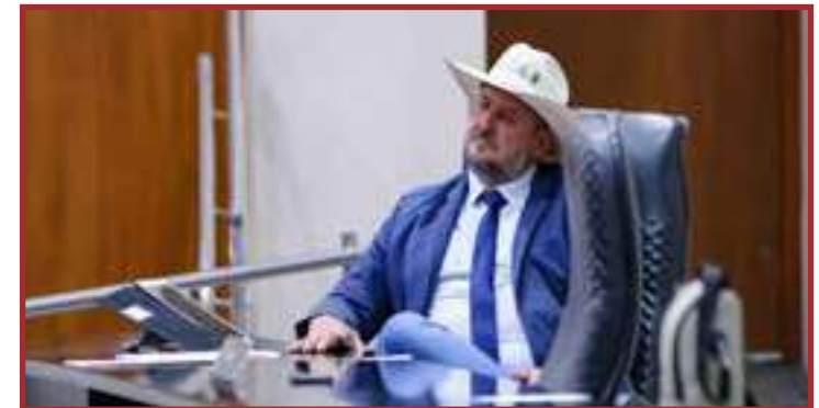
Produtores precisam saber valor pago pelos laticínios