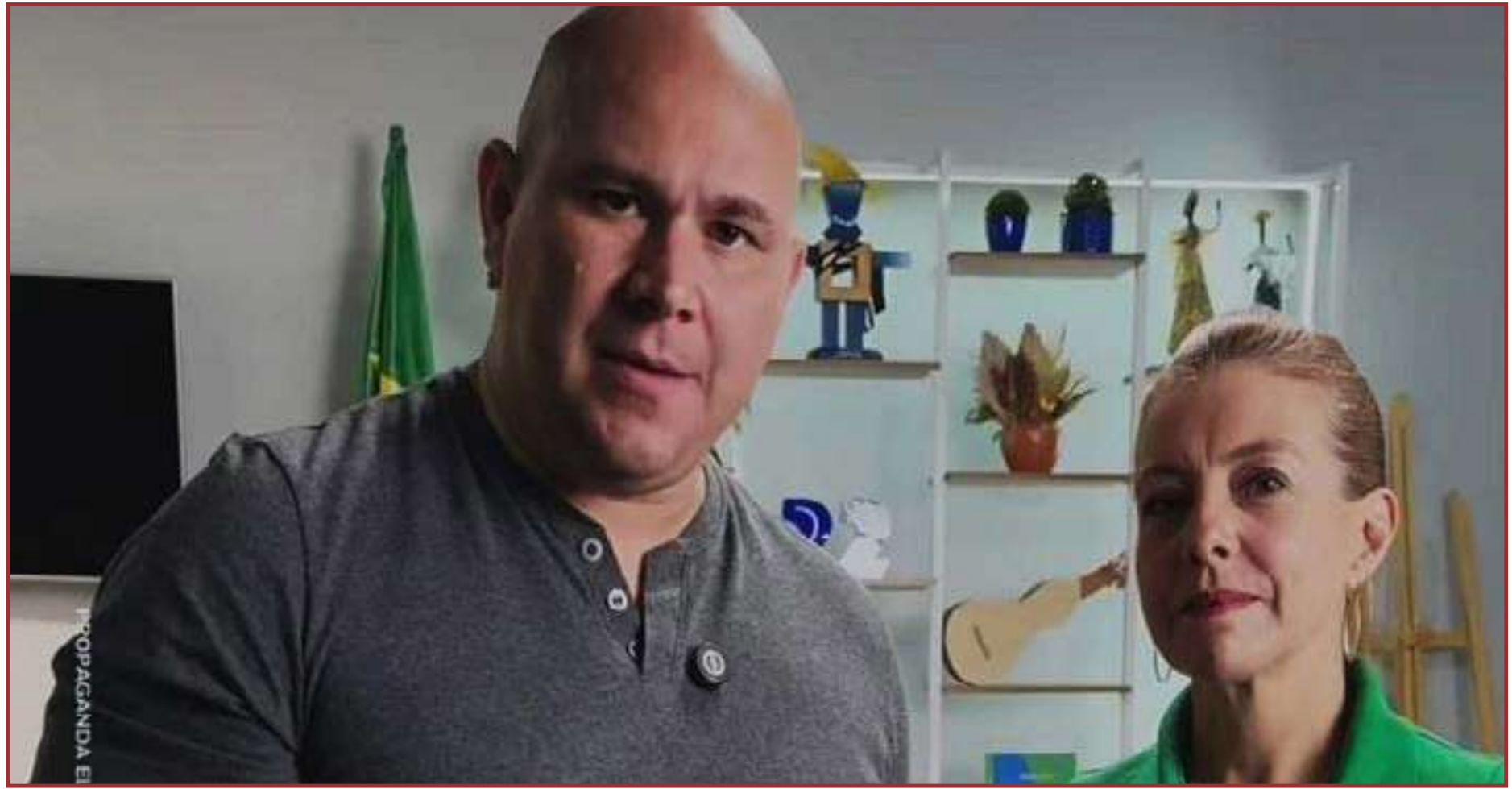
A recomendação foi feita durante uma audiência