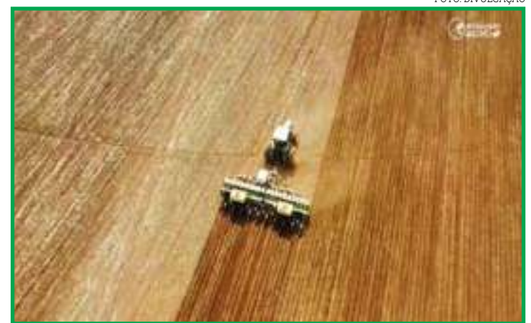
Outro temor é quanto a uma concentração de trabalhos no momento da colheita