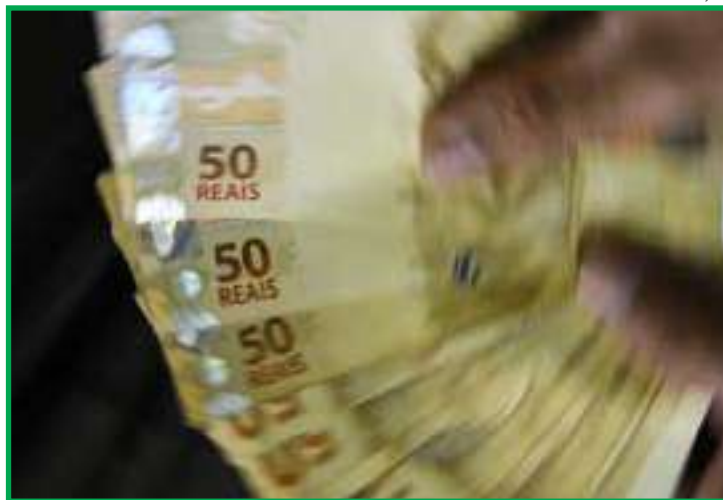
Estimativa é que 25,8 milhões de trabalhadores recebam o benefício

Os demais beneficiários receberão os valores pela Poupança Social Digital, aberta automaticamente pela Caixa, conforme o calendário de pagamento. Segundo o Ministério do Trabalho e Emprego (MTE), a estimativa é que cerca de 25,8 milhões de trabalhadores recebam o benefício, totalizando R$ 30,7 bilhões.