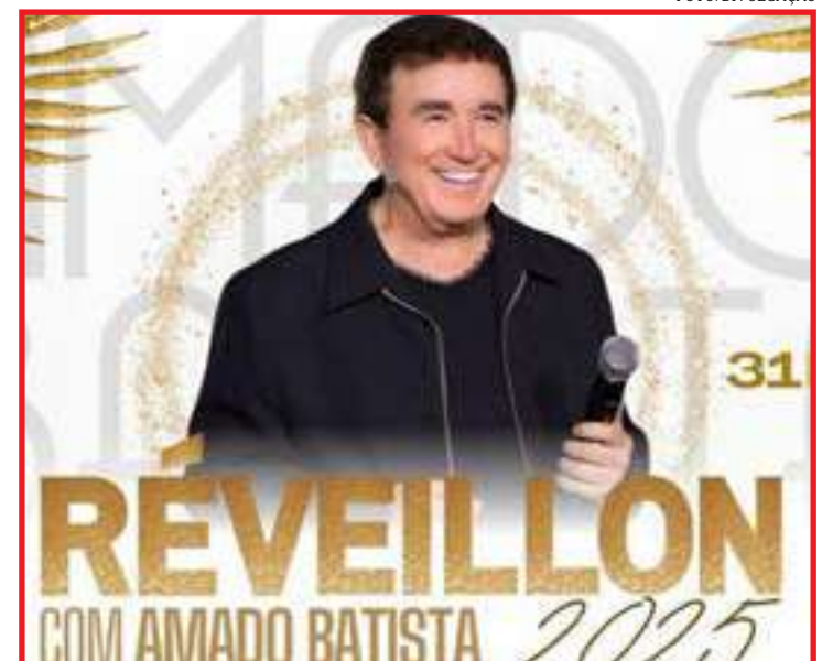
Prefeitura promoverá festa com estrela nacional