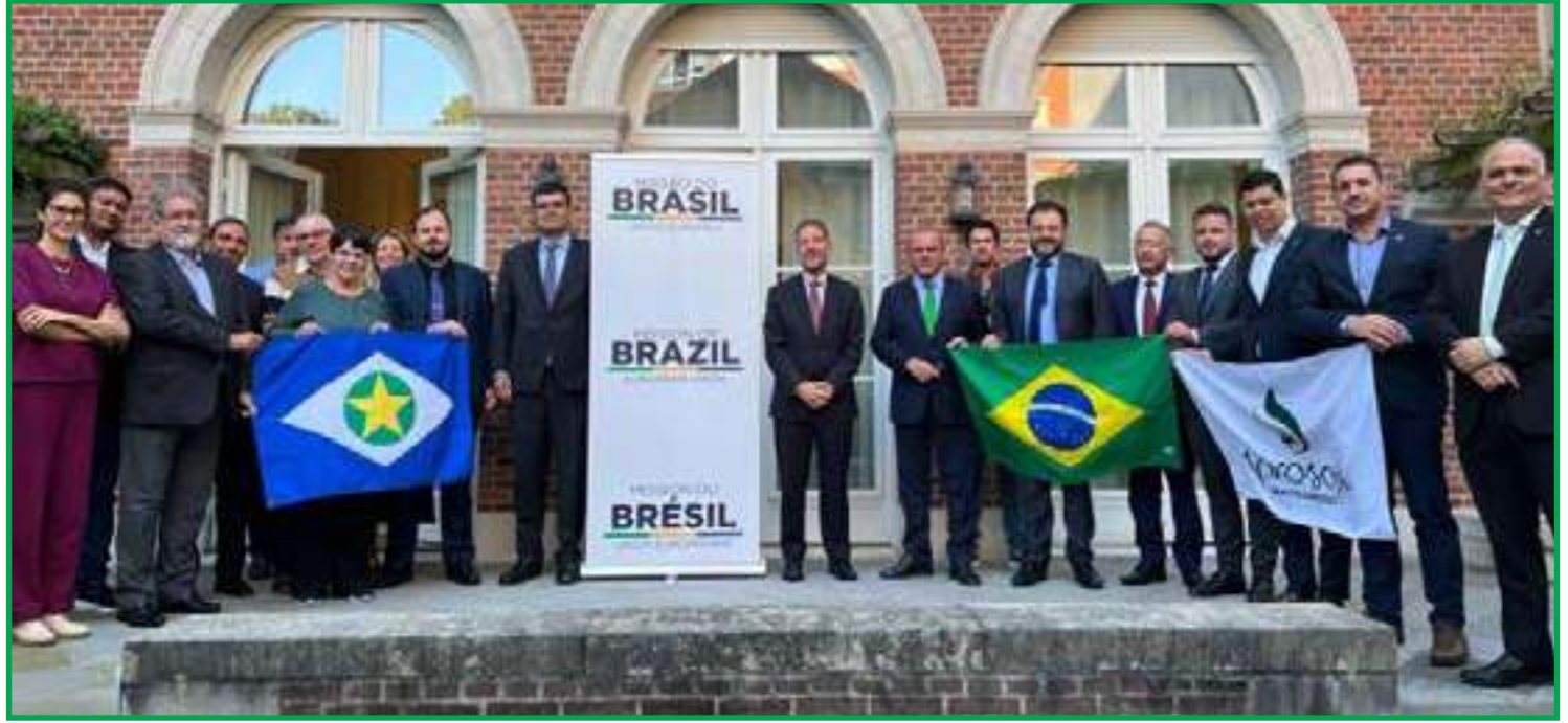
Comitiva passou por Países Baixos, Bélgica, Alemanha e França

agendas da missão, a Comissão Europeia anunciou o pedido para que a lei da União Europeia (UE) entre em vigor somente no final de 2025.