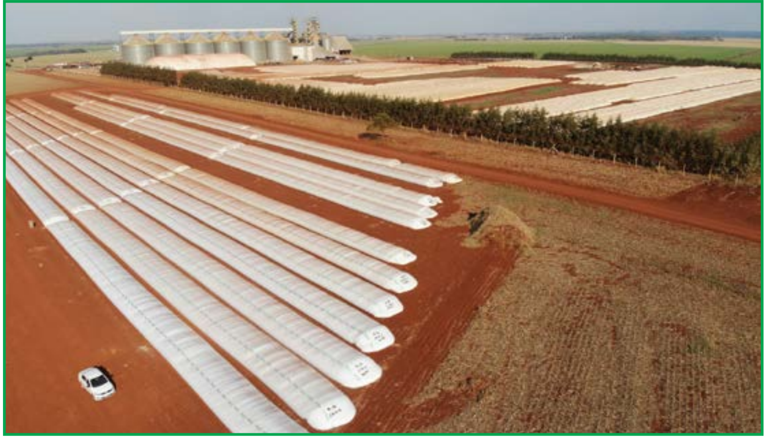
Produção estimada em 166 milhões de toneladas da oleaginosa

A logística brasileira enfrenta um cenário de pressão. A frota de transporte rodoviário e ferroviário não acompanhou o aumento da produção agrícola dos últimos anos, gerando filas em armazéns e portos e de quebra aumentando o custo do frete.