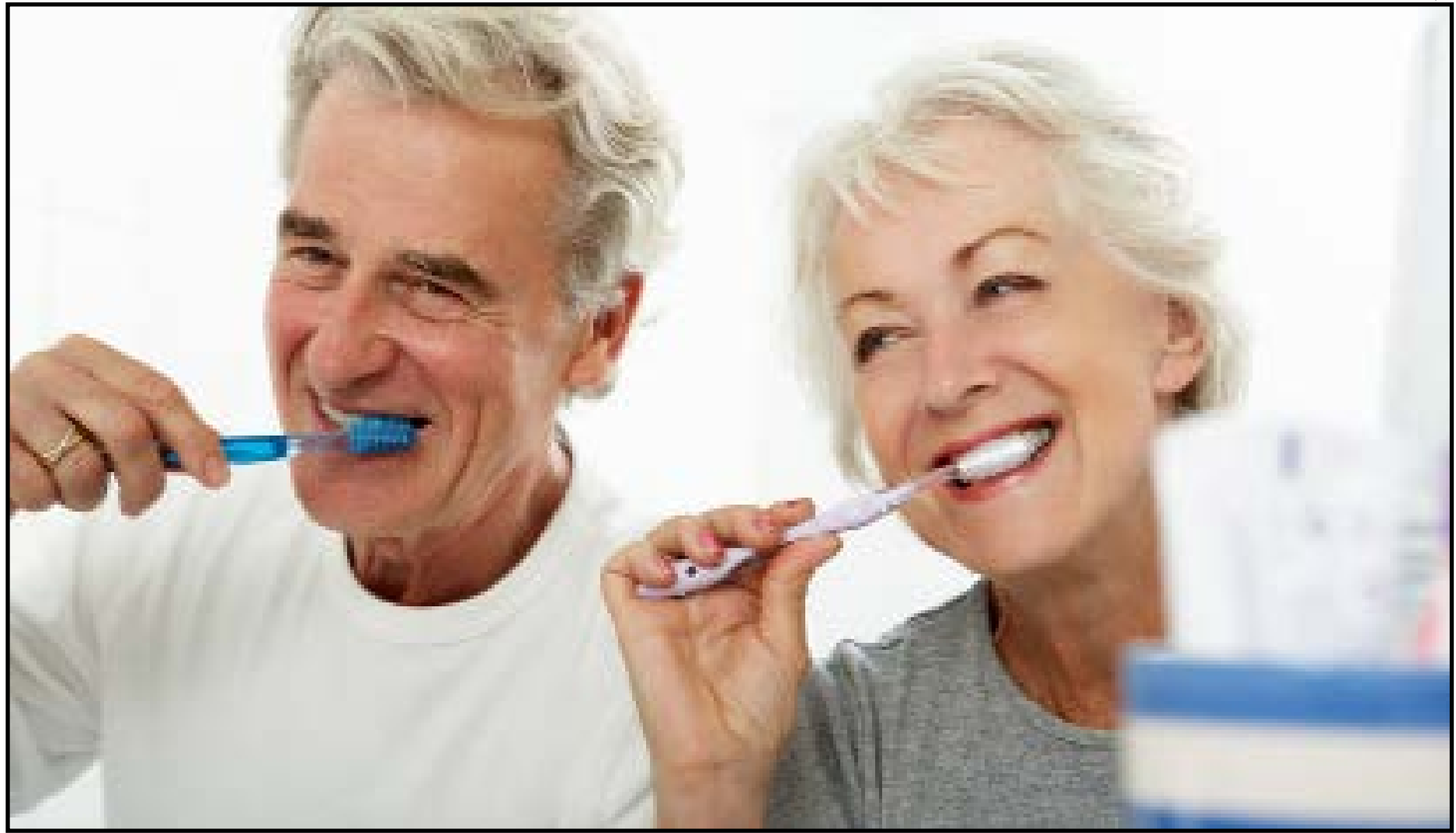
Doenças que impactam diretamente a alimentação e a saúde geral

Além da periodontite, outras doenças bucais podem afetar a saúde dos idosos, como as cáries, que podem avançar rapidamente devido à redução da produção de saliva, e a candidíase oral, que é comum em pessoas com sistemas imunológicos mais debilitados. A boca seca, por sua vez, é um problema recorrente, muitas vezes associado ao uso de medicamentos e ao envelhecimento, e pode contribuir para o desconforto e o aumento do risco de cáries.