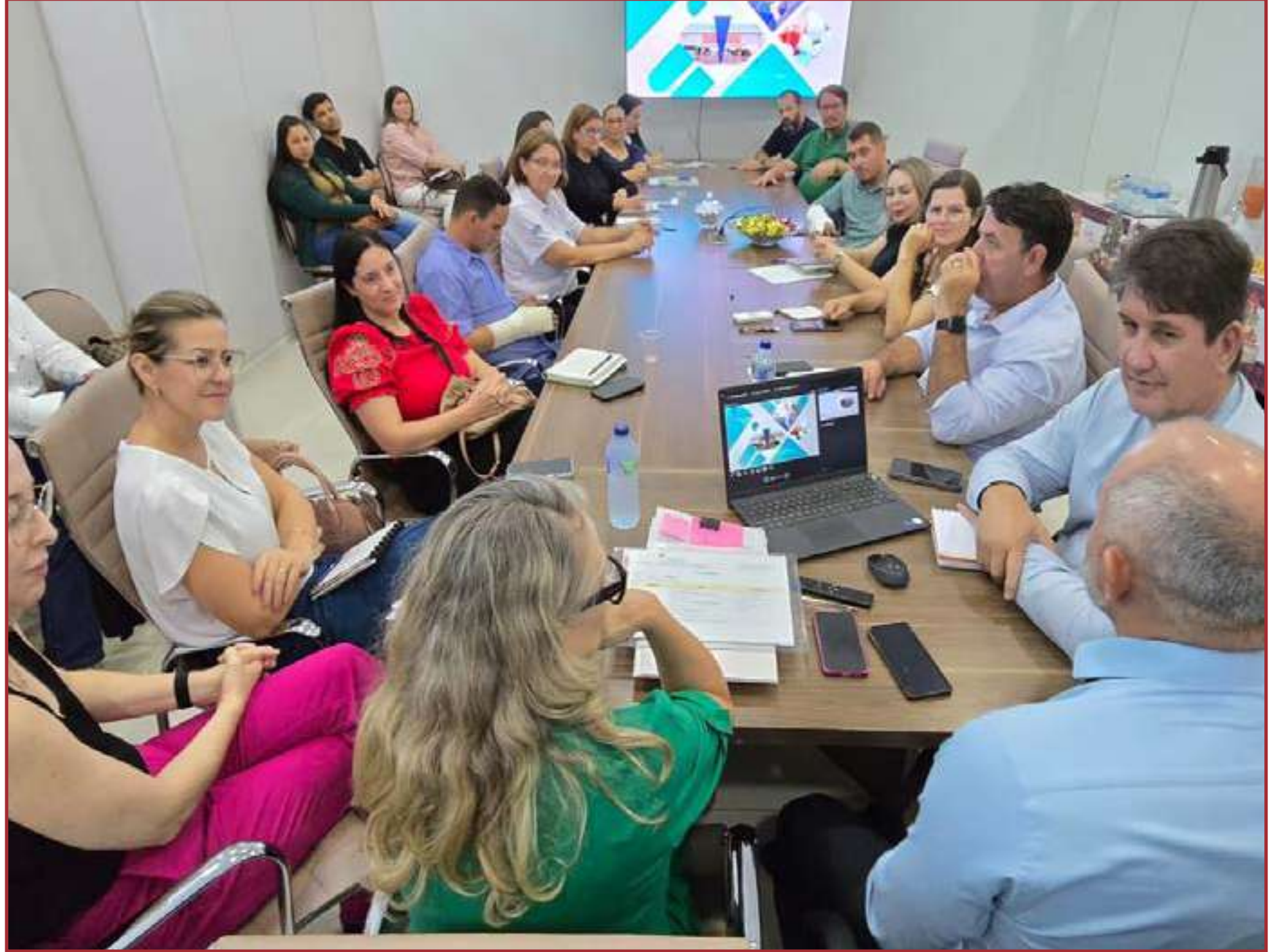
Secretários de 16 municípios alinham projetos regionais

O Colegiado, formado pelos secretários municipais, é responsável