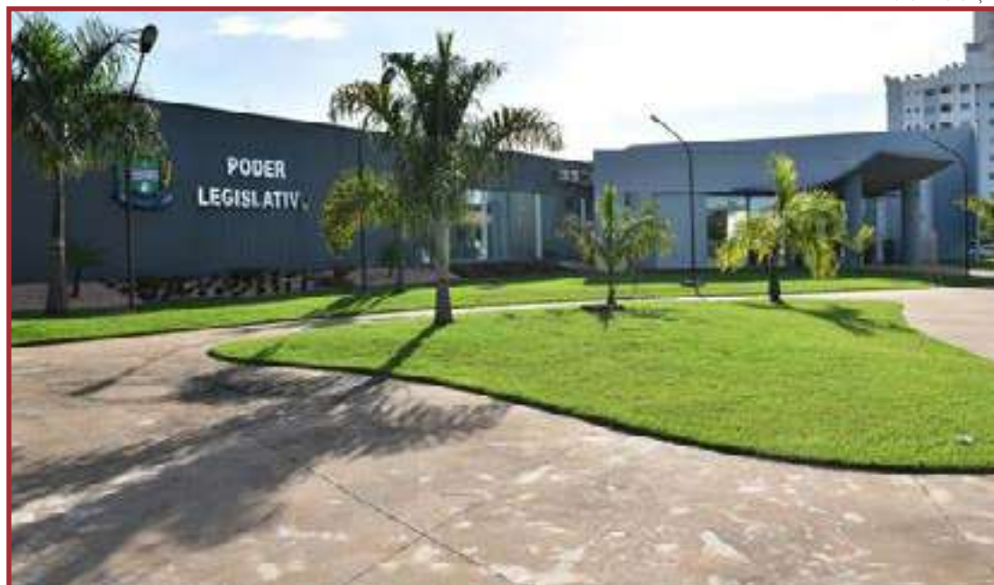
Medida já inicia na próxima segunda-feira

"É uma alteração que facilita a vida dos sinopenes, pois iguala os horários de atendimento da Prefeitura e da Câmara, permitindo que o cidadão possa usufruir dos serviços de am-