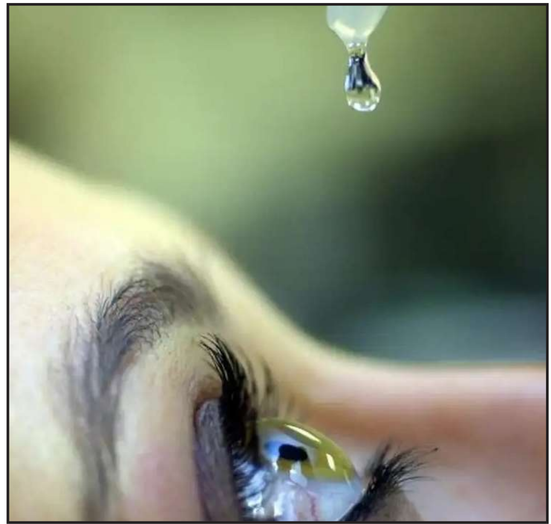
Exposição excessiva ao sol pode causar inflamações