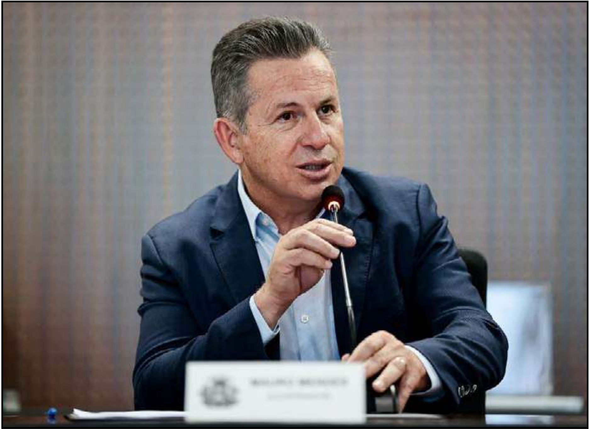
Governador garante que equipamentos estão "na agulha" para serem instalados

"Além do Hospital Central, também retomamos o Hospital Júlio Muller, em Cuiabá, que vamos entregar para a UFMT assim que concluirmos. E no interior, estamos construindo mais quatro hospitais regionais: em Confresa, Tangará da Serra, Juína e Alta Floresta. Já as unidades existentes passam por reforma e ampliação para melhorarmos a es-