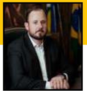
LUCAS COSTA BEBER

Redes ferroviárias e hidrovias modernas permitem o transporte de grãos com custos significativamente mais baixos do que o Brasil, que depende majoritariamente de rodovias e diesel caro.