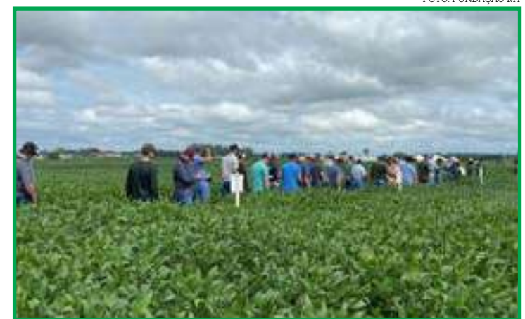
Pesquisa e serviços agrônômicos são realizados por meio de uma vitrine de cultivares

e outros estados brasileiros) e a Ramax Brasil (Produção para o mercado interno + garantia de abastecimento para o mercado externo). "Com a nossa expertise geramos oportunidades a todos os elos da cadeia produtiva. Por meio de parcerias, auxiliamos os pequenos produtores ou frigoríficos a se tornarem fornecedores internacionais", destacou o CEO da Ramax Group, Magno Gaia.