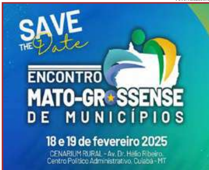
Encontro municipalista de fevereiro discutirá gestão e desafios

O evento contará ainda com espaços exclusivos para atendimento de prefeitos e suas equipes, com participação de técnicos da AMM, TCE, CNM, Desenvolve MT e Secretaria de Infra-