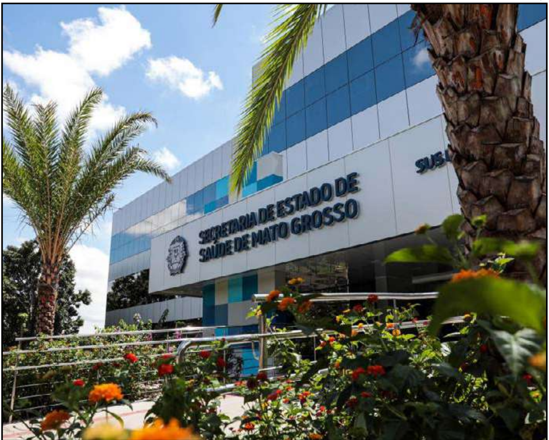
Repasse é relativo ao serviço prestado no mês de dezembro/2024

O investimento previsto, por ano, na unidade também será ampliado, passando de R$ 48,7 milhões para R$ 93,9 milhões, o que representa um incremento superior a 92% nos recursos destinados aos serviços.