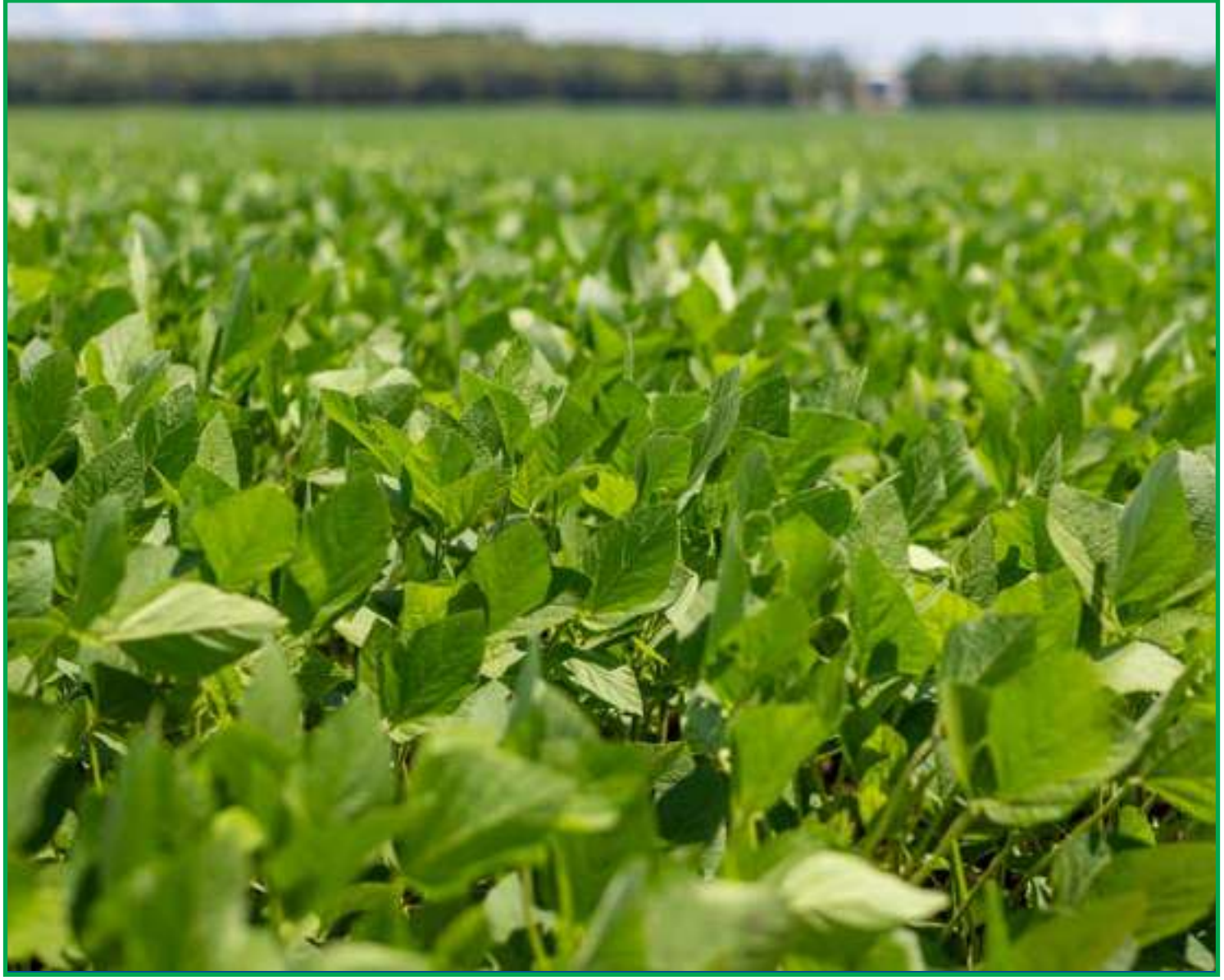
Evento reúne produtores, especialistas e lideranças

As inscrições para a Abertura Nacional da Colheita da Soja 2024/25 são gratuitas e estão abertas. Além da programação técnica e de debates estratégicos para o setor, o evento será uma oportunidade de troca de experiências entre produtores, especialistas e representantes do agro.