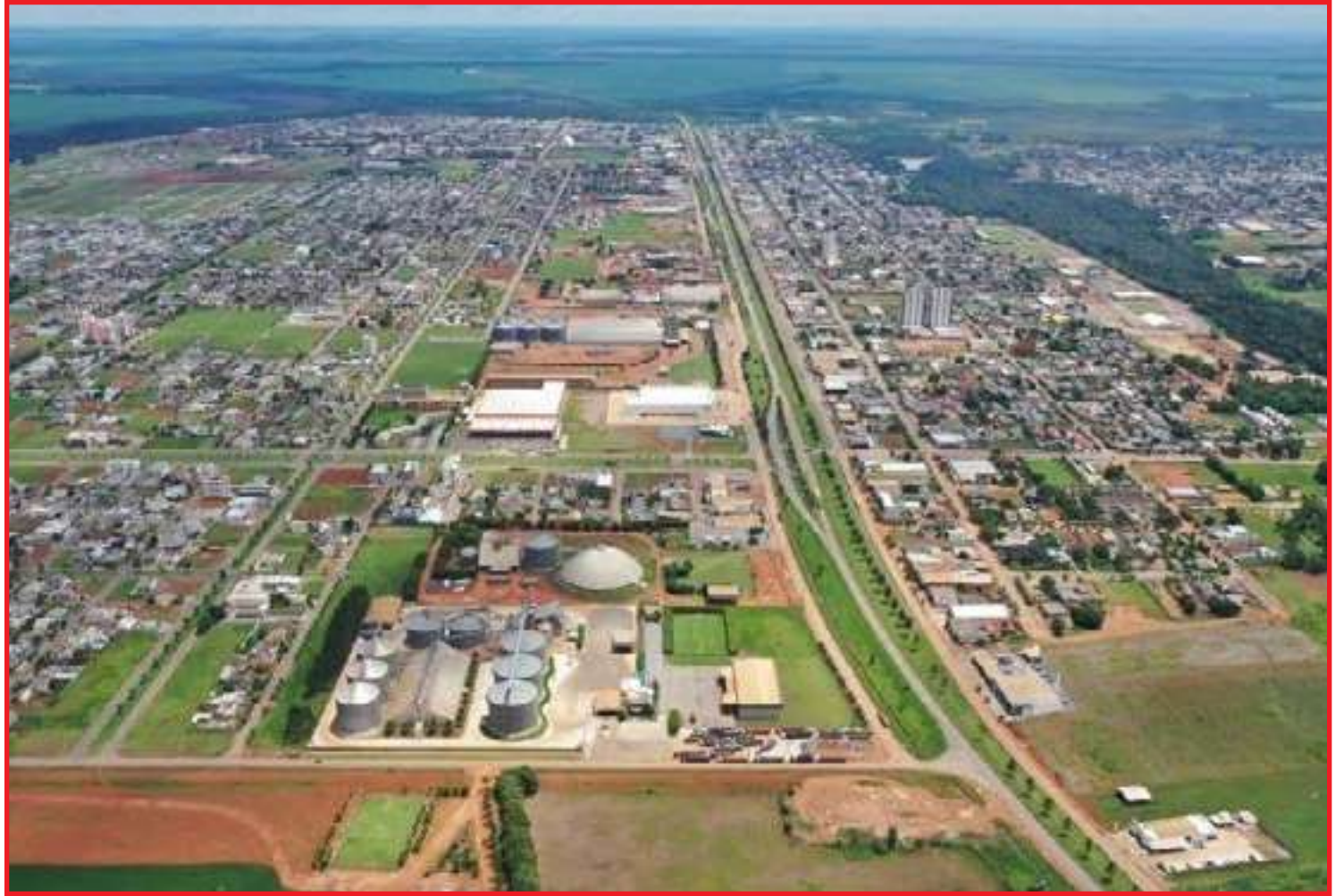
Também haverá construção de Pontos de Parada e Descanso (PPD)