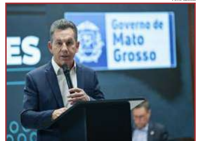
Governador diz que vai acionar Procuradoria para estudar projeto

próximo mês para definir se os equipamentos serão enviados pela Secretaria Estadual de Saúde ou se os recursos serão repassados à prefeitura para aquisição.