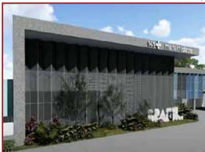
Unidade de R$ 103 milhões será construída no bairro Delta

tante na saúde municipal é o hospital municipal, que está na reta final de construção.