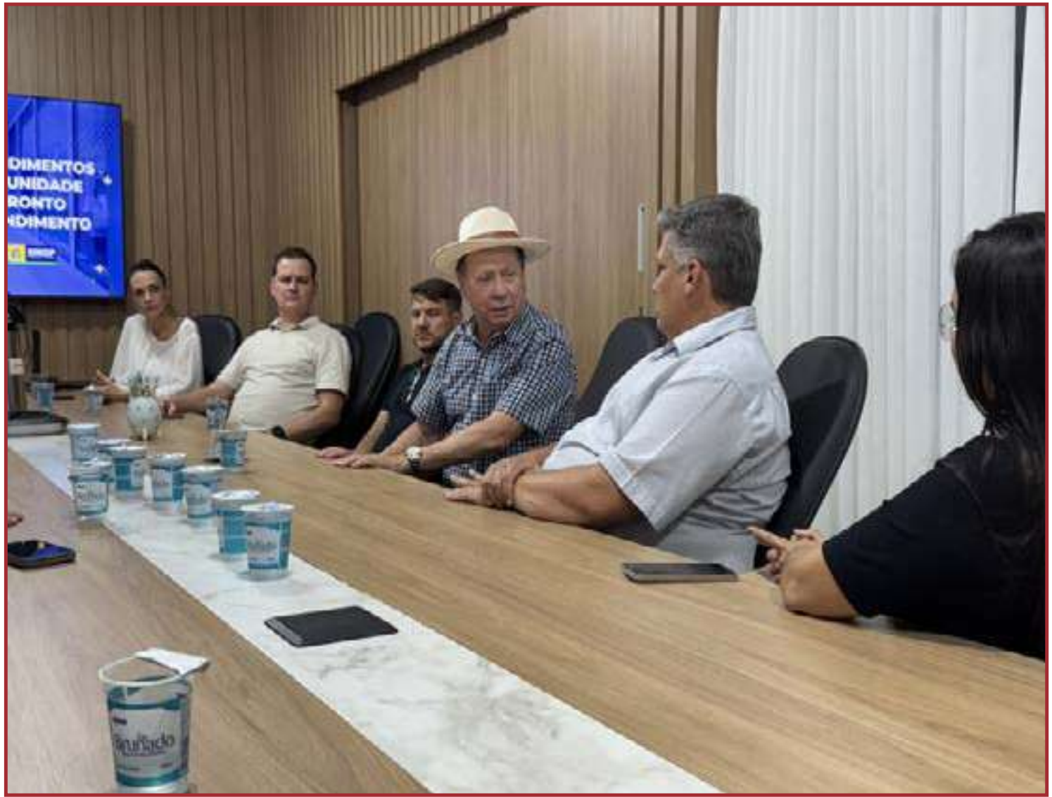
Pedido será encaminhado ao governador