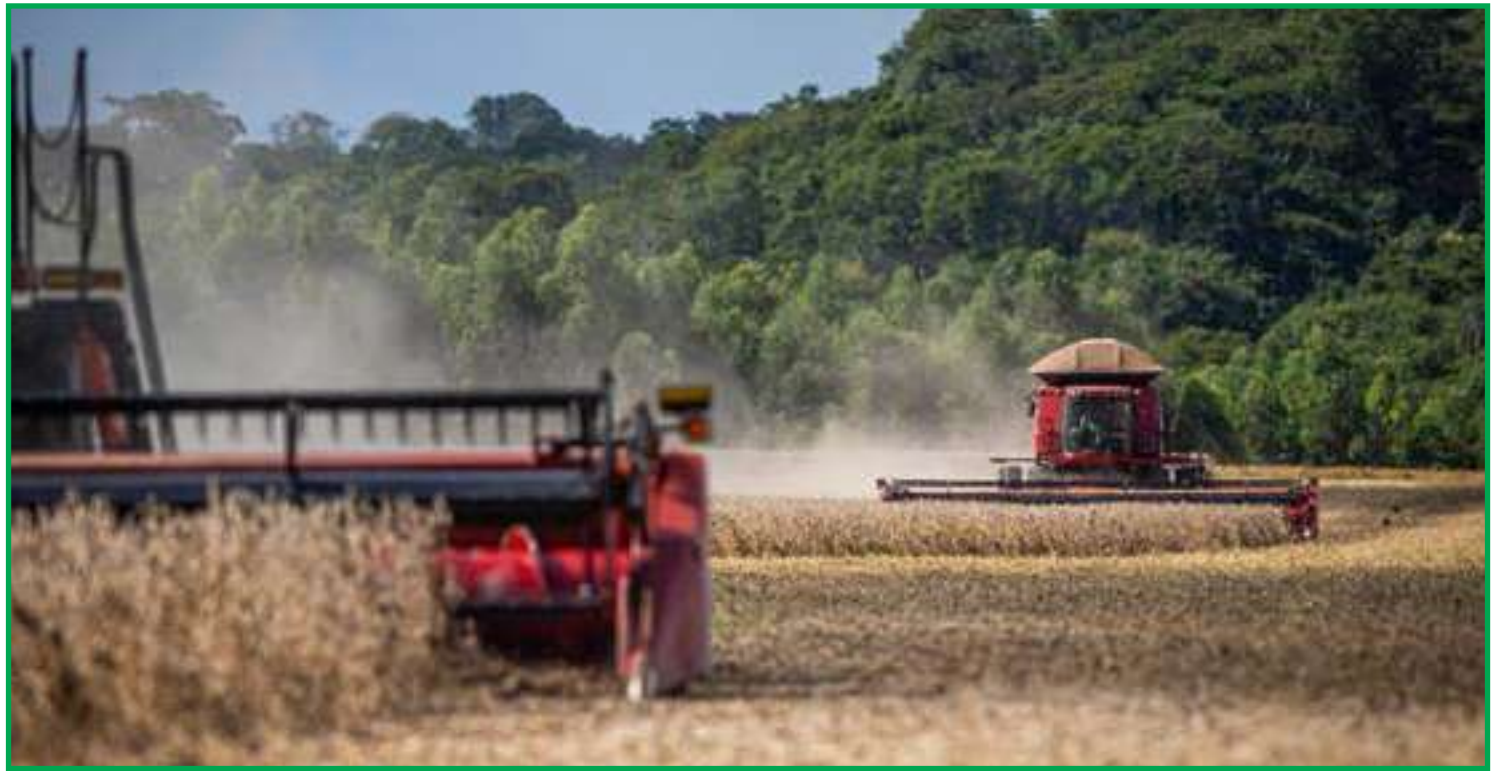
Estados da região devem crescer 2,8% este ano

Em relação ao Brasil, no geral, e às demais regiões, a expectativa é de desaceleração da economia diante de um cenário de aumento da taxa básica de juros (atualmente em 13,25%),