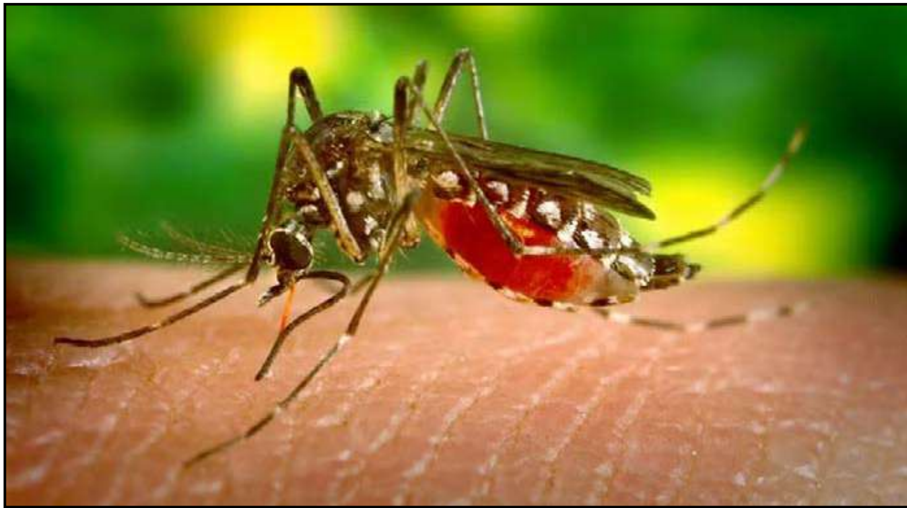
Aedes aegypti , mosquito transmissor da dengue, tem uma grande capacidade de adaptação

Em Cuiabá, a Prefeitura decretou estado de emergência na área da Saúde Pública da capital devido ao risco de epidemia de chikungunya e dengue. O decreto, válido por 60 dias, prevê a criação de um Comitê de Operações Emergenciais para monitorar a situação e tomar decisões estratégicas.