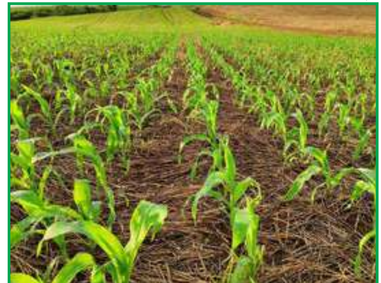
Clima, armazenagem, infraestrutura, custos e reforma tributária