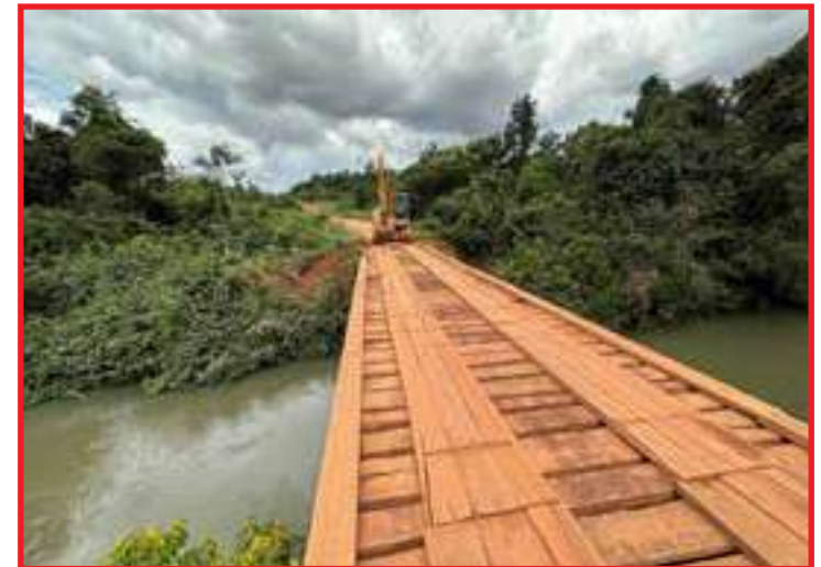
Estrutura sobre o Rio Celeste fica na região de divisa com Nova Ubiratã