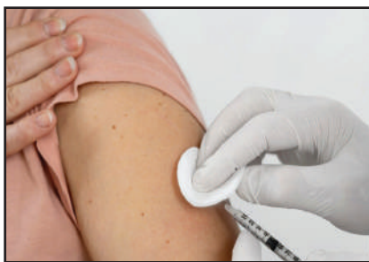
Página - 8

PLANTIO DO MILHO AVANÇA; ALGODÃO NA RETA FINAL