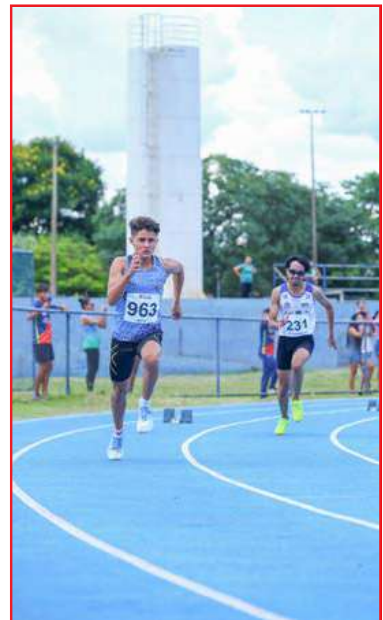
Bons resultados dos irmãos em MS