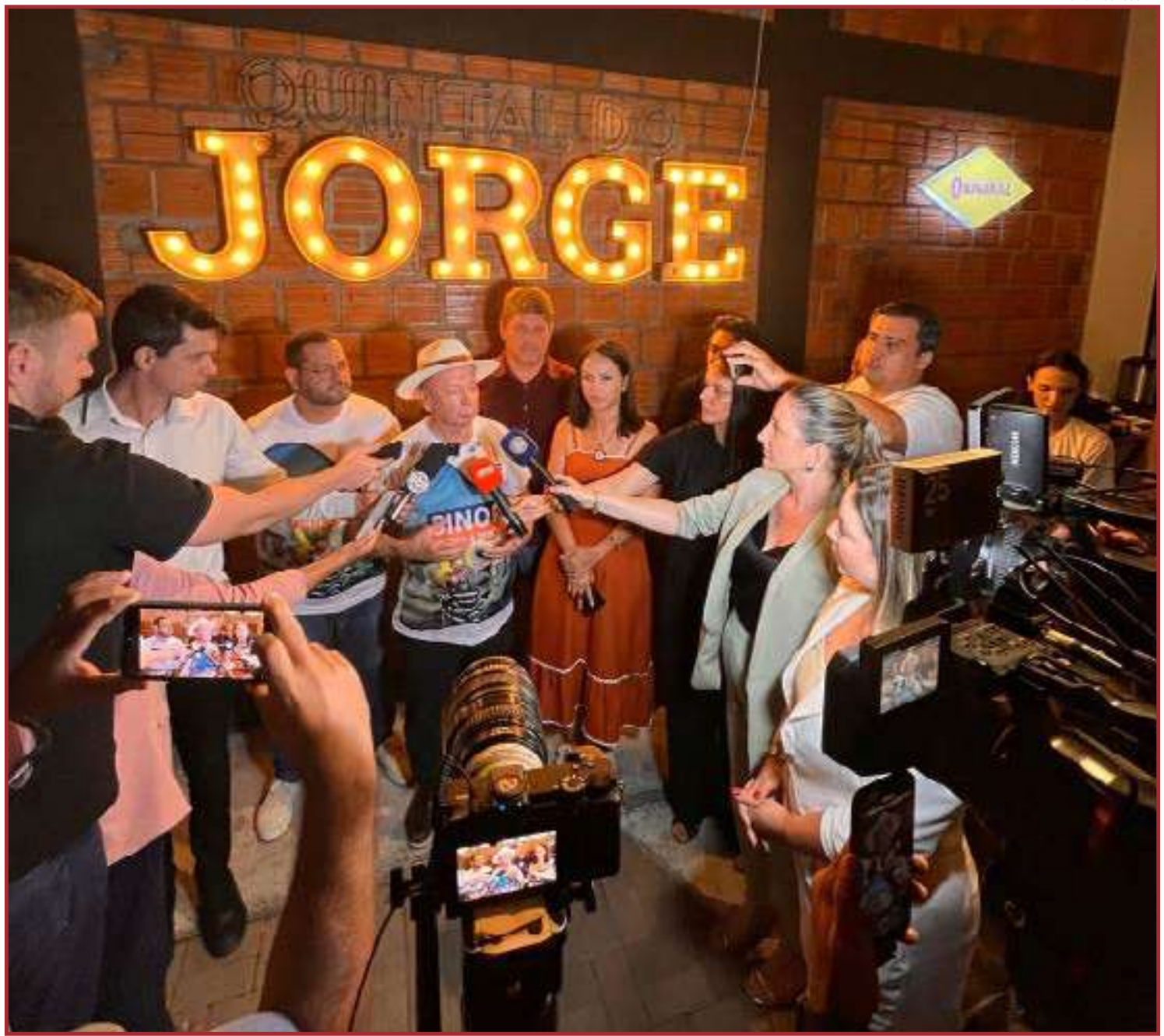
Intensificação das ações envolve limpeza e fiscalização nos bairros

"Não basta apenas a Prefeitura intensificar as campanhas e mutirões, cada morador precisa fazer sua parte para vencermos essa batalha", concluiu.