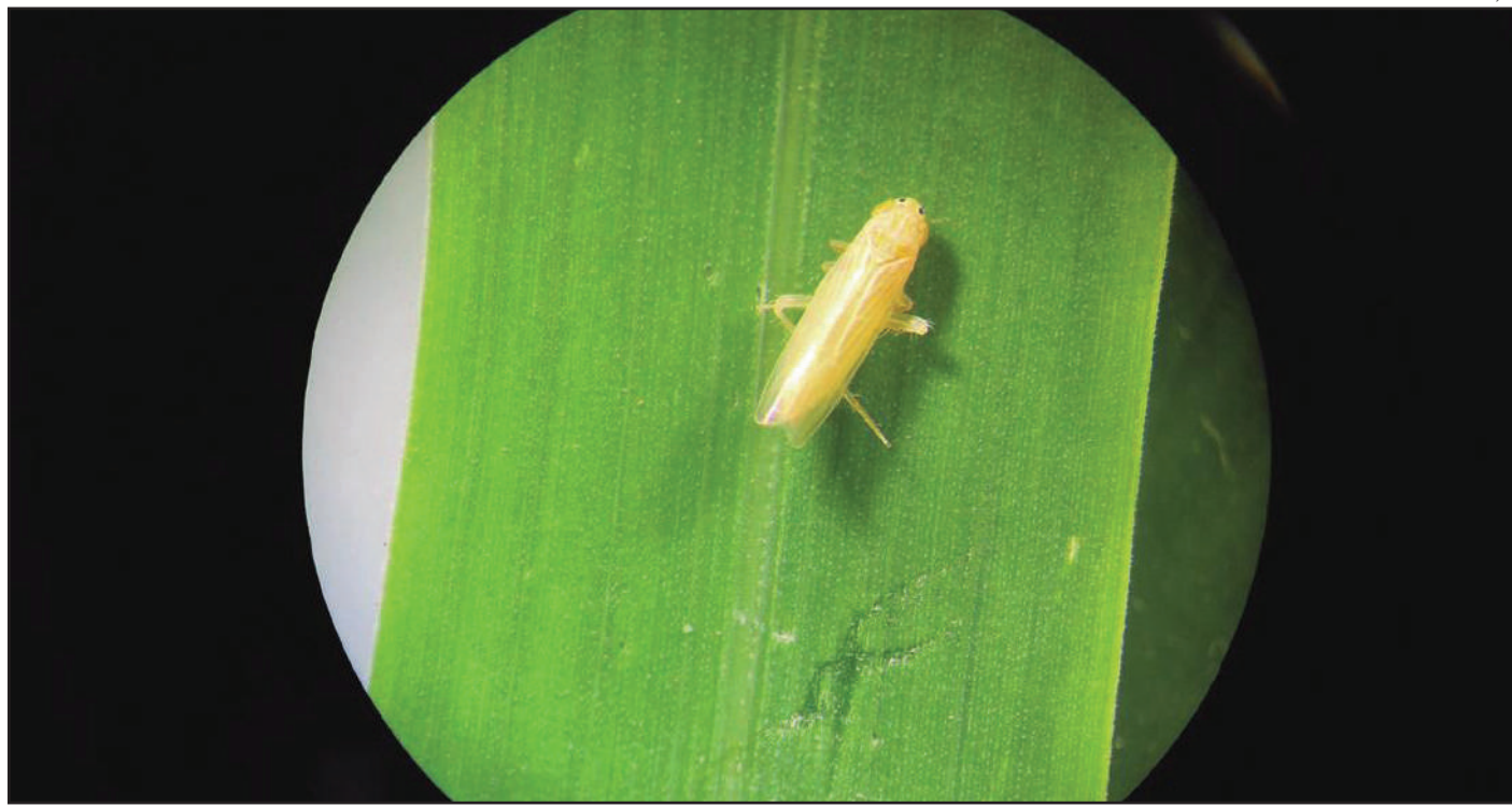
Página - 4

Na safra 2023/2024, a cigarrinha-do-milho gerou perdas significativas tanto no Brasil quanto na vizinha Argentina. Por aqui, a praga reduziu drasticamente a produtividade em diversas regiões, causando impactos expressivos, afetando diretamente o rendimento dos produtores e a oferta do grão no mercado.