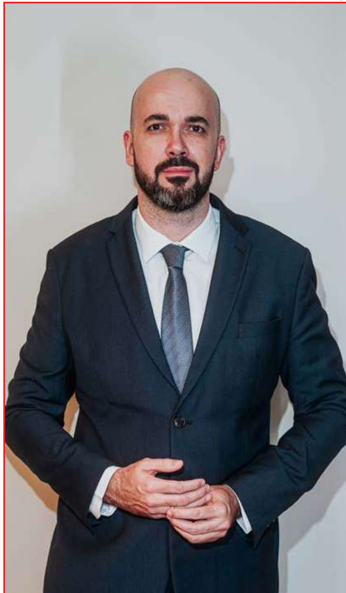
O advogado presidirá Comissão no triênio 2025-2027

"Vamos trabalhar juntos, com dedicação e comprometimento, para enfrentar os desafios que surgirem e contribuir com a evolução