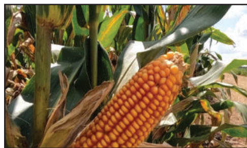
Página - 4

PLANTIO DO MILHO AVANÇA; ALGODÃO NA RETA FINAL