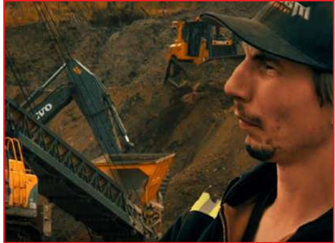
Minerador norte-americano Parker Schnabel, que comanda série do Discovery Channel

No dia seguinte, a negociação prossegue. E Balbinot revela o valor que quer pelos 50 hectares: algo em torno de R$ 6 milhões, ou US$ 1 milhão na cotação da época. É cinco vezes mais do que Parker havia pago em Yukon. Ele faz as contas e decide recuar. "Os riscos que eu correria aqui são muito altos. Acho que tem muito potencial aqui, mas preciso pensar nisso com calma",