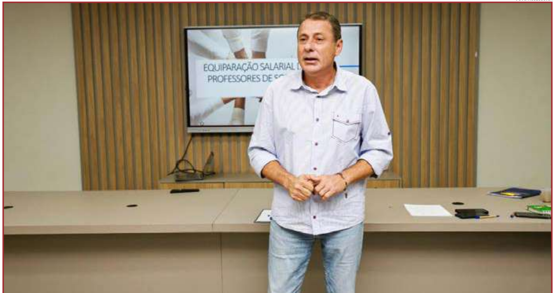
Prefeito de Sorriso assume com o compromisso de revolucionar a saúde