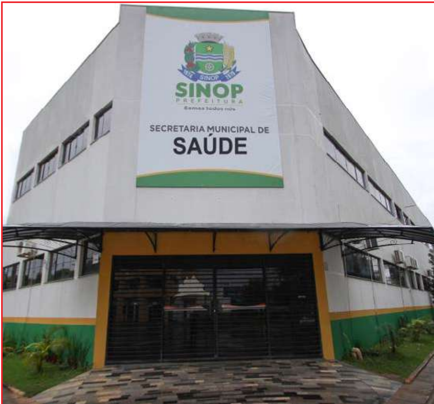
Município é o único com a maior quantidade de projetos aprovados para apresentação