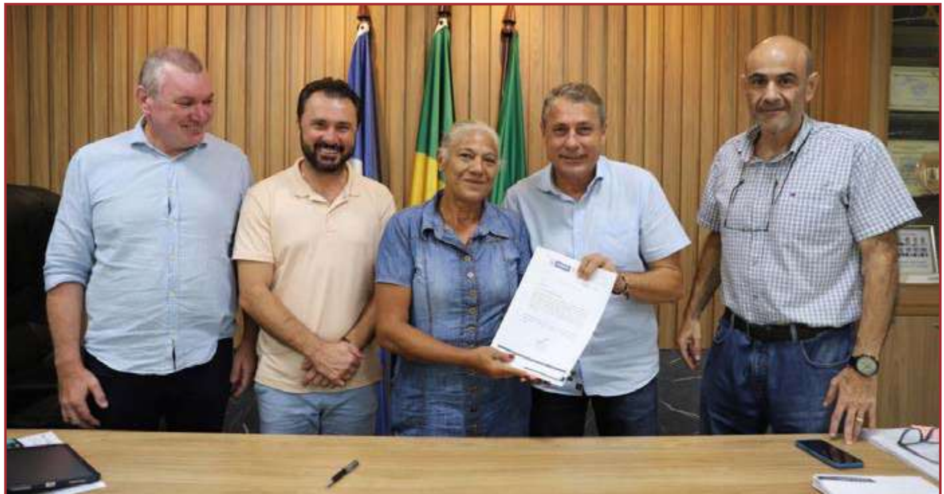
Em fevereiro, Alei entregou documento de posse a moradores de cinco bairros