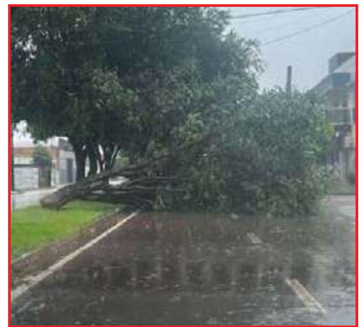
Árvores caíram em avenidas da cidade