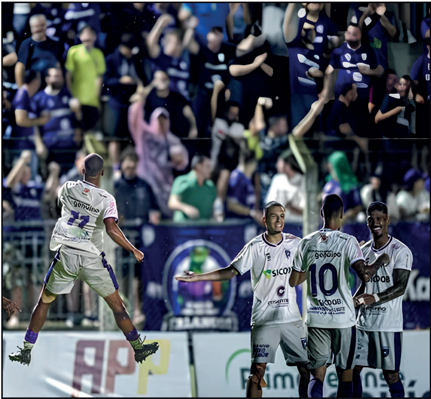
Torcida fez a festa em pleno Dutrinha