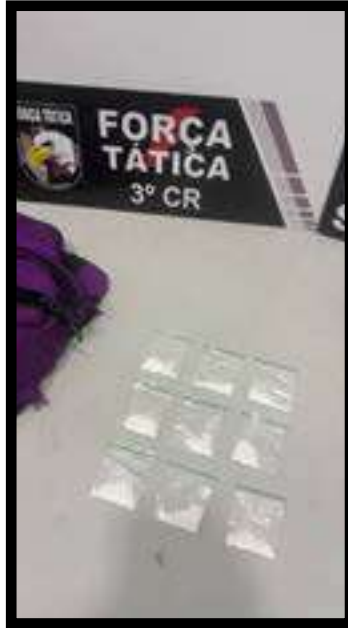
IMAGEM DO DIA