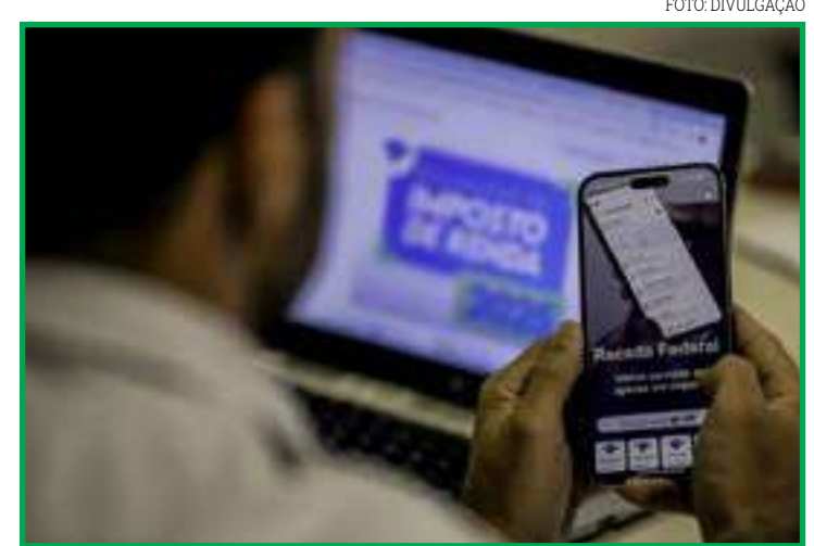
Prazo para contribuinte prestar contas vai até 30 de maio