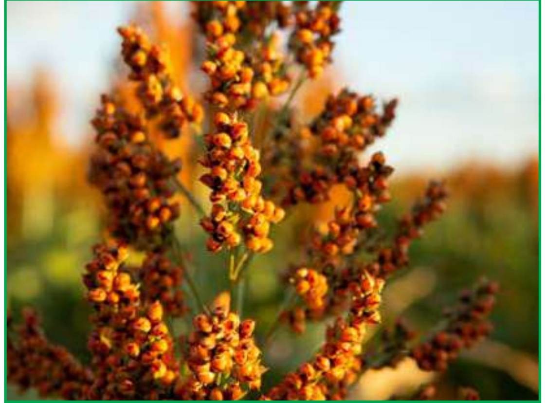
Cultura é mais tolerante à seca e adaptado aos mais variados climas do Brasil

Hoje a Advanta, vem quebrando paradigmas mostrando o quanto o sorgo tem potencial produtivo. Neste propósito a empresa desenvolve alguns trabalhos. Entre as tecnologias criadas, destaque para sor-