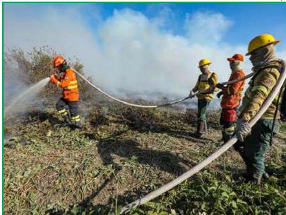
Bombeiros combatem fogo no Pantanal durante a seca de 2024

Grande parte da redução no Estado veio do Pantanal, que perdeu 61% de seus recursos hídricos. O bioma sofreu recentemente grandes queimadas, em 2020 e 2023, e enfrenta desde 2018 cheias abaixo do normal, não repondo a perda da seca.