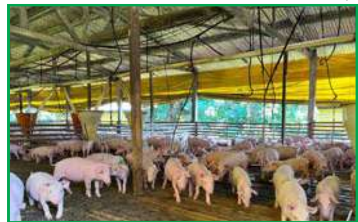
Preço da saca de 60 kg do milho eleva custo de produção e gera preocupação