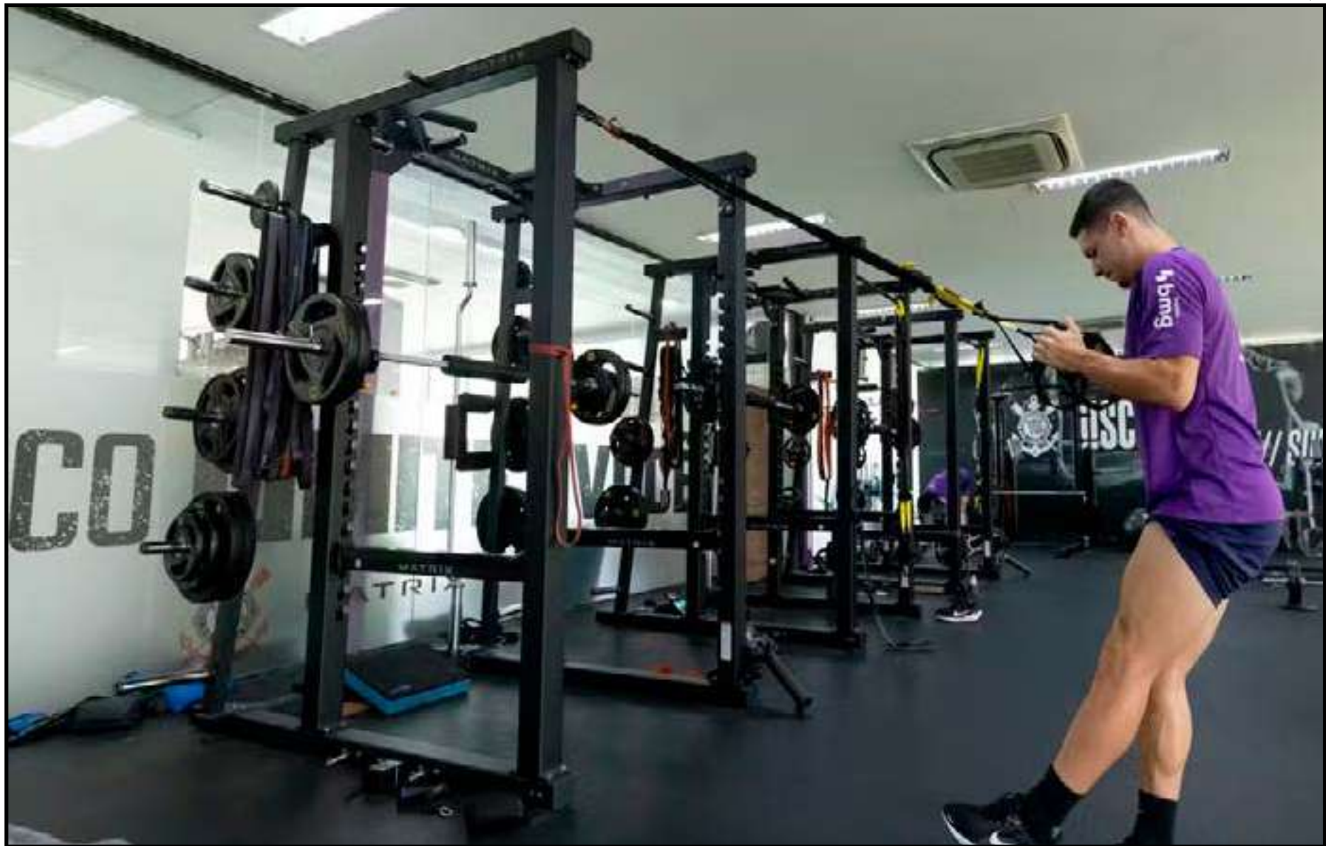
Atleta tem treinado sem restrições com o restante do grupo

A tendência é de que ele esteja à disposição de Ramón Díaz para a decisão