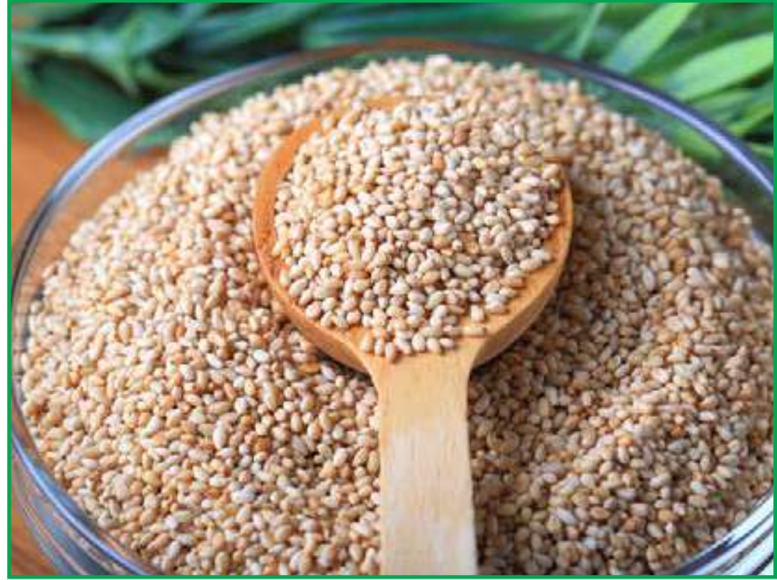
Acordo é resultado da participação de MT na China International Import Expo

Outro destaque do acordo é o desenvolvimento conjunto de 2 a 3 novas linhagens de gergelim, que serão testadas no Brasil com vistas à sua aprovação como novas variedades nacionais. Também será feita a introdução de cultivares chinesas no Brasil, com pedidos formais de teste de desempenho produtivo em campo. A parceria também prevê metas concretas: até maio de 2025 devem ser formados grupos técnicos, estabelecidos planos de curto e médio prazo, avaliadas pelo menos quatro cultivares de cada país e troca-