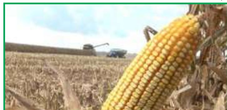
Recuo no preço do gergelim é um dos fatores apontados para a maior presença de milho na região

O coordenador administrativo salienta que a expectativa na região é que as chuvas prevaleçam um pouco mais. "A chuva não pode