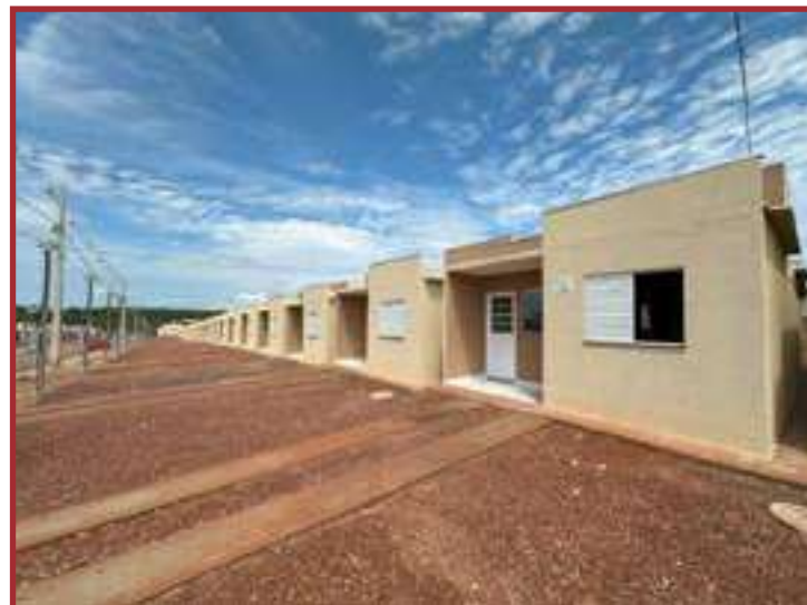
Prefeituras aguardam a avaliação de viabilidade dos terrenos

Santos destaca que alguns municípios que não