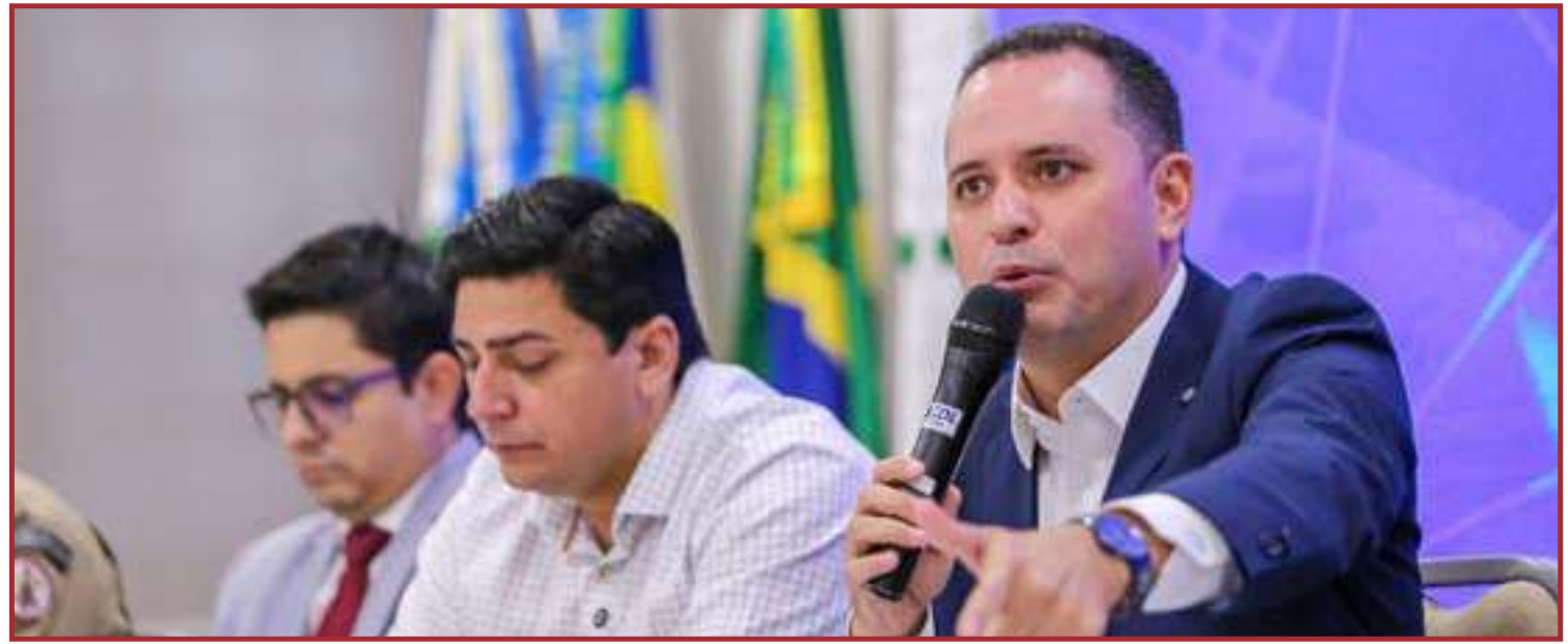
Simplificação tributária e a melhoria do ambiente de negócios em MT