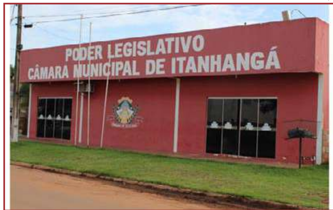
Procurador-Geral ingressou com Adin

Conforme argumenta o Procurador-Geral, ficou assentado pelo STF que a vedação se aplica apenas ao mesmo cargo e não há