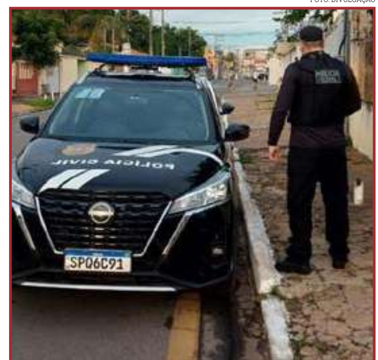
Polícia Civil cumpriu mandados judiciais em Mato Grosso