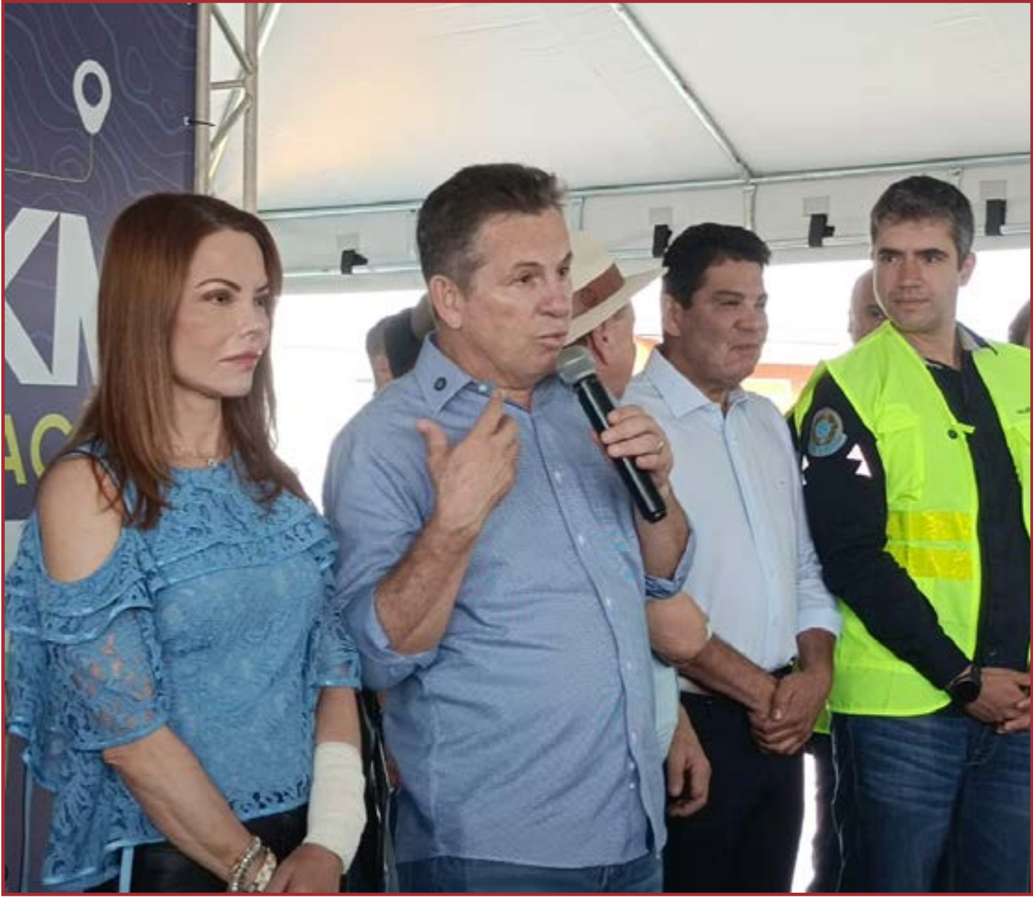
Estado conclui etapa histórica

Entre Sinop e Sorriso, por exemplo, três novas estruturas foram erguidas para substituir pontes antigas e ampliar a capacidade da rodovia. O contrato específico do trecho entre Sorriso e Sinop prevê aporte de R$ 396 milhões, reforçando o compromisso com a modernização da BR-163.