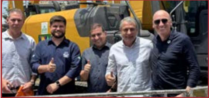
Equipamentos para a agricultura de Sorriso