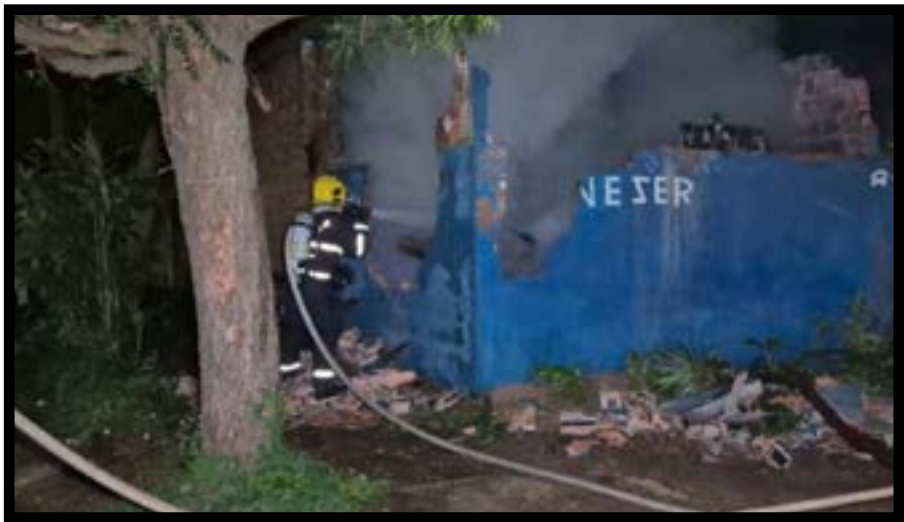
Um incêndio de grande proporção danificou uma casa na Avenida Ildo Bianchi, no Jardim Vila Mariana, em Sinop, na noite de quarta. O fogo começou enquanto os moradores estavam em um culto religioso. A rápida ação de vizinhos impediu que as chamas consumissem totalmente o imóvel e permitiu a retirada de um VW Gol da garagem. Ninguém ficou ferido. Vizinhos perceberam o fogo e iniciaram os primeiros combates, jogando água e areia no local, antes da chegada dos Bombeiros. A residência pertence a uma senhora que estava na igreja no momento que o incêndio começou e disse não saber a causa.