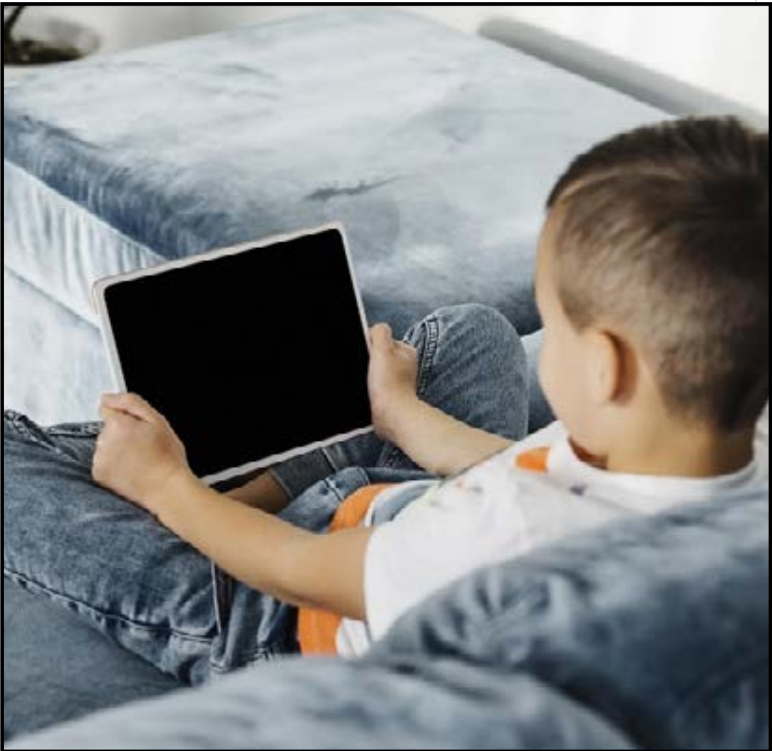
Hiper conexão digital impacta profundamente o desenvolvimento infantil

Proporcione atividades de convivência: a educadora reforça que as tarefas cotidianas podem se tornar momentos de conexão. Fazer compras com as crianças, organizar o quarto ouvindo música ou instituir o “minuto da conversa”, em que cada membro da família compartilha algo bom ou difícil do dia, são maneiras de fortalecer vínculos e ensinar escuta ativa. Esses rituais simples ajudam a construir um ambiente emocionalmente seguro, especialmente importante em um período