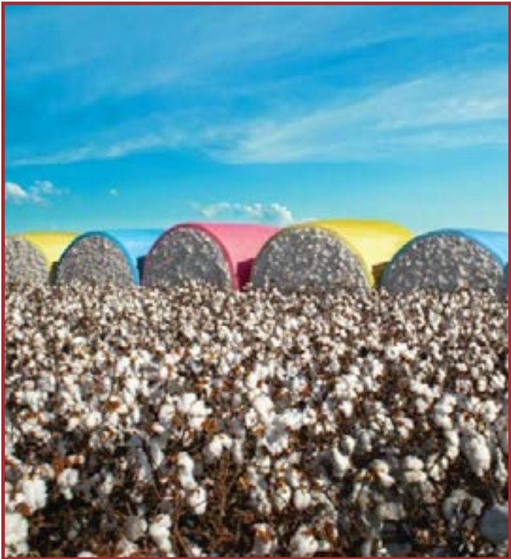
MT conseguiu redirecionar os embarques e ampliar as vendas para mercados asiáticos

A partir de junho, entretanto, o cenário mudou. Os preços da pluma passaram a cair com mais intensidade, pressionados pela desvalorização externa, pela queda do dólar e pelo aumento das vendas de estoques da safra 2023/24. Além disso, a proximidade da colheita recorde de 2024/25 ampliou a percepção de excesso de oferta. Diante desse quadro, compradores adotaram uma postura mais cautelosa, aguardando condições mais favoráveis para negociar. Com a oferta elevada e uma demanda interna moderada, a recuperação dos preços foi limitada. A instabilidade geopolítica e o câmbio menos favorável também contribuíram para esse cenário. Para o início de 2026, agentes já intensificam novas programações de embarques e contratos futuros, consolidando o mercado a termo como a principal estratégia de gestão comercial do setor.