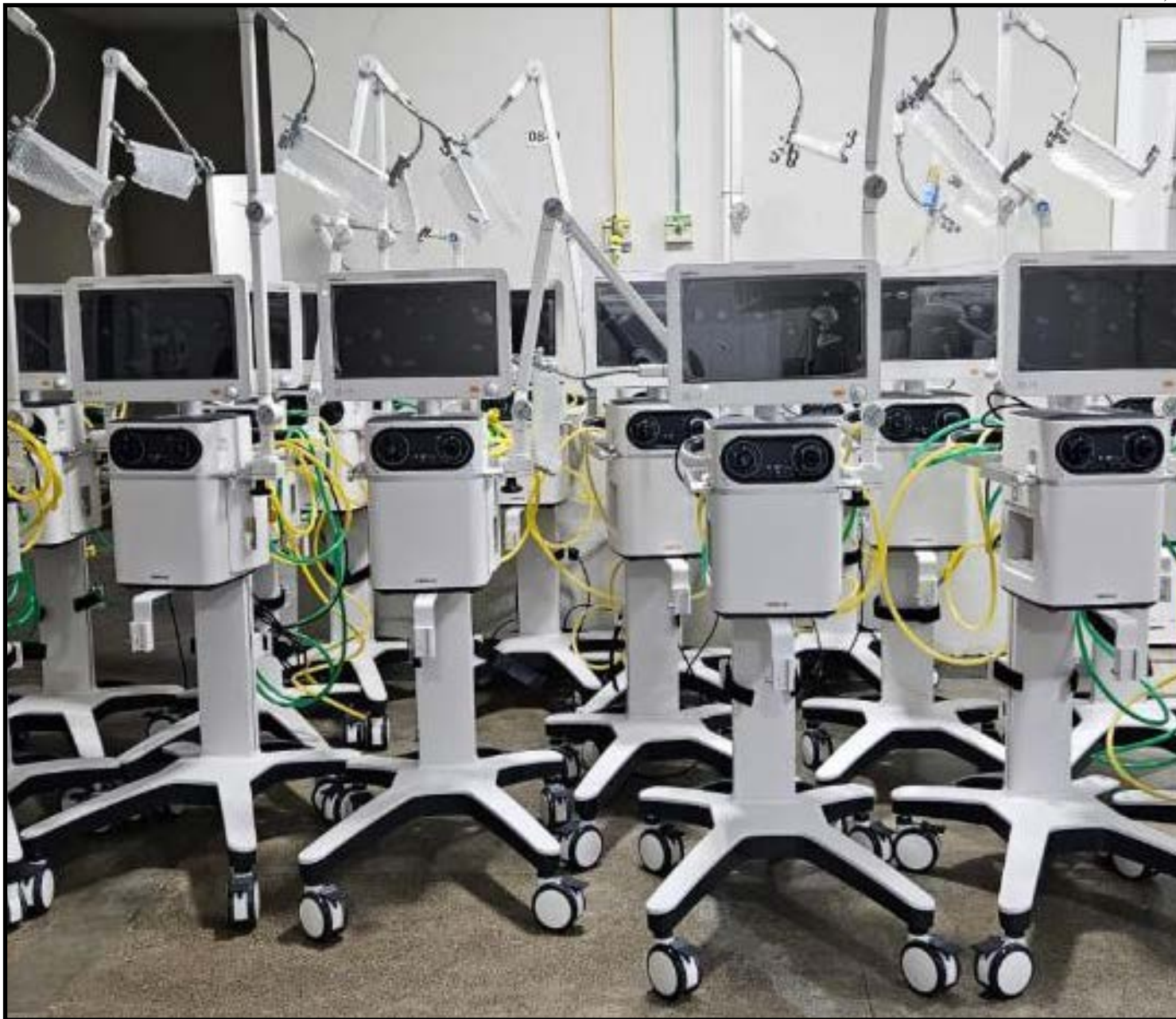
HR Sorriso adquiriu 15 ventiladores pulmonares e convocou 135 profissionais

ainda que a unidade dispõe de residência médica em clínica médica. "Temos uma equipe reforçada para dar conta dos atendimentos à população da Macrorregião", acrescentou.