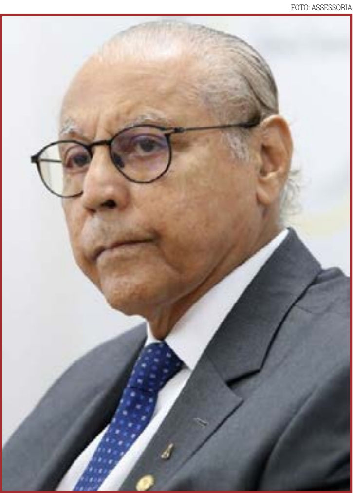
Falta de definição pode acelerar esvaziamento

Diante da mudança no cenário jurídico, sindicatos pressionam por uma reavaliação da postura do governo estadual, enquanto o Executivo mantém cautela ao tratar do impacto fiscal. “Qualquer decisão precisa respeitar os limites da responsabilidade fiscal”, diz a nota oficial.