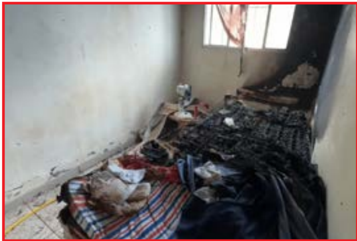
Incêndio em residência no Recanto dos Pássaros

Eu estou grávida de três meses, foi um susto enorme. Eu vim para fora, ele ficou dentro tentando apagar o fogo. Foi quando eu liguei para o Corpo de Bombeiros”, contou.