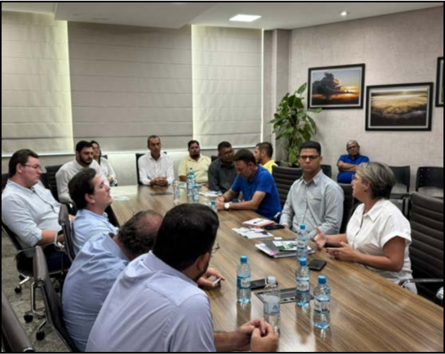
Visita técnica ocorreu em Lucas do Rio Verde

A troca de experiências entre os municípios reforça o compromisso da gestão em buscar soluções inovadoras, sustentáveis e alinhadas ao futuro da cidade.