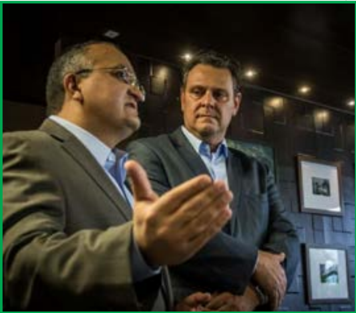
Petista cita histórico de rompimento político

Após deixar o cargo, Fávaro disputou eleição no palanque de Mauro Mendes, foi derrotado naquele pleito e acabou eleito senador em 2020, em eleição suplementar após a cassação de Selma Arruda. O episódio deixou sequelas políticas entre os grupos. A declaração ocorre enquanto Taques tenta reconstruir sua base política, apostando em articulação nacional. Filiado ao PSB desde dezembro de 2025, ele assumiu a presidência estadual da legenda com apoio de dirigentes nacionais e expectativa de presença de Geraldo Alckmin em sua posse.