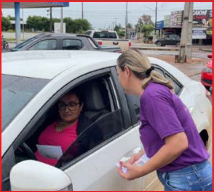
Pit stop foi realizado em algumas vias da cidade