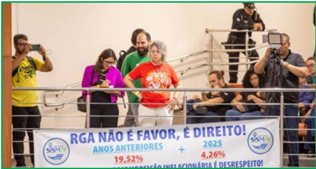
Nova lei federal reabre debate sobre pagamento

O histórico apresentado pelo governo aponta que a RGA foi paga integralmente em 2017 e 2018, enquanto, em 2019, a concessão foi barrada