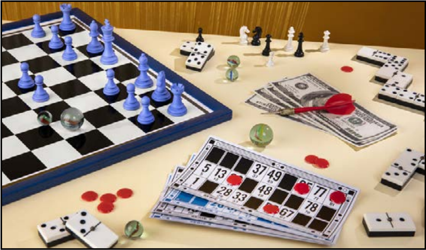
Jogos de tabuleiro atravessaram a história como uma das formas mais antigas de entretenimento

Outro ponto destacado por educadores é a possibilidade de adaptação dos jogos a diferentes faixas etárias e contextos. Com ajustes simples nas regras ou na dinâmica das partidas, os jogos podem