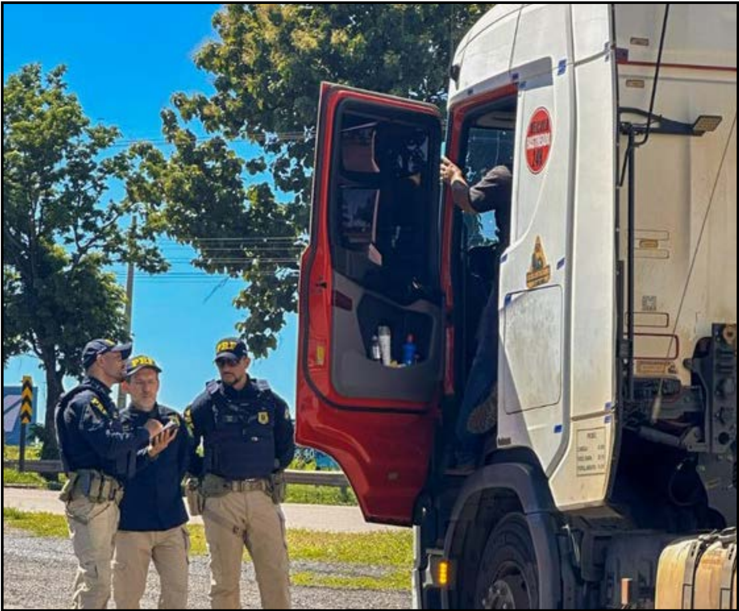
Mais de 2 mil motoristas flagrados dirigindo sob efeito de álcool

multa gravíssima no valor de R$ 2.937, recolhimento do veículo e suspensão do direito de dirigir. Mesmo com o aumento do fluxo de veículos nas rodovias federais durante o período, aliado à melhoria das condições da via, da sinalização e à intensificação das fiscalizações, os sinistros de trânsito registrados totalizaram 2.638 ocorrências, com 2.835 feridos e 243 mortes, contra 2.555 sinistros, 2.719 feridos e 244 mortes em 2024. As principais causas dos sinistros ainda mantêm relação direta com o comportamento dos condutores, com destaque para reação tardia ou ineficiente do condutor; ausência de reação e acesso à via sem observar a presença de outros veículos. Já os tipos de acidentes mais registrados foram a saída de pista, seguida de colisão traseira e colisão transversal. As rodovias BR-163, com 972 sinistros, e BR-364, com 750 ocorrências, continuam sendo os trechos que demandam maior atenção operacional, em razão do elevado fluxo de veículos, especialmente do transporte de cargas. Nas ações de combate ao crime, o destaque vai para a apreensão de drogas, que superou 2024, ultrapassando 18 toneladas de entorpecentes. A Cocaína foi a mais apreendida com 7,4 toneladas, seguida do skunk 7,3 toneladas, maconha com 3,2 toneladas, haxixe com 111kg e 15,9 kg de crack. Outros resultados ex-