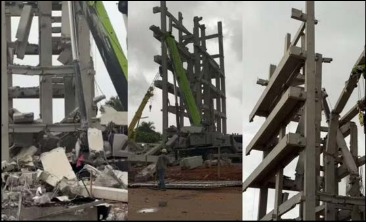
'Não tem como dar errado'... mas deu

“Felizmente, os trabalhadores conseguiram sair rapidamente. Fazer o traba-