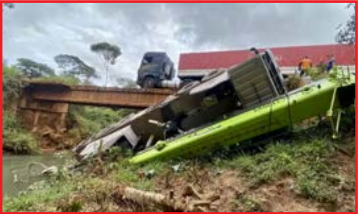
Ponte sobre o Córrego Grande na MT-560 foi totalmente interditada