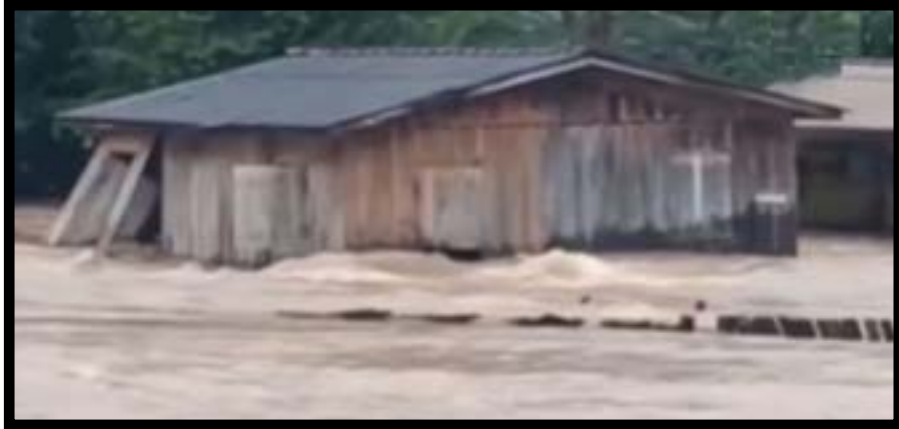
Uma casa foi arrastada pela força da correnteza após uma forte tempestade atingir o distrito de Nova União, em Cotriguaçu, na terça (20). Imagens registradas após o temporal mostram o imóvel com as paredes destruídas e a estrutura comprometida devido ao impacto da enxurrada. Segundo moradores, a chuva começou por volta das 4h e seguiu até cerca das 10h, com volume intenso e contínuo. Com a força da água, estradas de terra ficaram intransitáveis, pontes e acessos foram danificados, e algumas famílias ficaram ilhadas, sem conseguir sair ou receber ajuda imediata. A Secretaria do distrito informou que 12 famílias foram afetadas pelos temporais.