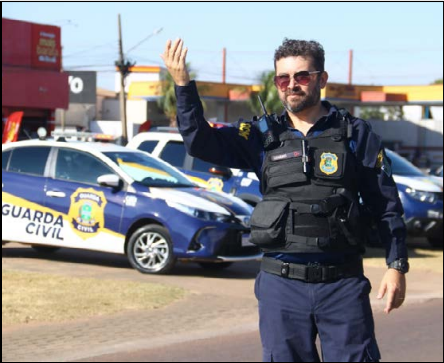
Atenção no trânsito precisa ser redobrada

Sinop é um polo educacional que conta com mais de 75 escolas, somando as redes municipal, estadual, federal e privada. Diante desse quantitativo significativo, a GCM seguirá realizando o trabalho ostensivo de Rondas Escolares de forma escalonada.