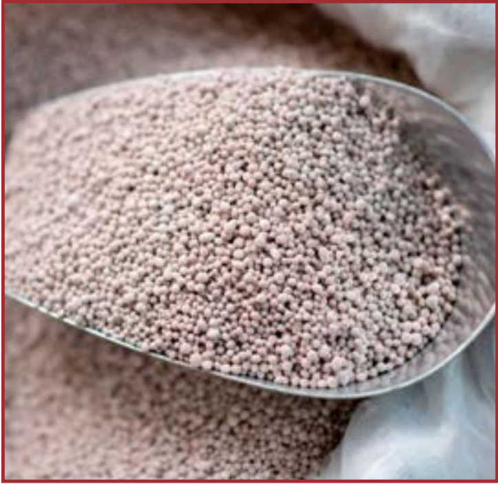
Tensões colocam o Brasil sob alerta