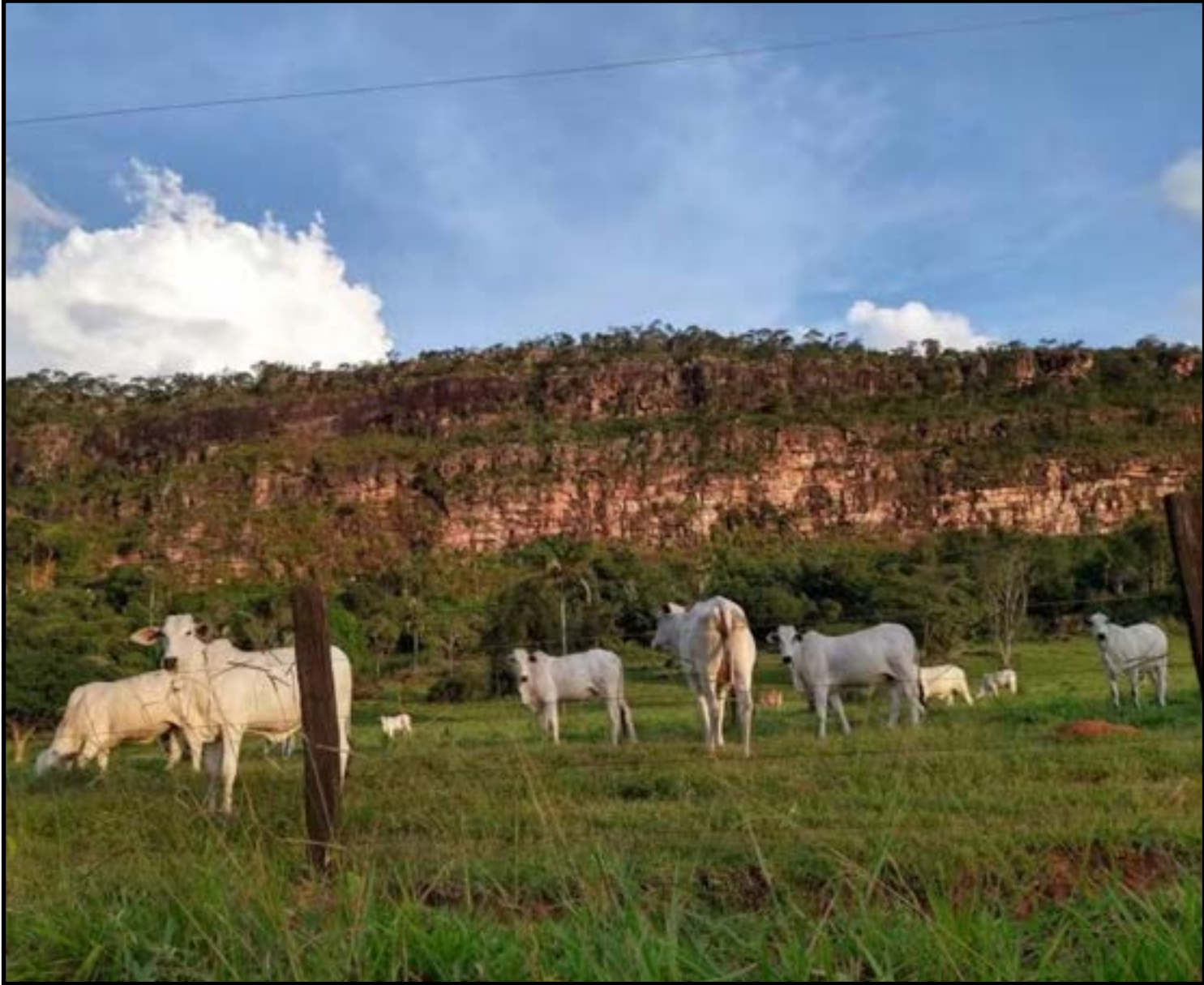
Pecuária havia registrado marco histórico de 7,36 mi de cabeças enviadas às indústrias

Outro detalhe que chama atenção foi a mudança no perfil do rebanho, de acordo com a Famato. “Animais com até 24 meses atingiram 43% do total, o maior patamar da série, somando 3,23 milhões de cabeças. O avanço reflete margens melhores e adoção de terminação intensiva nas regiões líderes”, disse.