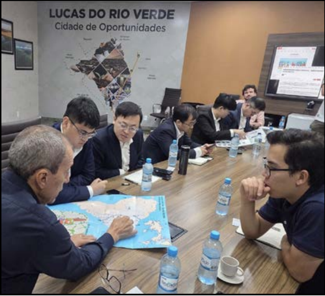
Vaz recebeu empresários chineses

O Município também promoveu feirinhas mensais da agricultura familiar, incentivando a comercialização direta e fortalecendo a economia local. A secretaria também participou do Show Safra 2025, realizando o 8º Fórum da Agricultura Familiar, que contou com lançamento do Selo de rastreabilidade da agricultura familiar de Lucas do Rio Ver-