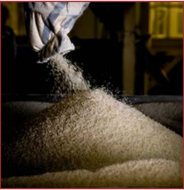
Fatores como produção elevada mantêm os preços do arroz travados no Brasil