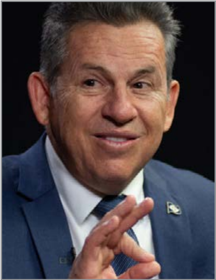
Governador reage a ação sobre acordo com Oi