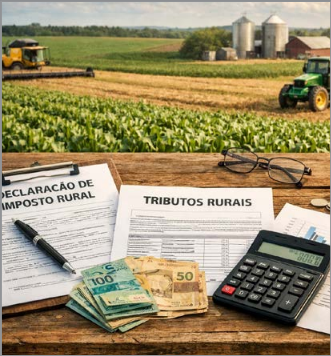
Mudanças vão gerar mais complexidade contábil e fiscal das atividades no campo

"Isso indica que o produtor rural pessoa física poderá receber um número junto ao CNPJ, sem que, necessariamente, tenha que se constituir como 'empresa', a exemplo do que já ocorre em alguns Estados, como São Paulo", esclarece o especialista. Ainda não está definido se esse cadastro será vinculado ao CPF do produtor ou a cada propriedade rural, o que demanda atenção especial, sobretudo para aqueles que possuem mais de um imóvel rural.