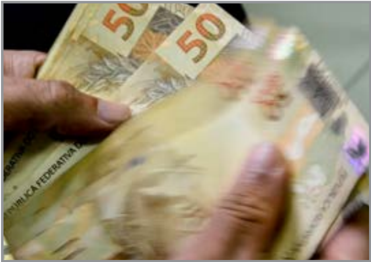
Estimativa para o PIB é 1,8% em 2026