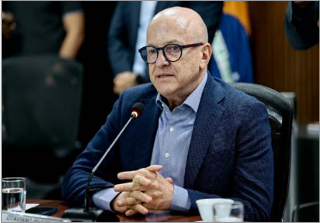
Vice defende continuidade e cita avanços da gestão

Além da eventual posse, o vice-governador também é pré-candidato ao Governo em outubro e tem adotado um discurso centrado na continuidade administrativa. Durante a fala, ele destacou o volume de investimentos realizados pelo Estado nos