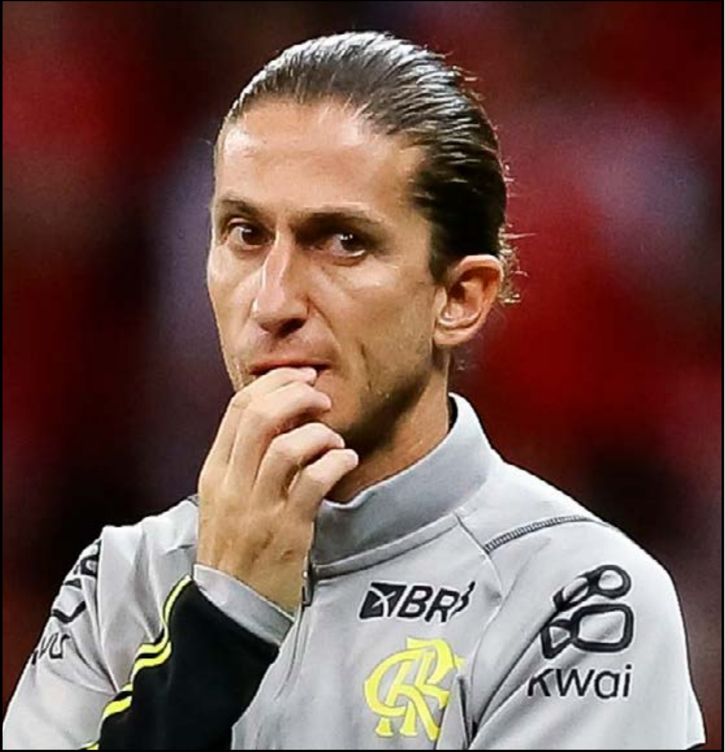
Filipe Luís correu risco de ser eliminado com antecedência

Se perder, o Flamengo estará automaticamente eliminado e disputará o Grupo X, o quadrangular do rebaixamento. O Flamengo enfrenta o Sampaio Corrêa no sábado (7), às 20h, pela última rodada da fase de grupos do Campeonato Carioca. Antes, nesta quarta (4), o Rubro-Negro encara o Internacional, às 18h, pelo Brasileirão. Os dois jogos acontecem no Maracanã.