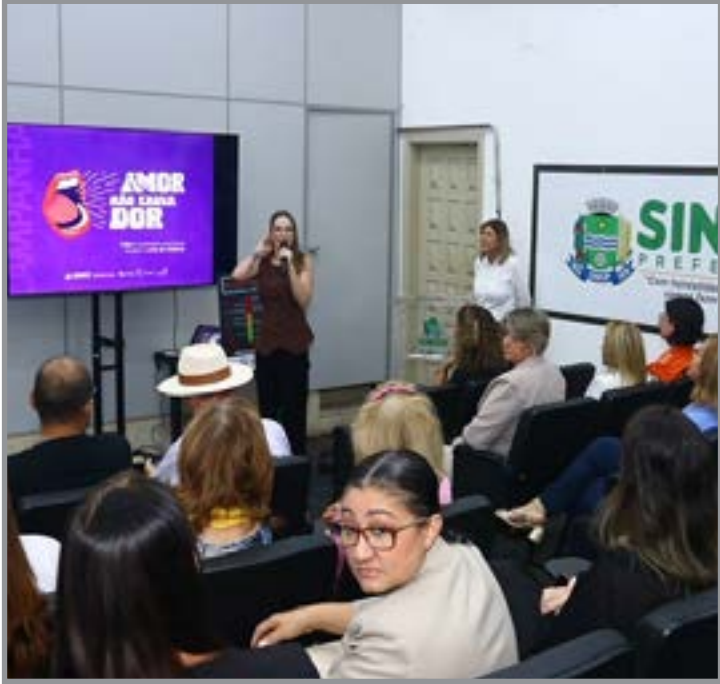
Cidade lidera ranking estadual de casos em MT