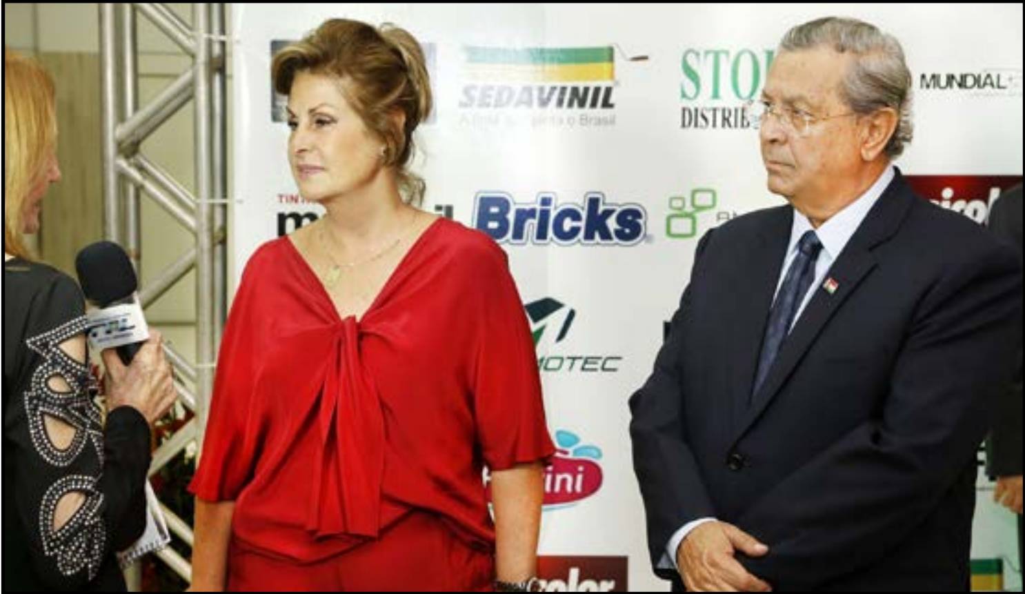
Senador Jayme Campos reavalia corrida ao governo