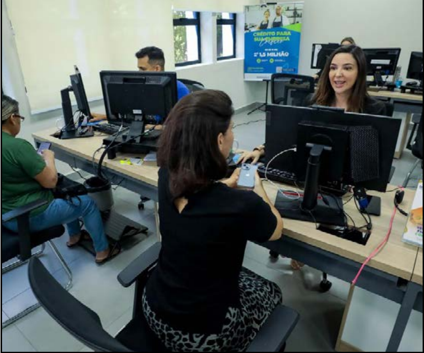
Planejamento, clareza no investimento e organização financeira

3 - Organize as planilhas e documentação com antecedência: a parte documental costuma ser simples, mas as planilhas financeiras ainda são um dos pontos que mais geram dúvidas durante o processo. Informações sobre faturamento, despesas e projeções financeiras são essenciais para a análise de viabilidade do crédito. As planilhas mostram a realidade financeira da empresa. Quando os dados estão