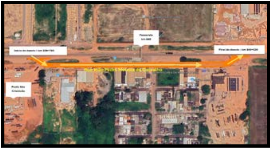
A Nova Rota iniciou ontem as obras de recuperação e reforço estrutural da passarela de pedestres localizada no km 840 da BR-163/MT, em Sinop. Para a execução dos serviços, o fluxo de veículos será desviado em um trecho de aproximadamente 500 metros da rodovia. Após o término das atividades, a passarela será liberada para uso dos pedestres. O cronograma poderá sofrer alterações em razão de condições climáticas desfavoráveis.