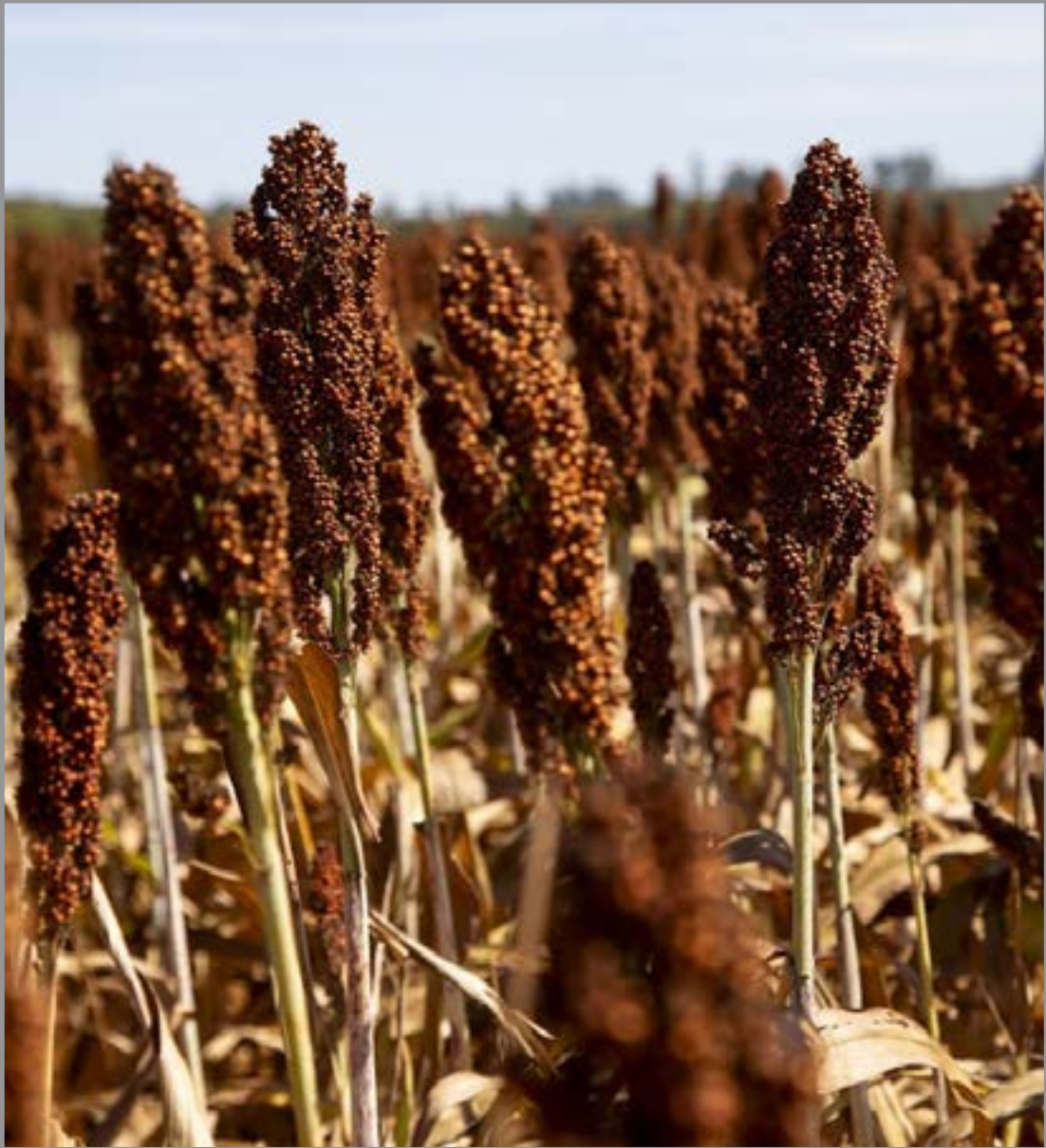
Sorgo vive um momento de consolidação no Brasil

A empresa atua globalmente há mais de 50 anos em melhoramento genético de diversas culturas e tem trabalhado para elevar o sorgo a um novo patamar no Brasil. Entre as inovações está o sorgo igrowth, uma tecnologia que auxilia de forma eficaz no controle de plantas daninhas e gera benefícios inclusive para as culturas subsequentes.