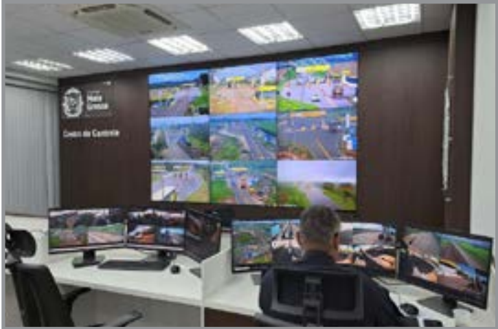
Serviço é realizado por policiais militares