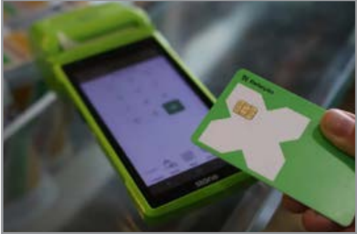
Decreto assinado em novembro pelo presidente Lula alterou o programa