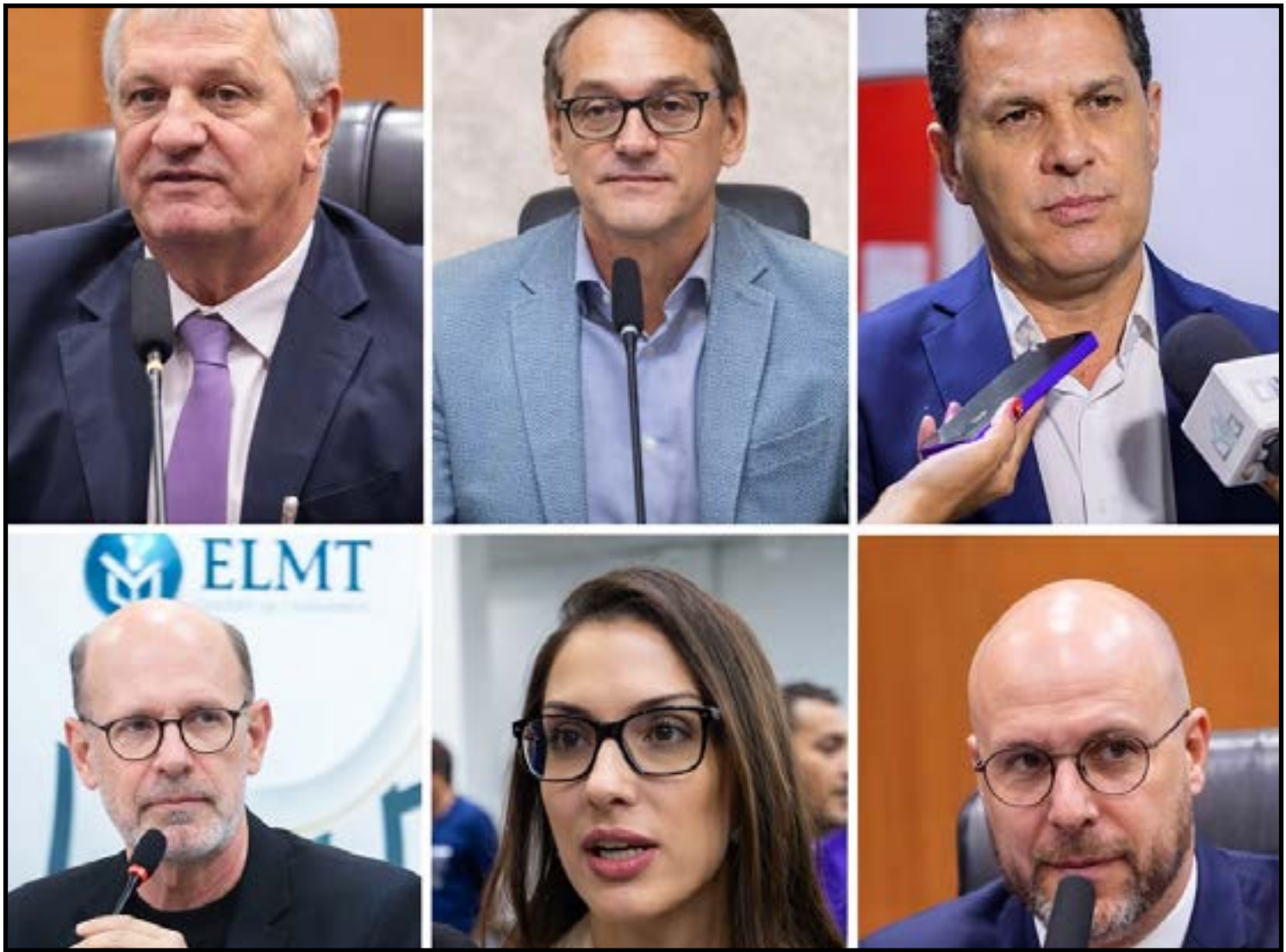
Russi explica que caberá a WS convocar primeira reunião para instalar comissão

"Os blocos indicaram deputados que demonstraram interesse e disposição para contribuir, o que é fundamental para que a CPI realize um bom trabalho", concluiu.