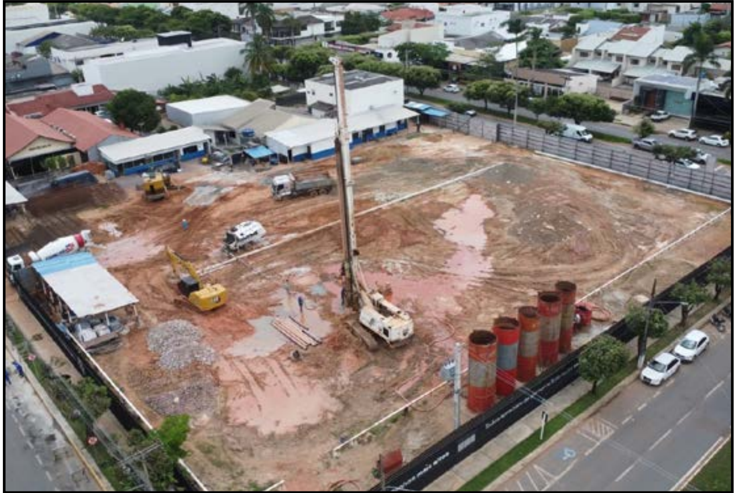
Salto é ainda maior quando comparado a janeiro deste ano

A pasta também registrou aumento de 49,96% na metragem quadrada da construção civil. Em fevereiro de 2025, foram registrados 45.436,46 m 2 ; já em fevereiro de 2026, foram autorizados 68.136,56 m 2 de construção. No acumulado dos dois meses (janeiro e fevereiro), em 2025 foram registrados 96.602,03 m 2 , enquanto em 2026 o número chegou a 192.993,29 m 2 — um aumento de 99,78%, praticamente o dobro. Os projetos para construções unifamiliares lideram o ranking de autorizações. Esse modelo é destinado a uma única família (casas). A modalidade comercial aparece logo em seguida e é voltada a negócios (lojas, escritórios). A categoria mista ocupa o terceiro lugar no ranking e tem como objetivo unir áreas comerciais