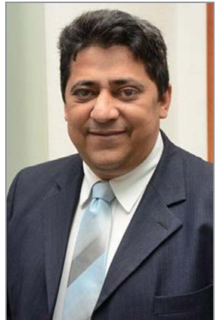
Medeiros é nome definido pelo partido