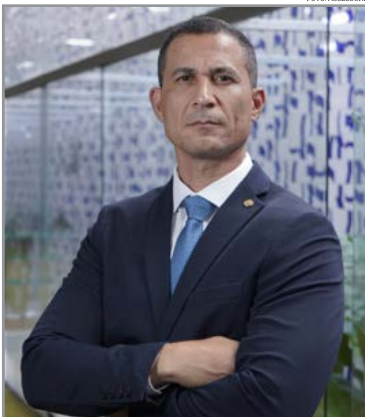
Deputado quer apoiar Flávio Bolsonaro