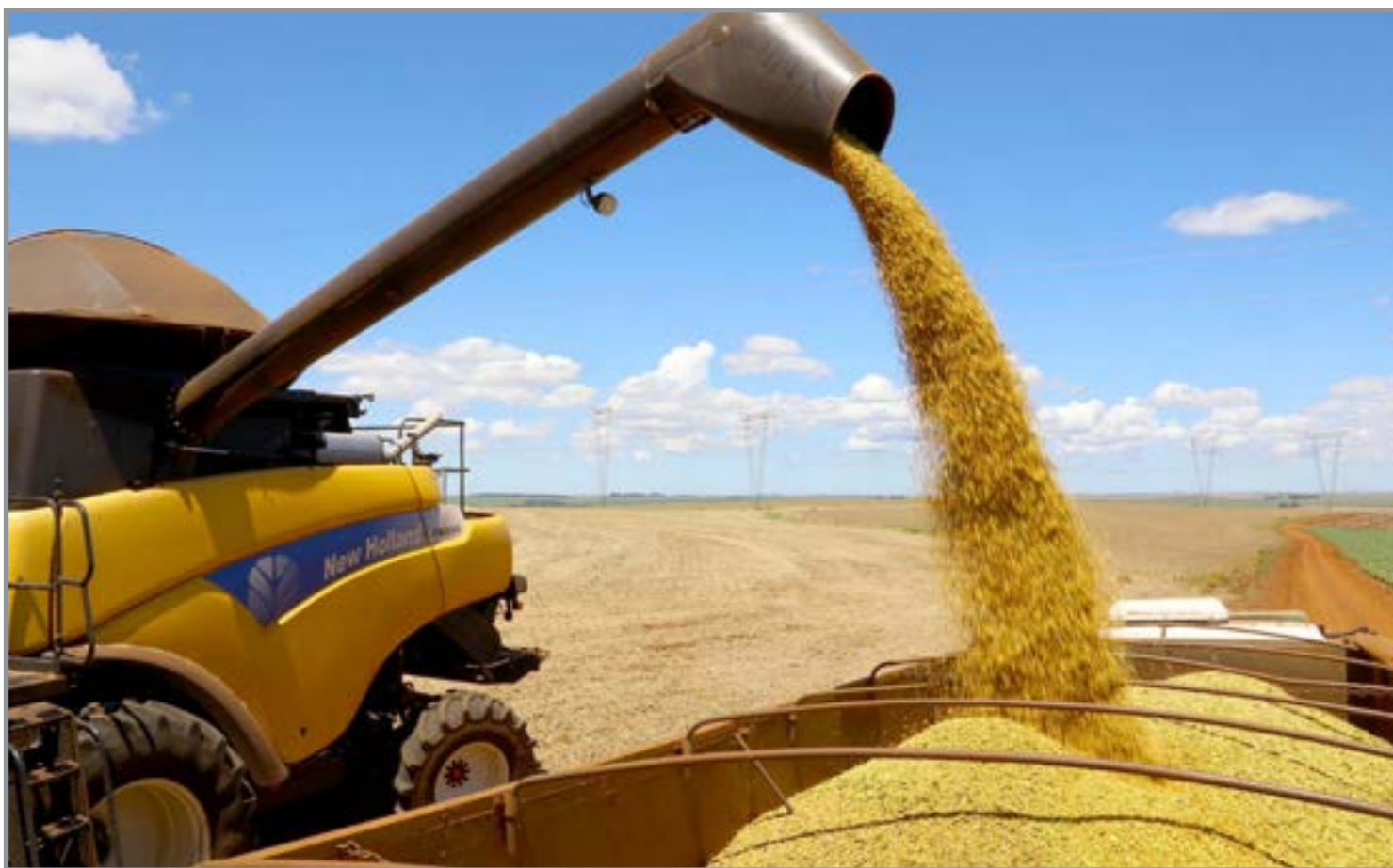
Desempenho foi puxado principalmente pela produção de grãos

Entre os componentes da despesa, o consumo das famílias totalizou R$ 8,1 trilhões, o consumo do governo, R$ 2,4 trilhões, e a formação bruta de capital fixo, R$ 2,1 trilhões. A balança de bens e serviços ficou superavitária em R$ 44,6 bilhões e a variação de estoque foi de R$ 30,2 bilhões.