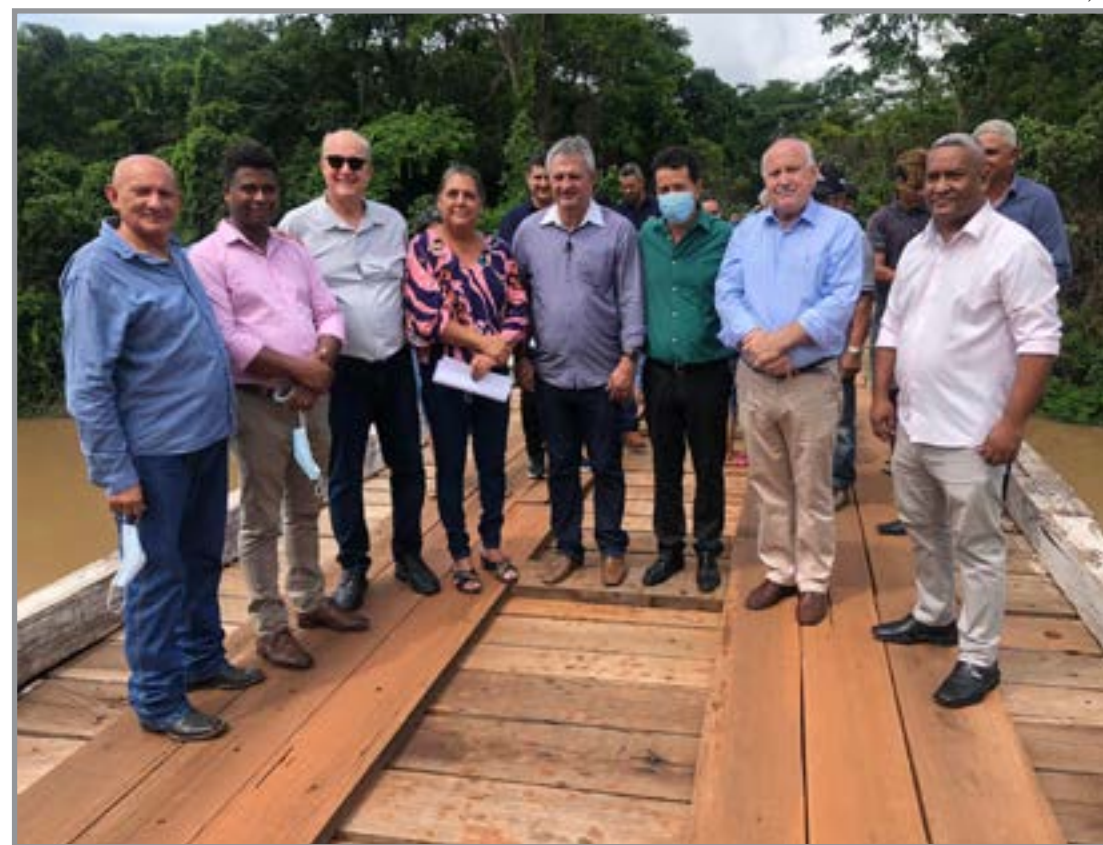
Município é citado como polo de turismo