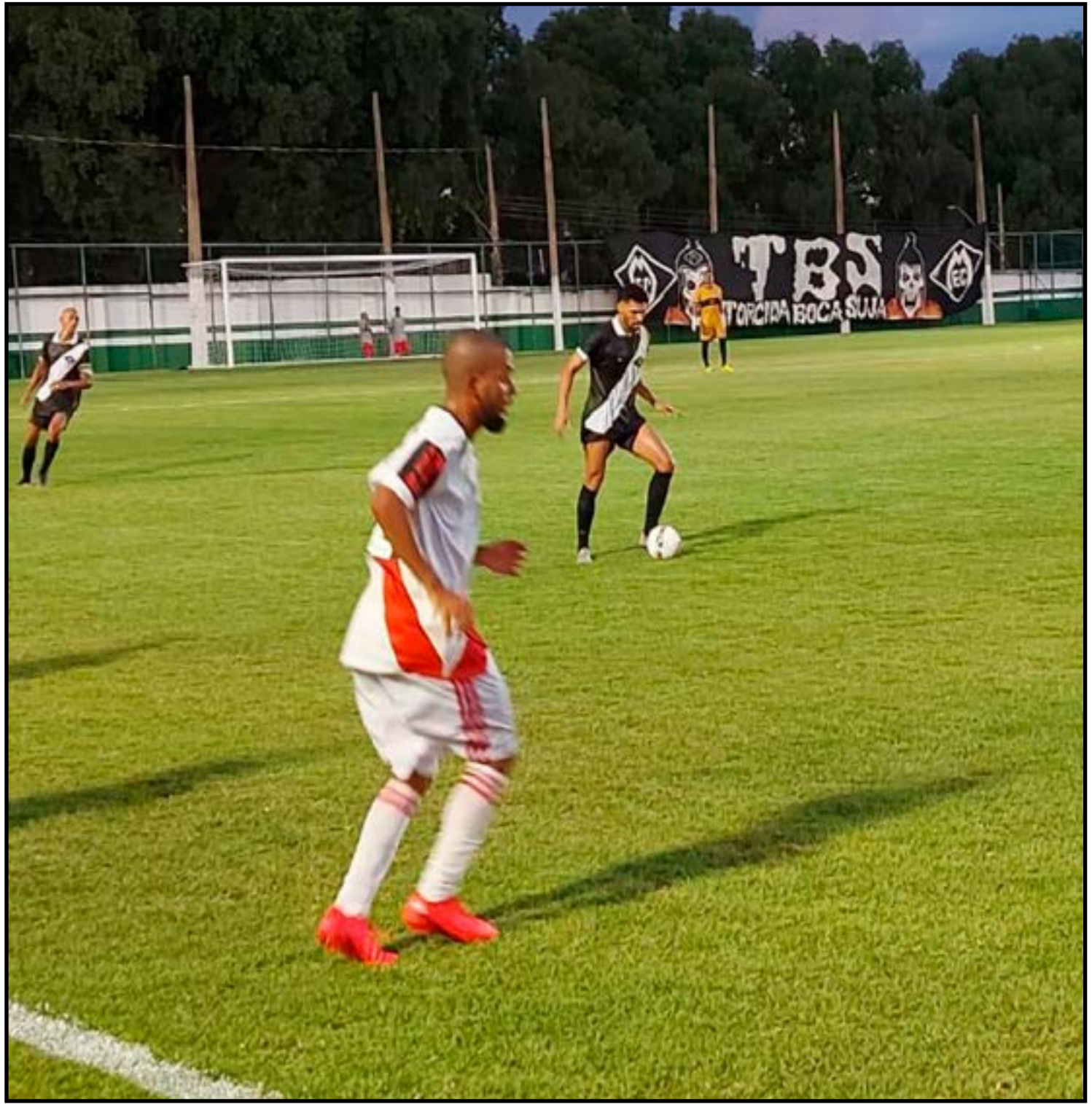
Paulistano jogou Segundona em 2023, mas abandonou o campeonato

Com história centenária no futebol mato-grossense, o Dom Bosco inicia um novo capítulo fora das competições profissionais, apostando em reconstrução administrativa e equilíbrio financeiro para retomar as atividades no estado.