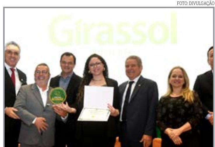
3ª consecutiva na lista das empresas premiadas