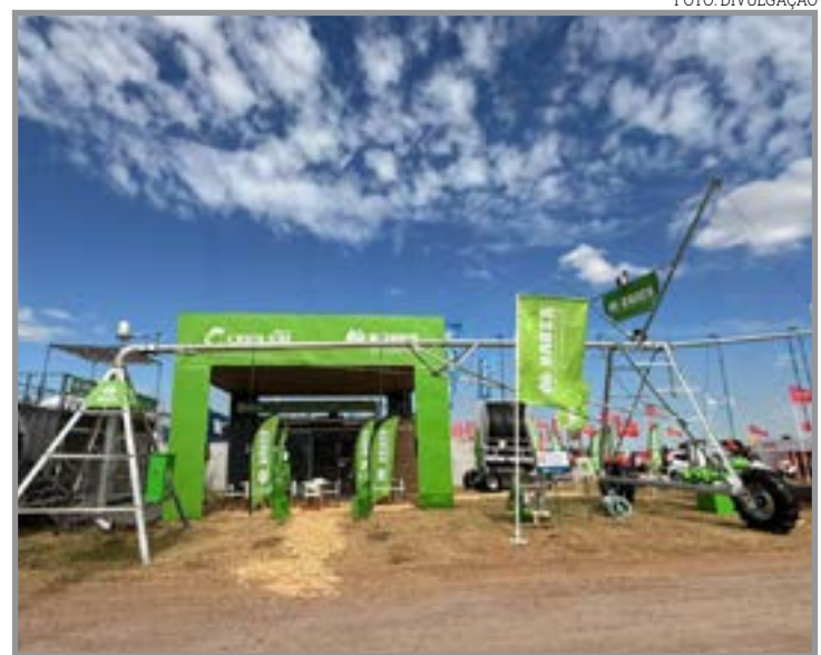
Soluções para sustentabilidade, eficiência produtiva e conectividade no agro

O equipamento também pode ser integrado à tecnologia da Irricontrol, reforçando o compromisso da empresa com a produtividade sustentável e o uso consciente da água. Mais um destaque da linha é o eco ProRain, sistema de irrigação por carretel que oferece gestão avançada da irrigação, facilidade operacional e rápido