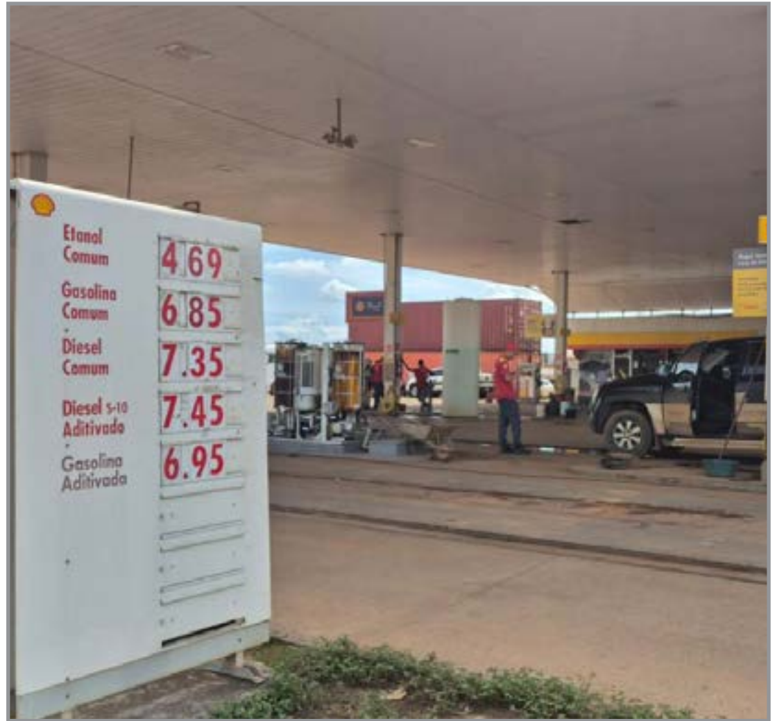
Ex-alunos participam de palestras sobre o protagonismo feminino

“Nós criamos dois novos tipos para caracterizar a abusividade do distribuidor, tanto no caso de um armazenamento de combustível injustificado, quanto do aumento abusivo do preço que passa a ser fiscalizado pela ANP a partir de critérios ob-