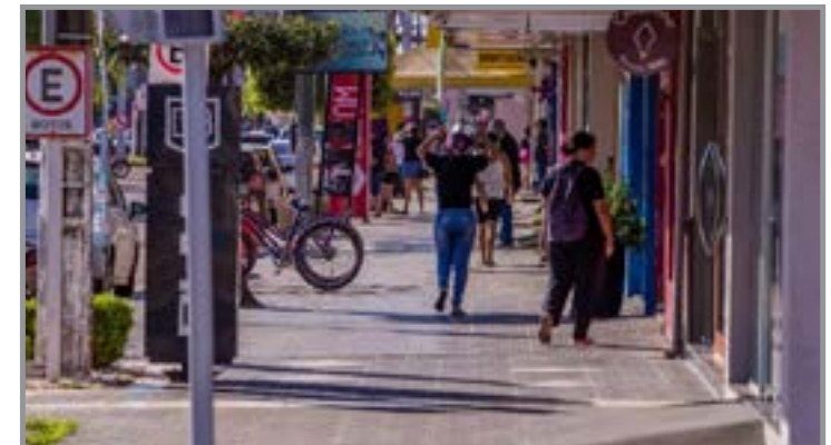
Normas ampliam garantias de informação, atendimento e proteção ao consumidor