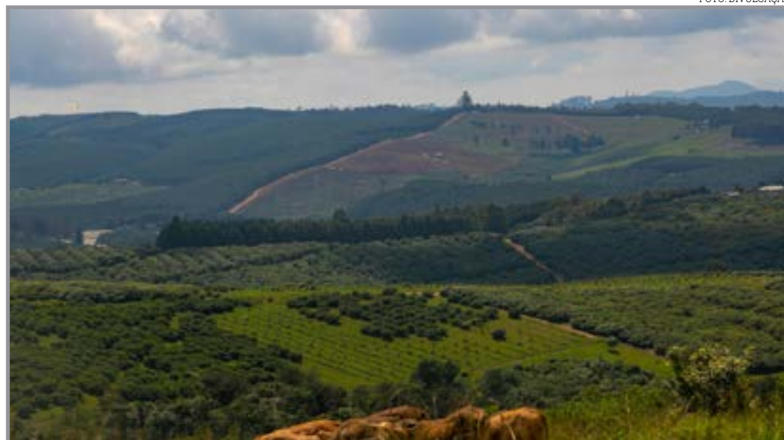
Lei protege quem exerce a atividade produtiva na área

Da mesma forma, é imprescindível que o produtor mantenha arquivados todos os comprovantes de investimentos realizados na propriedade, como melhorias estruturais, correção de solo e implantação de culturas perenes. "Esses documentos servirão como prova em eventual pleito indenizatório, pois demonstram o valor agregado ao imóvel e os investimentos realizados de boa-fé pelo arrendatário", destaca o especialista.