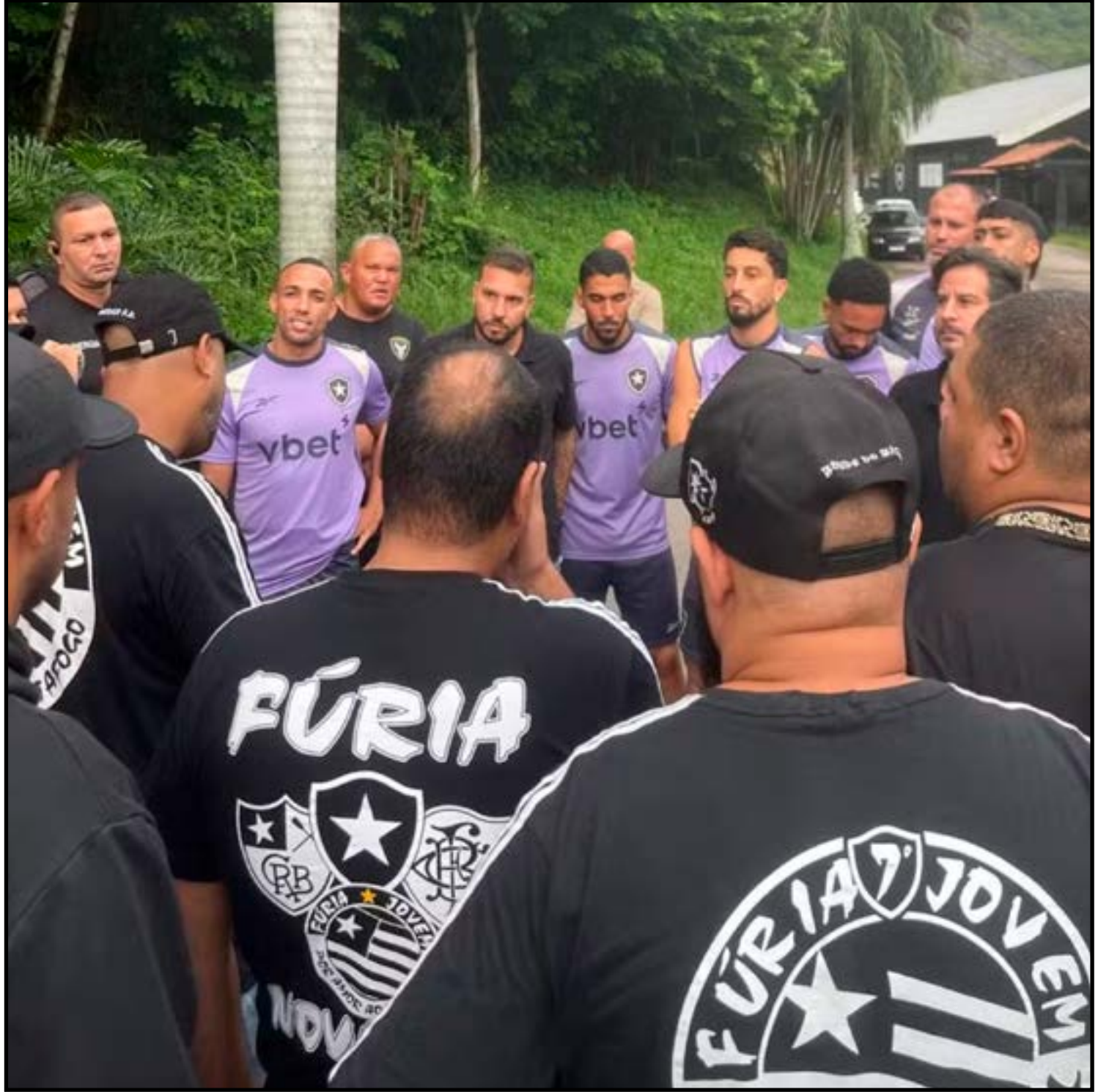
Organizada do Botafogo vai ao Espaço Lonier para cobrar jogadores e diretores

Nesse caso, o artigo 5.8 afirma que deve ser imposta uma multa de pelo menos US$ 15 mil (R$ 78,4 mil) e, em caso de segunda infração e infrações subsequentes, será imposta uma multa de US$ 20 mil (R$ 104,6 mil). O Botafogo tem até o dia 18 de março para apresentar argumentos e se defender. Procurado pela reportagem, o clube optou por não se manifestar.