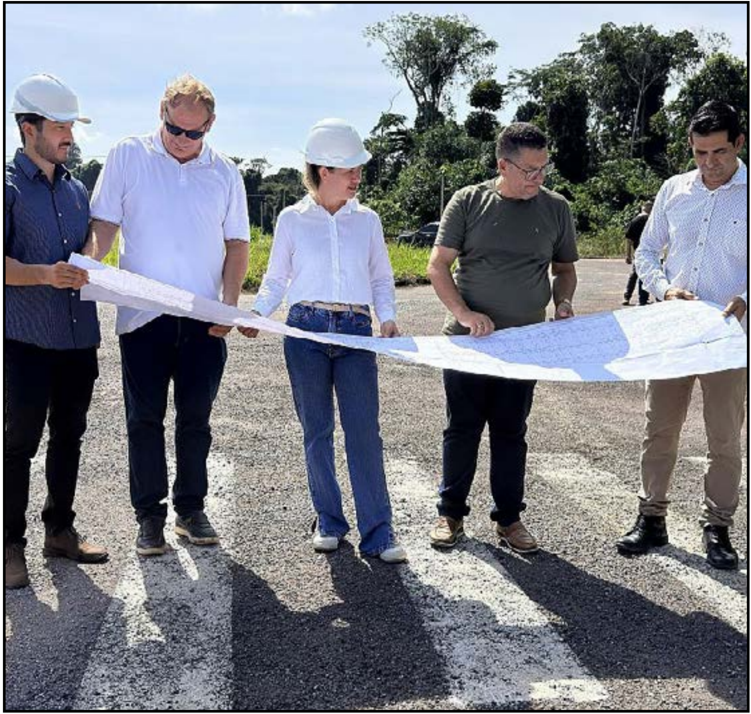
Loteamentos entregues nos últimos 4 anos

As próximas visitas in loco dos vereadores serão definidas por calendário que está em fase de elaboração pela empresa de engenharia.