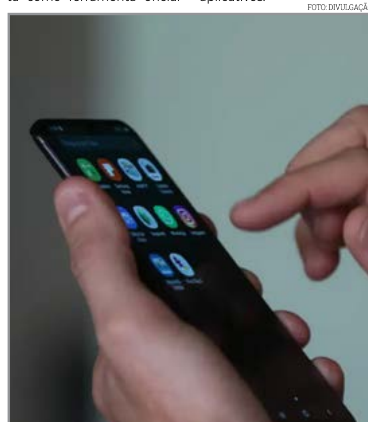
Programa malicioso rouba dados bancários de usuários

tiva, estão o Código de Ética e Conduta, políticas internas de Anticorrupção, Compliance, Conflito de Interesses, Comitê de Integridade, Canal de Denúncias e treinamentos internos que fortalecem O Jeito de Ser Girassol.