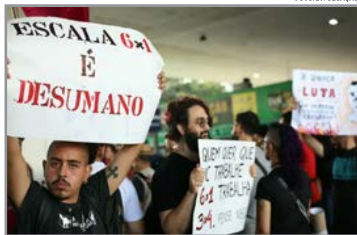
Levantamento foi feito pela Nexus - Pesquisa e Inteligência de Dados

Já 35% dos brasileiros entre 25 e 40 anos (millennials) são totalmente favoráveis ao fim do 6x1, independentemente de isso impactar ou não o pagamento dos trabalhadores. Segundo os dados, 42% são favoráveis se a medida aprovada não implicar redução salarial. Há ainda 5% que se dizem favoráveis, mas ainda sem ter opinião formada sobre a condicionan-