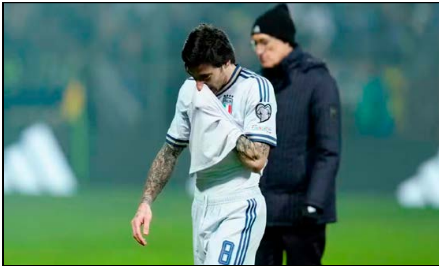
Sandro Tonali chora a eliminação da Itália

Na atual edição do principal torneio europeu, nenhuma equipe italiana chegou às quartas de final: o último campeão da Itália foi a Inter de Milão, em 2010. A Inter, o Milan, a Juventus, e até outras equipes locais contavam com grandes estrelas do futebol. Hoje, ocupam um papel totalmente secundário no mercado euro-