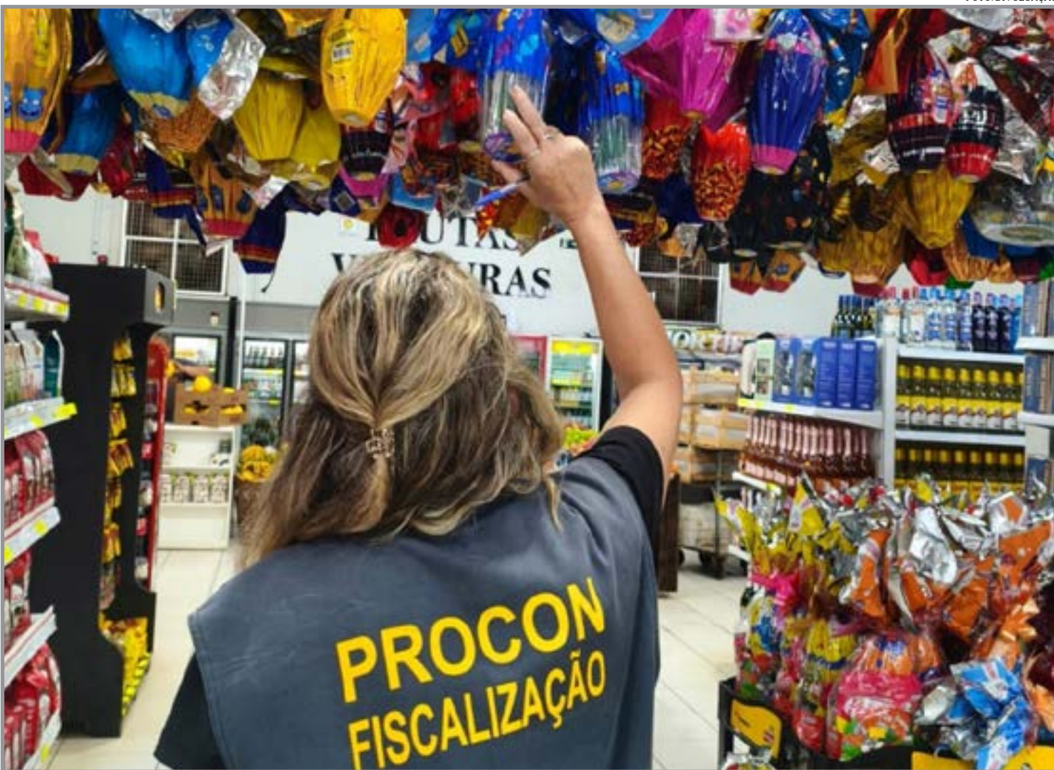
Consumidores devem estar atentos para que as surpresas sejam somente agradáveis