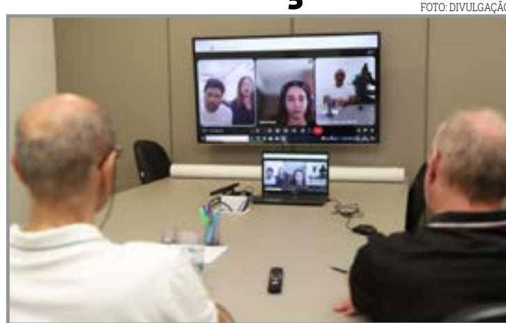
Encontro será no dia 14, às 19h, na Câmara

pular é uma das etapas previstas no processo de elaboração do plano. As definições sobre a realização da audiência foram alinhadas em reunião técnica realizada na Secretaria da Cidade. O Plano Municipal de Habitação estabelece diretrizes para o ordenamento da expansão urbana, definição de áreas para moradia e ampliação do acesso à infraestrutura básica, como saneamento, abastecimento de água, energia elétrica e serviços públicos essenciais. A elaboração conta com assessoria técnica da Geoline Engenharia.