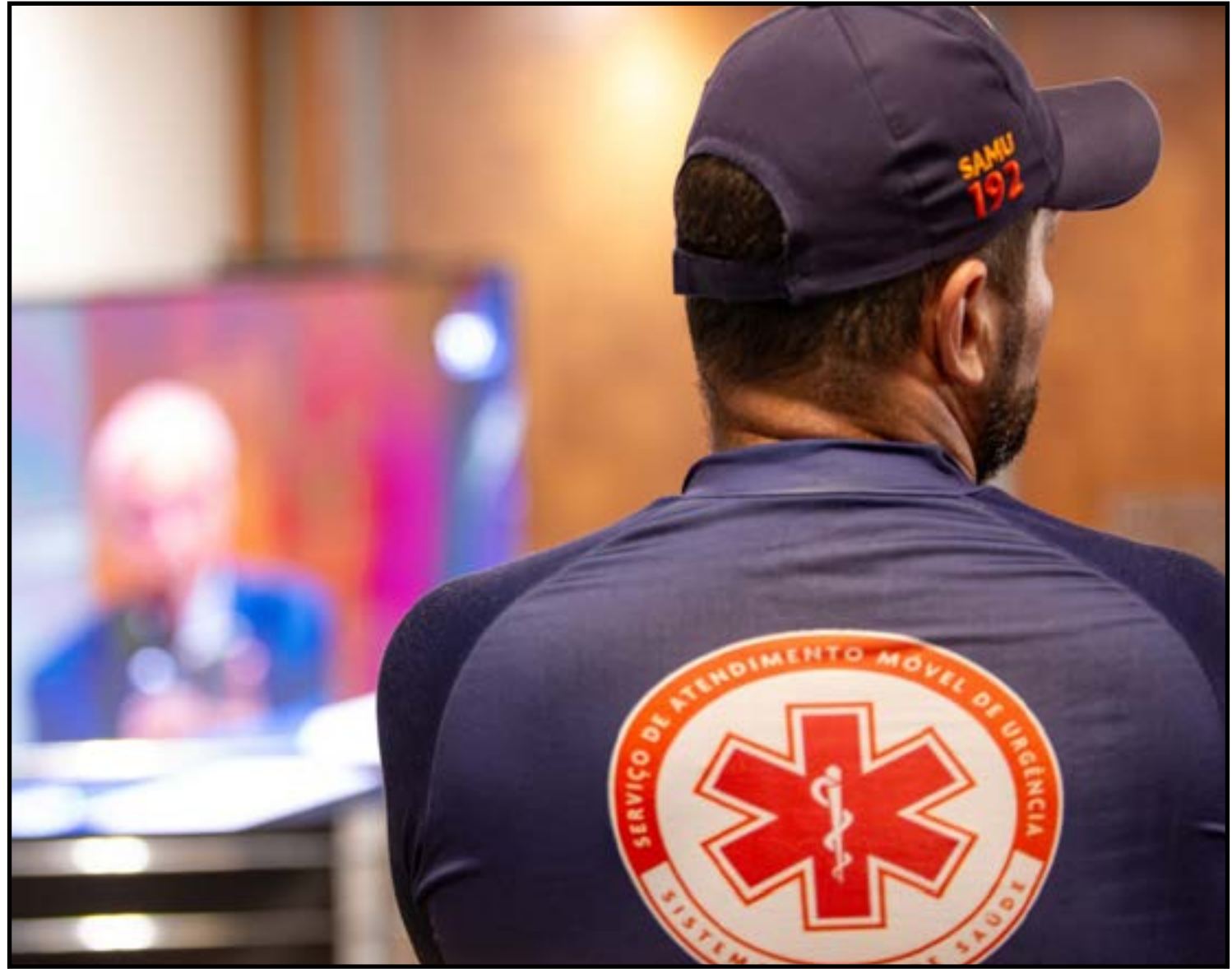
Secretários de estado serão convidados para o debate.