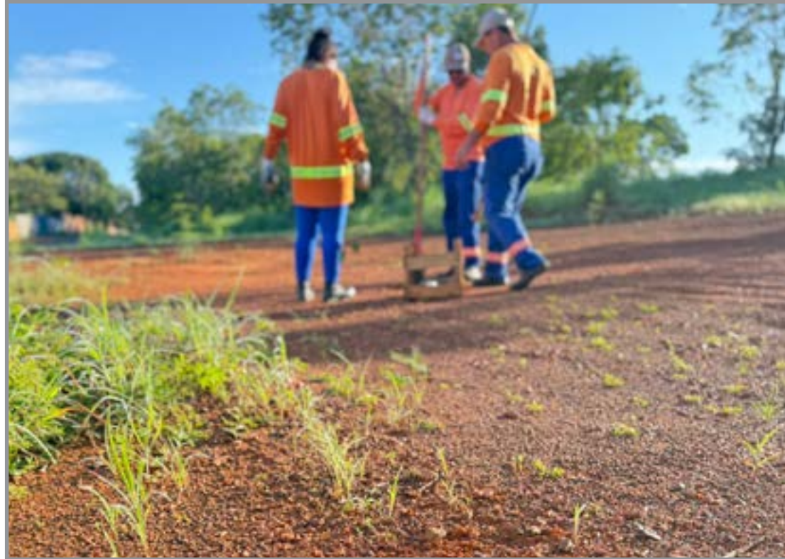
Prefeitura de Nova Xavantina atua nessa importante missão

Esse evento contou com diversos grupos de voluntários e parceiros como UNEMAT, Rede de Frente - Conselho da Mulher, Lions, Clube de Desbravadores da Igreja Adventista, APAE, Secretarias de Infraestrutura, Assistência Social, Segurança pública, Agricultura Familiar e Educação, dentre outros,