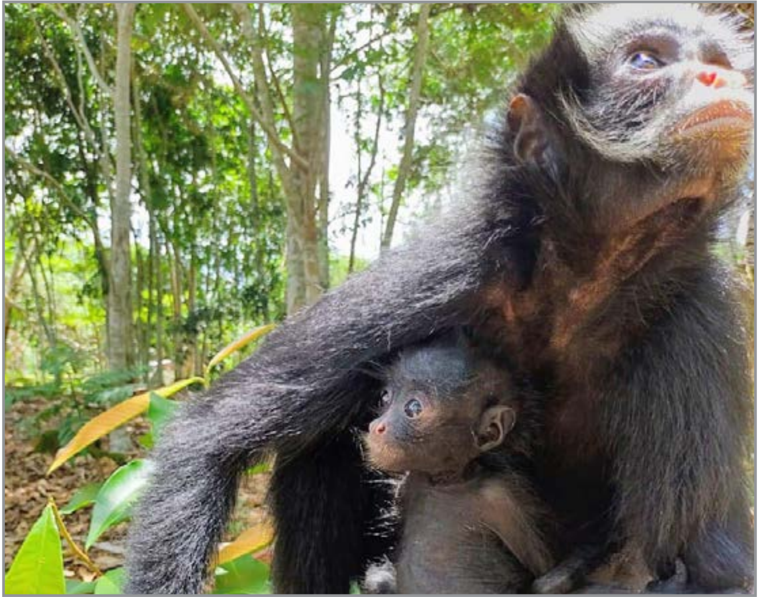
Macacos vão para zoológico em São Paulo

Antes da viagem, os animais passaram por exames. O transporte será feito em voo da Latam Solidário, com embarque em Cuiabá e apoio logístico terrestre da SEMA. No destino, o trio passará por quarentena, fase de aproximação e integração gradual, em processo que deve durar de quatro a cinco meses.