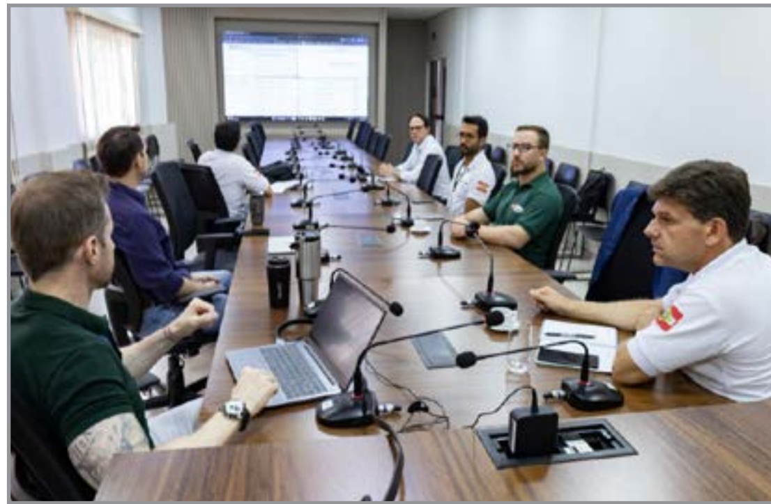
Equipe veio trocar experiências ambientais

Lançado em Mato Grosso em junho do ano passado, o CAR Digital 2.0 ampliou em mais de 100% o número de análise e validações do Cadastro Ambiental Rural. O órgão ambiental mato-gros-