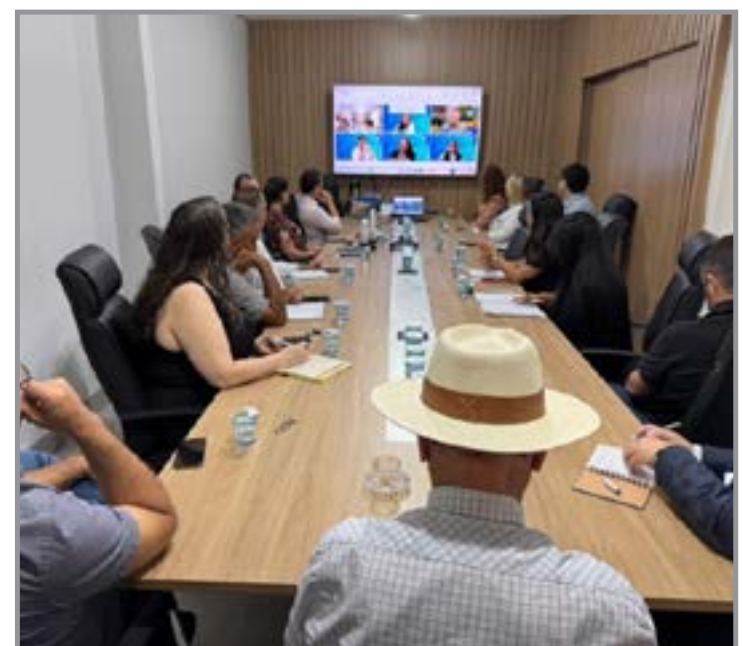
Reunião atualiza status de projetos e define próximos passos