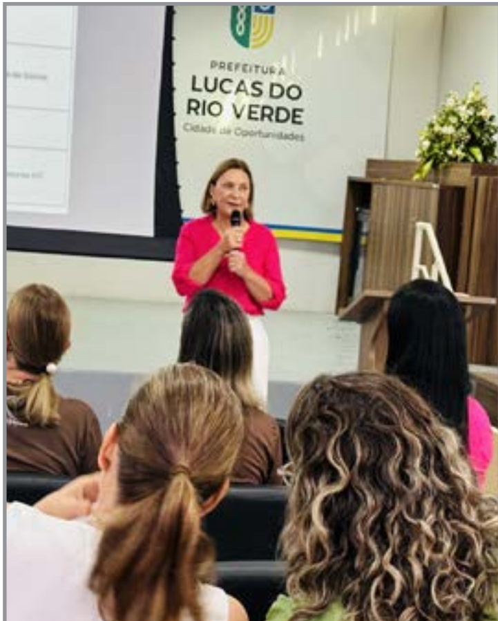
Atividades levaram informação, apoio e combate à violência durante todo o mês

Nos CRAS, foram realizadas oficinas sobre sexualidade, saúde íntima e autoestima, além de atividades com crianças, adolescentes e famílias, abordando direitos das mulheres e autonomia. Também houve práticas coletivas, como aulas de yoga, voltadas ao bem-estar das participantes.