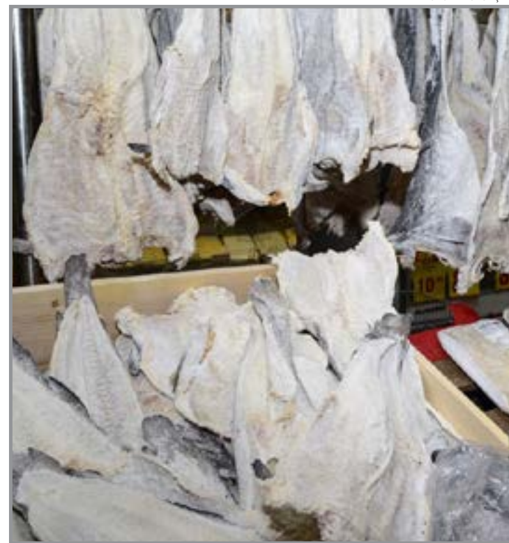
Recuo contrasta com a inflação geral do período