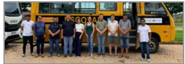
Destaque para parceria com o Estado