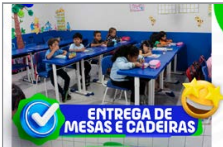
Material entregue em duas unidades

A iniciativa integra o conjunto de melhorias realizadas na rede municipal de ensino, com foco em oferecer uma educação mais eficiente e acolhedora.