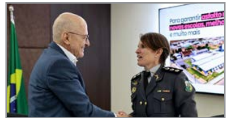
Nomeação histórica marca 1ª mulher à frente da Segurança Pública no estado

Além da formação operacional, a nova secretária também possui qualificação em gestão de alto comando, o que reforça o perfil técnico para conduzir uma das áreas mais sensíveis da administração estadual.