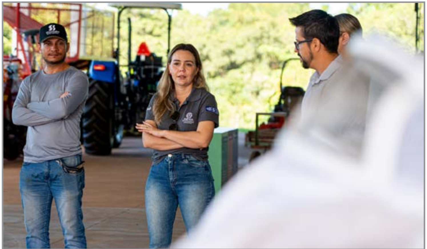
Iniciativa fruto de parcerias

Por meio de iniciativas como essa, a gestão reafirma seu compromisso com o