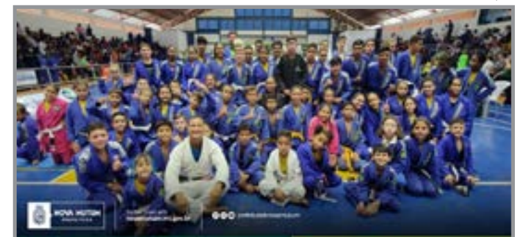
Inscrições para projeto esportivo seguem até 24 de abril