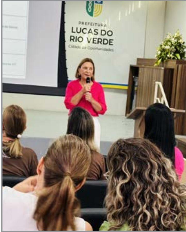
Atividades levaram informação, apoio e combate à violência durante todo o mês

Nos CRAS, foram realizadas oficinas sobre sexualidade, saúde íntima e autoestima, além de atividades com crianças, adolescentes e famílias, abordando direitos das mulheres e autonomia. Também houve práticas coletivas, como aulas de yoga, voltadas ao bem-estar das participantes.