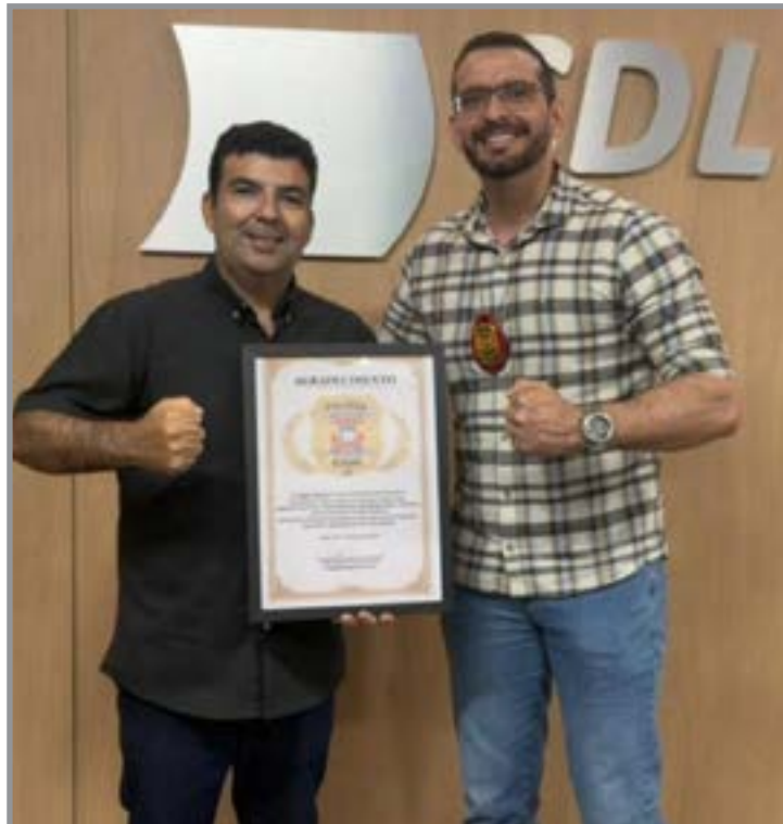
Documento foi entregue pelo delegado regional de Sinop