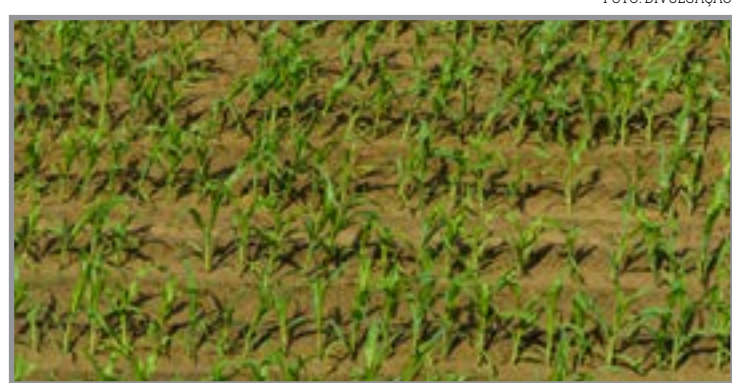
Maioria das lavouras do país já está implantada

Do ponto de vista técnico, o especialista ressalta que o sucesso da safra está diretamente condicionado à eficiência na operação de implantação, especialmente diante da restrição temporal da janela de semeadura da