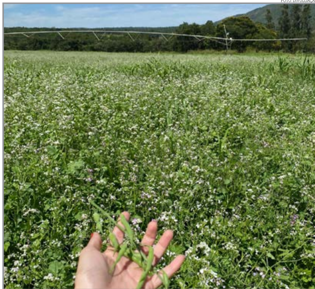
Forrageiras passam a ser estratégicas no manejo

Com a janela da safrinha mais curta, o sistema de produção deixa de depender exclusivamente da implantação de uma segunda cultura com alto potencial produtivo e passa a valorizar práticas que garantem a construção de solo e a estabilidade ao