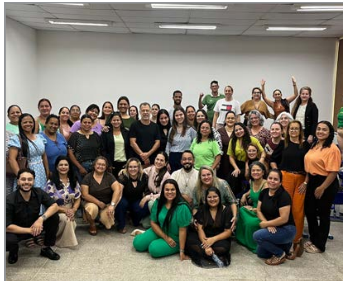
Capacitação integra política de formação continuada dos conselheiros

A participação das representantes de Santa Carmem reforça o compromisso da administração municipal