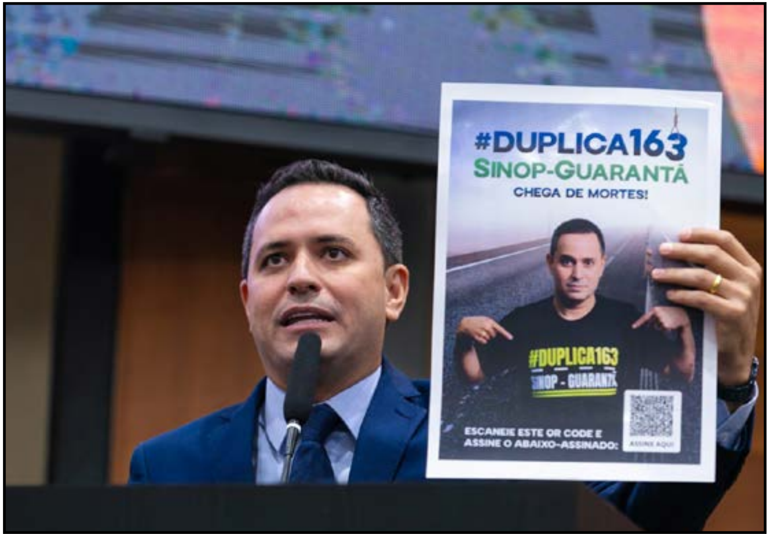
Duplicação é considerada urgente para reduzir o número de acidentes fatais

As contribuições levantadas na audiência devem subsidiar a análise do edital de concessão por órgãos de controle e auxiliar na definição de investimentos para a BR-163 nas próximas décadas.