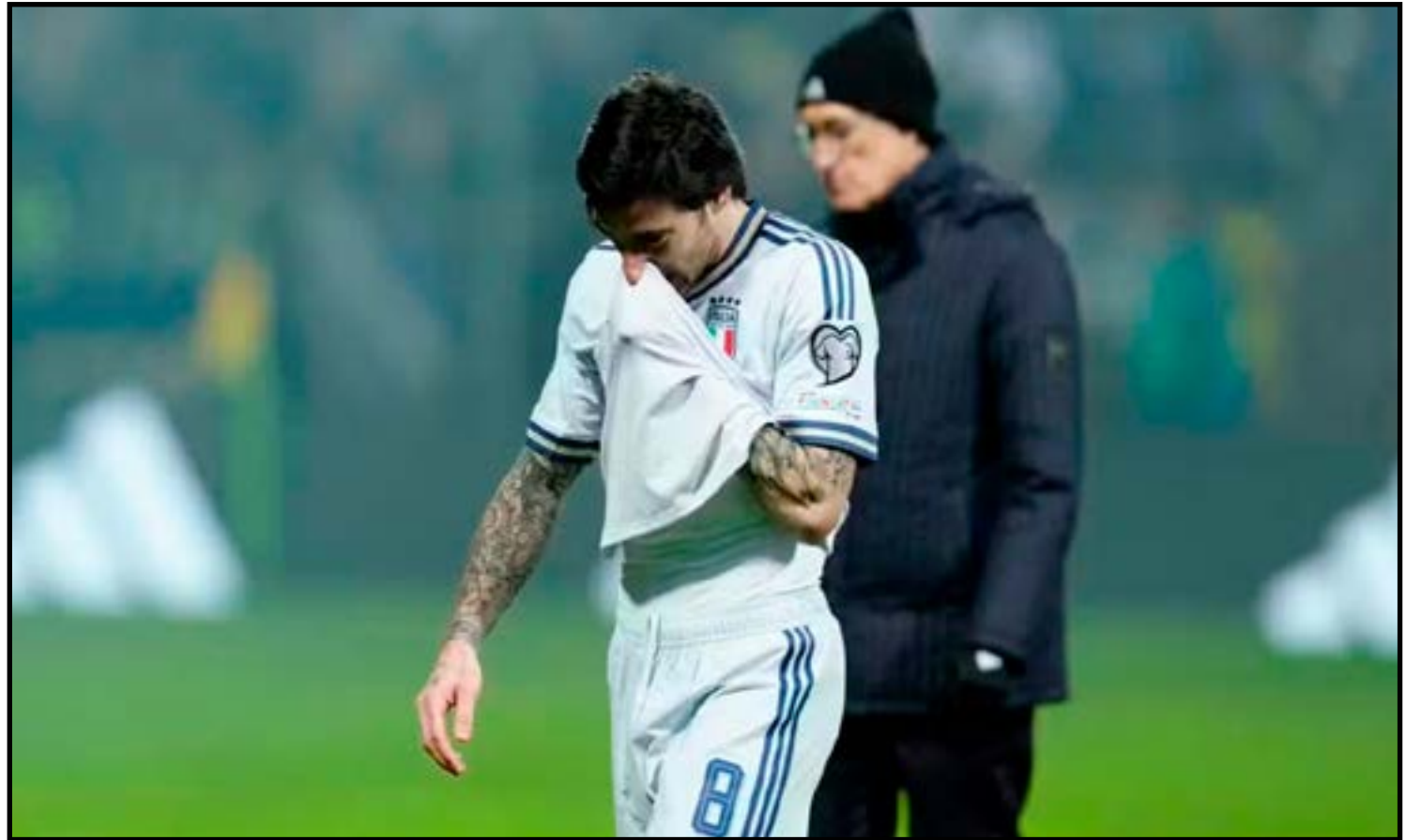
Sandro Tonali chora a eliminação da Itália

Na atual edição do principal torneio europeu, nenhuma equipe italiana chegou às quartas de final: o último campeão da Itália foi a Inter de Milão, em 2010. A Inter, o Milan, a Juventus, e até outras equipes locais contavam com grandes estrelas do futebol. Hoje, ocupam um papel totalmente secundário no mercado euro-