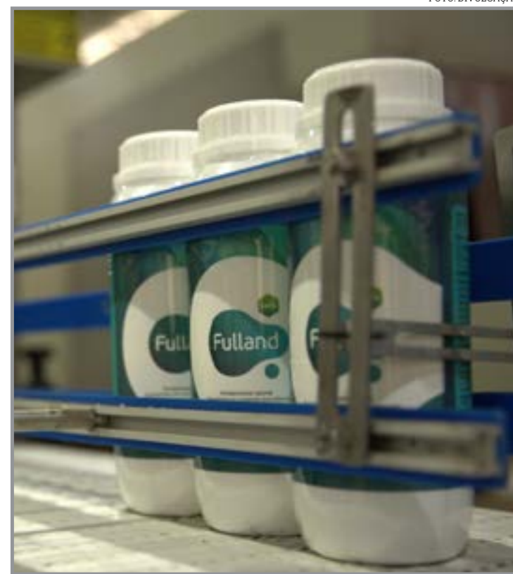
Redução da dependência de produtos importados

"Pesquisas são essenciais para descobertas de novos microrganismos que serão capazes de exercer papel na redução do uso de fertilizantes, contribuindo para nutrição de plantas de maneira eficaz, reduzindo custos para os produtores rurais", complementa.