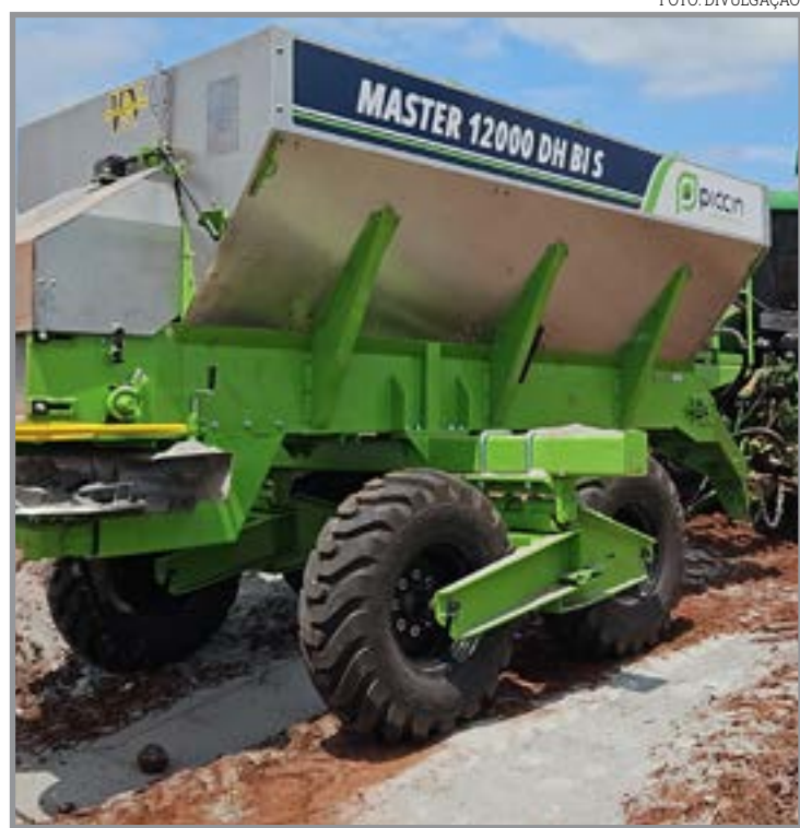
Soluções serão apresentadas ao público goiano durante o evento

Para ele, a Tecnoshow é uma oportunidade para se aproximar mais de um produtor com perfil altamente tecnificado, que trabalha com escala e exige máquinas confiáveis, produtivas e preparadas para longas jornadas. "Queremos mostrar como essas soluções podem contribuir para aumentar de fato a eficiência no campo", pontua o profissional.