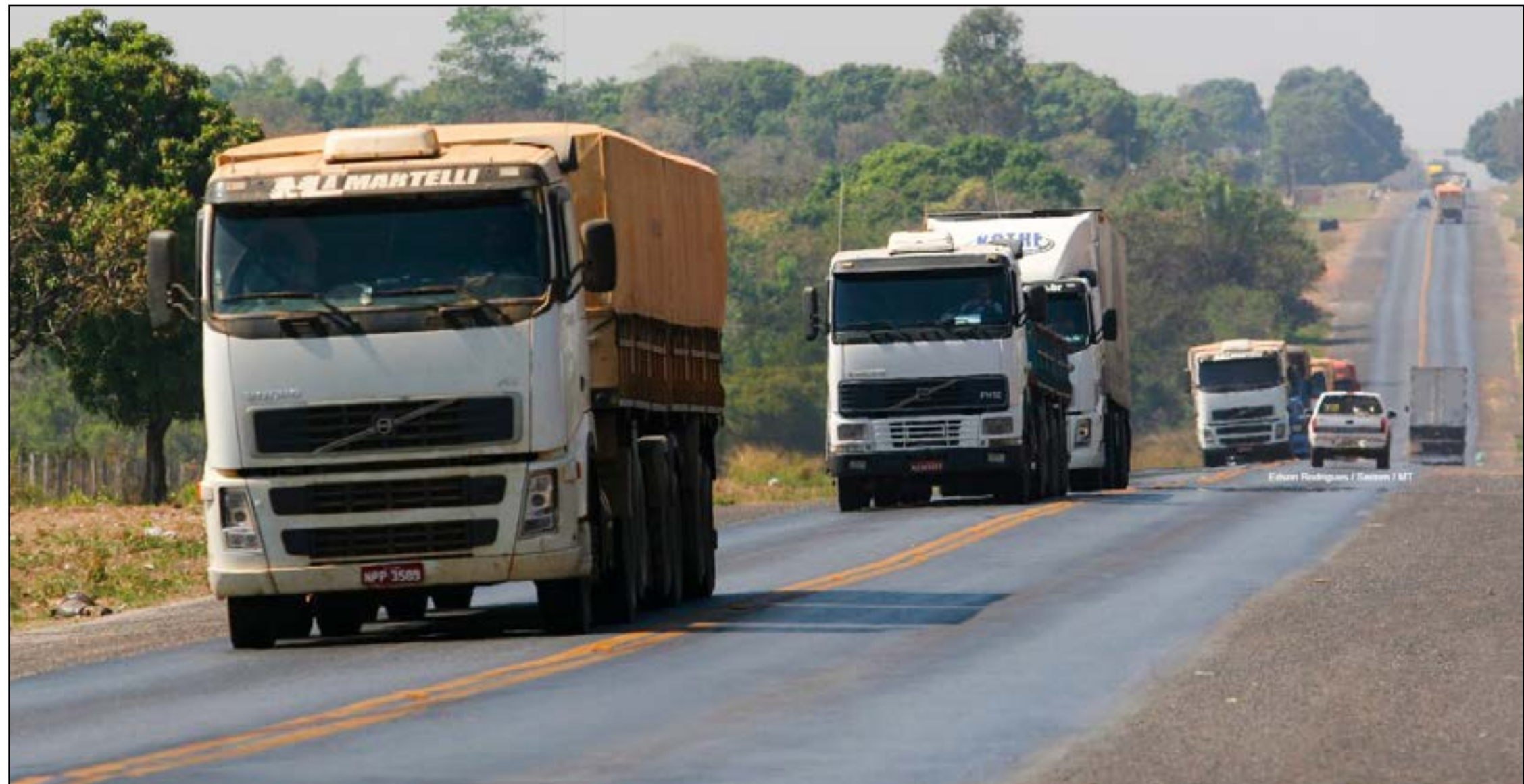
Felipe Rodrigues / Imagem / MT