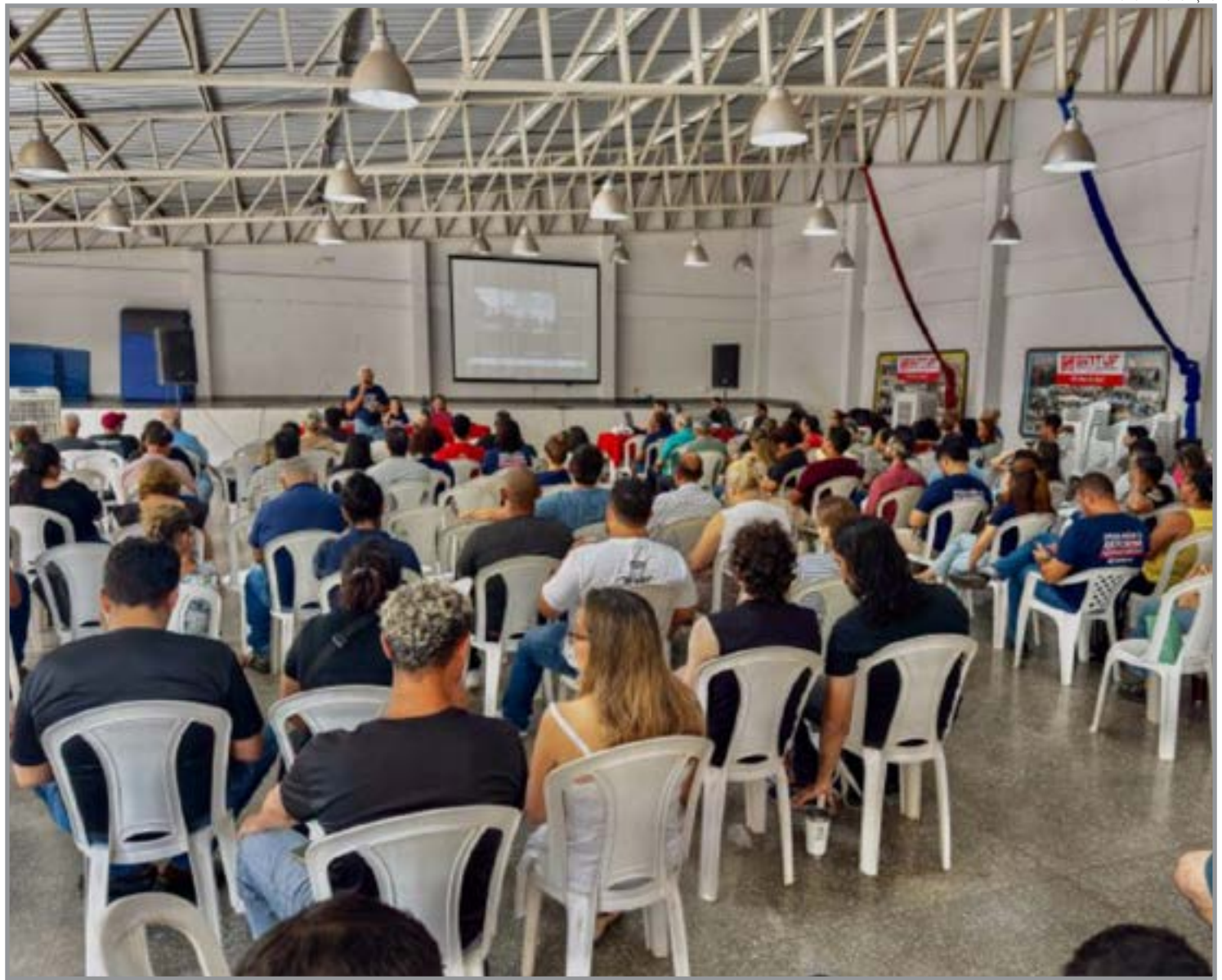
Hoje, cerca de 50% da categoria está paralisada em diferentes regiões do país

Os nomes dos membros serão ratificados em assembleia no dia 13, mesma data do início da paralisação. A primeira atividade após a assembleia será uma caravana a Brasília, nos dias 15 e 16 de abril. Atualmente, cerca de 50% da categoria está paralisada em diferentes regiões do país, como Minas Gerais, Bahia e Paraná, e ainda não há perspectiva de encerramento do movimento.