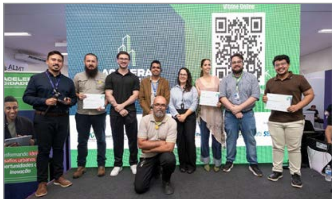
Evento reuniu startups e marcou encerramento de fase no Show Safra

O primeiro lugar ficou com a Re-veste Lucas, seguida por ezhus, Syntra Gestão e Tecnologia, Transformar Orgânico e Agro360°. Também