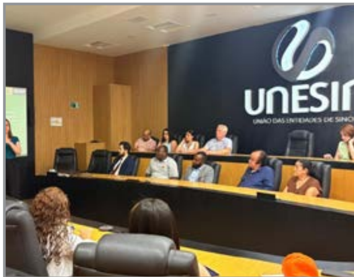
Iniciativa reúne instituições e setor produtivo

Ele reforçou que a proposta busca beneficiar toda a cadeia produtiva. "Nós queremos beneficiar trabalhadores e empregadores. Um