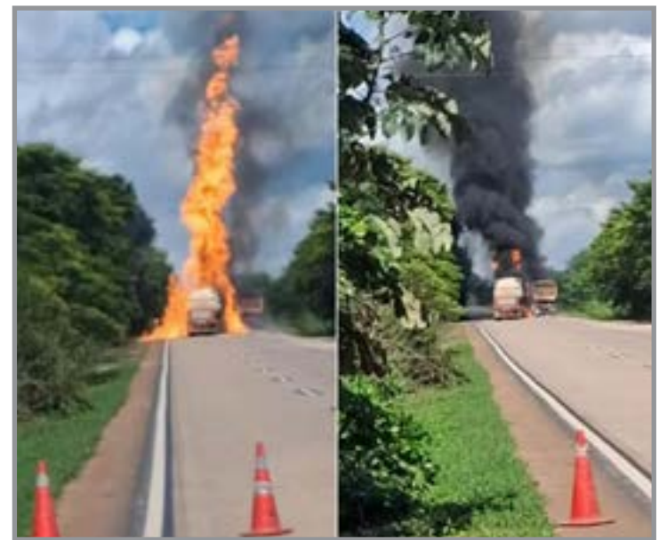
Acidente envolveu dois veículos de carga que passavam pela BR-364

cessionária que administra a estrada, Nova Rota do Oeste, o acidente ocorreu por volta das 13h40, no km 4 da BR. A pista sentido Cuiabá/Rondonópolis foi interditada. Segundo a empresa, as informações iniciais apontam que não há vítimas no local. Até a última atualização desta reportagem, a concessionária não informou a condição dos motoristas envolvidos. Equipamentos do bombeiro também foram acionados e trabalham para combater o fogo.