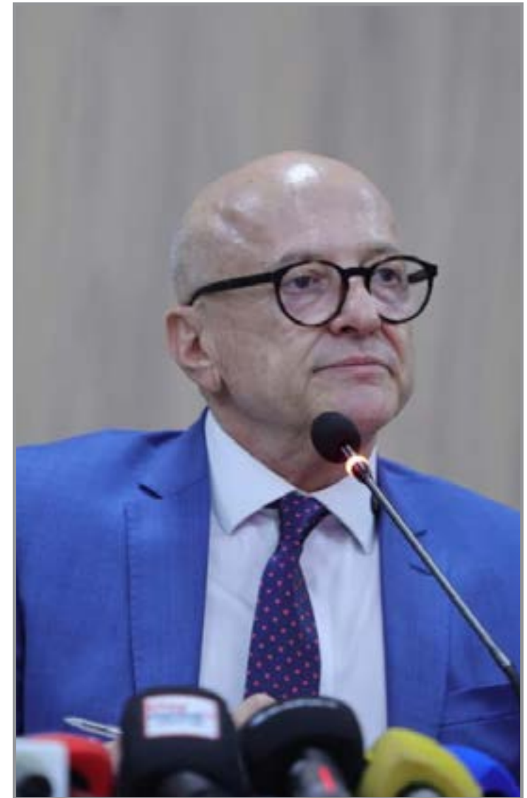
Discurso reforça continuidade da atual gestão