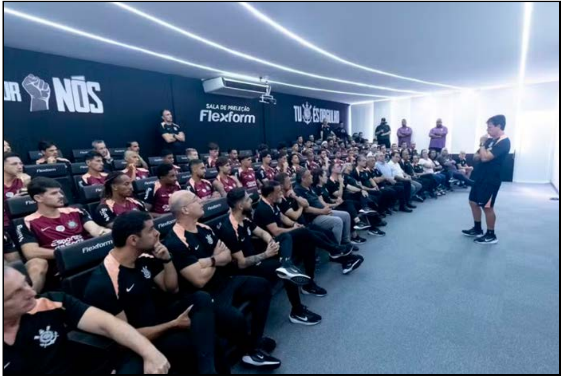
Fernando Diniz em reunião com jogadores e funcionários no CT Joaquim Grava

No bate-papo apenas com os atletas, o novo técnico do Corinthians orientou o grupo a buscar preservação no momento de crise. A equipe não vence há nove jogos, fez apenas cinco gols no período, despencou na tabela do Cam-