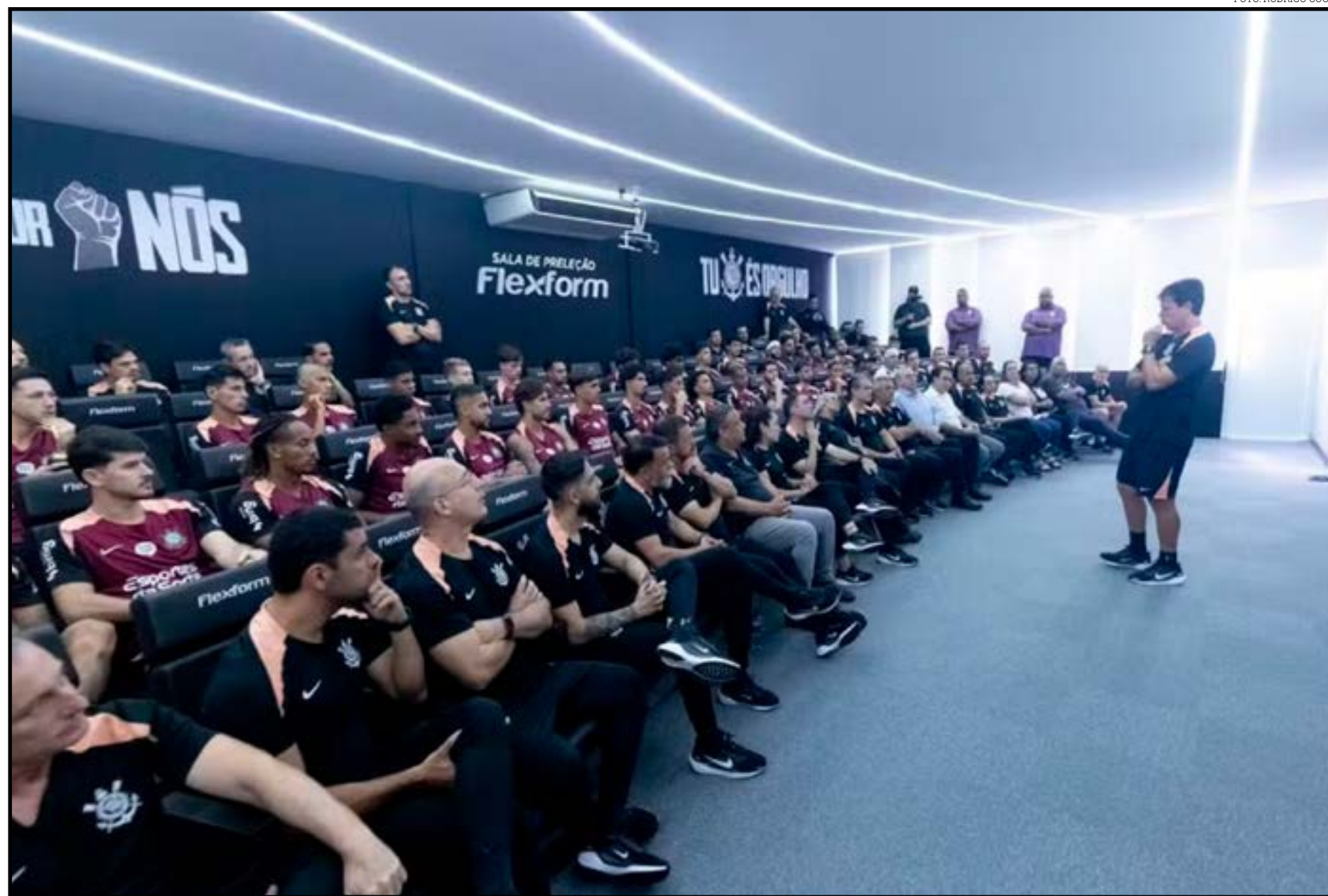
Fernando Diniz em reunião com jogadores e funcionários no CT Joaquim Grava

No bate-papo apenas com os atletas, o novo técnico do Corinthians orientou o grupo a buscar preservação no momento de crise. A equipe não vence há nove jogos, fez apenas cinco gols no período, despencou na tabela do Cam-