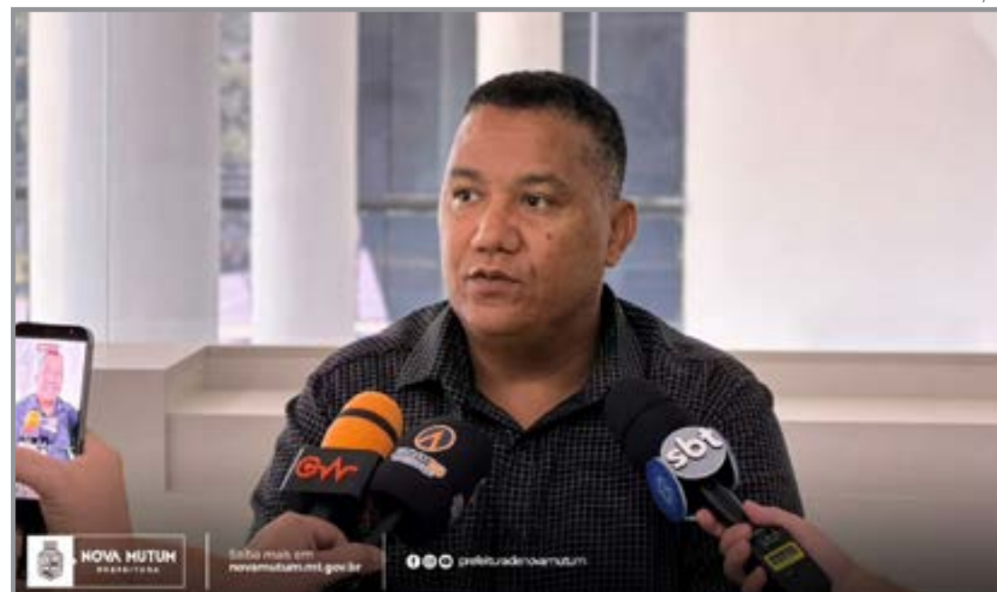
Inscrições ocorrem online entre abril e junho

O cronograma prevê etapas distintas para participação. O agendamento online ocorreu entre os dias 6 e 12 de abril, enquanto o período