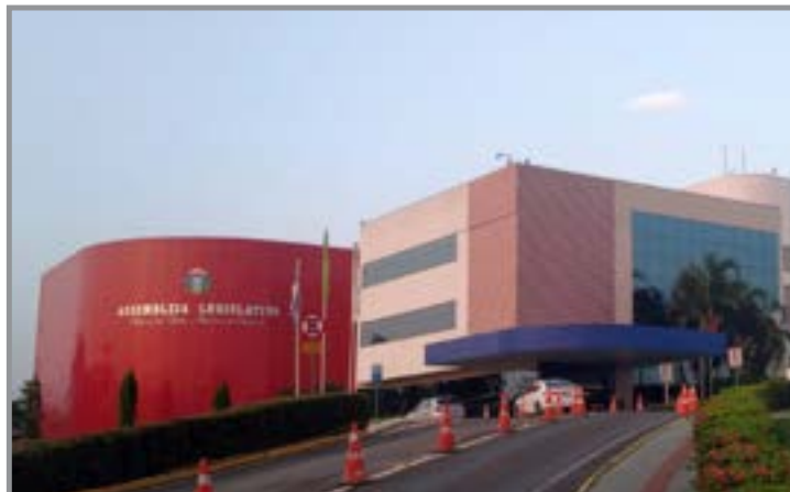
O caso segue em análise e pode gerar novos desdobramentos

O parlamentar também levantou dúvidas sobre a le-