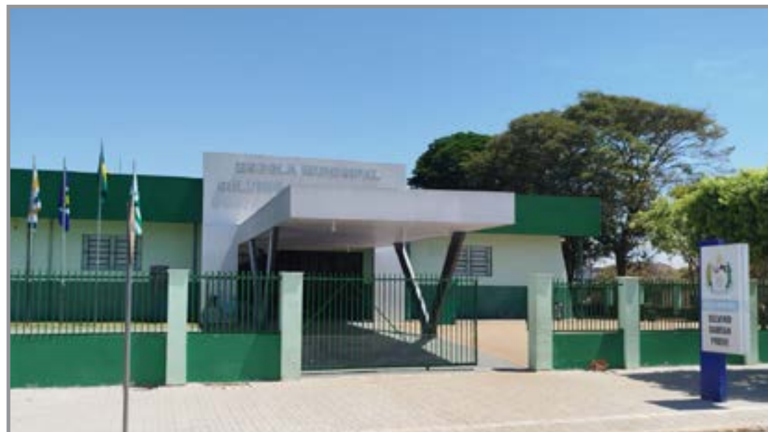
Dados referente ao ano passado

Os números apontam melhora no processo de alfabetização no município, refletindo ações voltadas ao acompanhamento pedagógico e ao desenvolvimento da aprendizagem nos primeiros anos escolares. Especialistas apontam que resultados desse tipo costumam estar associados à combinação de