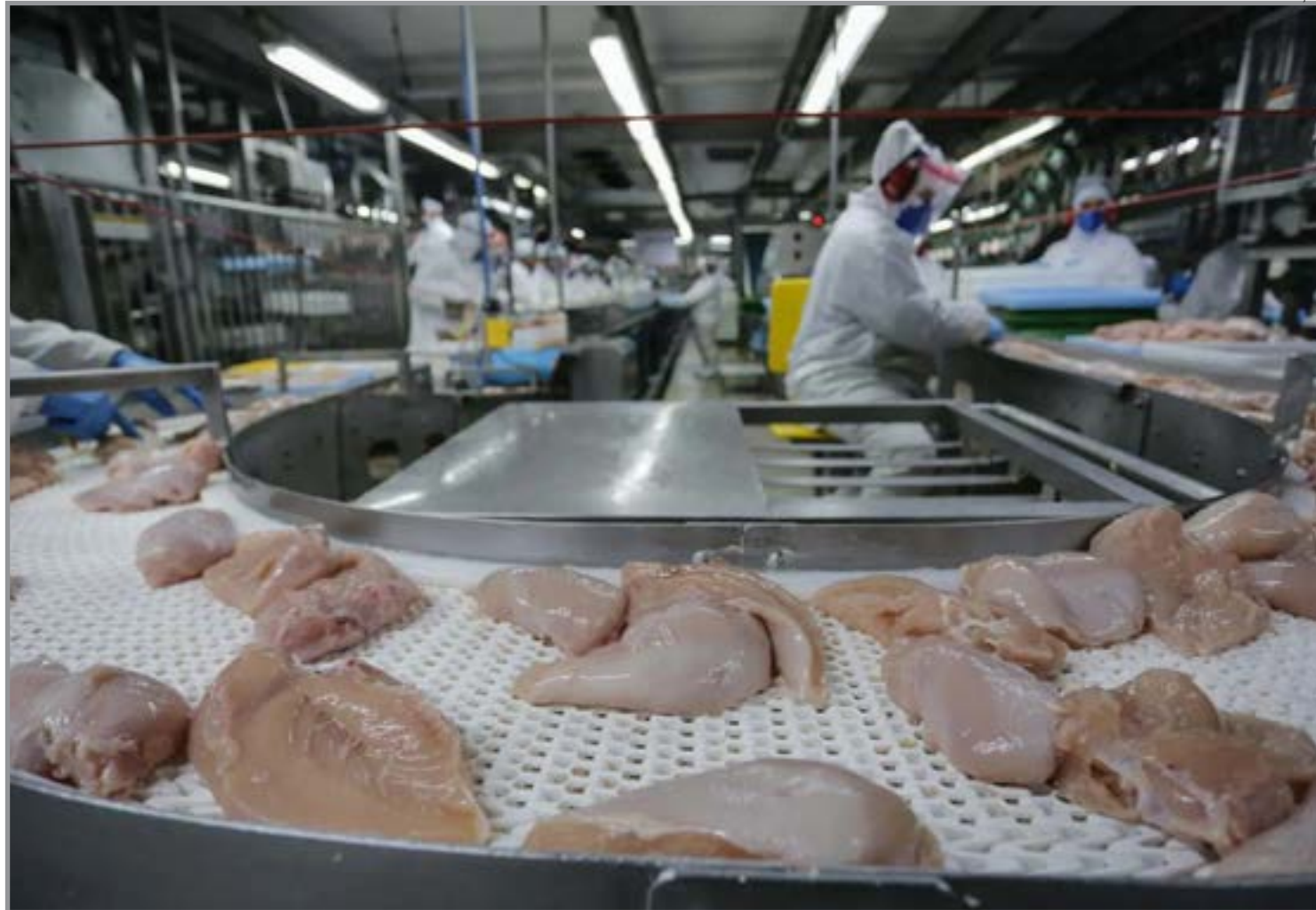
Fluxo comercial ativo mesmo em cenário internacional adverso

O Paraná lidera com ampla margem, seguido por Santa Catarina e Rio Grande do Sul, consolidando a força da região na produção e no