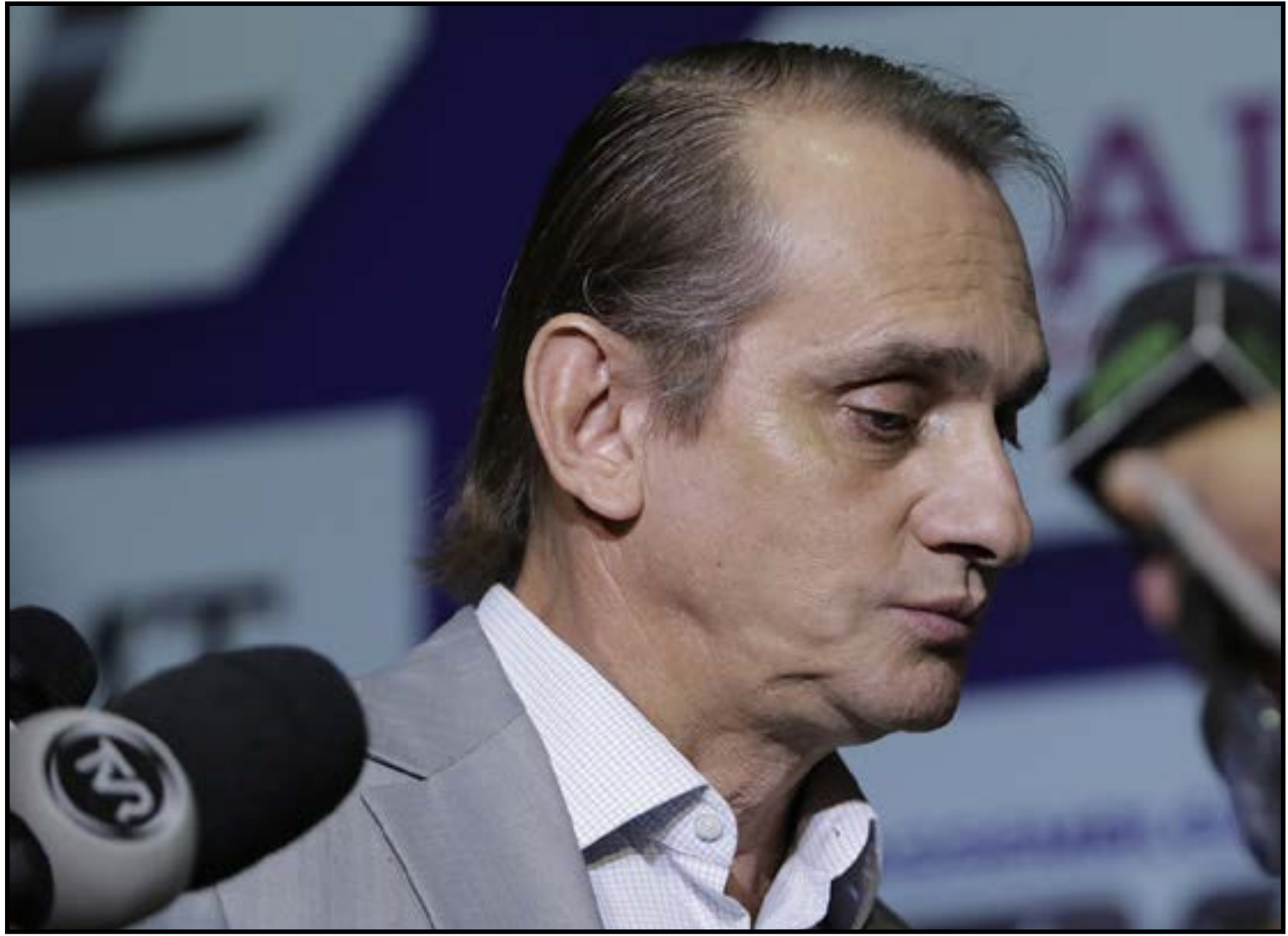
Medida busca valorização e melhoria das condições de trabalho

O projeto também prevê que a implementação respeite as normas de res-