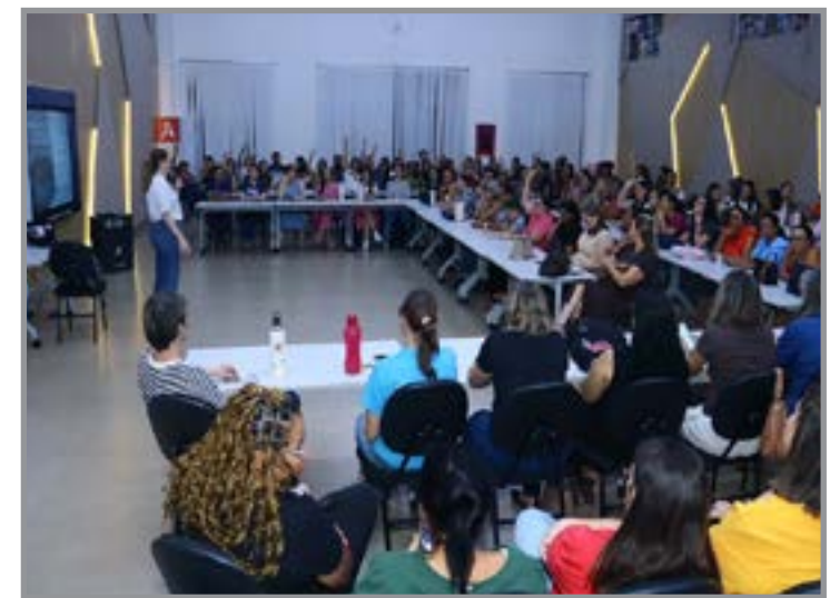
Ensinando educação financeira

CRUELDADE CONTRA ANIMAIS? É CRIME E DÁ CADEIA!