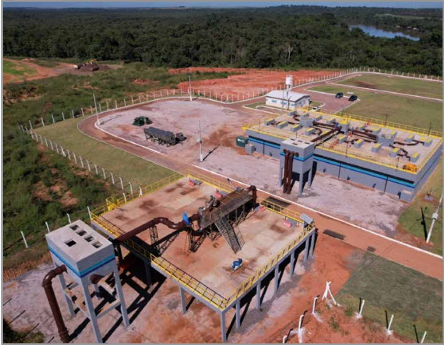
Equipe da Ager vistoria na Estação de Tratamento Teles Pires

Com o primeiro módulo praticamente concluído, a diretora-presidente reforça que a estação já cumpre etapas fundamentais do tratamento, desde a retirada de resíduos até o lançamento final no corpo receptor, ampliando a segurança ambiental. "Estamos entregando o primeiro módulo... passando por todas as etapas de tratamento até chegar ao corpo receptor", finalizou.