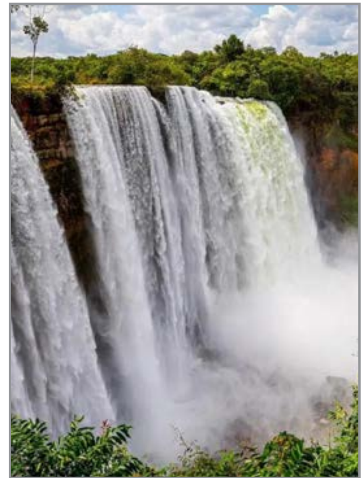
Projeto prevê capacitação e atividades comunitárias