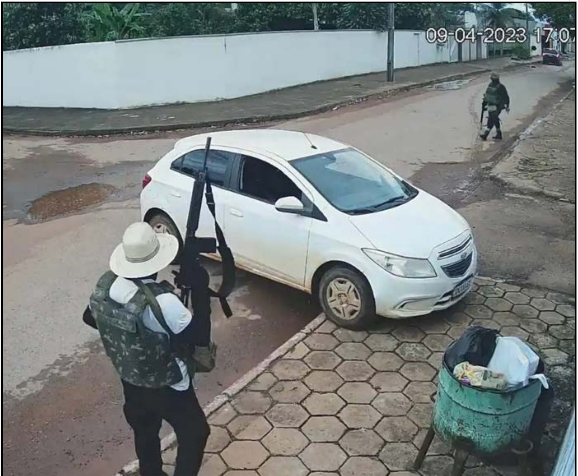
Caso é considerado o maior e mais violento crime patrimonial da história de MT

A época, cerca de 30 criminosos invadiram a cidade, sitiaram a região e chegaram a atacar o quartel da Polícia Militar, que foi incendiado. O grupo contou ainda com o apoio de criminosos experientes em roubos a bancos, no chamado "novo cangaço" e em operações no estilo "domínio de cidades".