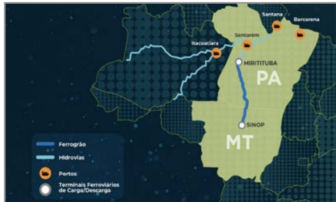
Processo será retomado

O ministro substituto do Tribunal de Contas da União (TCU), Marcos Bemquerer Costa, autorizou o governo federal a retomar os atos preparatórios para a concessão da ferrovia Sinop-Miritituba, conhecida como Ferrogrão. O processo estava suspenso desde março e foi liberado após recursos apresentados pela ANTT e pelo Ministério dos Transportes. Com a decisão, o TCU também determinou a análise do mérito do projeto com prioridade. Apesar do avanço, a ferrovia ainda depende de decisão do Supremo Tribunal Federal (STF), que analisa a constitucionalidade da obra e ainda não definiu data para retomada do julgamento. O relator no STF, ministro Alexandre de Moraes, já votou a favor da validade da lei que permitiu a redução de área do Parque Nacional do Jamanxim para viabilizar o pro-