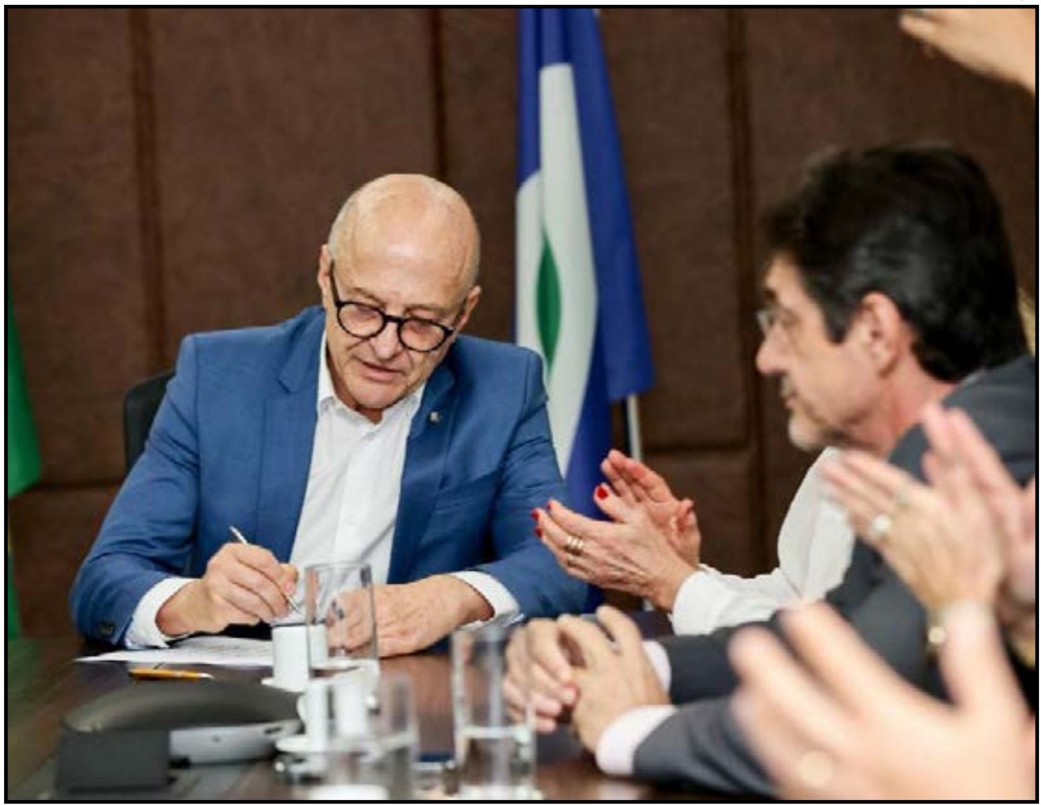
Apreensão, remoção, guarda, destinação e eventual inutilização de máquinas

O Memorando de Entendimento estabelece que a inutilização ou destruição de maquinários e equipamentos seja tratada como medida excepcional, após terem sido esgotadas todas as alternativas de remoção, transporte e guarda dos bens apreendidos, devidamente registradas em relatório técnico circunstanciado. Um canal de comunicação permanente entre as instituições envolvidas também será forma-