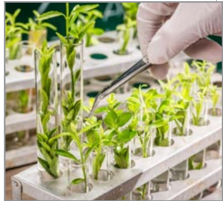
Biossoluções ganham espaço como alternativa viável