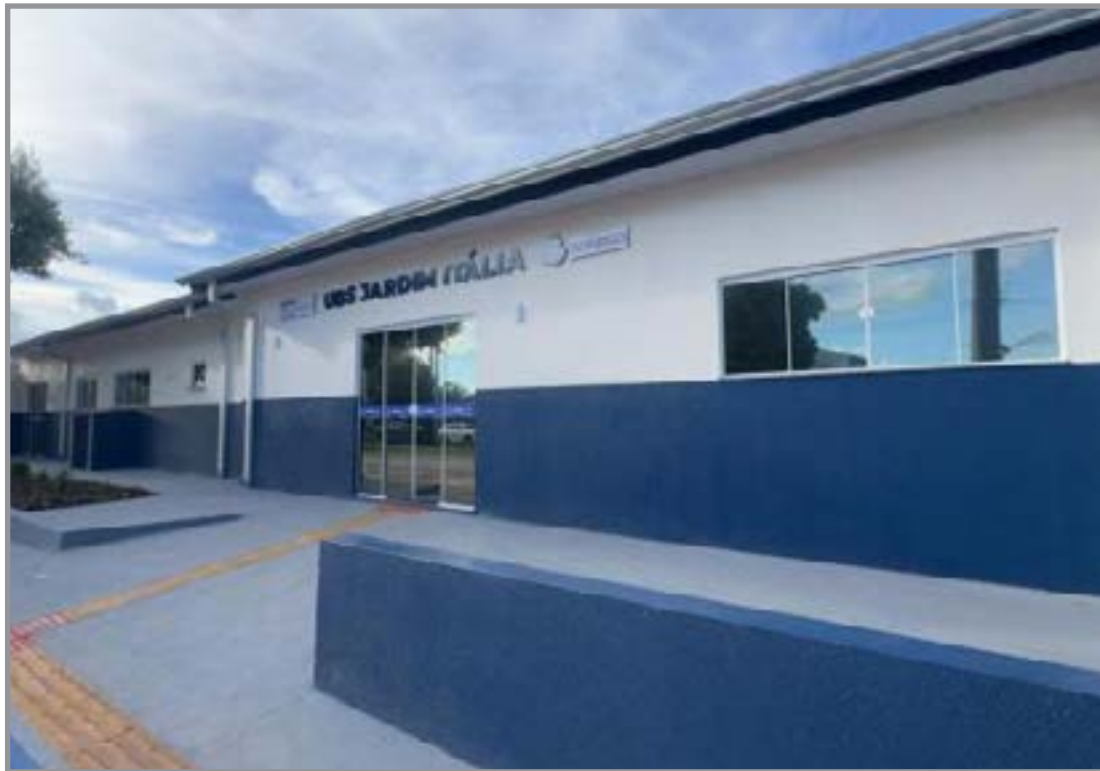
Município investiu mais de meio milhão em recursos próprios na obra