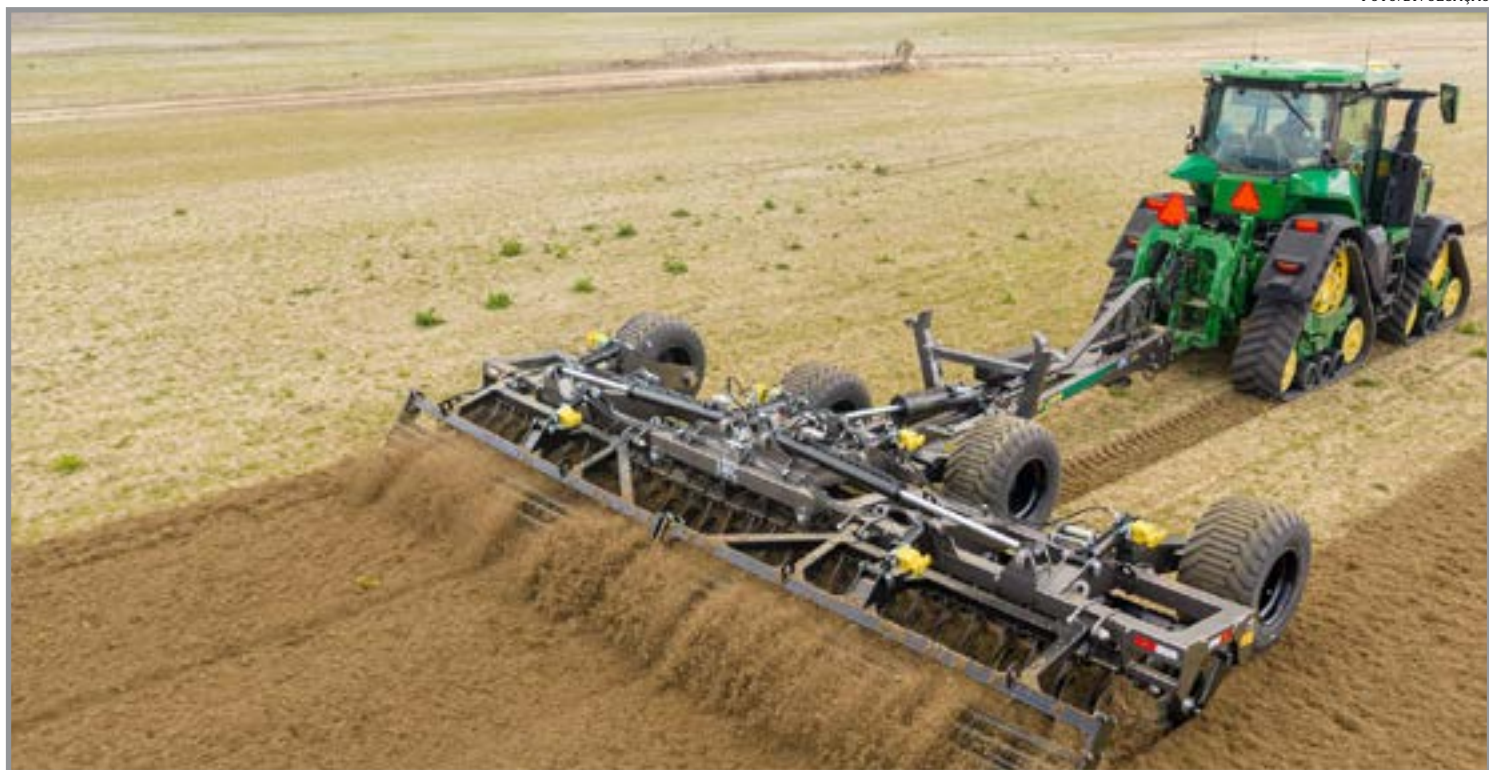
Evento será realizado na sexta-feira

Diferente da programação anterior, não será necessário realizar inscrição prévia.