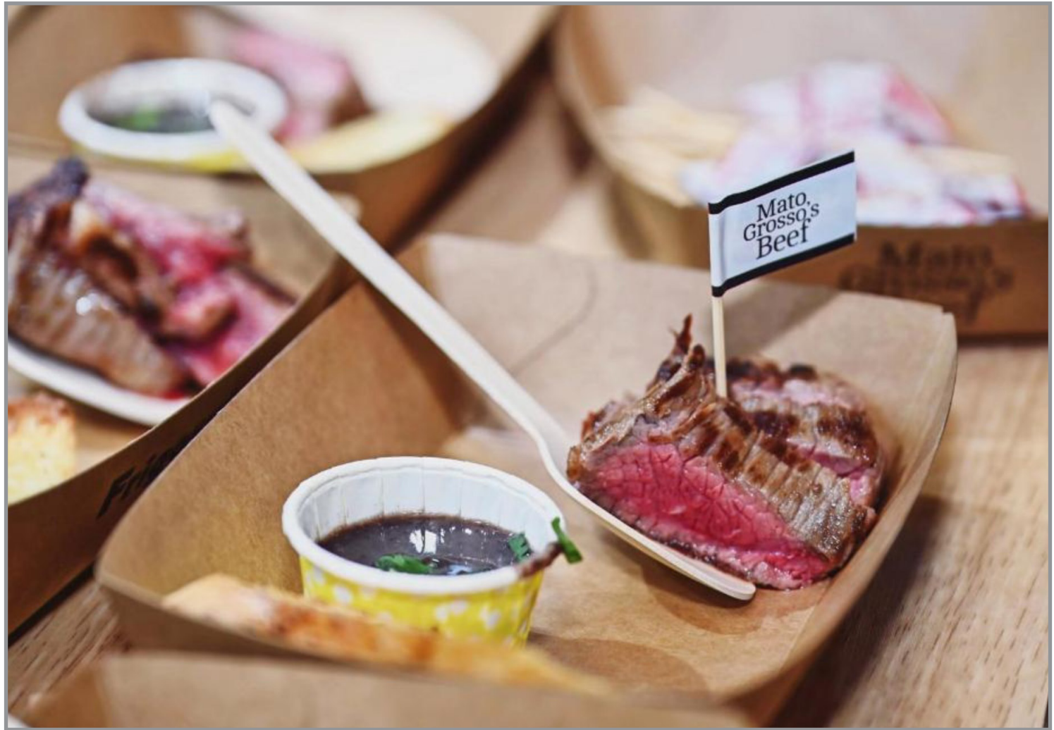
China seguiu como principal destino da produção mato-grossense