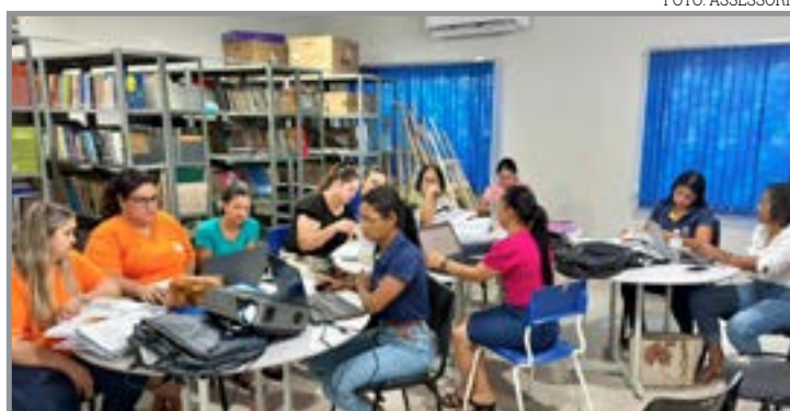
Projeto integra professores e alinha práticas

A proposta busca romper o isolamento entre unidades escolares e incentivar a construção coletiva de soluções pedagógicas. Ao compartilhar práticas e desafios, os professores passam