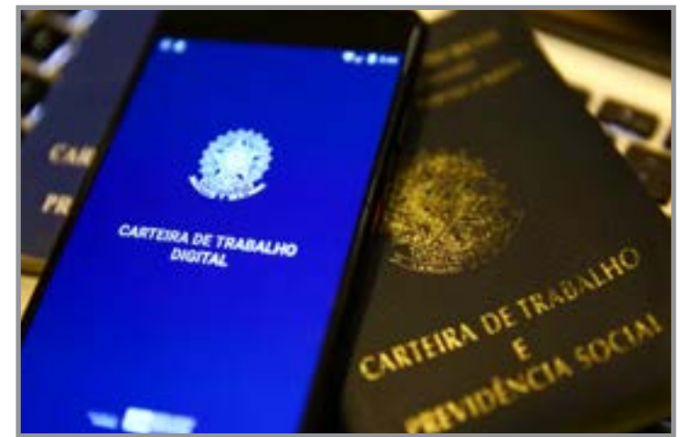
Setor da construção civil foi o principal responsável pela geração de empregos