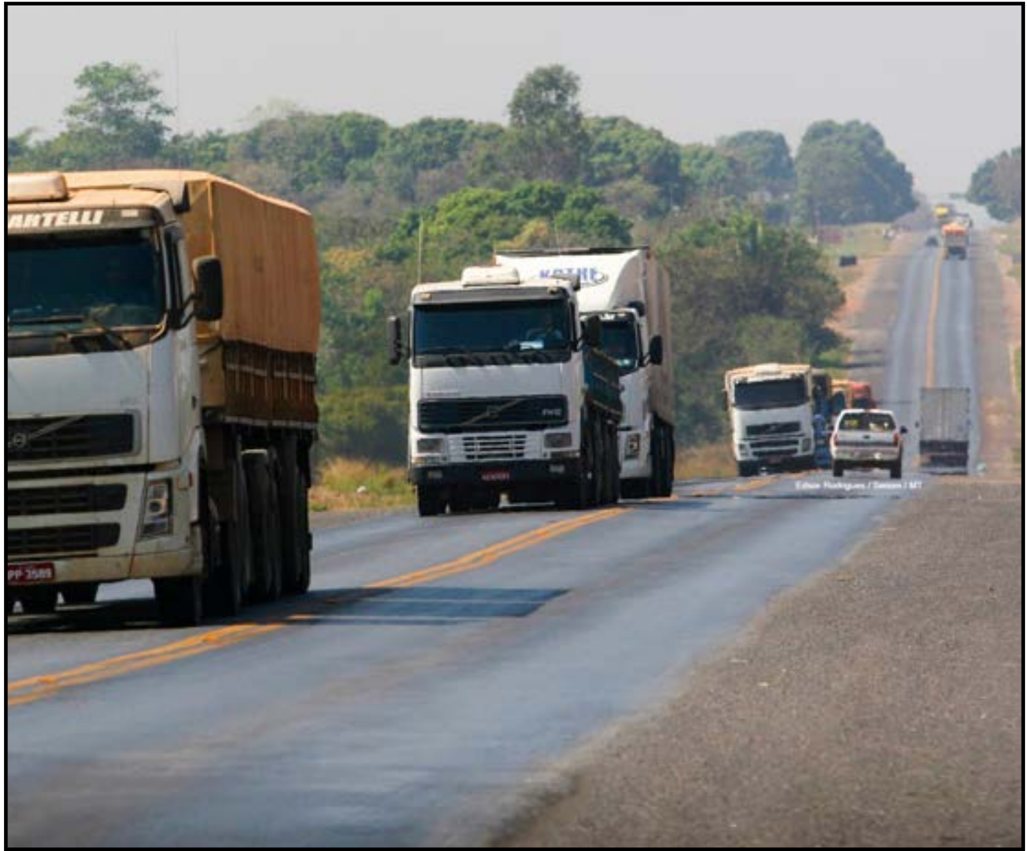
Duplicação é vista como urgente na região

Durante a audiência, o deputado também defendeu a revisão do cronograma previsto na nova concessão, argumentando que obras estruturantes precisam ser priorizadas desde o início do contrato. "A BR-163 é o principal corredor logístico do estado. Precisamos garantir eficiência no transporte, mas, acima de tudo, segurança para quem uti-