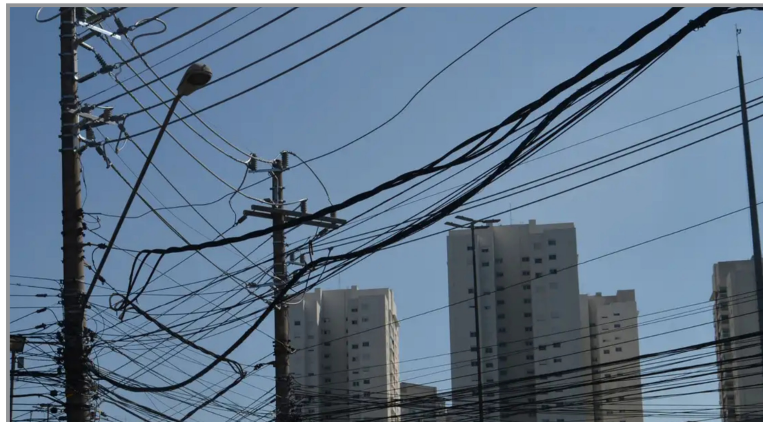
Lei foi sancionada pelo governador em exercício