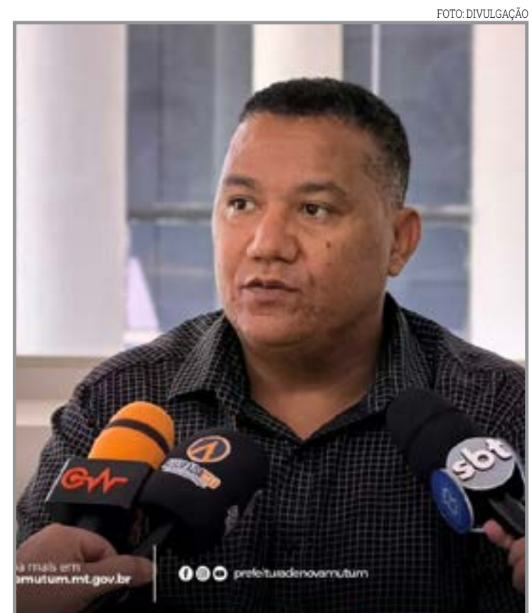
Cadastro segue até junho com novas regras

pio. "Investir na formação e no planejamento dos nossos professores é investir diretamente no futuro de Colíder. Estamos construindo uma educação mais organizada, justa e eficiente para todos os alunos", declarou.