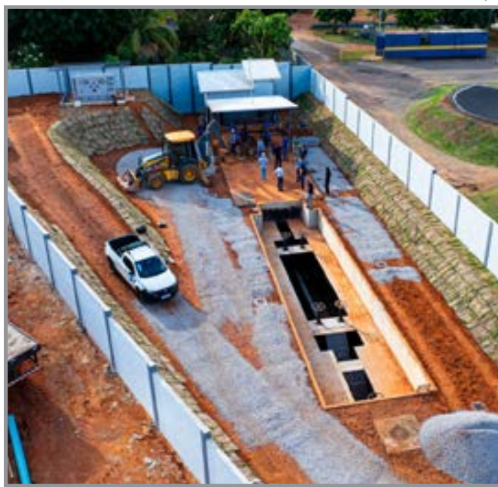
Estrutura deve beneficiar cerca de 20 mil moradores