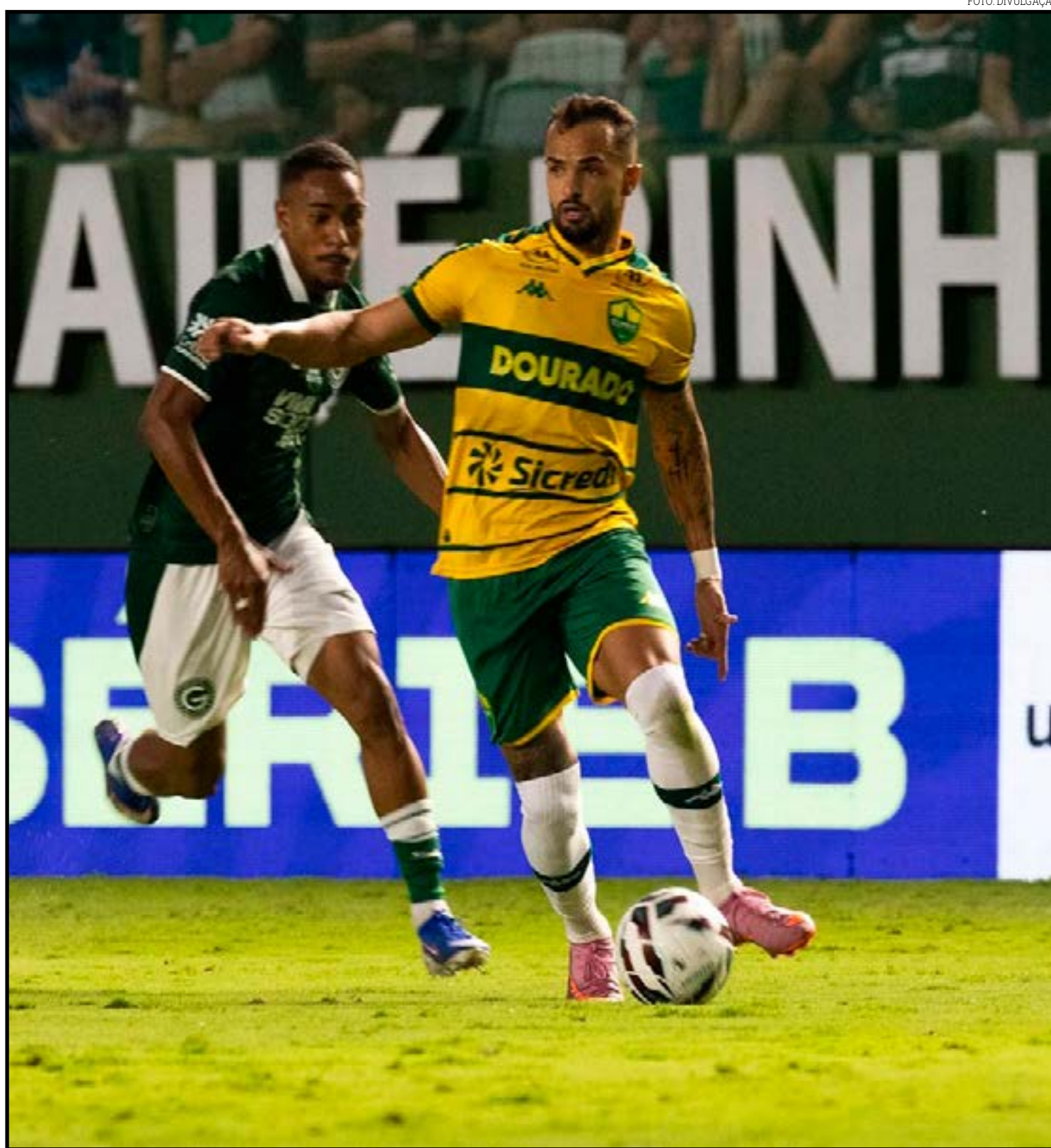
Vai chover após vitória do Cuiabá