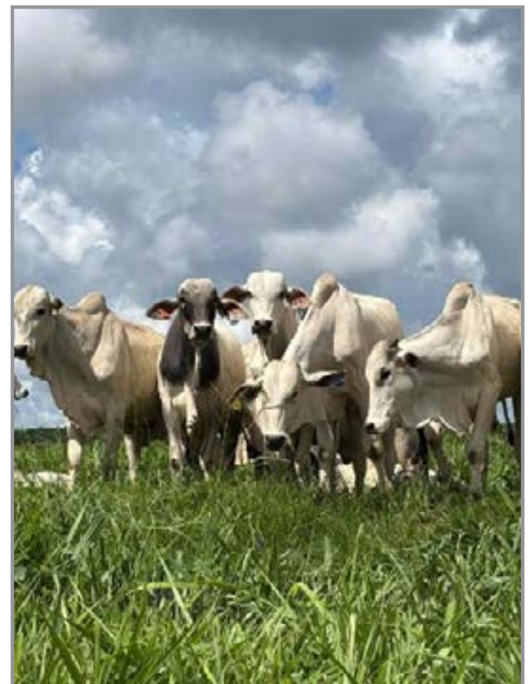
Escaladas mais folgadas e exportações firmes