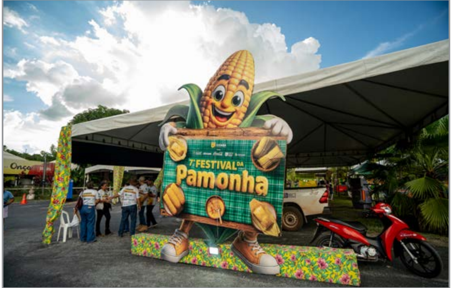
Aprosoja: usos do milho além da culinária

"Nós estamos no sétimo Festival da Pamonha e as