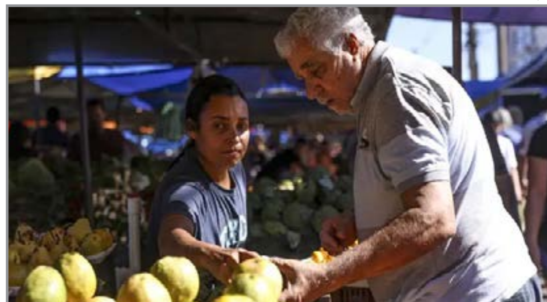
Crescimento desse movimento também acompanha a mudança demográfica no país

De acordo com especialistas, trata-se de uma geração mais engajada, que busca negócios alinhados a valores pessoais e também à solução de demandas da comunidade. Outro destaque é o alto nível de participação e o baixo índice de desistência