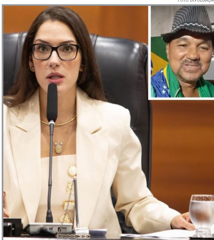
Deputada ainda pediu à Justiça a exclusão imediata do vídeo do Tiktok e Instagram

“Cumprir anotar que o conteúdo foi veiculado simultaneamente nas plataformas TikTok e Instagram, ampliando ainda mais sua difusão, sendo passível de novas visualizações, compartilhamentos e interações, o que contribui para a contínua disseminação das ofensas”, diz trecho da ação. Ainda não há decisão sobre o processo.