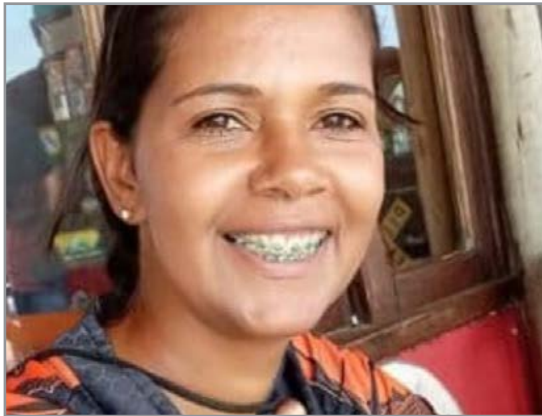
Vítima foi socorrida por pessoas que estavam no local

Ainda conforme a ocorrência, após o fato, o marido da vítima retornou ao sítio para buscar a arma de fogo. Posteriormente, um advogado compareceu à Polícia Mi-