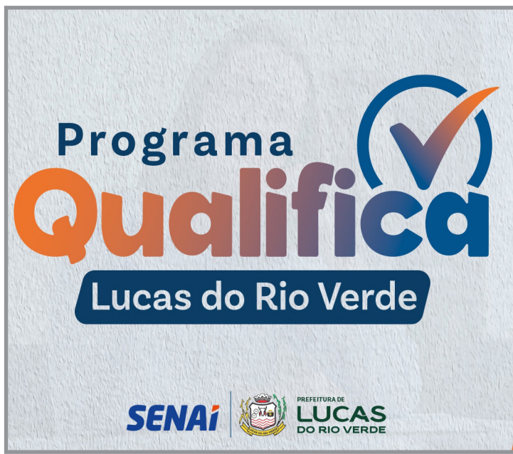
Capacitações são ofertadas no período noturno

Com foco no agronegócio, o curso prepara profissionais para operar máquinas utilizadas no campo. Para participar o candidato deve ter 18 anos completos, ensi-