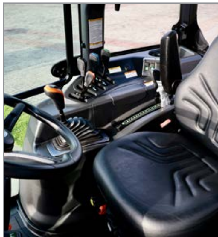
Multinacional irá expor seu portfólio completo de tratores

Estes novos modelos entregam excelente torque e eficiência energética com menor consumo de combustível e sem sobrecarga. "Na prática, a motorização Perkins que equipa estes modelos, trabalha em uma faixa ideal de eficiência, sem sobrecarregar e sem esforço", afirma o consultor de marketing da LS Tractor, Astar Kilpp. Com transmissão LS 20x20, com reversor sincronizado e super redutor Creeper integrado, estes novos modelos ampliam a versatilidade no campo, possibilitando desde operações de alta precisão, como pulverizações, até atividades mais rápidas, sempre com ganho de produtividade e conforto operacional.