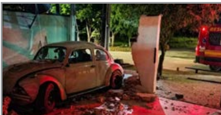
Ocupantes foram socorridos e encaminhados ao Hospital Regional

A mulher com ferimentos estava com passageira do veículo. Outros dois ocupantes não tiveram lesões aparentes, mas também foram encaminhados para atendimento médico. O caso foi registrado na polícia para investigação.