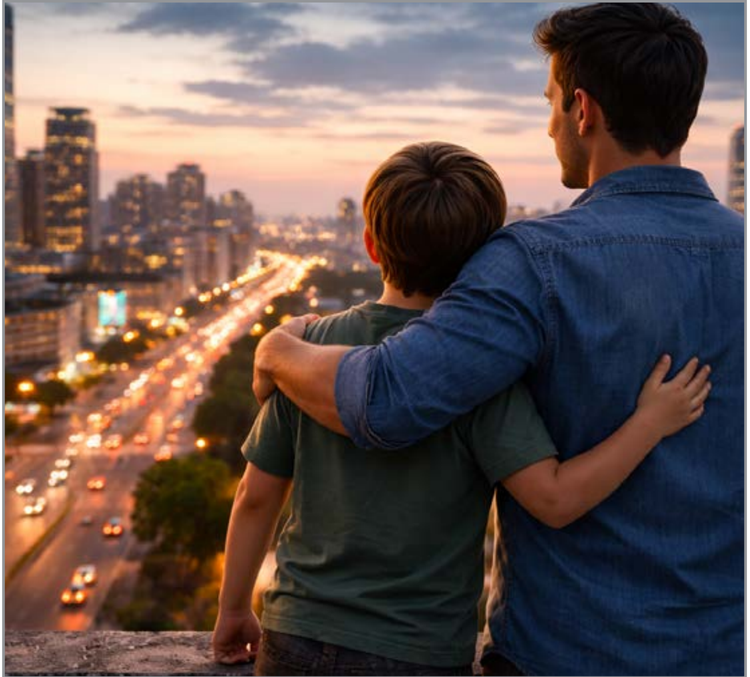
Desde 2020, mais de mil crianças registradas somente com nome da mãe

No caso da indicação do suposto pai pela mãe, o sistema permite a identificação automática dos registros de nascimento vinculados à mãe que ainda não possuem paternidade reconhecida. A partir disso, a mãe pode inserir os dados do suposto pai e anexar os documentos necessários. O Cartório então encaminha o caso ao juiz para dar início ao processo de investigação de paternidade, conforme previsto na legislação.