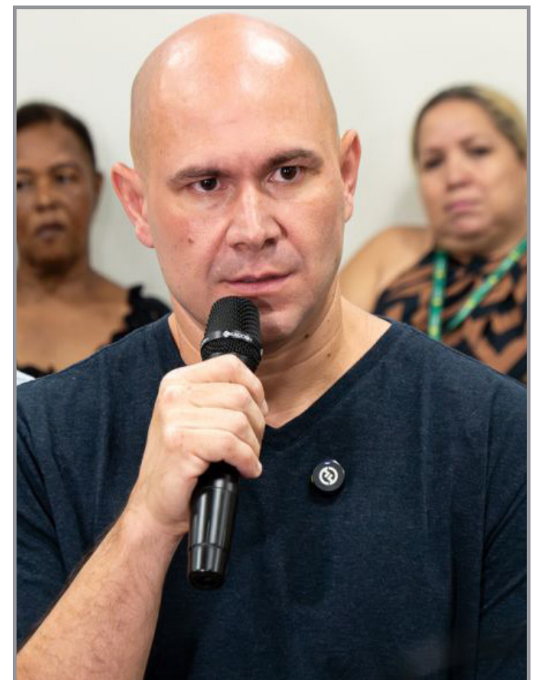
Deputado chamou o prefeito de “psicopata político”