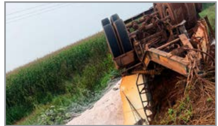
Um dos semirreboques tombou