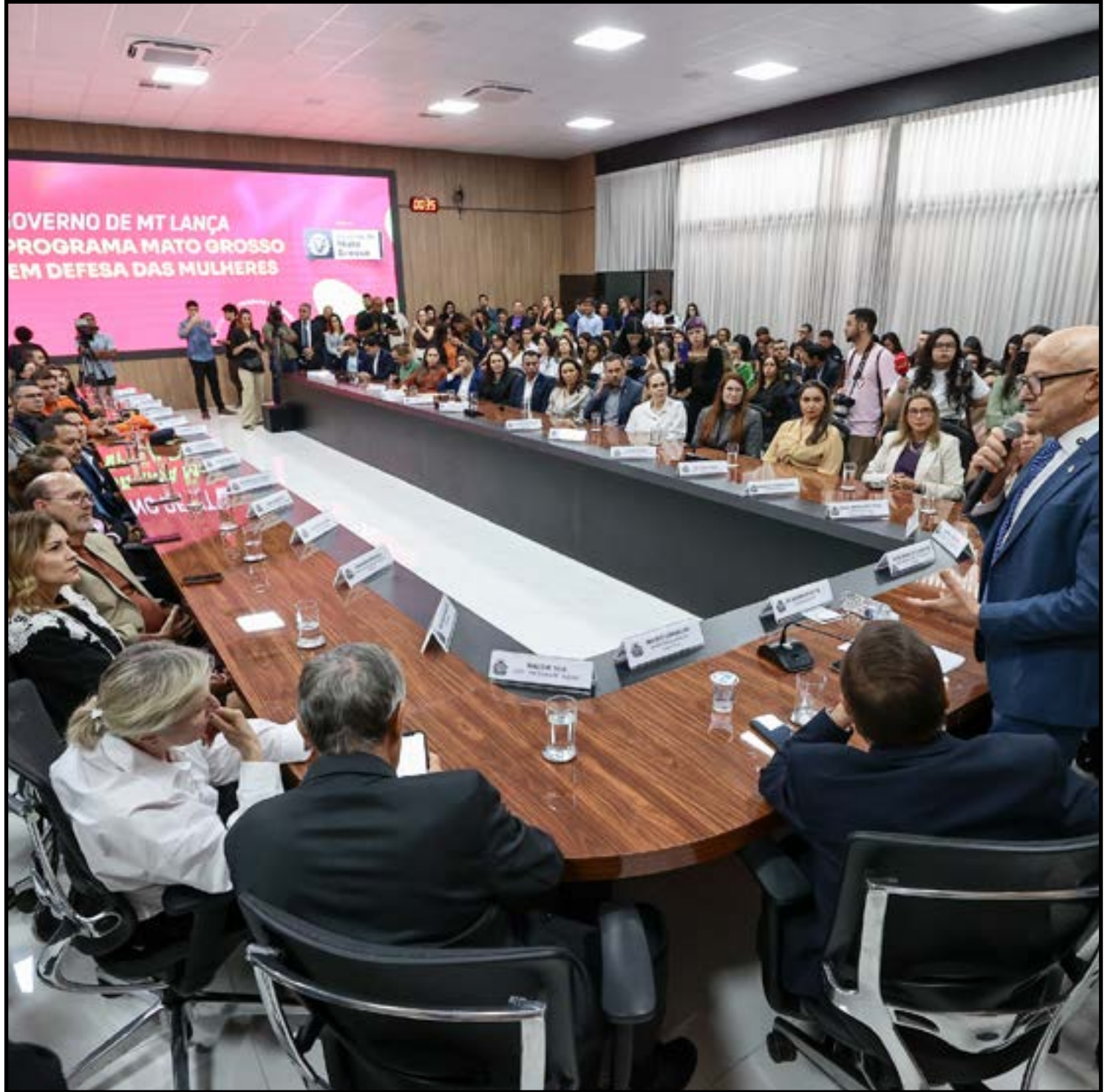
Espaços garantem acolhimento e exames 24h

Muitas chegam em estado fragilizado e precisam de um ambiente acolhedor para relatar o que aconteceu", explicou.