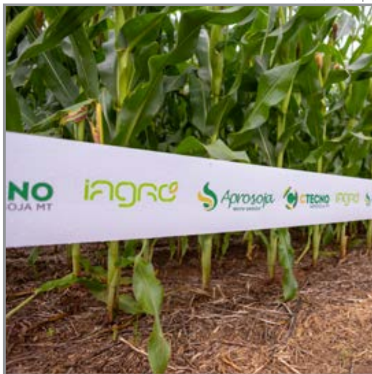
Iniciativa reúne produtores para acompanhar estudos sobre manejo

posta da cultura à aplicação de nutrientes como enxofre, nitrogênio e boro. Também serão apresentados conteúdos sobre manejo de herbicidas e estratégias de sistemas de produção com rotação de culturas. No dia 29, a programação segue no CTECNO Parecis, com foco em temas relacionados à eficiência produtiva e ao uso de insumos. Entre os conteúdos previstos estão o manejo da adubação nitrogenada no milho, o manejo de herbicidas no sistema soja-milho, além de estratégias para otimizar o uso de nutrientes e o mercado de fertilizantes, considerando o aumento dos custos de produção. As visitas têm como objetivo levar ao campo informações aplicadas à realidade das lavouras, contribuindo para o aprimoramento do manejo e para decisões mais seguras por parte dos produtores.