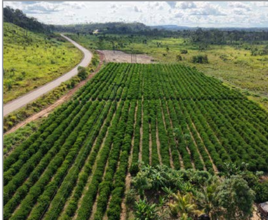
Imagem de área de produção de pequena escala de Aripuanã

A expectativa entre as organizações do setor tam-