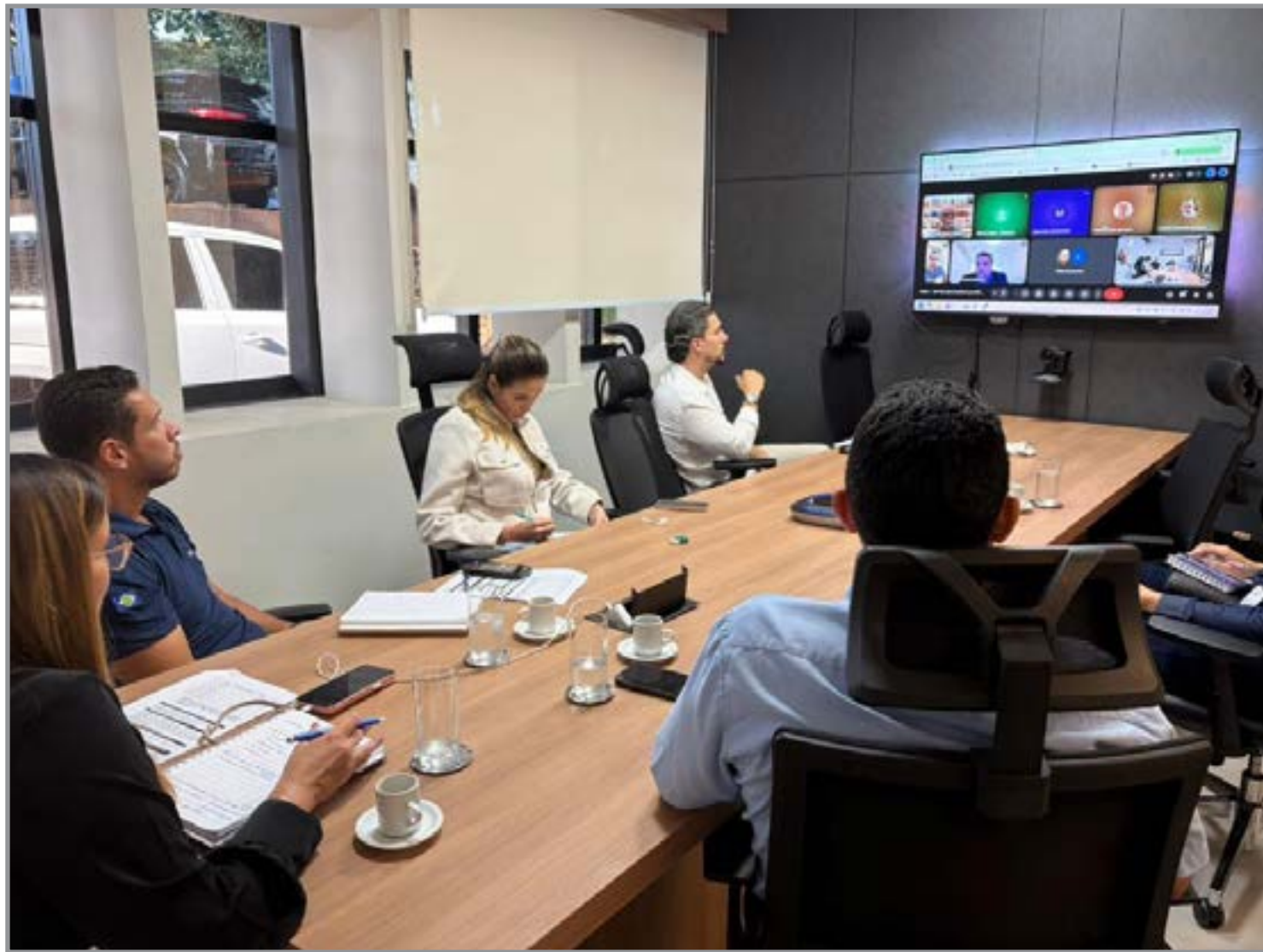
Comitê aprova comissão de fertilidade do solo

Entre os objetivos da comissão estão a elaboração e atualização das recomendações oficiais de correção do solo e de adubação; a padronização e atualização dos métodos oficiais de análise de solos, tecido vegetal, corretivos, fertilizantes e outros materiais de interesse agrícola; além da definição de de-