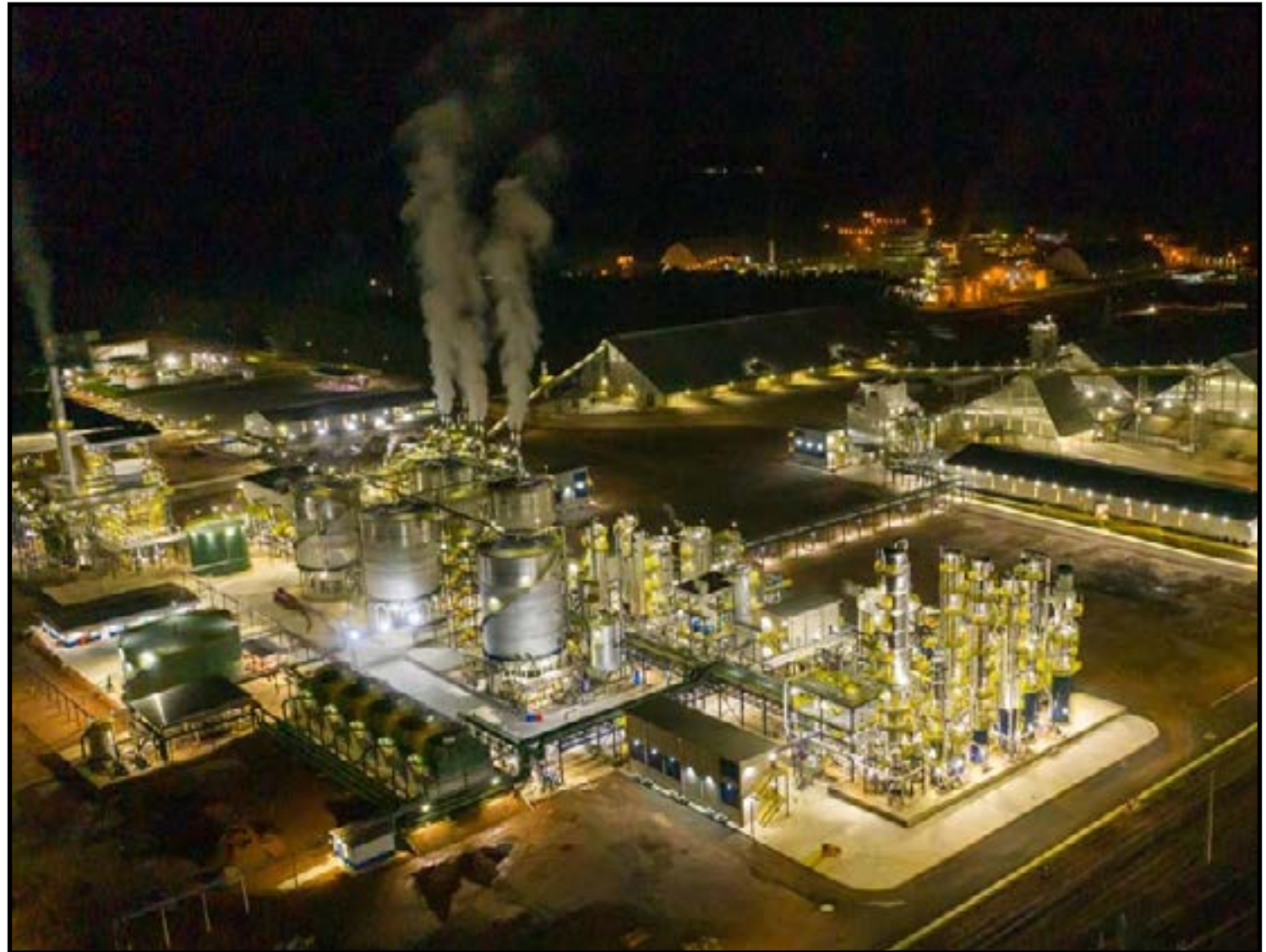
DRO para Rondonópolis e Rio Verde/GO

Com aproveitamento integral da matéria-prima, a Inpasa transforma grãos em produtos de alto valor agregado que abastecem o mercado interno e chegam a cinco continentes — entre eles etanol, DDGS, óleos vegetais, bioeletricidade e biogás — reforçando sua liderança em bioeco-