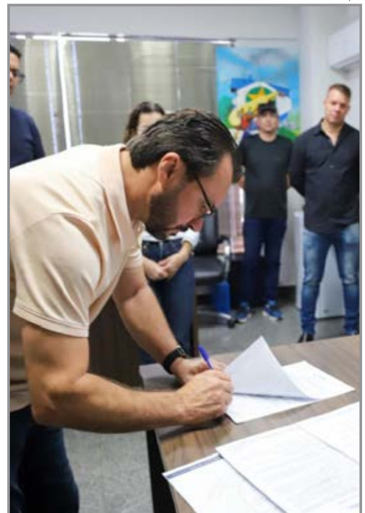
Centro Social São Francisco, a Associação de Vaquejada de Sorriso e a Casa do Oleiro