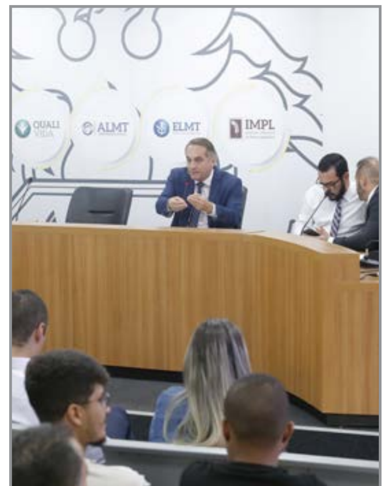
Auditores da CGE apontaram falhas em pagamentos