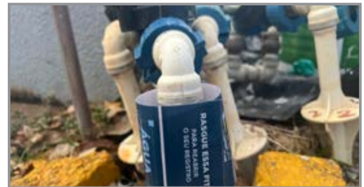
Refis oferece descontos e parcelamento no Serviço de Água e Esgoto aos contribuintes