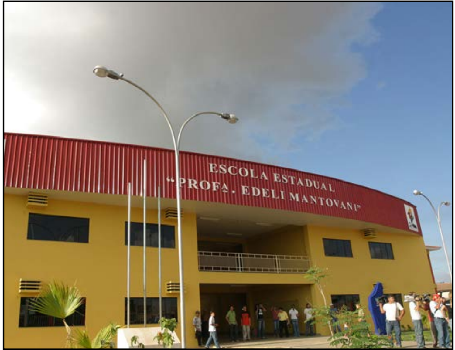
Escolas Edeli Mantovani, em Sinop, foi convertida para cívico-militar

presença dos militares da reserva ocorre no apoio à gestão administrativa e à disciplina escolar. Eles atuam em atividades como a organização da rotina, o controle de entrada e de saída, o acompanhamento das normas de convivência e o apoio às ações cívicas. A