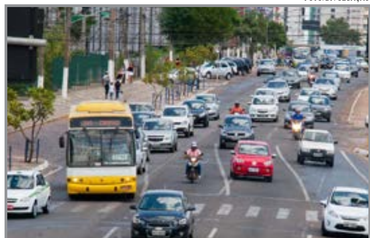
Contribuintes também podem parcelar o imposto em até seis vezes

O valor simbólico de R$ 80 é cobrado no ato da adoção, para colaborar com a manutenção do abrigo.