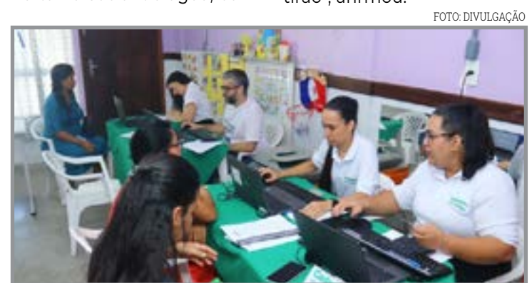
Centro Social São Francisco, a Associação de Vaquejada de Sorriso e a Casa do Oleiro