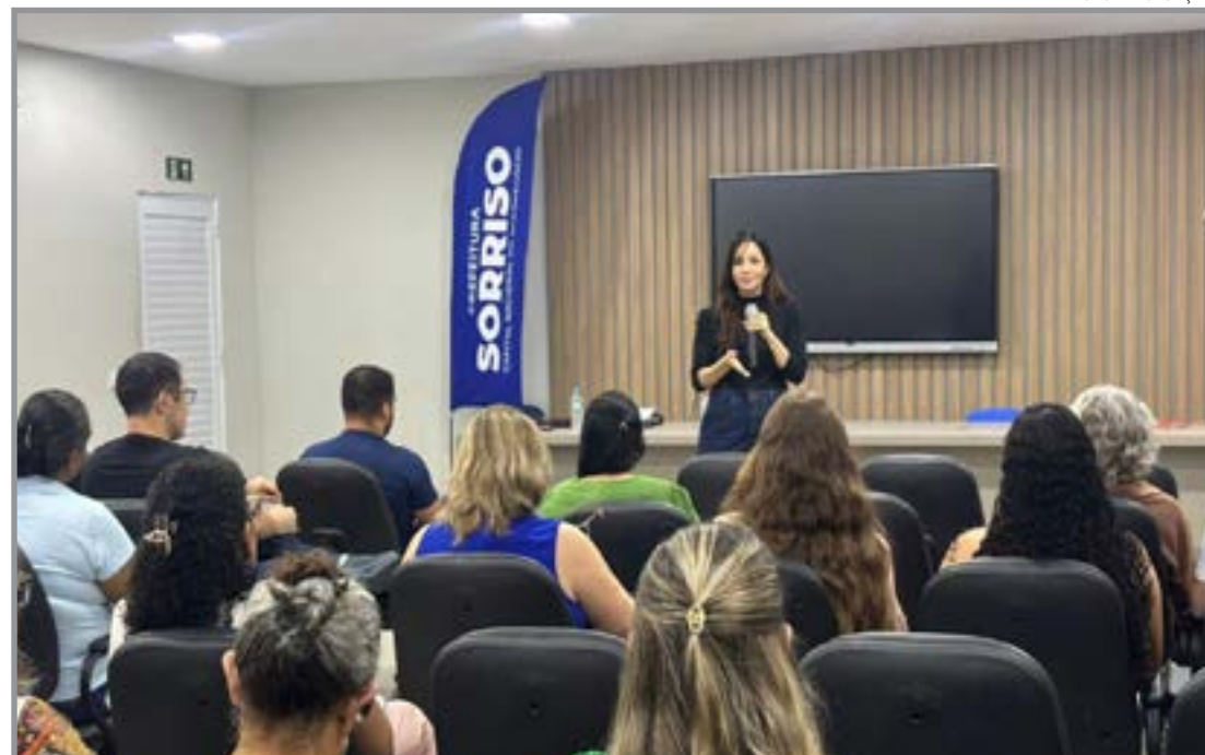
Ex-governador mantém aberta articulação para 2026