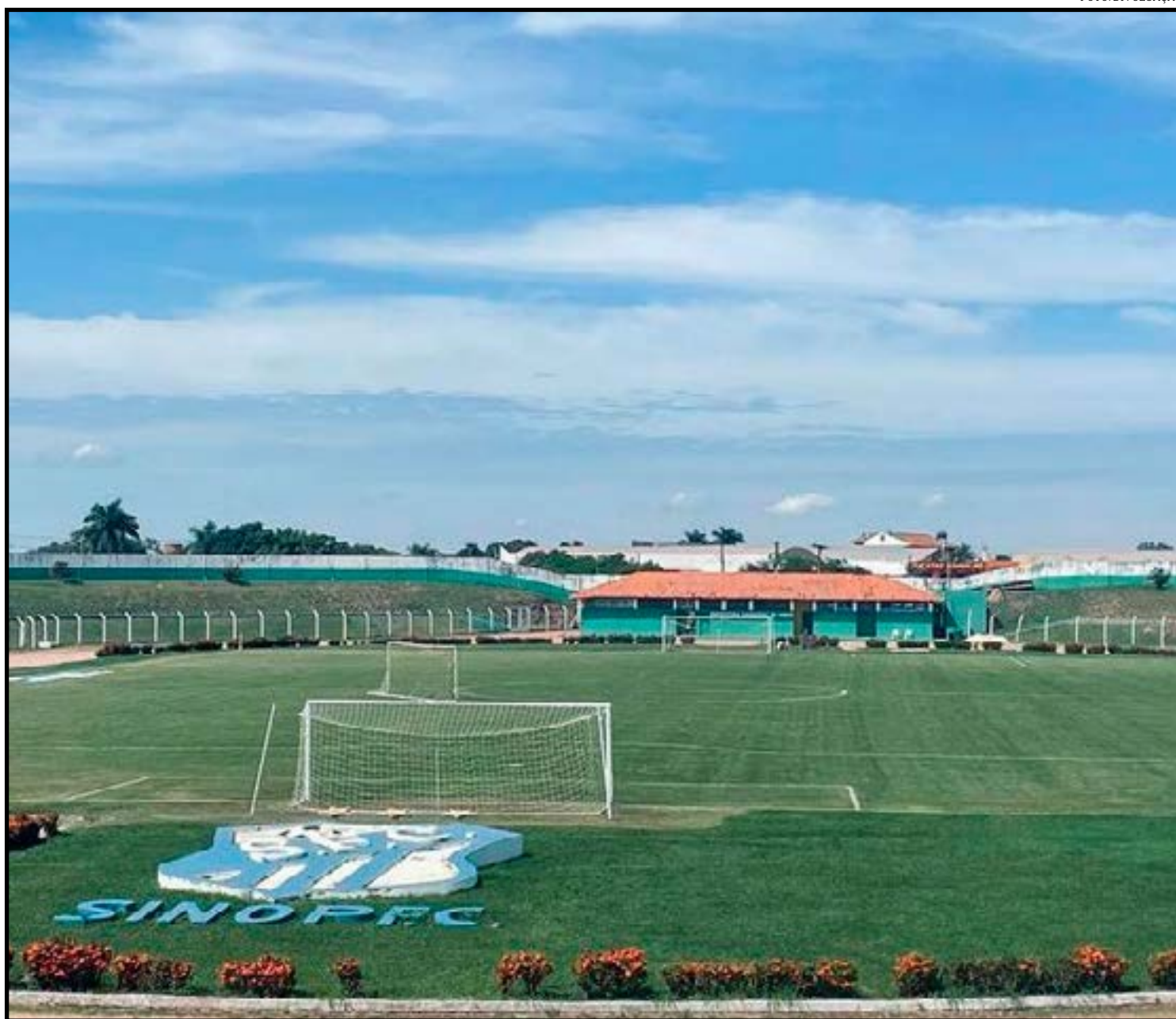
Sinop FC quer a liderança da chave

Enquanto na chave A, os 3 classificados estão definidos, na B a situação