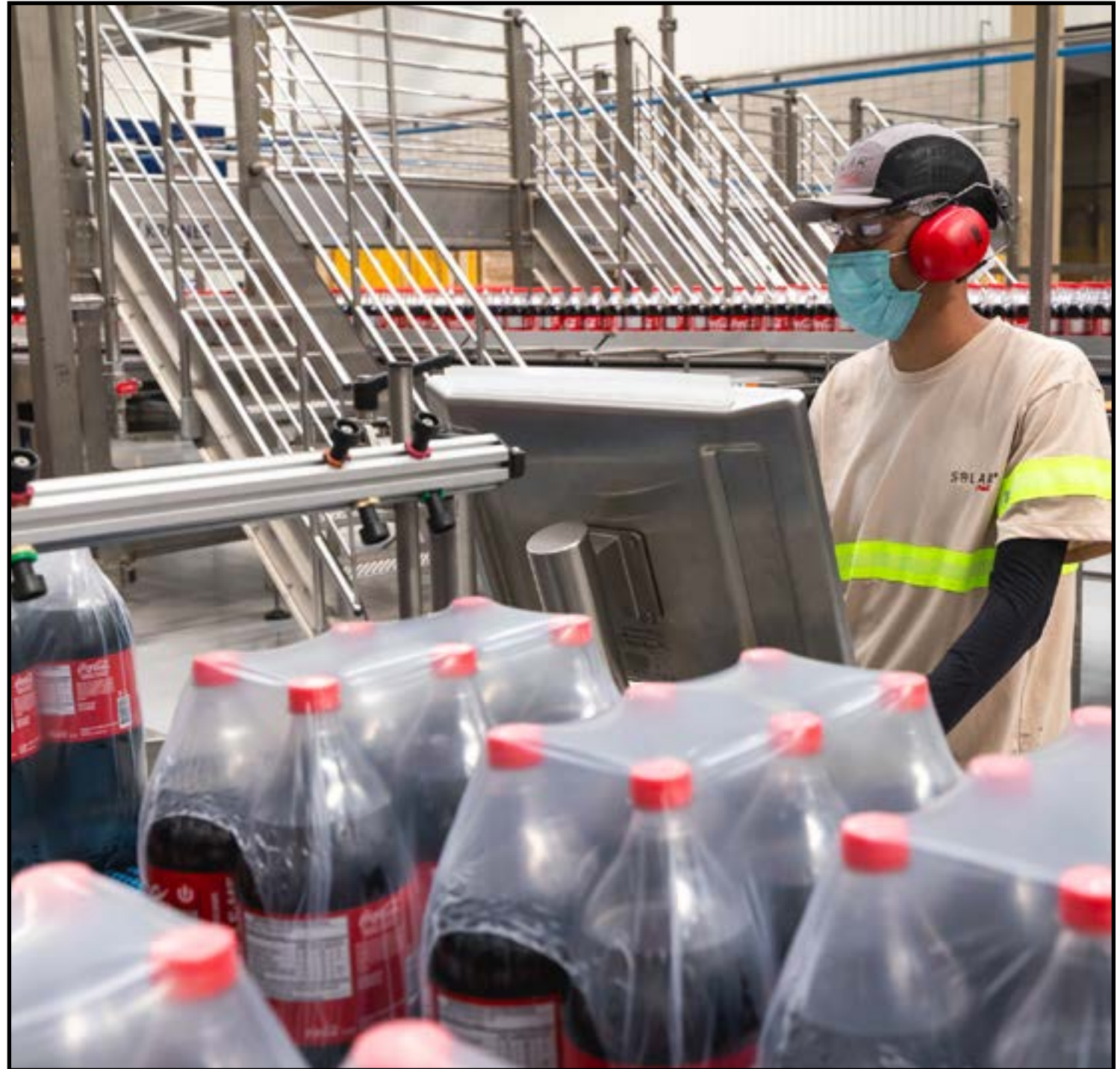
Aporte de R$ 500 milhões no estado até 2029

A expansão elevou o quadro em 80 novas vagas diretas técnicas, focadas em