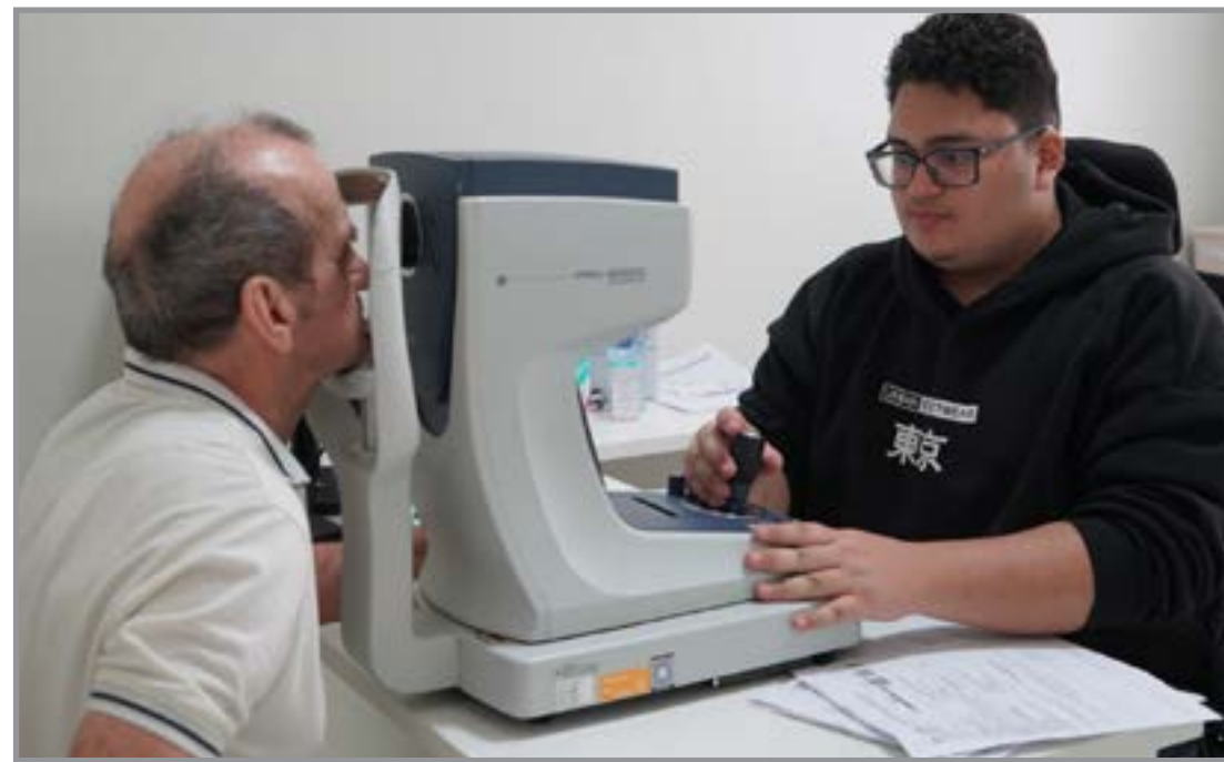
Campanha reforça cuidado com saúde ocular