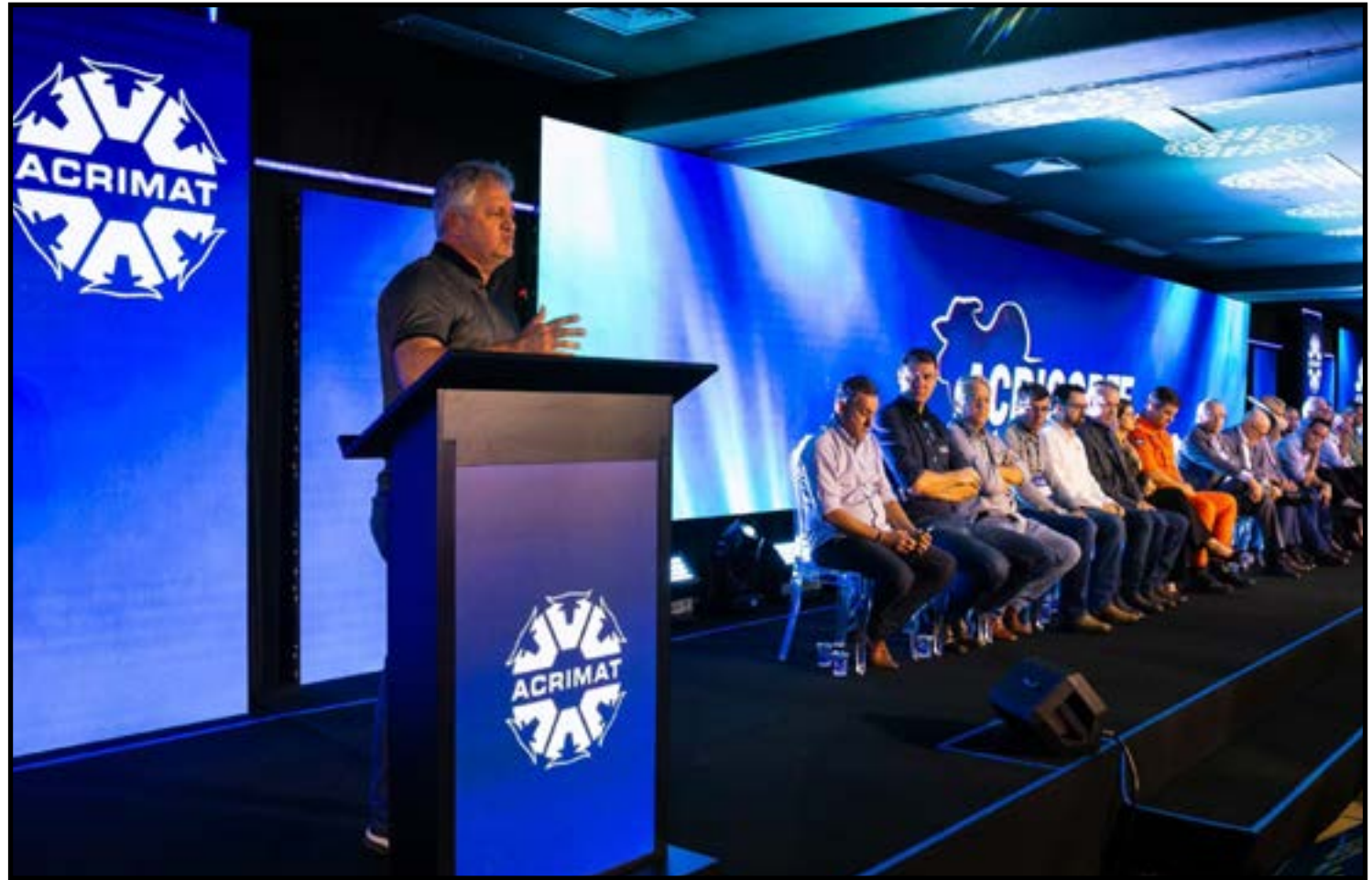
Evento reuniu produtores, empresas e lideranças políticas