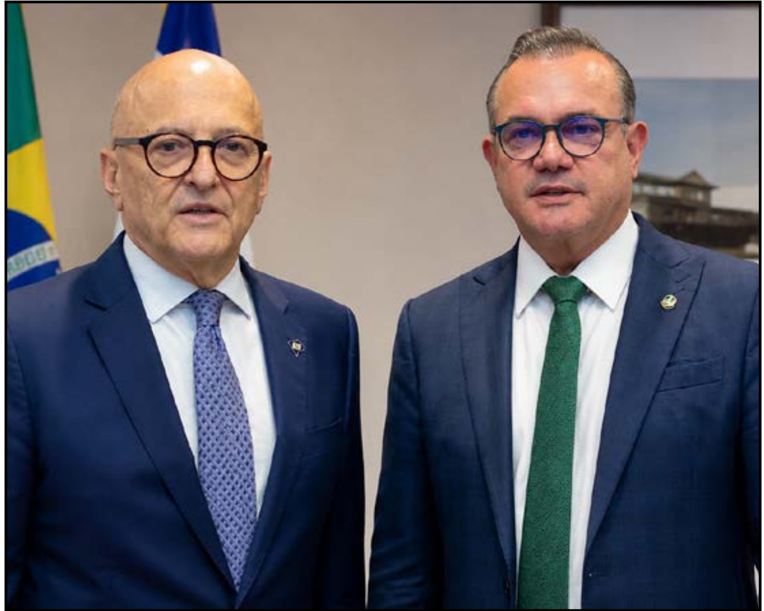
Disputa pelo Paiaguás pressiona base governista

Do outro lado, Wellington Fagundes também não demonstra qualquer sinal de disposição para recuar. Existe uma razão objetiva para isso: as pesquisas de inten-