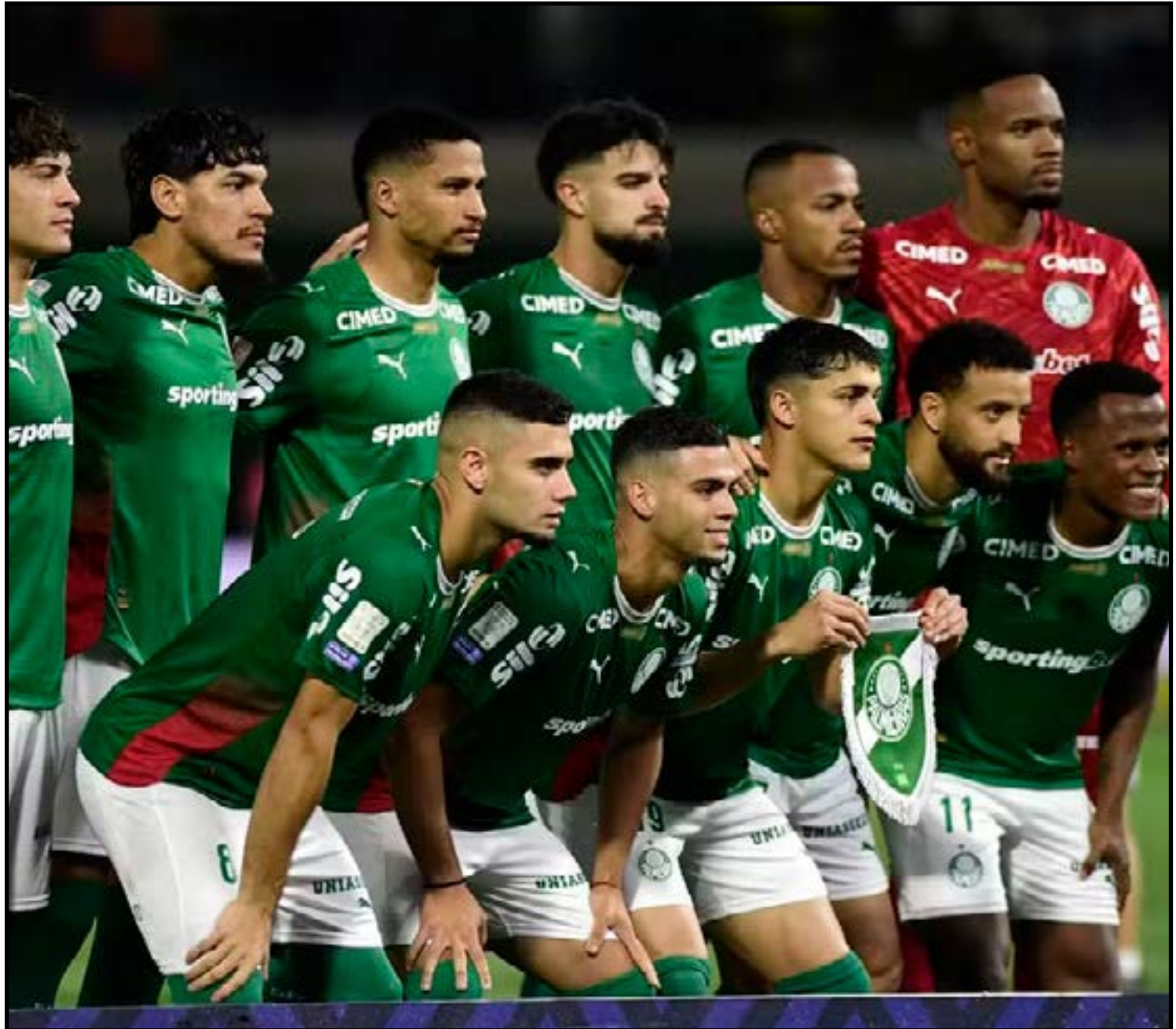
Time do Palmeiras antes do jogo contra o Cruzeiro

çou com pressão, diante de um 2025 frustrante. O título do Paulistão ajudou a amenizá-la, assim como os resultados que colocaram o Palmeiras no topo de todas