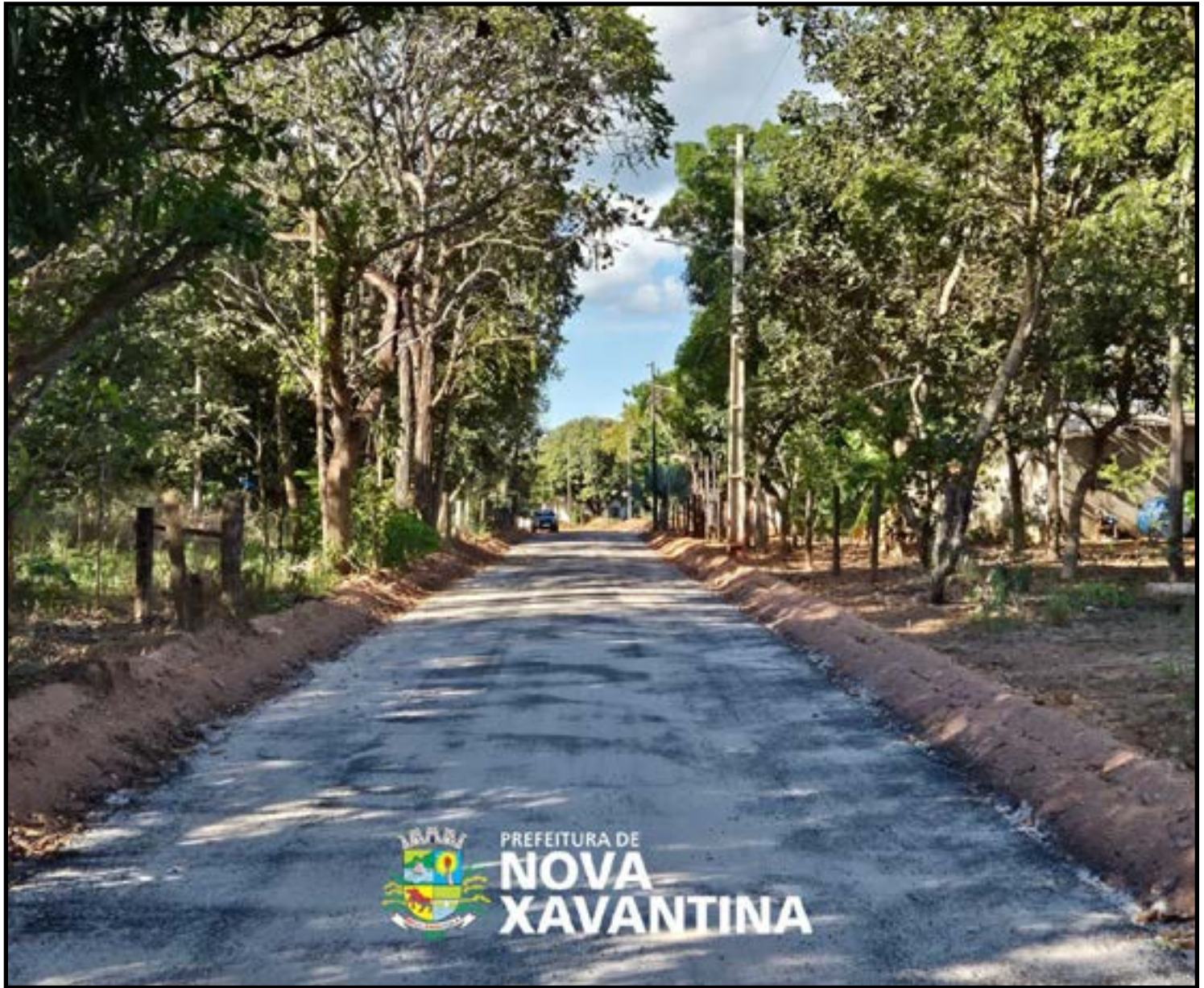
100% da obra finalizada na etapa de asfaltamento

Além de facilitar o tráfego de veículos e pedestres, a pavimentação contribui diretamente para a redução da poeira, melhora o acesso aos imóveis e oferece mais segurança para motoristas, motociclistas e moradores da região. A gestão municipal afirma que novas frentes de trabalho devem continuar sendo executadas nos próximos meses, ampliando as obras de infraestrutura urbana em diferentes bairros de Nova Xavantina.