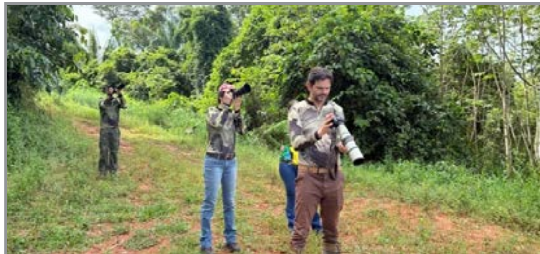
Conecta Avistar Mato Grosso ocorrerá no segundo semestre de 2026