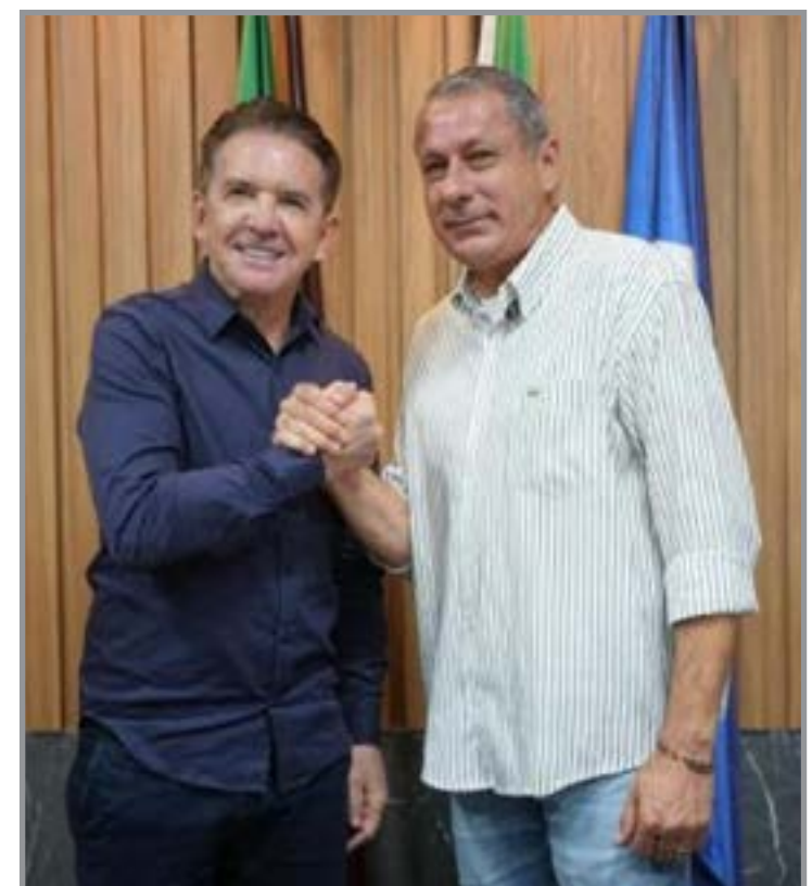
Município vira referência para metas do MT

outubro, o eleitor em situação irregular pode ter dificuldades para emitir passaporte, assumir cargo público e até realizar matrícula em instituições públicas de ensino.