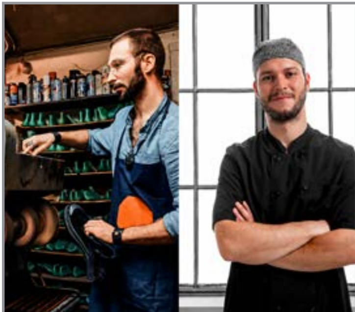
Cursos gratuitos miram emprego e renda local

Além da capacitação técnica, o Mutum Mais Oportunidades prevê ações de inclusão e divulgação para alcançar comunidades com