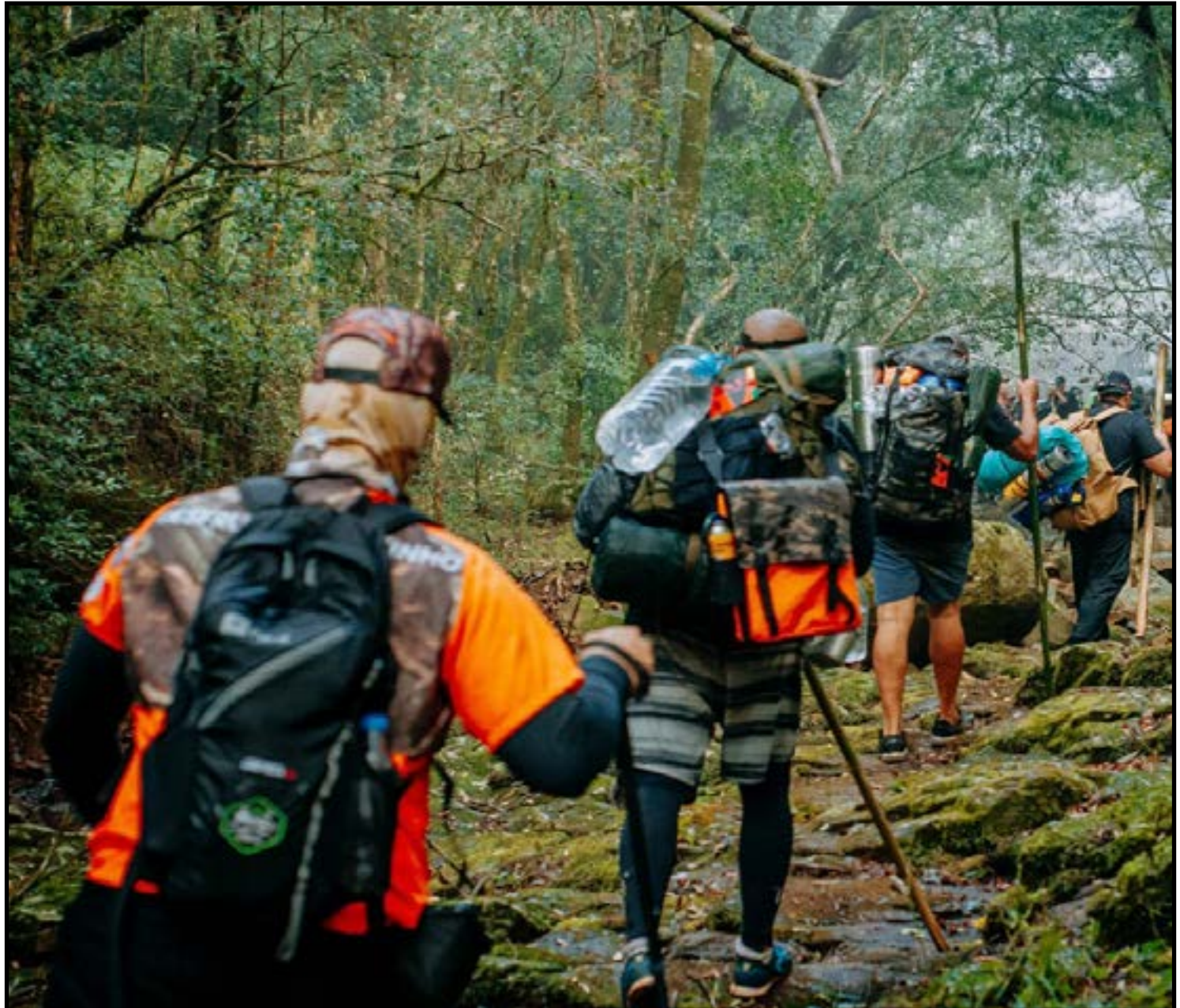
Legendários: presente em 24 países

Nos últimos anos, essa mobilização ganhou ainda mais força. Em 2026, durante as enchentes que atingiram Minas Gerais, mais de 800 voluntários do Legendários atuaram nas cidades de Juiz de Fora e Ubá, contribuindo para a