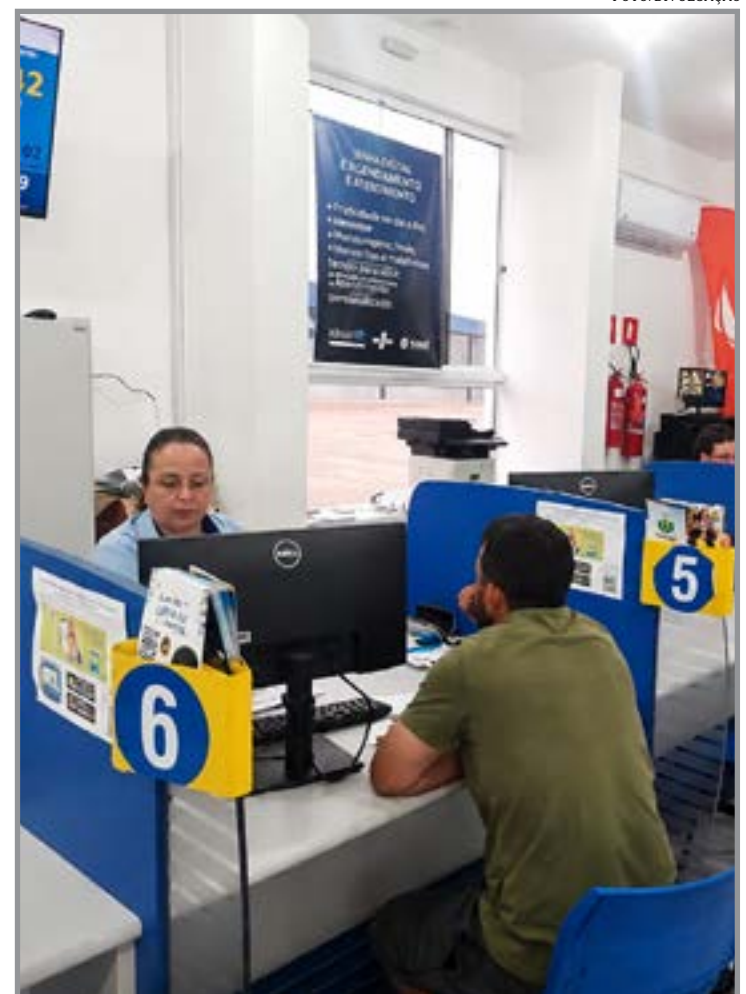
Multa em caso de não entrega

ser realizadas diretamente na Secretaria de Desenvolvimento Econômico ou pelos canais oficiais da Prefeitura de Nova Mutum.