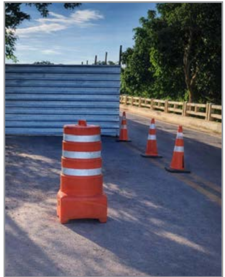
Obras estão sendo realizadas na ponte da MT-010 para corrigir problemas estruturais