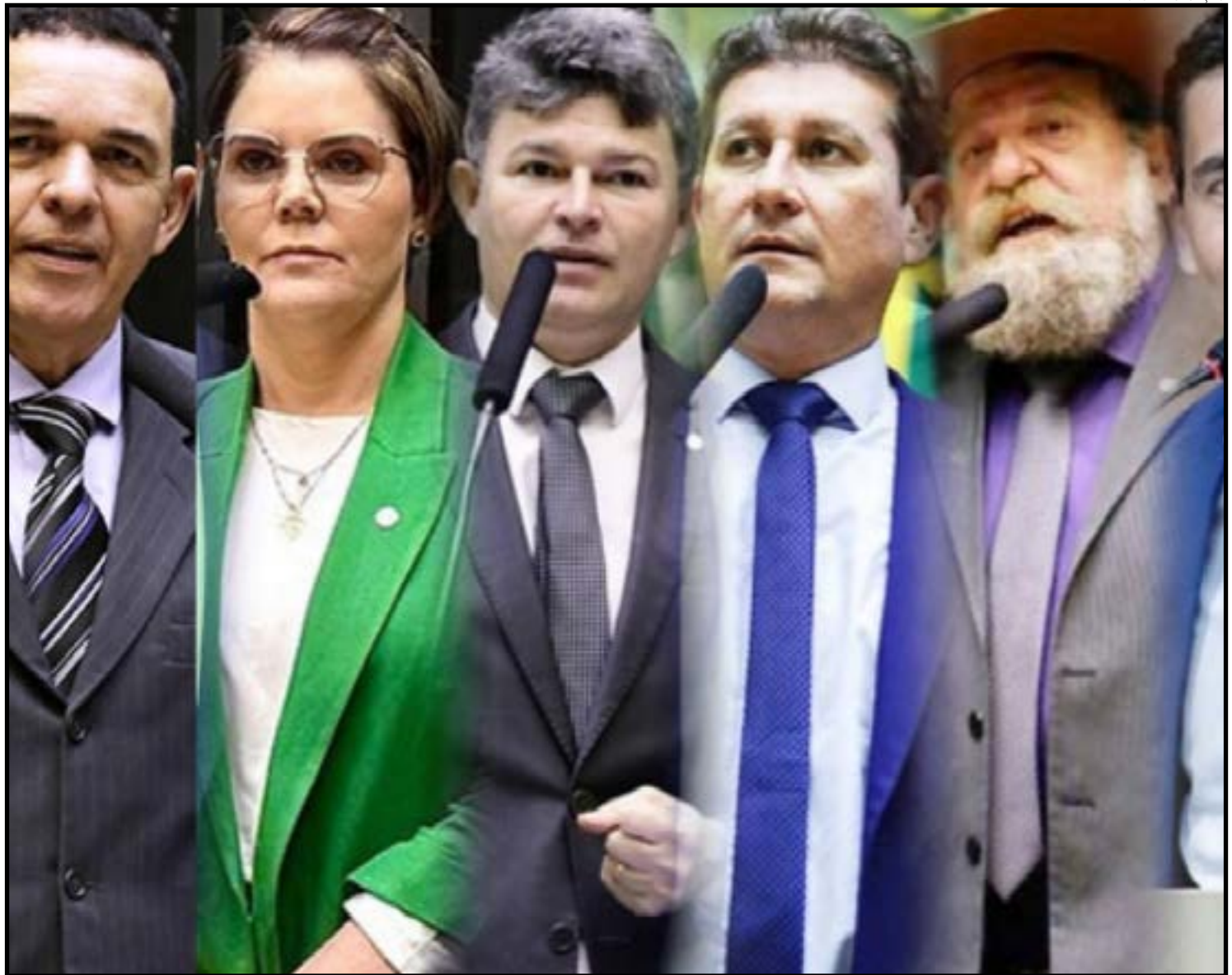
Guarde os nomes dos deputados

Apesar da previsão de jornada semanal de 40 horas, o texto abre margem para ampliação da carga horária por meio de acordos coletivos. A proposta estabelece que convenções sindicais poderão prevalecer sobre a legislação em temas como