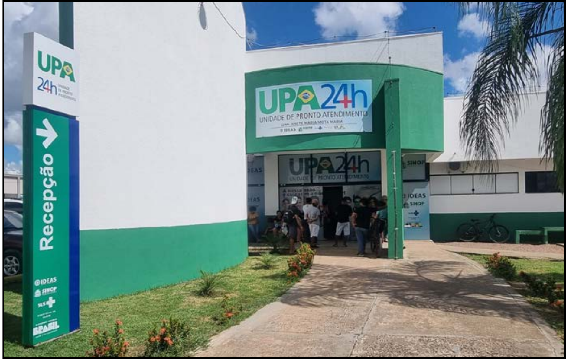
Módulos serão adaptados para uso habitacional

A administração municipal justificou que a adoção dos módulos apresenta vantagens operacionais e estruturais em relação à execução de obras convencionais. Entre os pontos destacados estão a rapidez na implantação, flexibilidade de layout, possibilidade de remanejamento futuro e menor impacto físico na