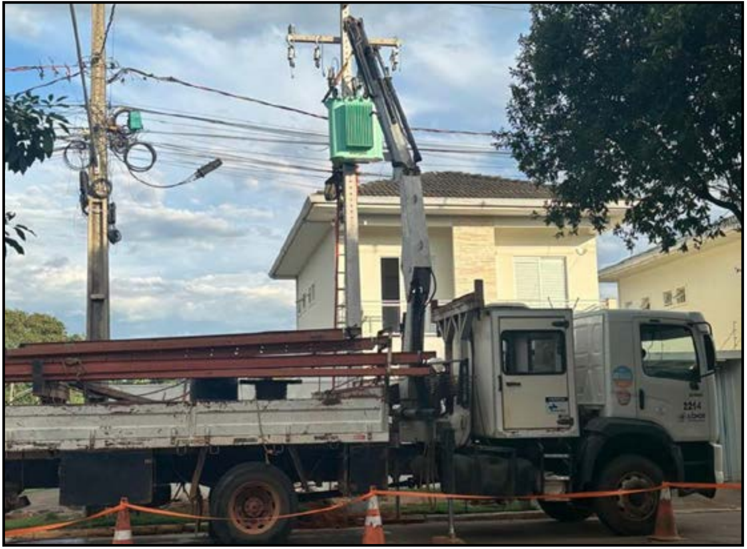
Aulas tiveram horários reduzidos por causa do calor

apesar das cobranças feitas pela população à prefeitura, a Prefeitura de Colíder não possui competência legal