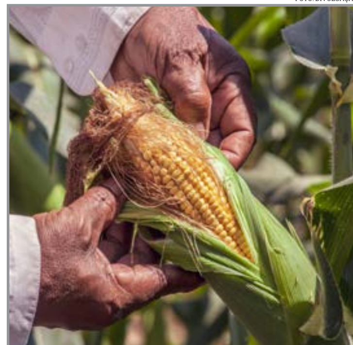
Categorias irrigado e sequeiro do concurso GETAP alcançam patamares históricos