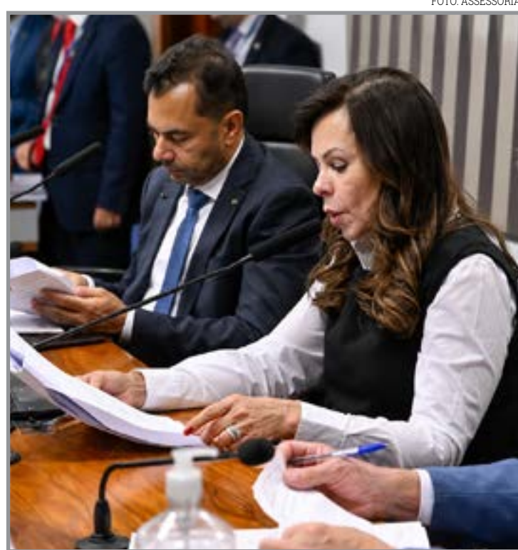
Nova regra liga reajuste às receitas do Fundeb

Durante a votação, parlamentares defenderam que a valorização dos professores é fundamental para melhorar a qualidade do ensino público e fortalecer a educação básica nos municípios brasileiros.