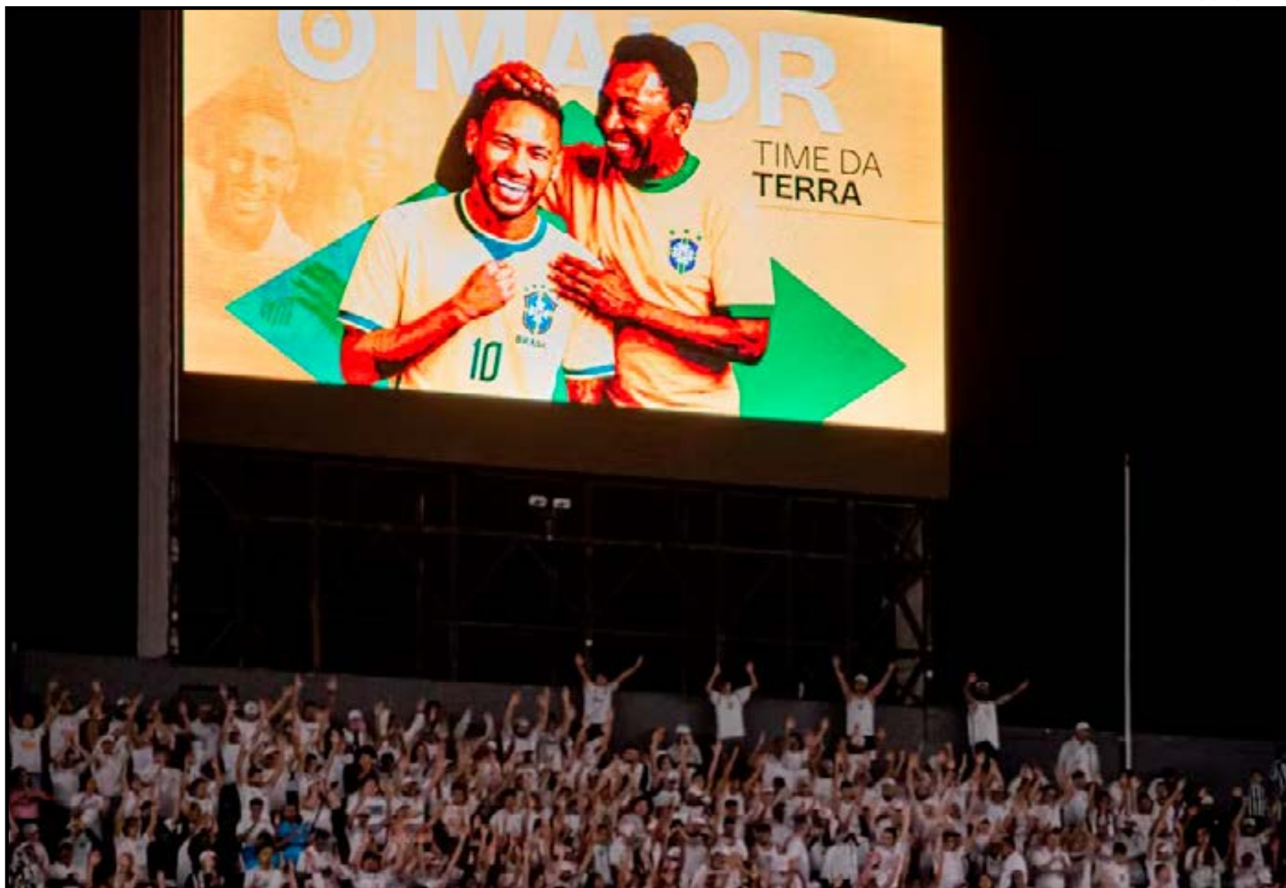
Elenco do Santos poderá sofrer reformulação em janela de meio de ano