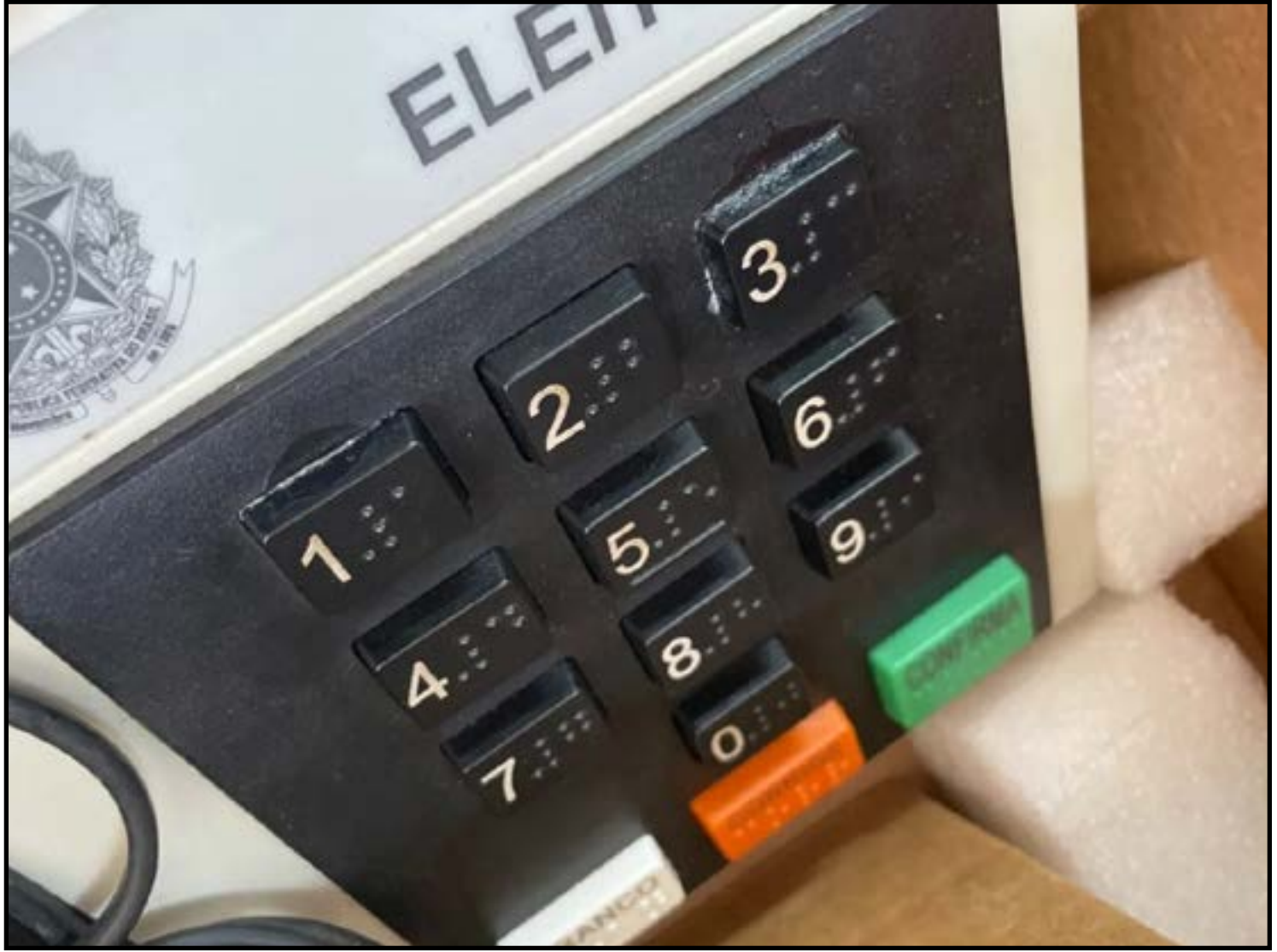
MT registra 2.476.993 eleitores com biometria

No mesmo período, foram registrados 125 mil novos eleitores jovens.