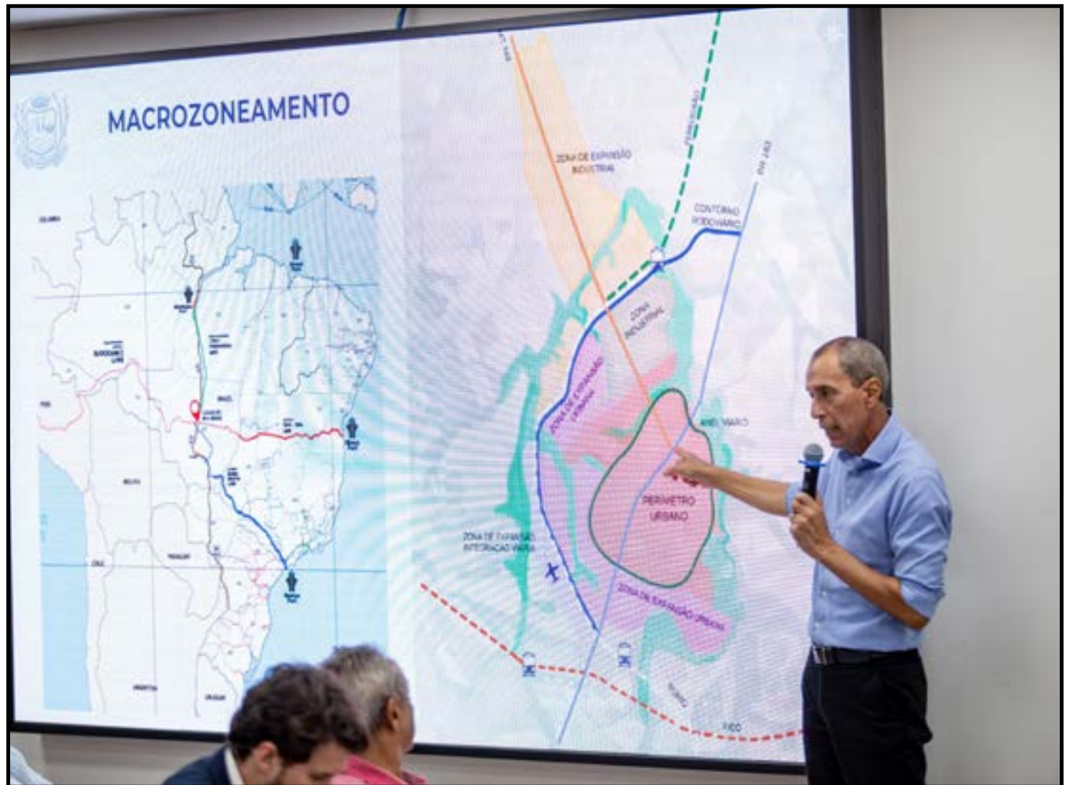
Implantação do contorno viário deve retirar caminhões da rodovia

Durante a audiência, a concessionária informou que cerca de 75% dos veículos pesados devem deixar de circular pela travessia urbana após a conclusão do contor-