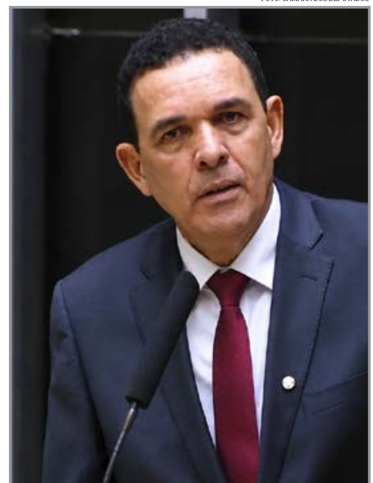
Parlamentar defende transição sem perda de empregos