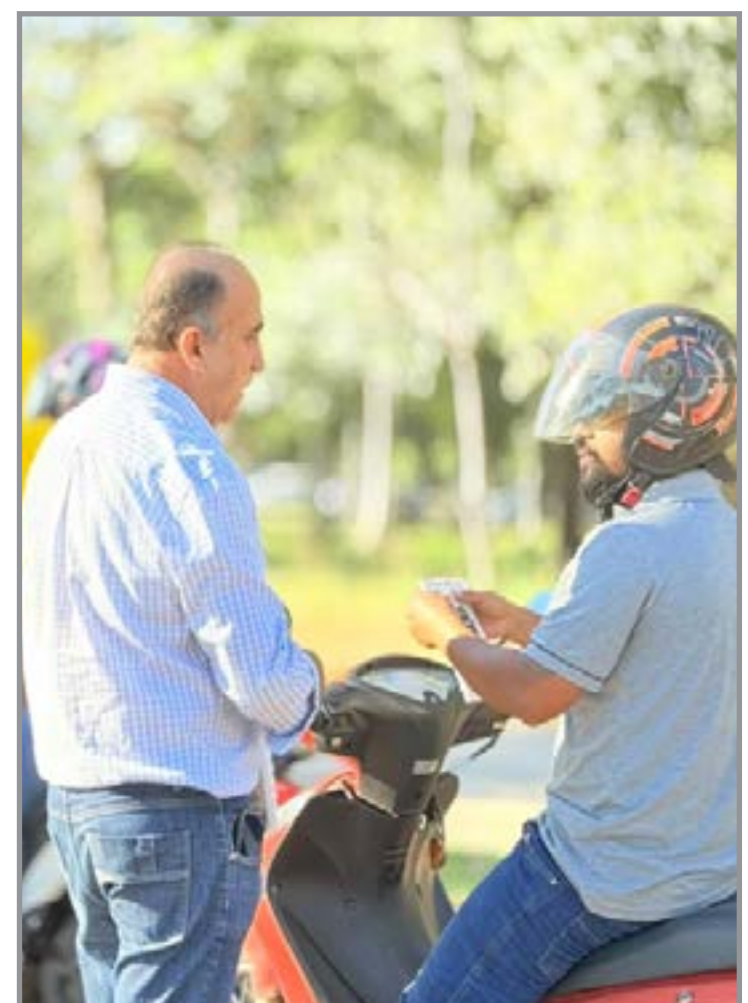
Por um trânsito mais seguro