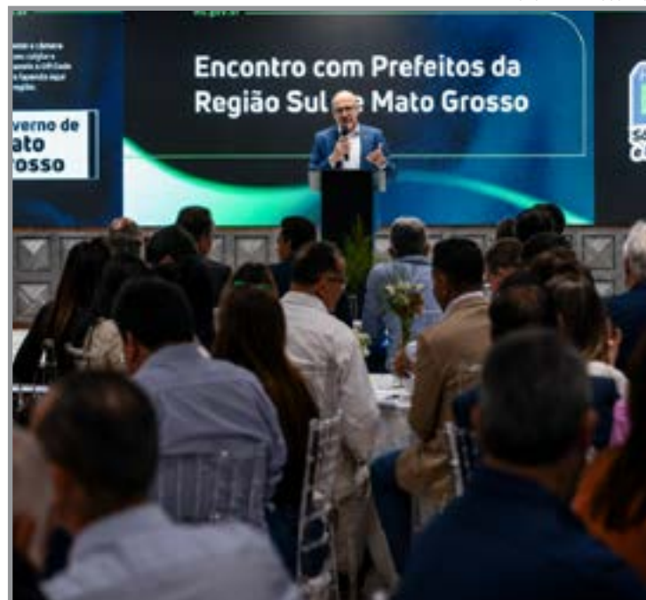
Governador cobra metas e gestão dos municípios

Durante a apresentação, Pivetta ainda fez um balanço dos investimentos estaduais desde 2019, destacando avanços na infraestrutura rodoviária, recuperação fiscal e aumento da capacidade de investimento do Estado. "Mato Grosso do-