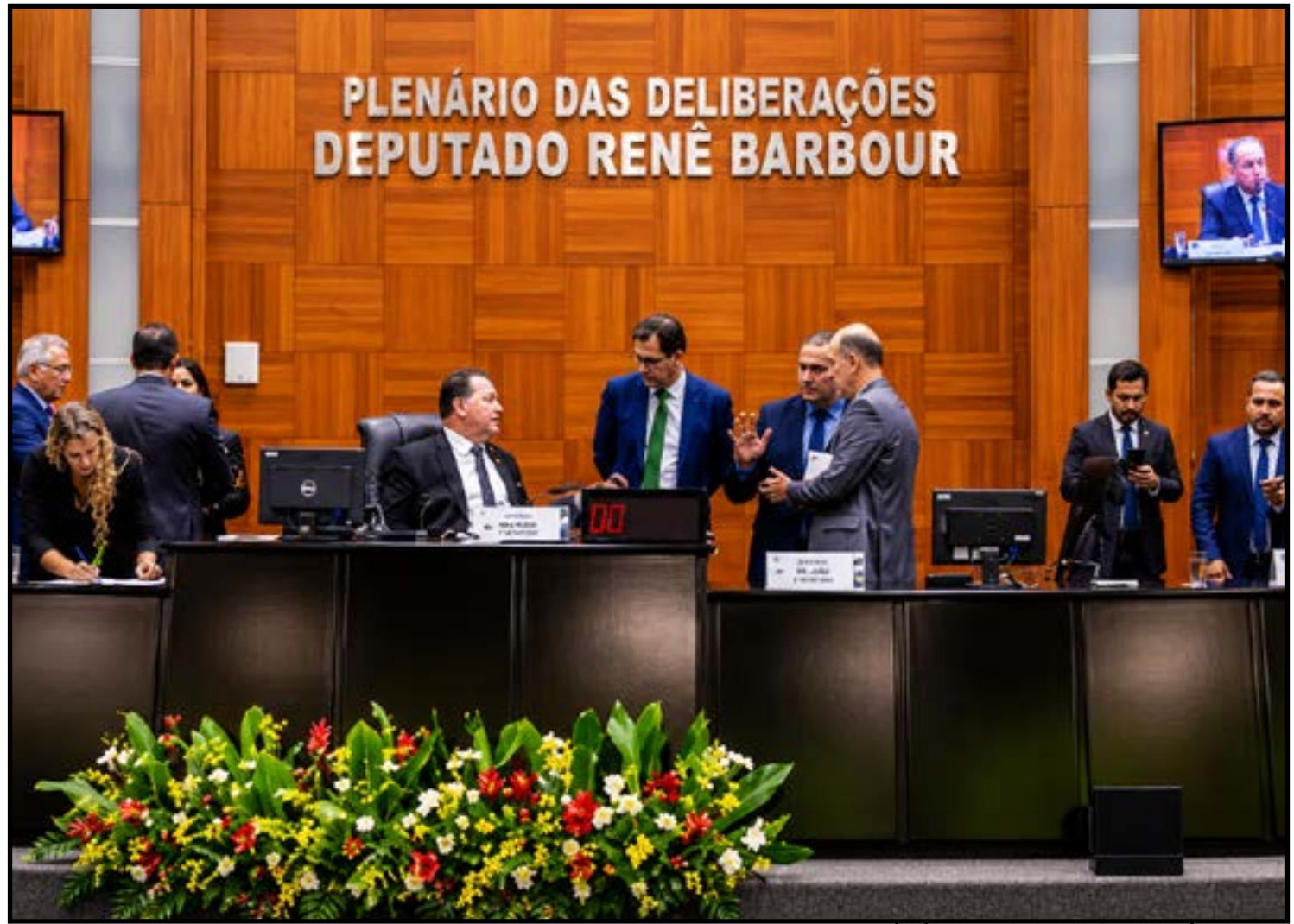
texto segue agora para sanção do governo

Além da criação do cadastro, o parlamentar destacou outras propostas apre-