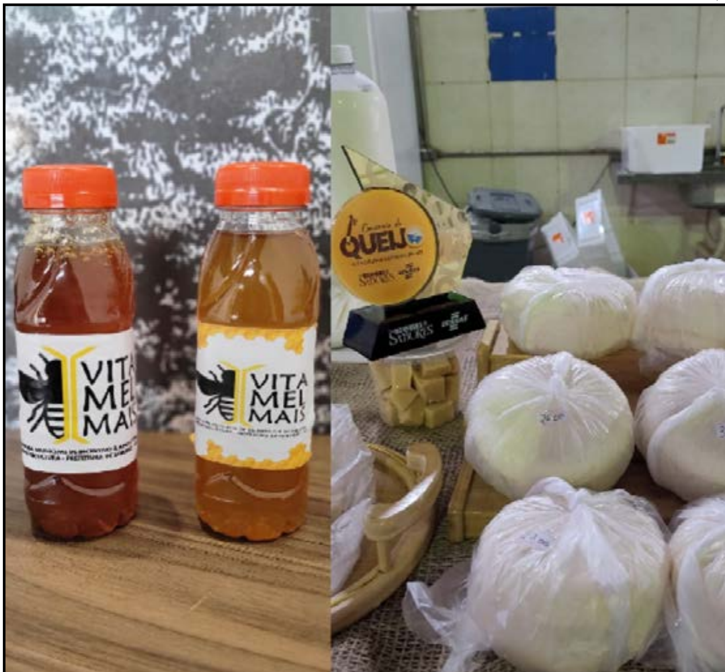
Evento será na semana que vem