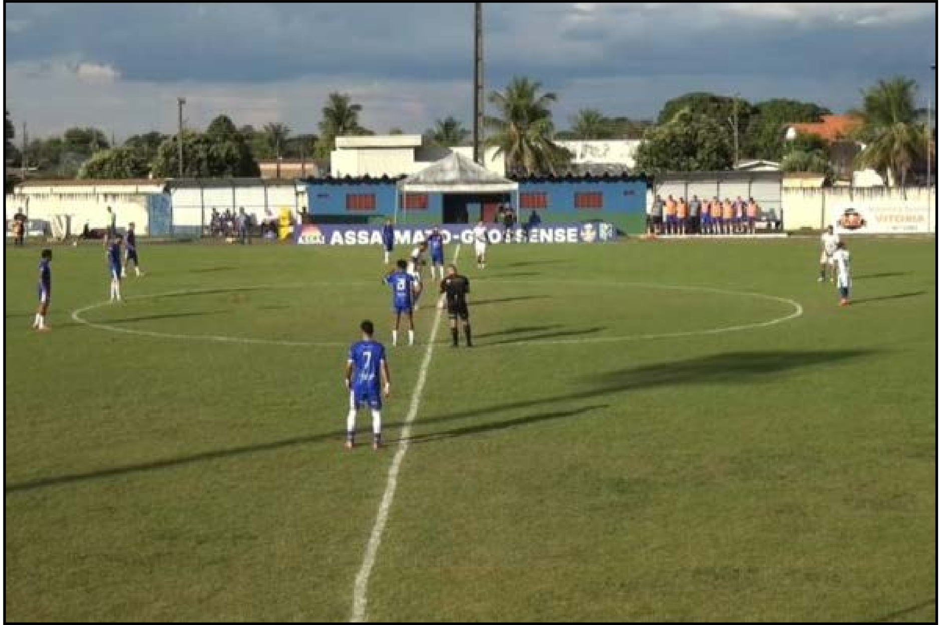
Galo venceu fora de casa no último sábado

Entretanto, houve momentos da história em que acabou se licenciando ou ficando inativo principalmente por conta das dívidas, que ainda se acumulam. Por isso, em 2001, nasceu a Associação Atlético Sinop, que disputou a elite em apenas uma edição, mas depois abdicou de participar no ano seguinte, e nunca mais voltou. Mem-