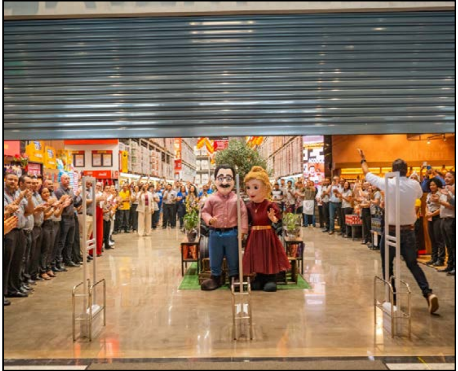
Nova loja gera aproximadamente 400 empregos