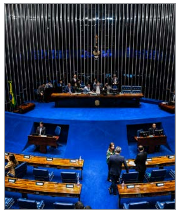
Projeto cria apoio e centros especializados