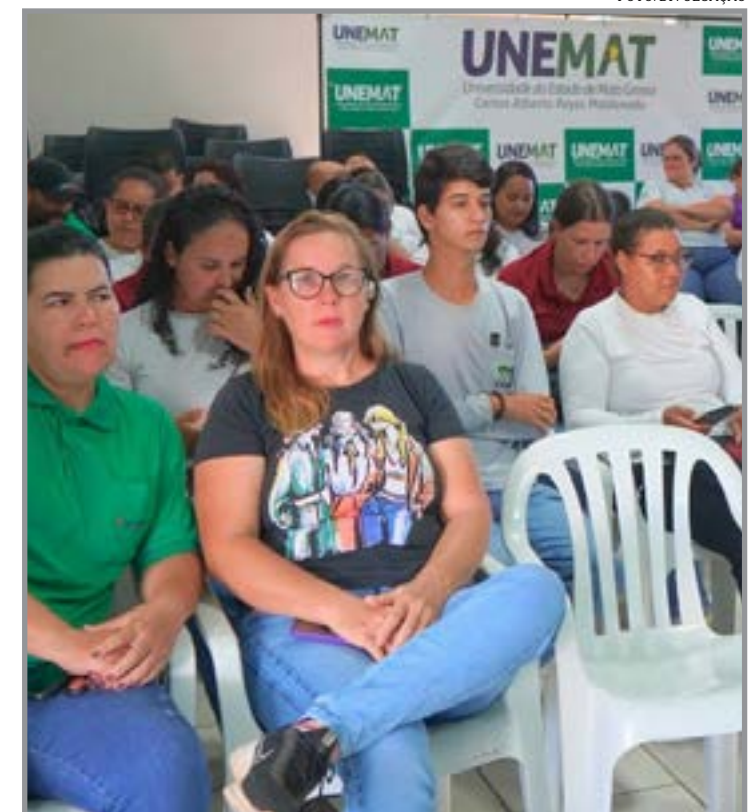
Modelo amplia prevenção contra dengue, zika e outras doenças