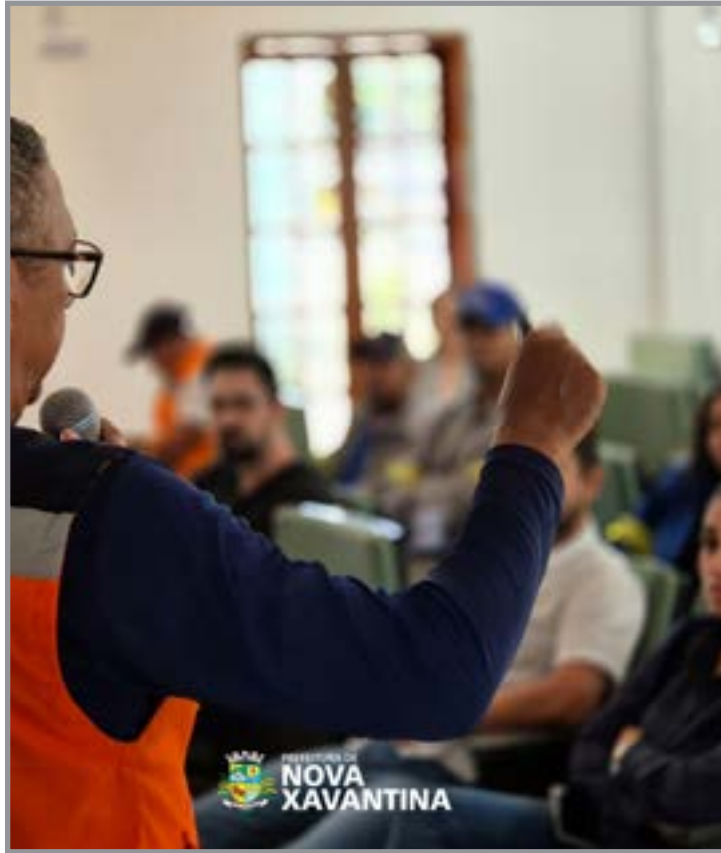
Curso de Defesa Civil Municipal