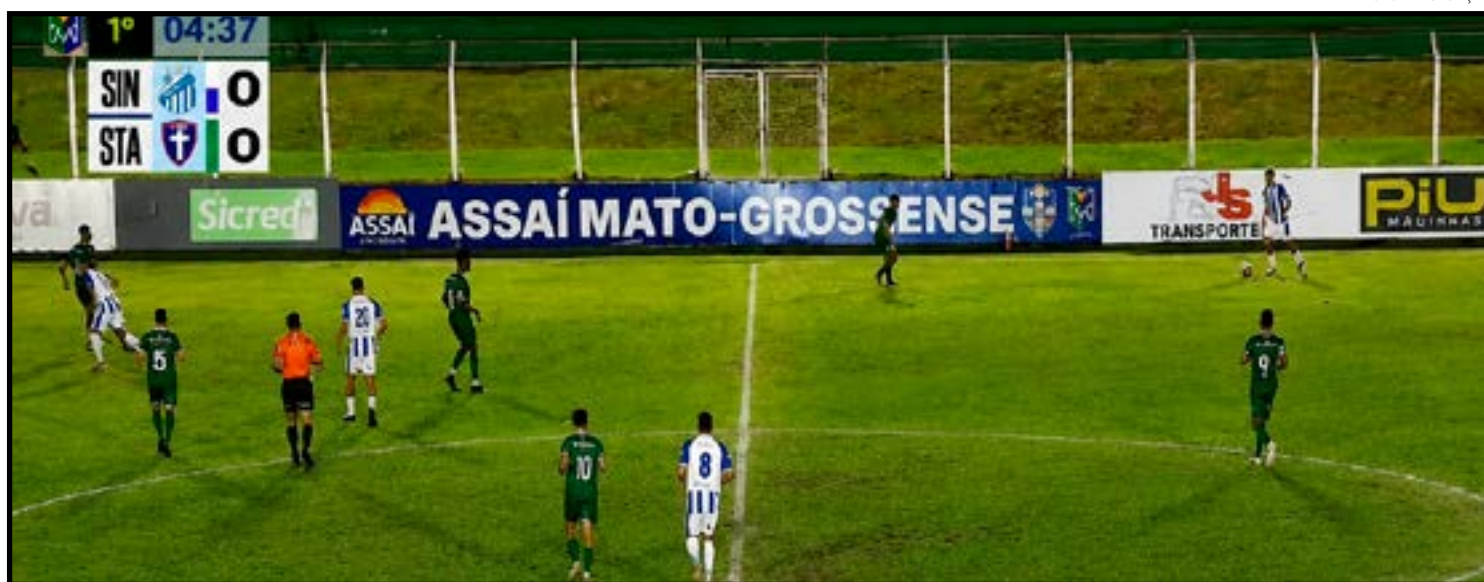
lubes garantiram retorno à elite do Estadual em 2027