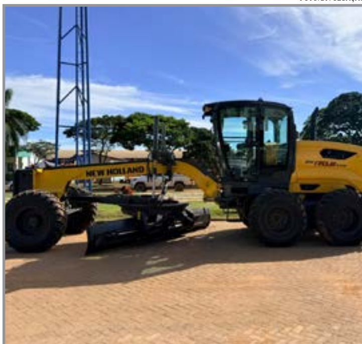
Máquina vai fortalecer infraestrutura do município