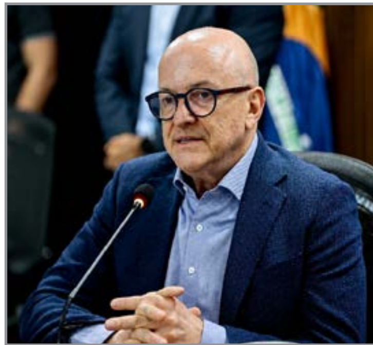
Governador defende obras e cobra empreiteiras

vo estadual sustentou que Mato Grosso assumiu obras que permaneceram por anos sem solução e ressaltou que