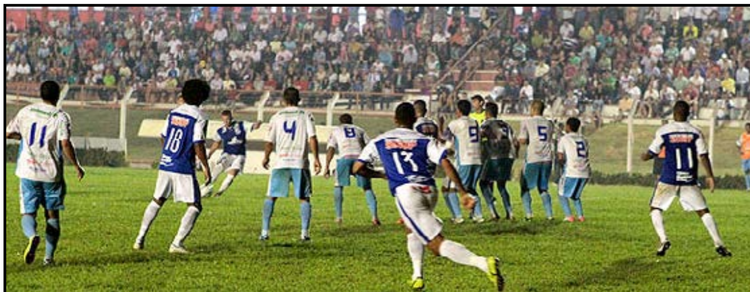
Imagem do jogo de ida da decisão entre os 2 clubes em 2012

semifinal de ida, o atacante Cleberson Tiarinha também comemorou o momento vivido pelo clube.