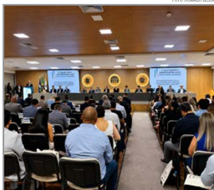
Previdência municipal entra no foco dos prefeitos

Dados apresentados durante o encontro mostram que 107 dos 142 municípios mato-grossenses já possuem