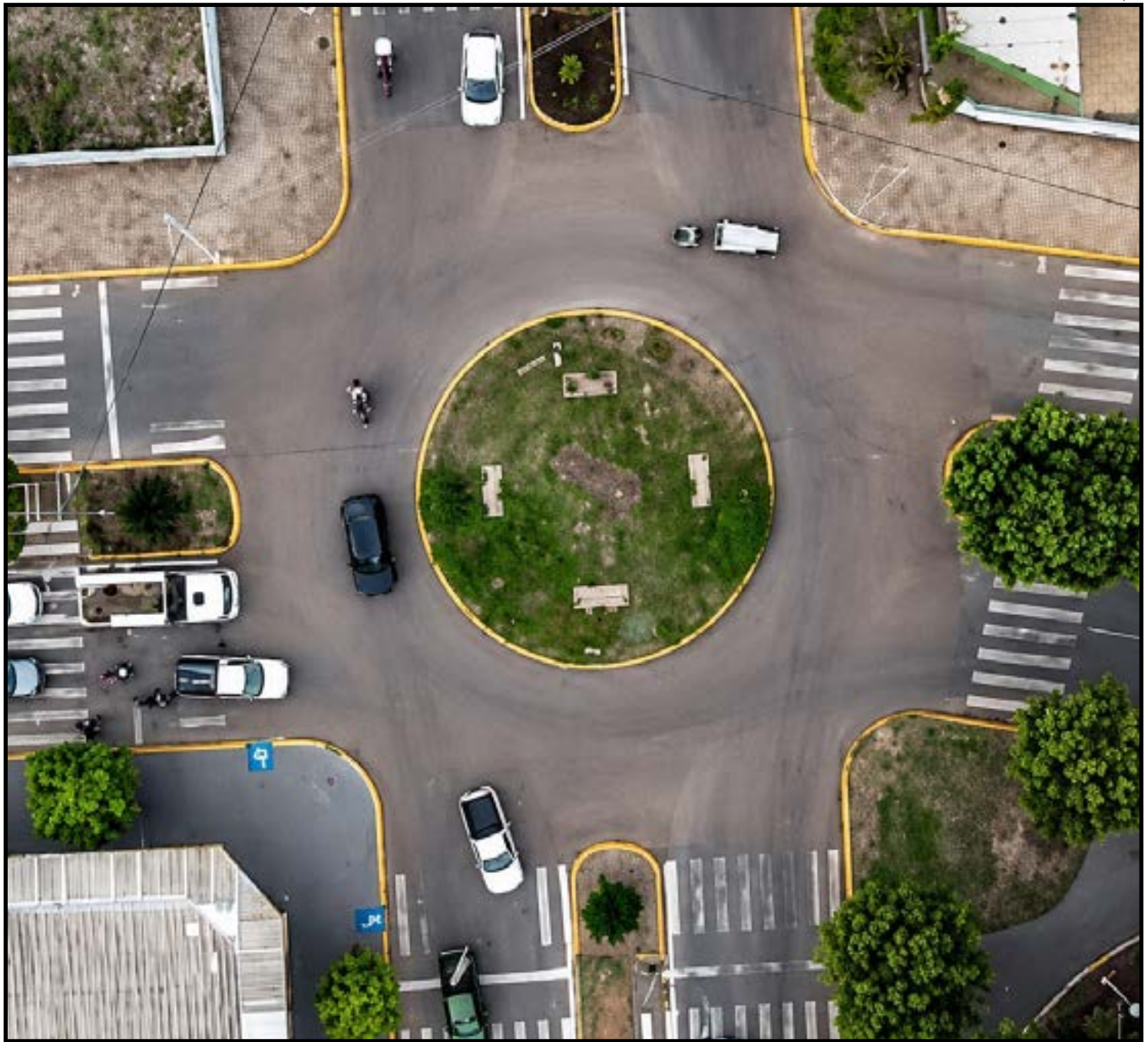
Iniciada implantação de novo semáforo na rotatória

Durante o período de execução das obras, a Secretaria de Segurança e Trânsito orienta os condutores a redobram a atenção ao trafegarem pela região, respeitando a sinalização temporária implantada no local e, se possível, optando por rotas alternativas. A Prefeitura reforça que as intervenções têm como principal objetivo preservar vidas, reduzir sinistros de trânsito e proporcionar mais segurança e eficiência na mobilidade urbana do município.