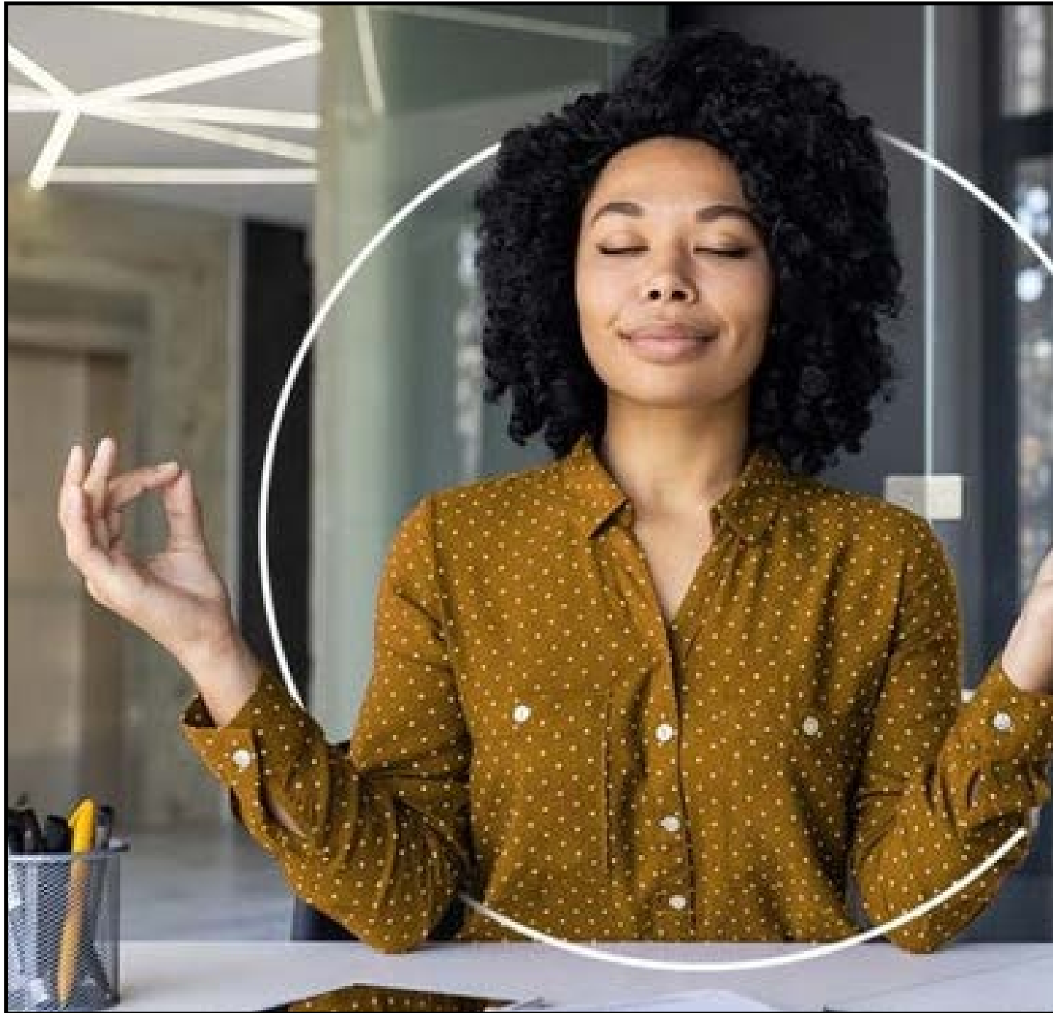
NR-1 muda a forma como as empresas precisam lidar com saúde e segurança no trabalho

As capacitações abordam temas como saúde mental para gestores e líderes, fatores psicossociais no ambiente corporativo, gestão de riscos, burnout como doença ocupacional e práticas para construção de ambientes seguros e saudáveis no trabalho. Segundo especialistas, empresas que investem em ambientes psicologicamente seguros conseguem fortalecer a cultura organizacional, melhorar o clima interno, preparar melhor suas lideranças e aumentar a capacidade de atrair e reter talentos.