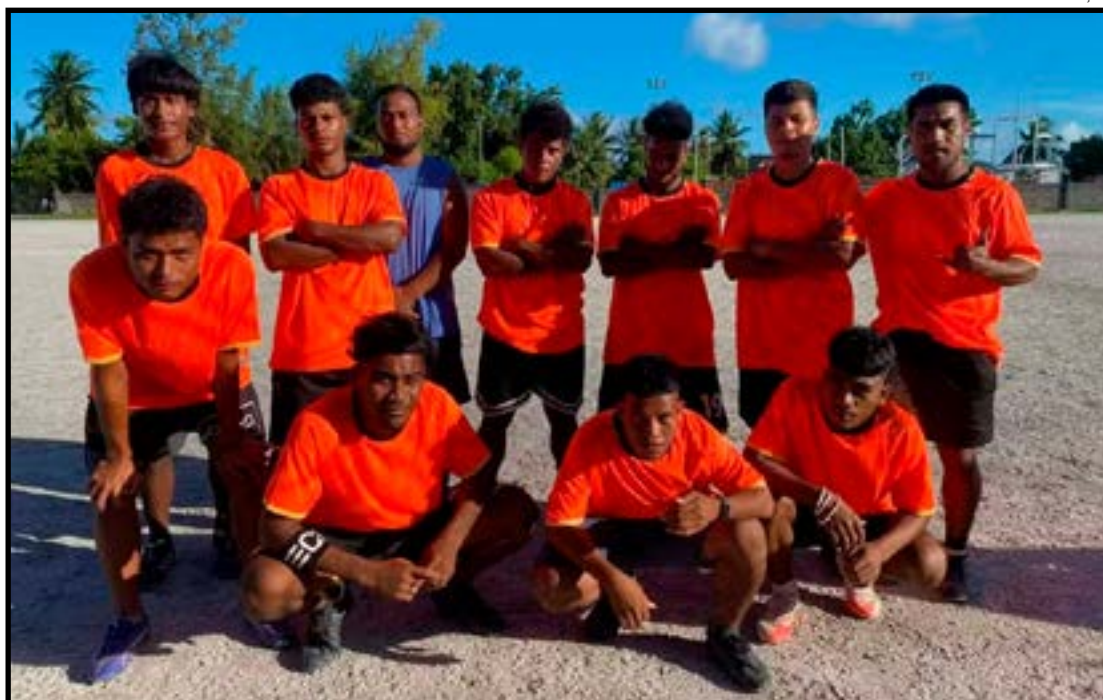
Seleção do Kiribati faz apelo para disputar a Copa do Mundo de 2030

O PNUMA não estabeleceu diálogo direto e formal com a Fifa sobre os riscos enfrentados por países formados por ilhas, como Kiribati, e no momento não tem um projeto específico para o futebol com esta nação. Mas o programa tem procurado realizar campanhas que mostrem como o esporte tem poder para conscientizar e mobilizar para a ação climática.