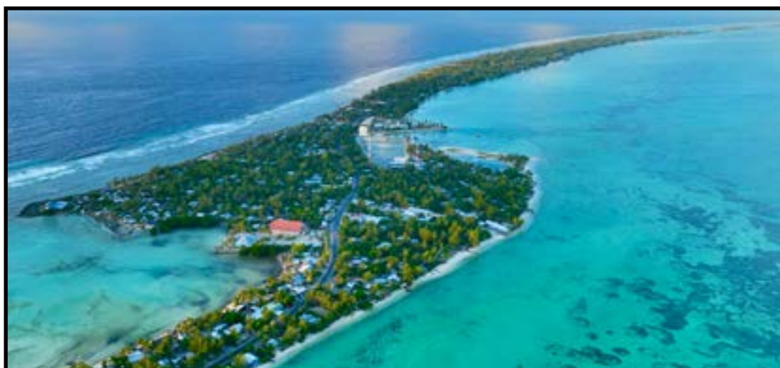
Região pode desaparecer por causa da crise do clima e do aumento do nível do mar

“Do ponto de vista do PNUMA, plataformas esportivas globais — incluindo o futebol — oferecem oportunidades importantes para ampliar a visibilidade dos riscos climáticos existenciais que atingem países vulneráveis como Kiribati,