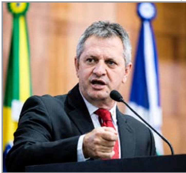
Deputado reforça parceria com o município

O parlamentar ressaltou ainda que Sinop ocupa posição de destaque no cenário estadual e que continuará buscando recursos e investimentos para fortalecer o desenvolvimento da chamada Capital do Nortão. “Fico feliz de visitar Sinop e encontrar