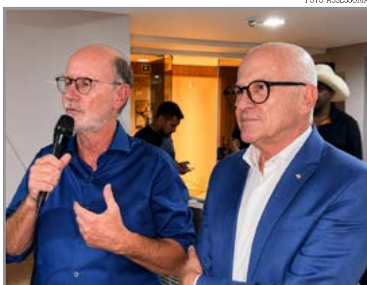
Tucanos aderem ao projeto político estadual da situação

“O PSDB decidiu caminhar com Pivetta porque reconhece nele um gestor preparado, sério e comprometido com pautas que sempre foram caras ao nosso partido”, afirmou.