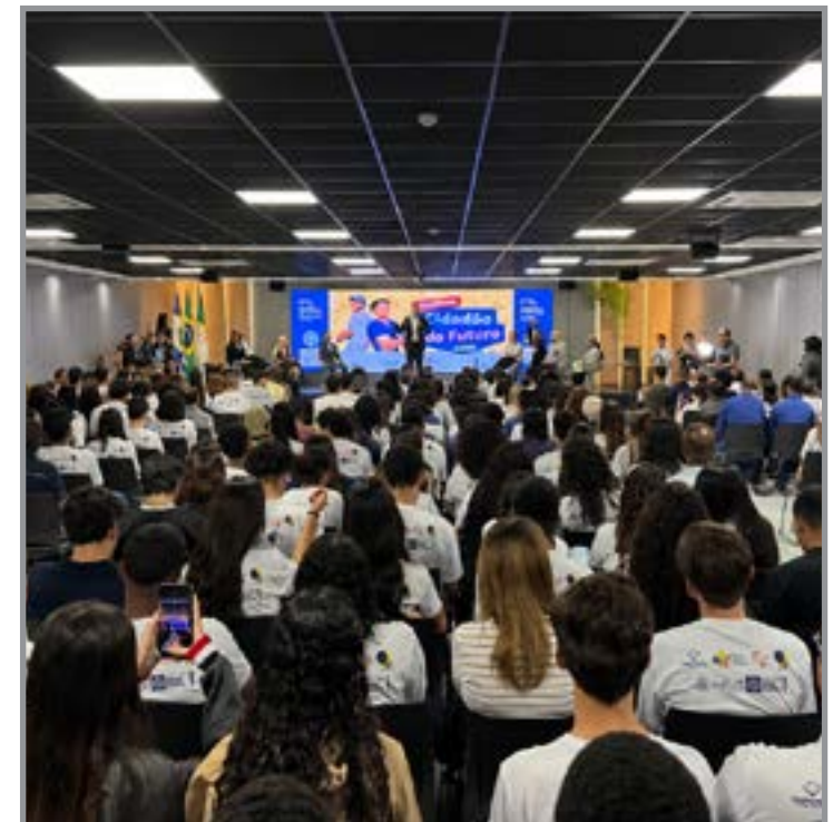
Programa amplia cidadania e participação juvenil