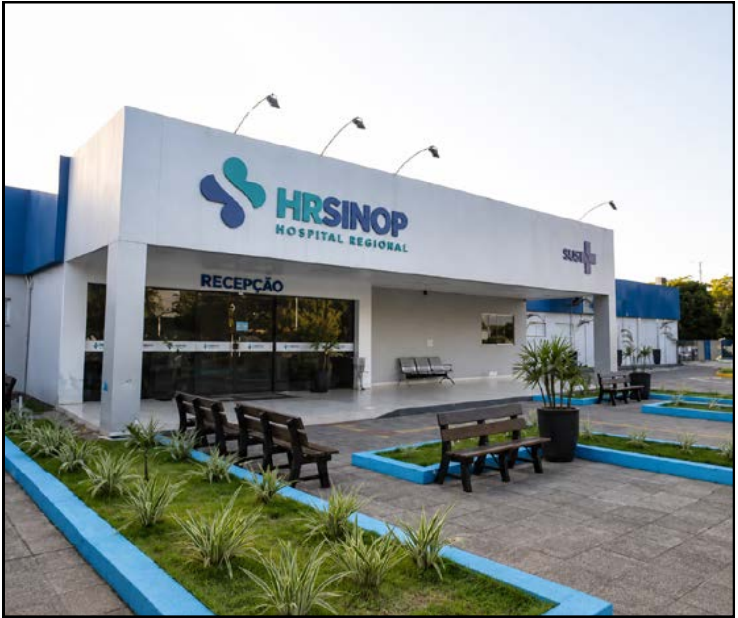
Gestão do HR será transferida para o Consórcio Público de Saúde Vale do Teles Pires

A secretária também informou que todos os profissionais que atualmente trabalham no hospital deverão passar por novos processos seletivos por causa da mudança de Cadastro Nacional da Pessoa Jurídica (CNPJ).