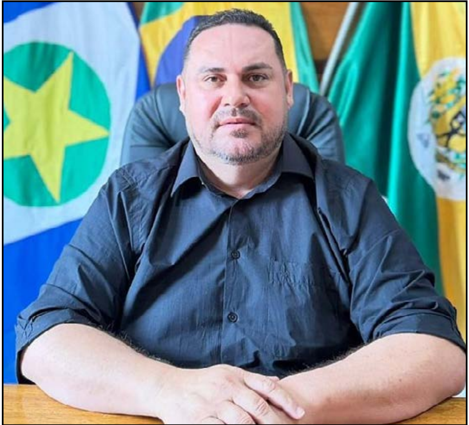
Município prepara reforma de UBS, novas ambulâncias e retomada de obras

O município também já possui recursos assegurados para a reforma da Unidade Básica de Saúde do distrito de Paredão Grande, obra considerada estratégica