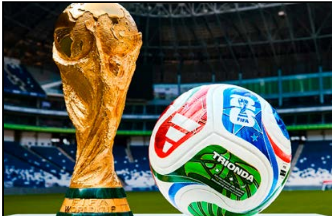
Quem levantará a taça no dia 19 de julho?

Os números ajudam a explicar a preocupação. Na última Copa do Mundo, os jogos tiveram média próxima de 100 minutos, considerando os acréscimos. Mesmo assim, cerca de 42 minutos eram consumidos em paralisações, cobranças demoradas e outras interrupções, o equivalente a praticamente um tempo inteiro de partida. Uma das novidades mais importantes envolve os arremessos laterais. Quando o árbitro identificar uma demora proposital para a cobrança, iniciará uma contagem visual de cinco segundos. Caso o jogador não execute o lance dentro do prazo, a posse de bola será entregue ao adversário. O mesmo princípio será aplicado aos tiros de meta. A diferença é que a punição será ainda mais severa. Se o goleiro ou a equipe atrasarem deliberadamente a reposição da bola, o árbitro poderá conceder escanteio ao time adversário, criando imediatamente uma situação de perigo. As substituições também passam por mudanças. O jogador que deixar o gramado terá apenas dez segundos para sair após a autorização da arbitragem. Caso demore além do permitido sem justificativa médica, seu substituto precisará aguardar um minuto para entrar em campo, deixando a equipe tempora-