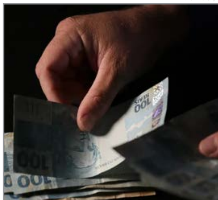
Bancos transferiram R$ 5,7 bi de valores esquecidos para o Desempenho