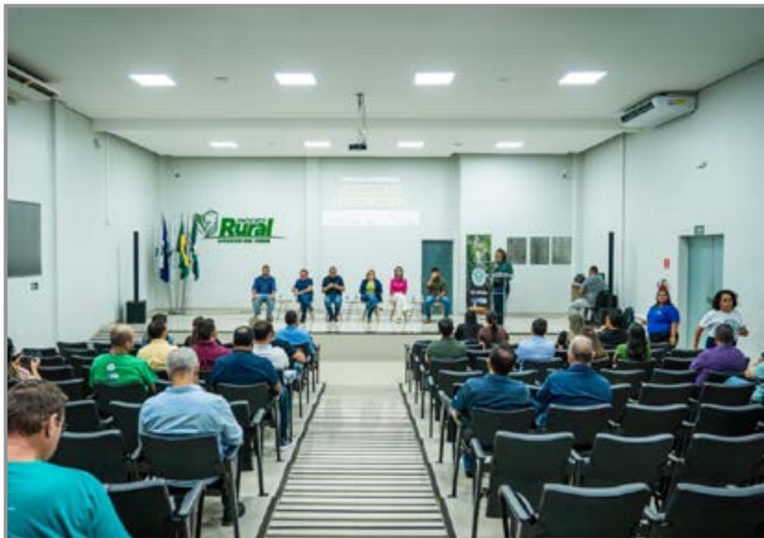
Evento foi realizado nesta semana em Lucas

“O CAR Digital vem com uma proposta diferente. Ele reduz a interferência manual nos processos e utiliza tecnologias como imagens de satélite, tornando as análises