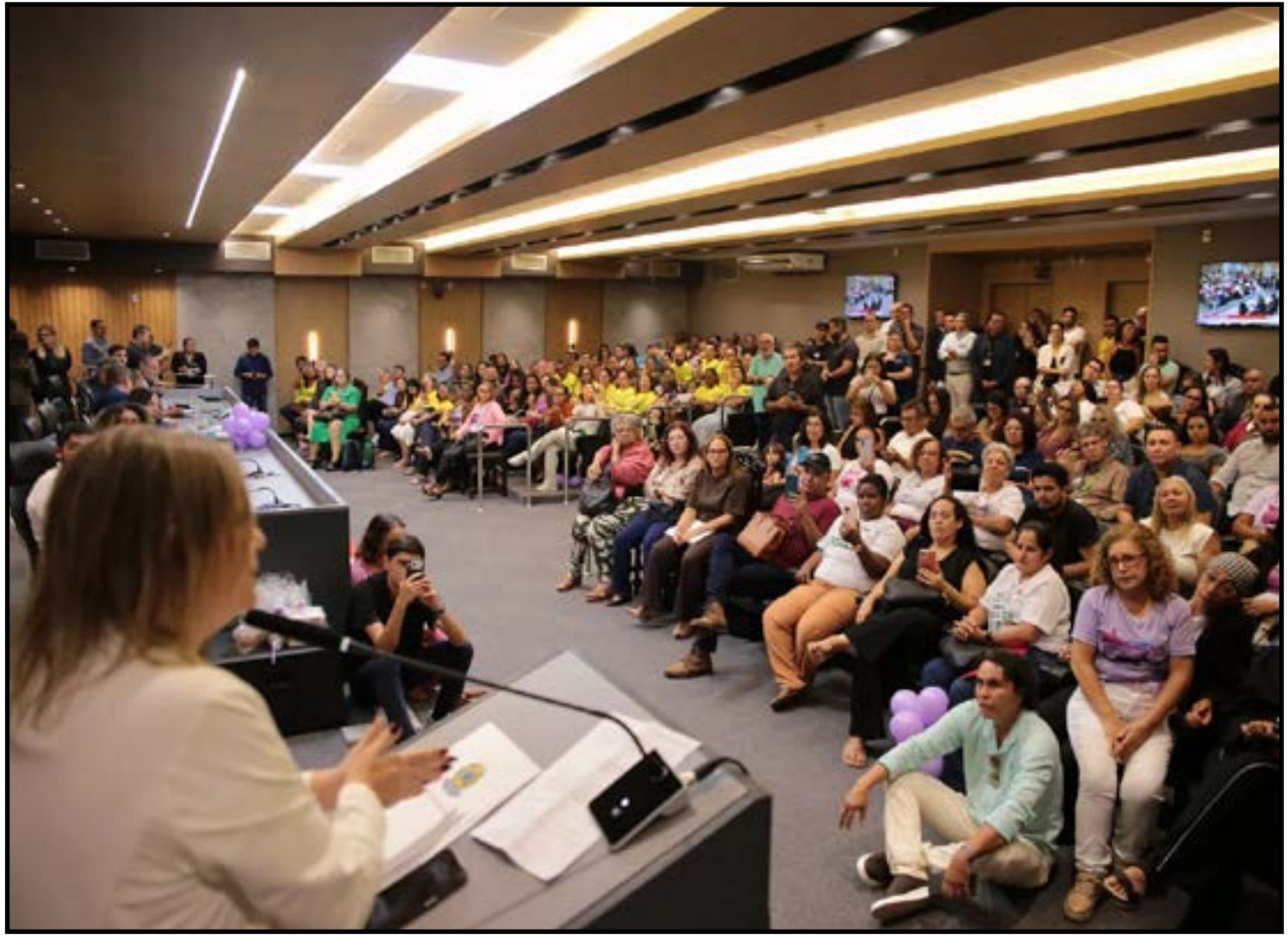
Representantes de diversos municípios discutem aplicação da Lei nº 15.326/2026

Autora da Lei Federal nº 15.326/2026, Luciene Cavalcante afirmou que a norma representa uma reparação histórica para milhares de trabalhadores da educação infantil em todo o país. “Essa lei garante que as pessoas sejam reconhecidas pela função que exercem. São profissionais que estão diariamente nas creches, cuidando,