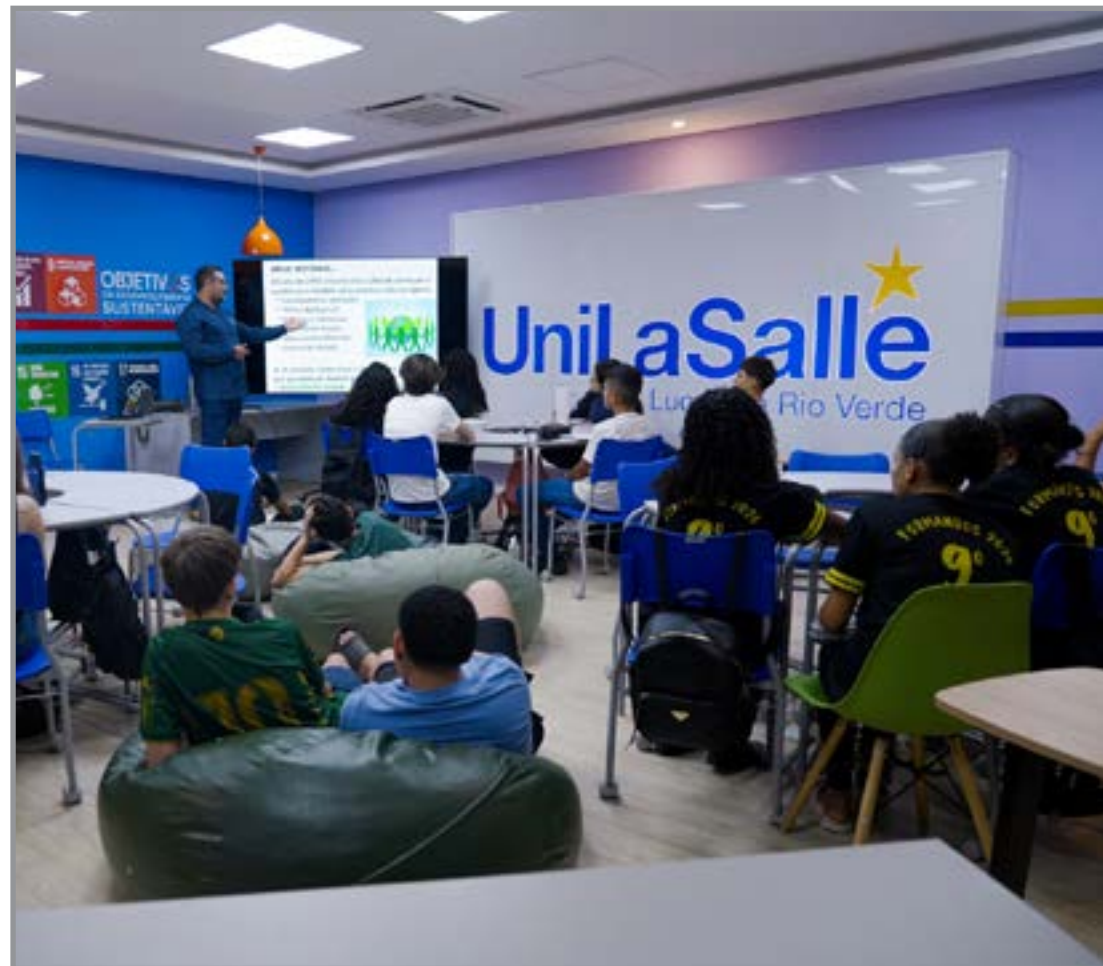
Atividades tiveram início nesta semana

Na ocasião, o município participou da jornada estadual de estruturação, aceleração e monitoramento dos