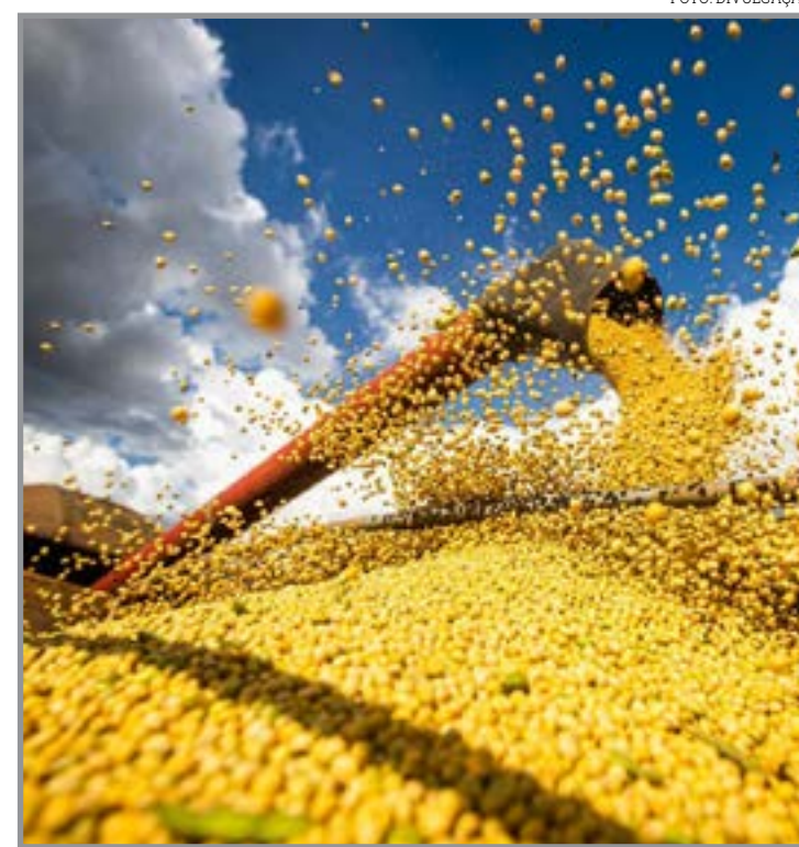
Se confirmado, resultado será recorde