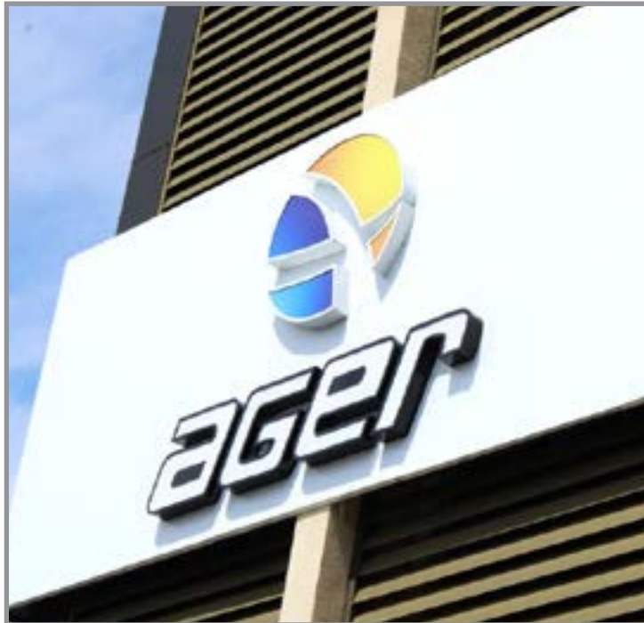
Ouvidoria da Ager também atende manifestações relacionadas aos demais serviços regulados

Além dos serviços de energia elétrica, a Ouvidoria da Ager também atende manifestações relacionadas aos demais serviços regulados pela Agência, como rodovias pedagiadas, transporte rodoviário intermunicipal de passageiros, Terminal Rodoviário de Cuiabá, gás natural canalizado, portos e hidrovias, e saneamento básico nos municípios conveniados com a Ager.