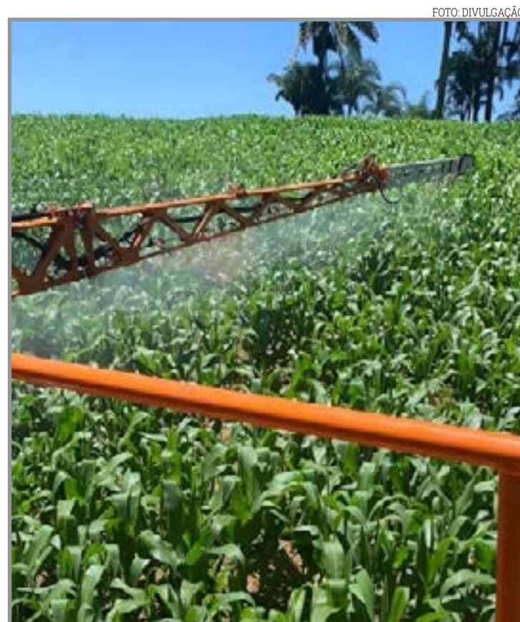
Levantamento revela diferenças na estratégia de aquisição de fertilizantes e defensivos

O estudo preliminar projeta uma relativa estabilidade no Custo Operacional Efetivo (COE) da safrinha 2025/26, com redução estimada entre 0,2% e 0,3% em comparação à temporada anterior. Apesar disso, a expectativa é de que os custos finais ainda sofram ajustes ao longo dos próximos meses, especialmente em função dos gastos com operações de campo, combustível e mão de obra que ainda serão contabilizados.