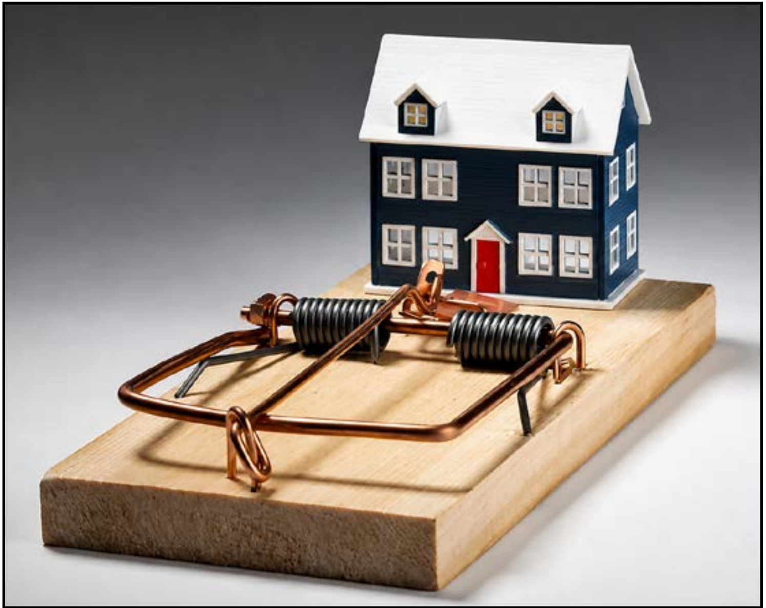
Site oficial traz mais de 84 milhões de propriedades registradas

Em muitos episódios, as vítimas só descobrem o golpe ao tentar formalizar a escritura ou registrar o imóvel, quando constatam que o vendedor não é o proprietário ou que há impedimentos legais desconhecidos.