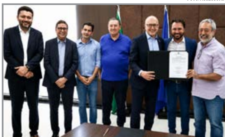
Municípios recebem convênios e novas autorizações

Em Lucas do Rio Verde, o Governo autorizou R$ 3,7 milhões para a conclusão de um empreendimento habitacional voltado a 150 famílias. O município também receberá recursos para a im-