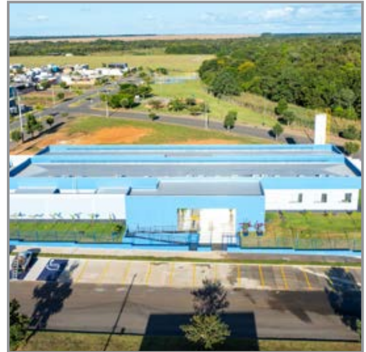
Inauguração será na segunda