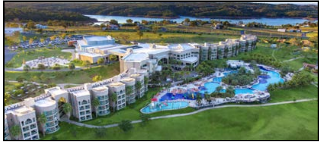
Aumento na frequência semanal atrai turistas do Centro-Oeste

“A evolução da conectividade aérea tem impacto direto no negócio. Quando conseguimos reduzir tempo e facilitar o acesso ao destino, ampliamos significativamente o nosso mercado. A nova rota entre Goiânia e Cuiabá, por exemplo, fortalece um mercado estratégico para nós. Ao mesmo tempo, possibilidade de voos internacionais no futuro abre um horizonte muito relevante, especialmente considerando o interesse crescente de turistas estrangeiros por destinos