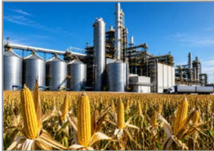
Assunto foi pauta nesta semana no plenário da Assembleia

O debate ocorre em meio às tratativas entre o