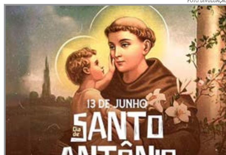
Dia de Santo Antônio neste sábado

determina a legislação trabalhista, com atenção especial aos direitos dos colaboradores. Além disso, as empresas devem estar respaldadas pela autorização da Lei Federal nº 11.603/2007 e legislação municipal. Atualmente, está proibido o funcionamento do comércio apenas nos seguintes feriados: 1º de janeiro – Confraternização Universal; Sexta-feira Santa; 1º de maio – Dia do Trabalhador; 2 de novembro – Dia de Finados; 25 de dezembro – Natal. A CDL Sinop permanece à disposição para orientar seus associados diante dessas mudanças.