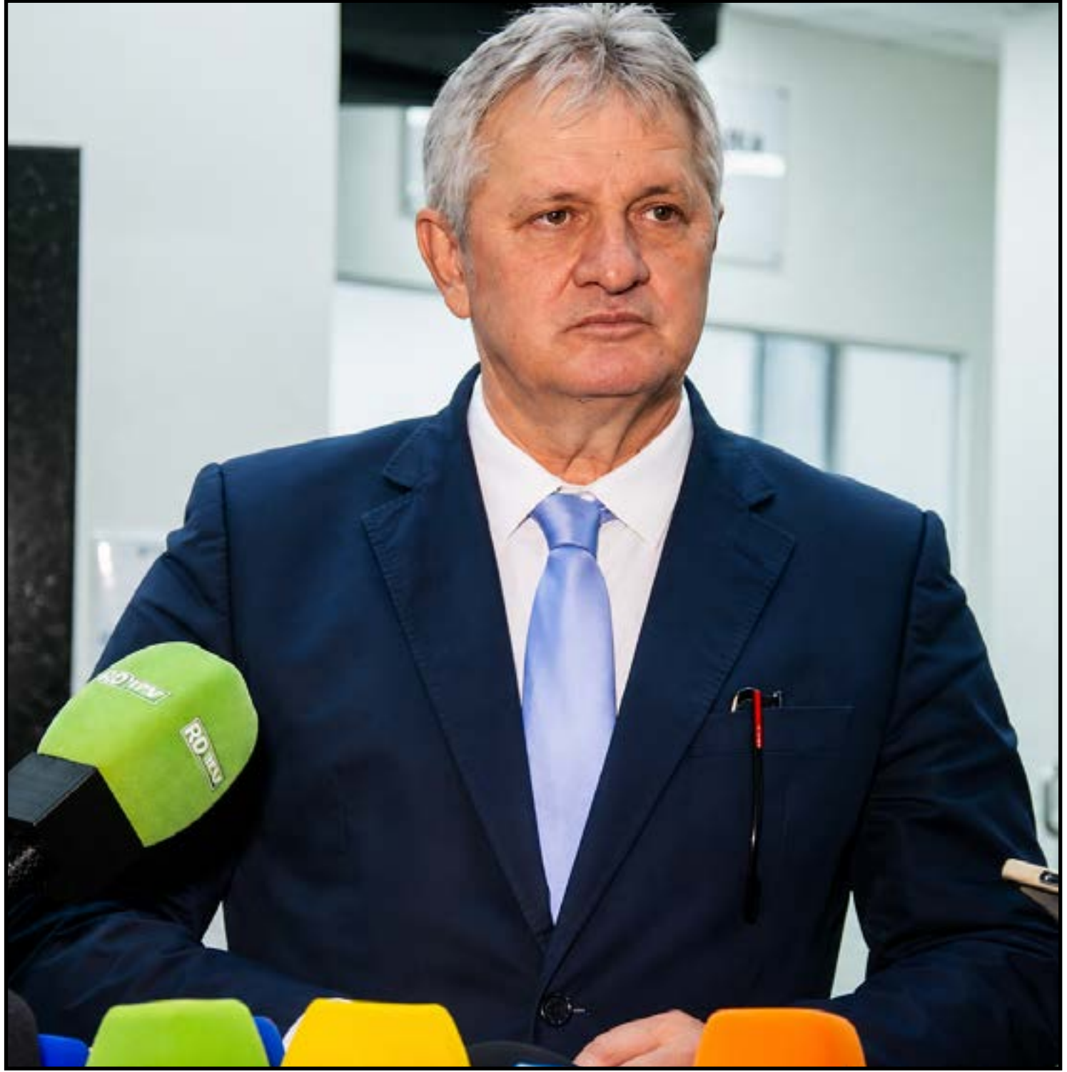
Projeto é visto como motor do turismo e negócios