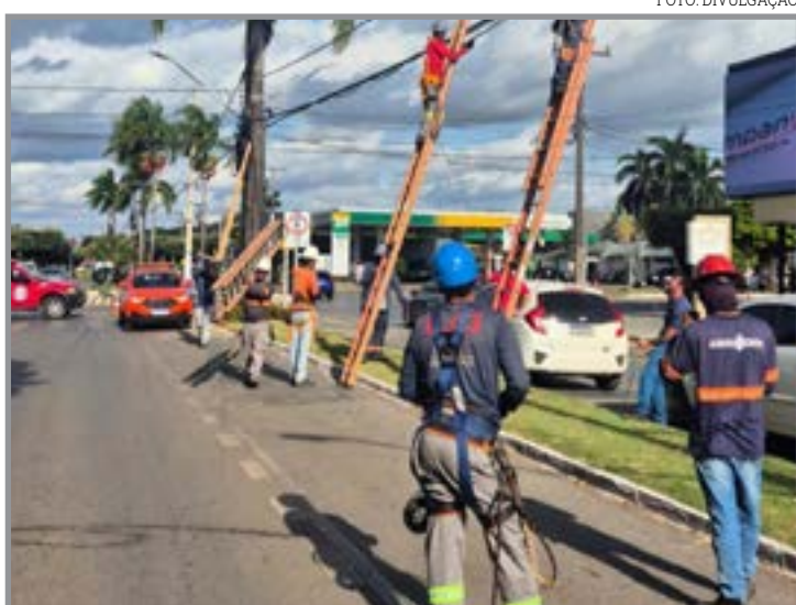
Fiação em desuso e irregular

A Operação Cacicus reúne Energisa e Prefeitura de Sorriso, por meio do Procon, Núcleo Integrado de Fiscalização (NIF) e Defesa Civil. A