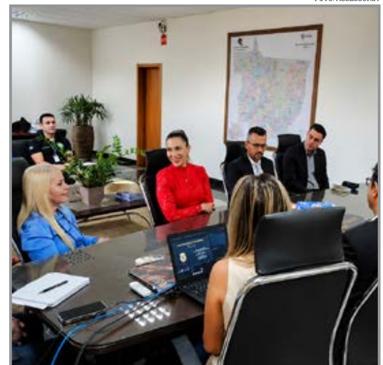
Objetivo é garantir lisura e segurança do pleito

Rita do Trivelato, Itanhanga, Feliz Natal e Santa Carmem, incluindo habitação popular, construção de centro de assistência social, drenagem urbana e pavimentação de estradas.